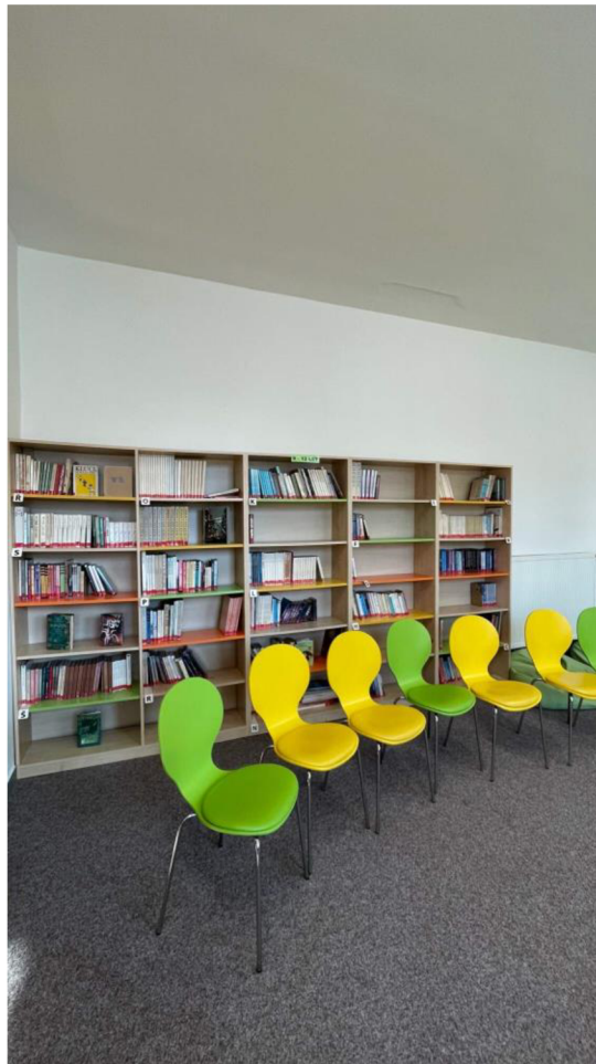
Obr. 3 (knihovna)