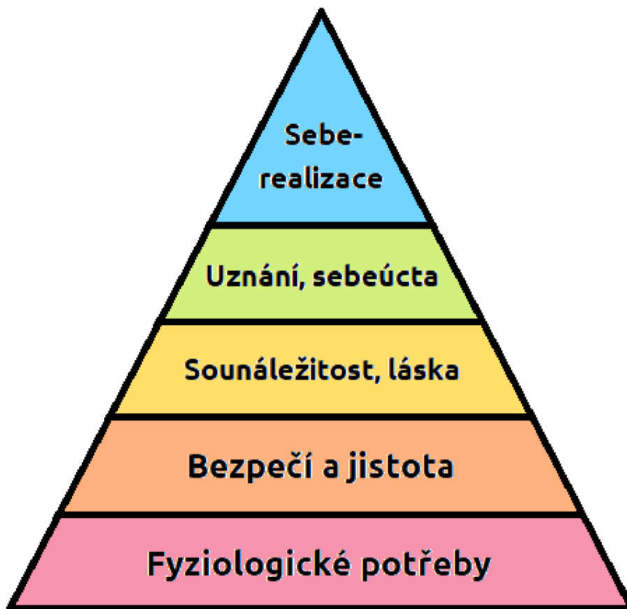
Obr. 4 (Maslowa hierarchie potřeb)