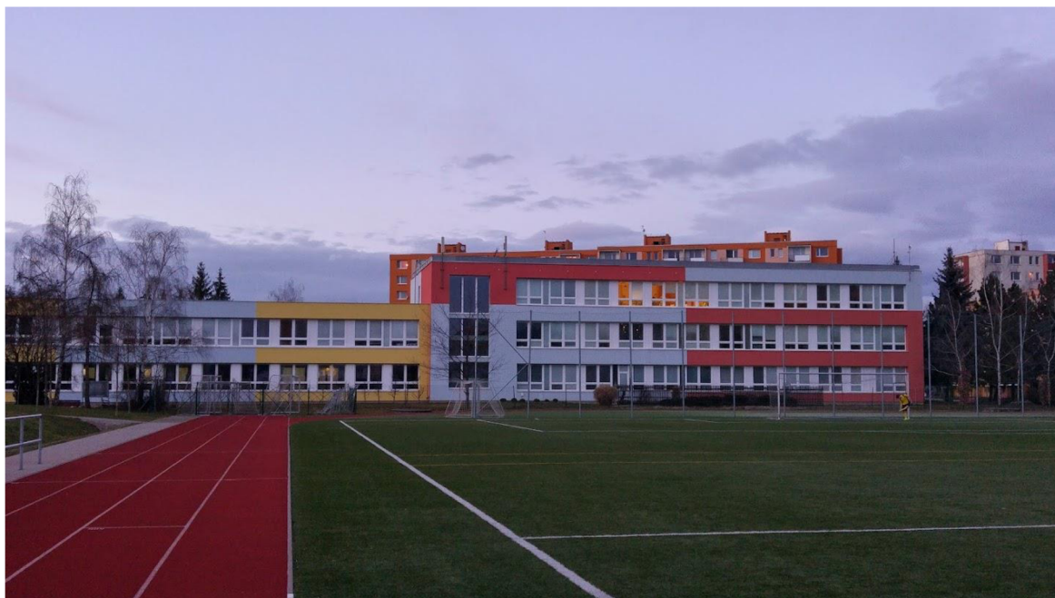
Obr. 2 (ZŠ Nedvědova)