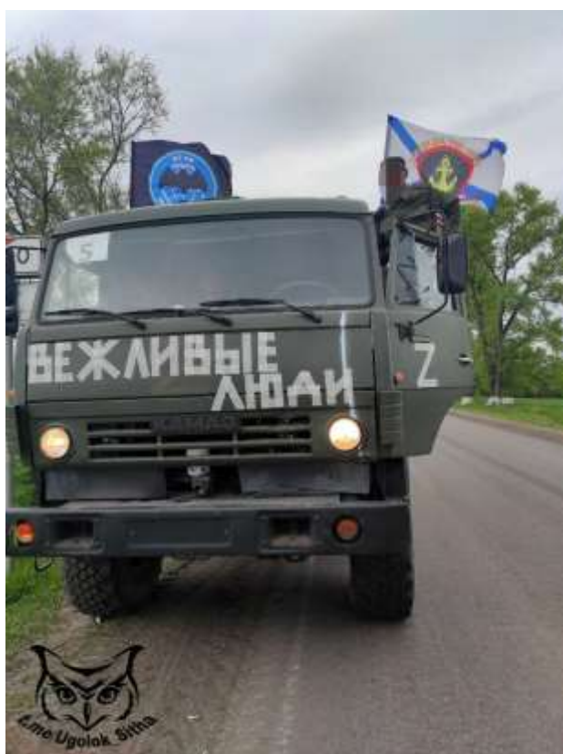
Obrázek č. 18

< https://cs.wikipedia.org/wiki/Rusk%C3%A1_vlajka#/media/Soubor:Flag_of_Russia_(1858%E2%80%931883).svg >