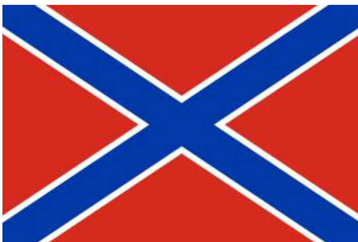
Obrázek č. 16

< https://cs.wikipedia.org/wiki/Luhansk%C3%A1_lidov%C3%A1_republika#/media/Soubor:Flag_of_the_Luhansk_People's_Republic.svg >