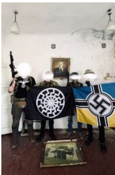
Obrázek č. 8

< https://en.wikipedia.org/wiki/3rd_Assault_Brigade#/media/File:3%D0%BE%D1%88%D0%B1%D1%80_logo.svg >