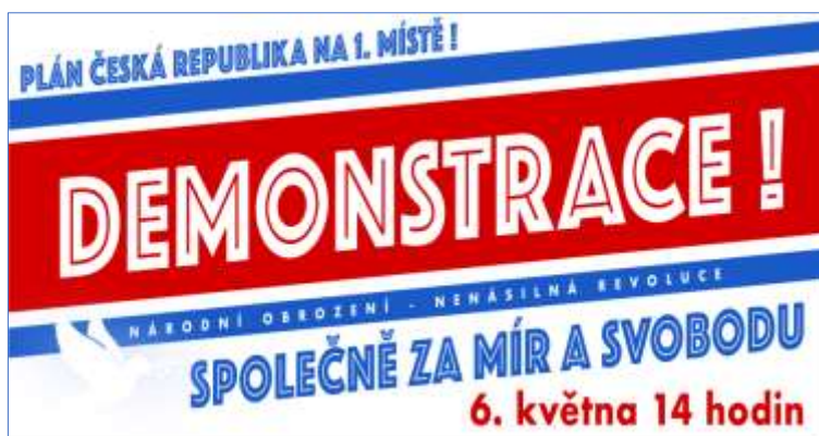
Obrázek č. 25

Banner demonstrace „Plán Česká republika na 1. místě“