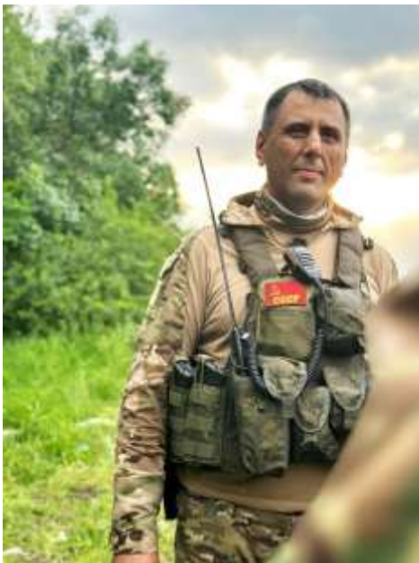
Obrázek č. 22