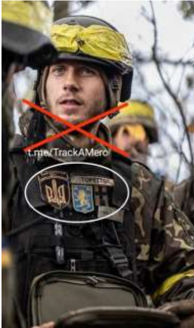
Obrázek č. 9

Ukrajinský voják s nášivkami na nosiči balistických plátů