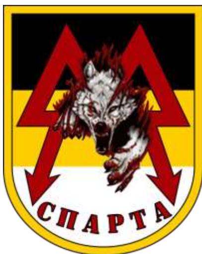
Obrázek č. 12

Dostupné z WWW: < https://revdia.org/stikery/ >