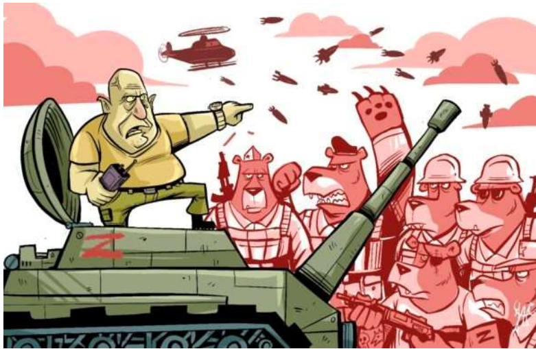
Obrázek č. 29

Kreslený vtip zobrazující „vzpouru Wagnerovců“