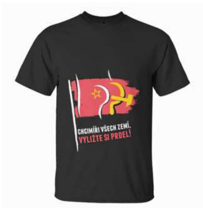
Obrázek č. 27