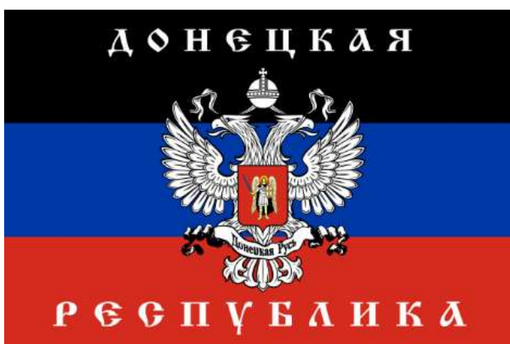
Obrázek č. 14

Dostupné z WWW: < https://militaryarms.ru/znaki-otlichiya/georgievskaya-lenta/ >