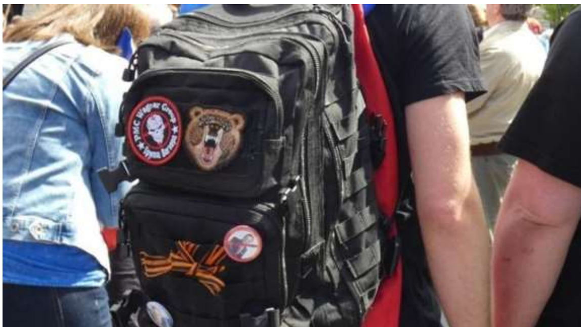
Obrázek č. 26