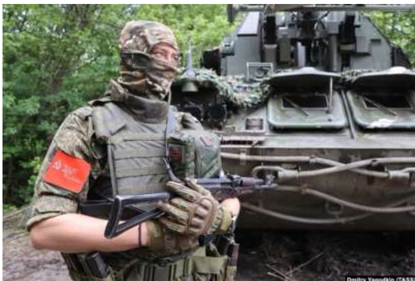
Obrázek č. 23