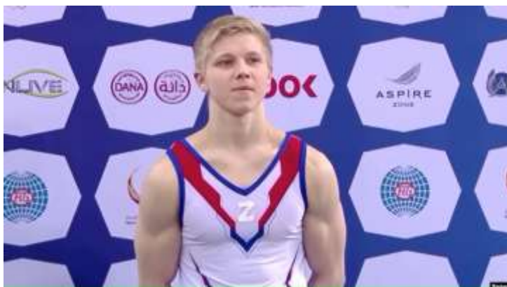
Obrázek č. 19