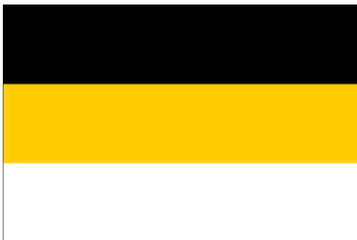
Obrázek č. 17