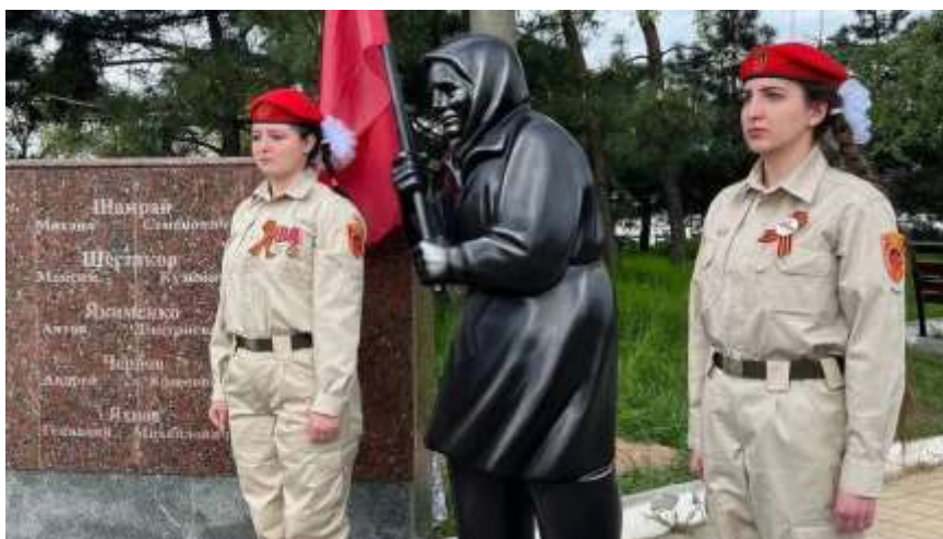
Obrázek č. 24

< https://gdb.rferl.org/01000000-c0a8-0242-bc38-08dbdba7f839_w1278_r0_s_d2.jpg >