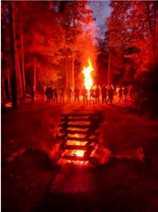
Obrázek č. 21