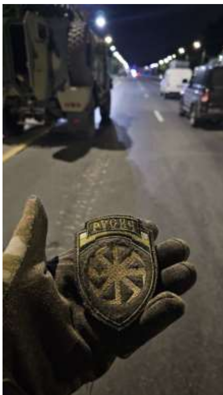
Obrázek č. 20

< https://www.rferl.org/a/russia-gymnast-banned-z-symbol/31856471.html >