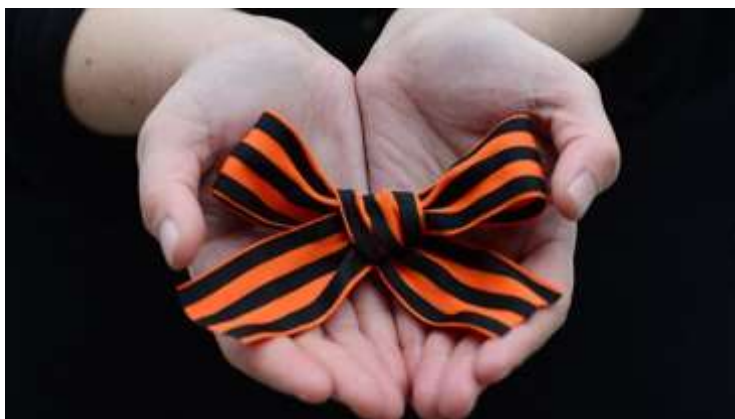
Obrázek č. 13