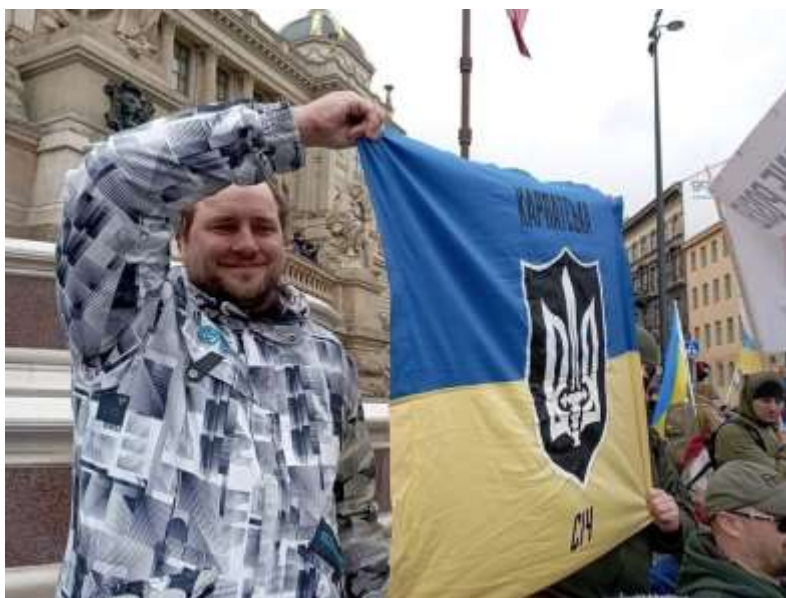
Obrázek č. 28

< https://eshop.zapojmeukrajinu.cz/products/tricko-chcimiri-vsech-zemi >