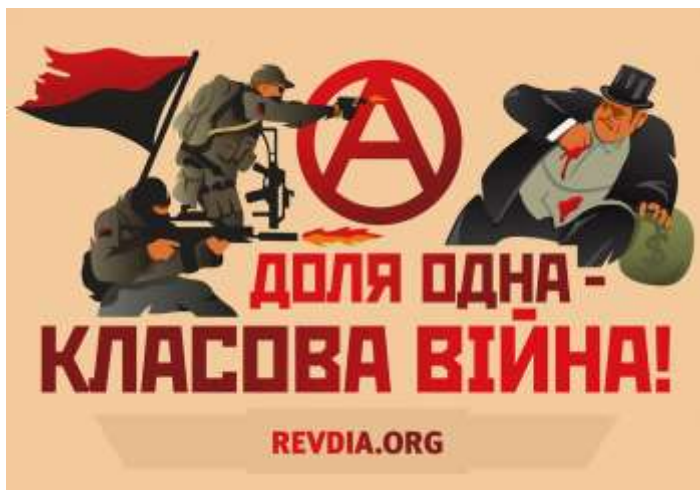
Obrázek č. 11