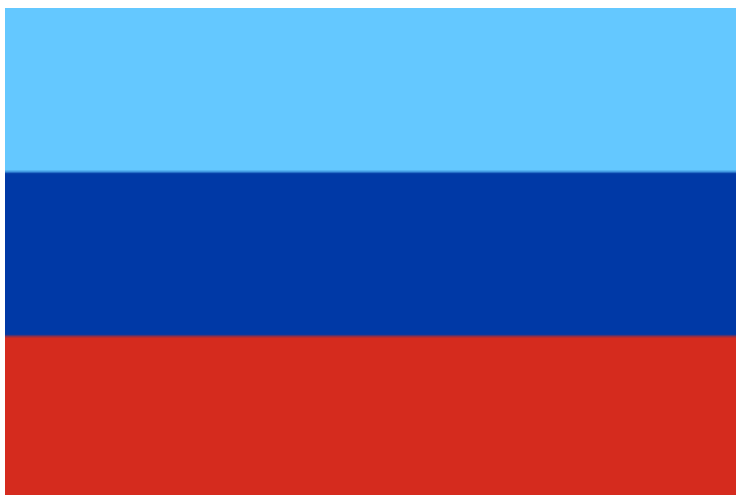
Obrázek č. 15