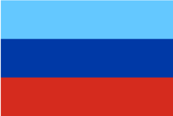
Obrázek č. 15