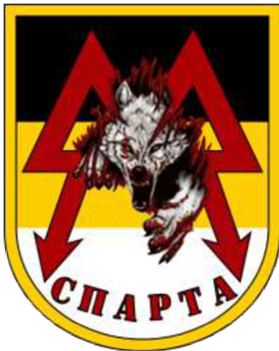
Obrázek č. 12