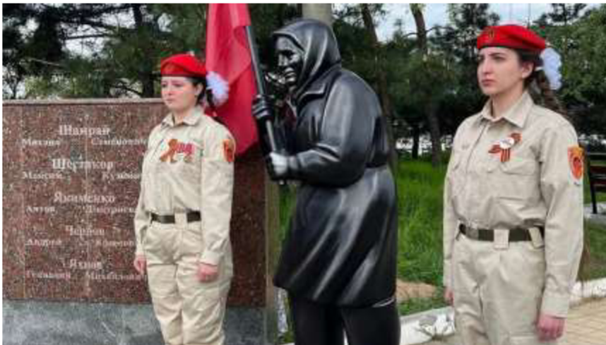
Obrázek č. 24

< https://gdb.rferl.org/01000000-c0a8-0242-bc38-08dbdba7f839_w1278_r0_s_d2.jpg >