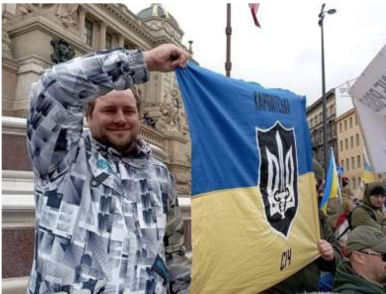
Obrázek č. 28

< https://eshop.zapojmeukrajinu.cz/products/tricko-chcimiri-vsech-zemi >