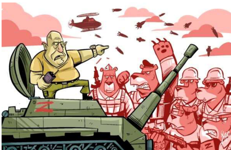
Obrázek č. 29

Kreslený vtip zobrazující „vzpouru Wagnerovců“