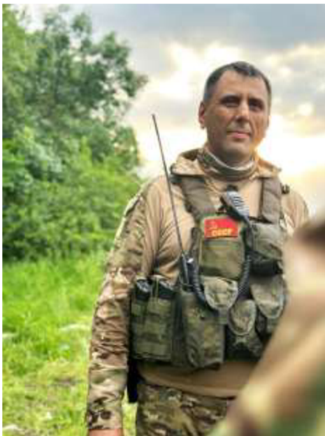
Obrázek č. 22

Dostupné z WWW: < https://t.me/dshrg2/1520 >