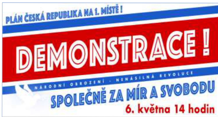
Obrázek č. 25

Banner demonstrace „Plán Česká republika na 1. místě“