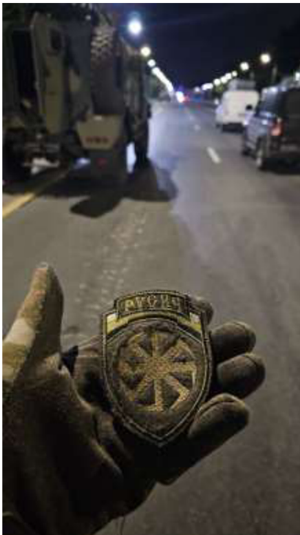
Obrázek č. 20

< https://www.rferl.org/a/russia-gymnast-banned-z-symbol/31856471.html >