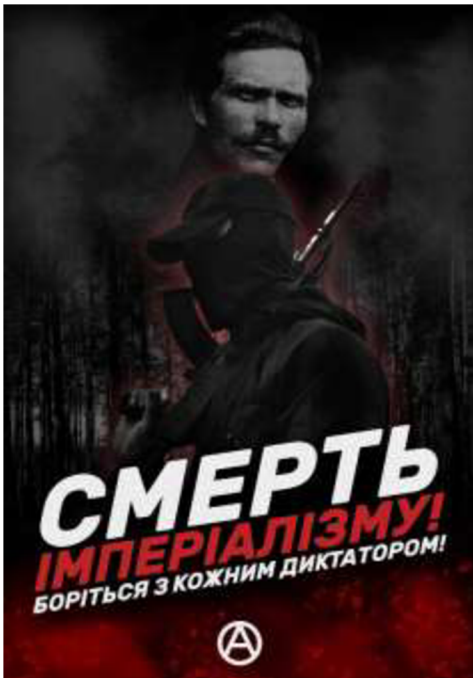
Obrázek č. 10

Dostupné z WWW: < https://t.me/TrackAMerc/6329 >