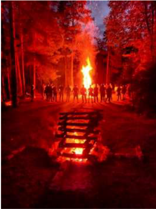
Obrázek č. 21