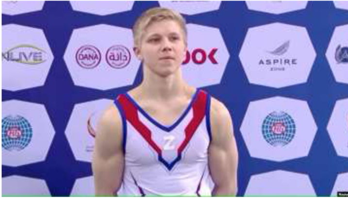
Obrázek č. 19