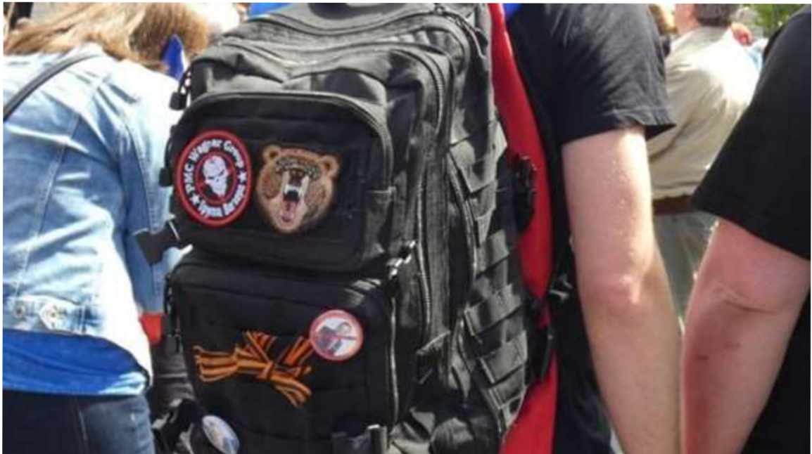
Obrázek č. 26