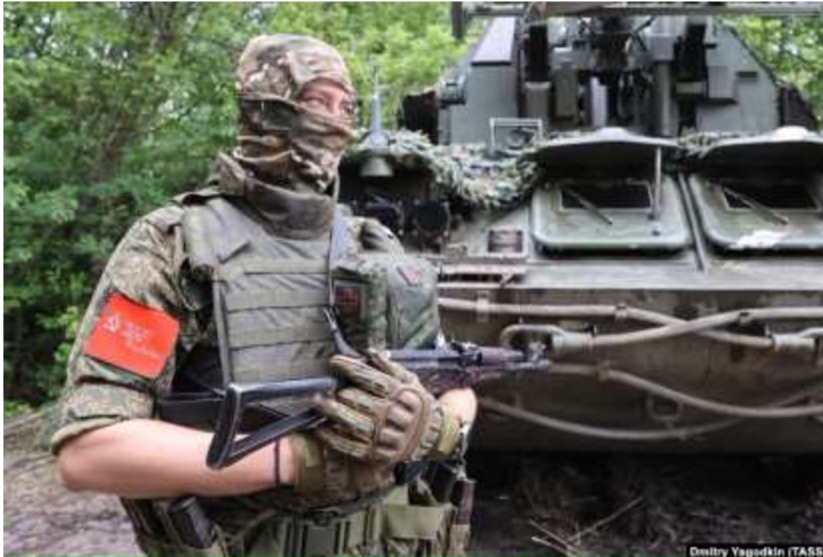
Obrázek č. 23