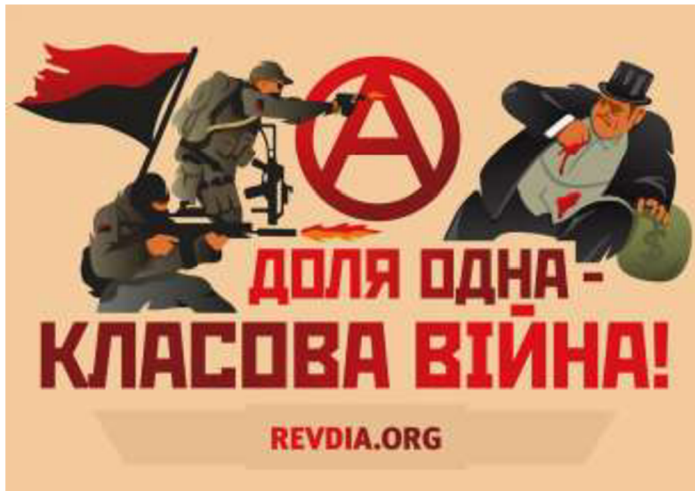
Obrázek č. 11