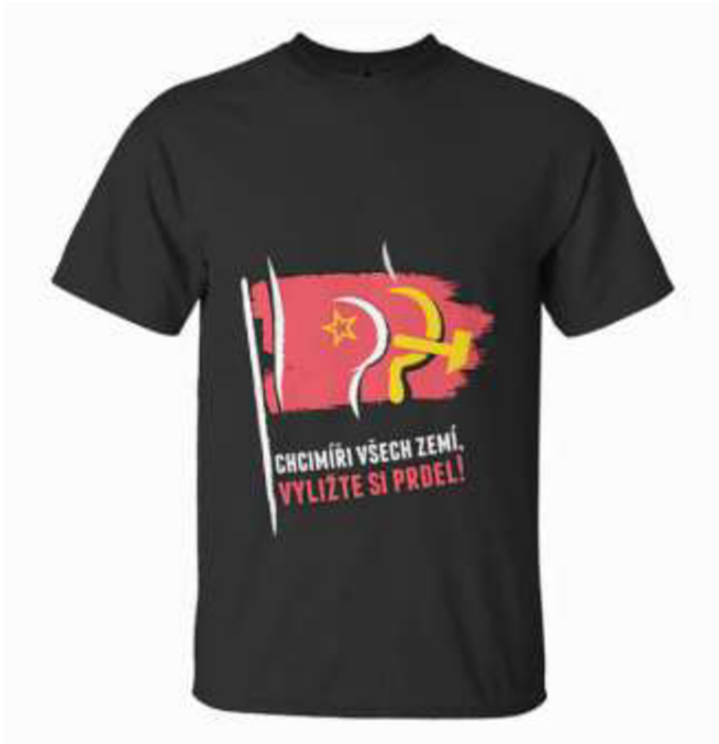
Obrázek č. 27