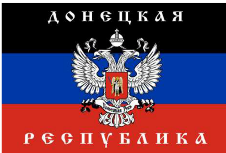
Obrázek č. 14