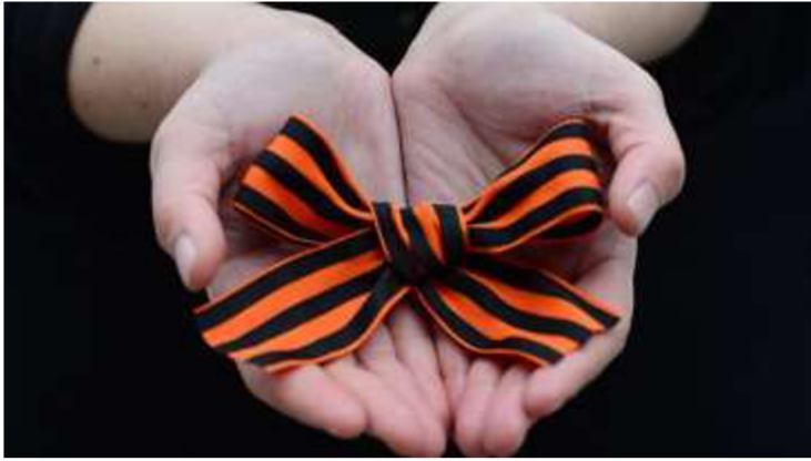
Obrázek č. 13