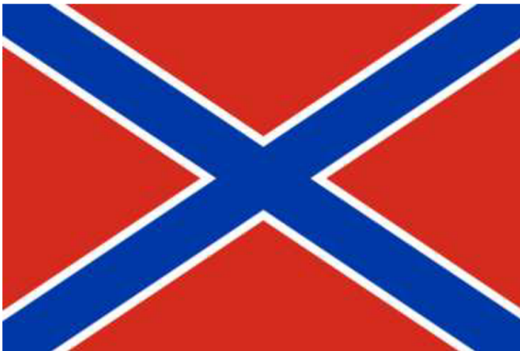
Obrázek č. 16

< https://cs.wikipedia.org/wiki/Luhansk%C3%A1_lidov%C3%A1_republika#/media/Soubor:Flag_of_the_Luhansk_People's_Republic.svg >