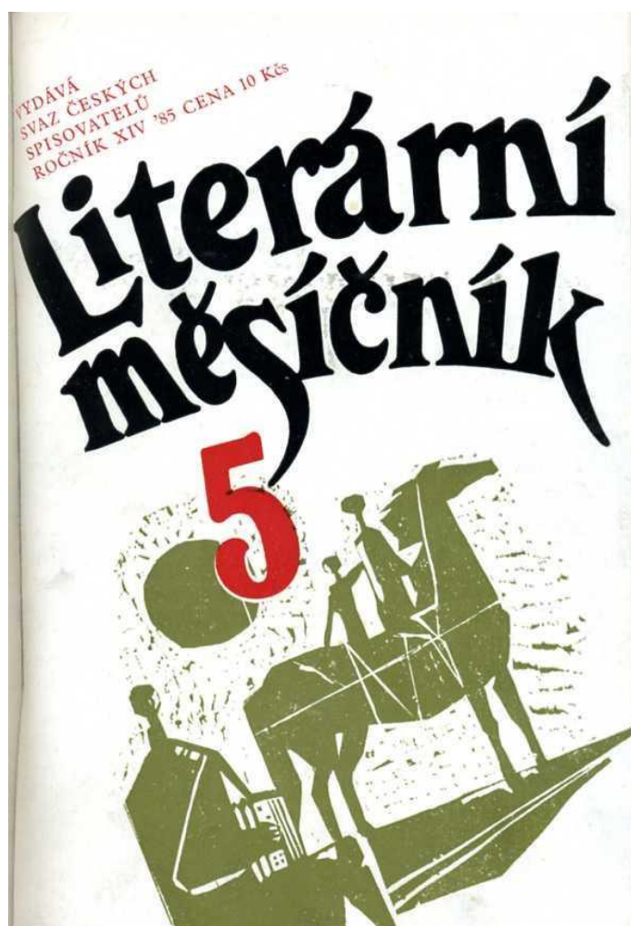
Obrázek 1 - Ukázka časopisu Literární měsíčník [8]

Literární měsíčník je periodikum, které začalo vycházet roku 1972 v nakladatelství Československý spisovatel. Charakteristické pro tento časopis bylo, že se už od svého vzniku snažil o to, aby byla provedena tzv. normalizace v literatuře. Na počátku jeho existence ho řídil Rudolf Kalčík, ale velmi brzy se na tento post dostali jiní, jako například Josef Rybák, nebo Oldřich Rafaj či Vladimír Kolár. [9, str. 132]