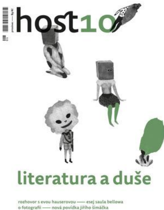
Obrázek 3 - Úvodní obrázek časopisu Host [12]