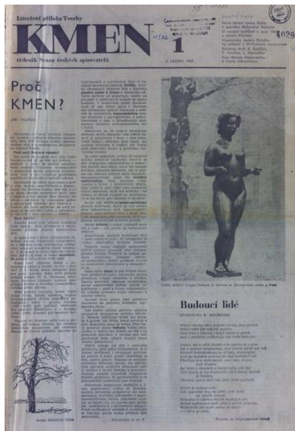
Obrázek 2 - Ukázka časopisu Kmen [10]

K jeho charakteristice lze úvodem říci: „Vedle Literárního měsíčníku druhý reprezentativní časopis oficiálně vydávané literatury 80. let.“ [9, str. 83]