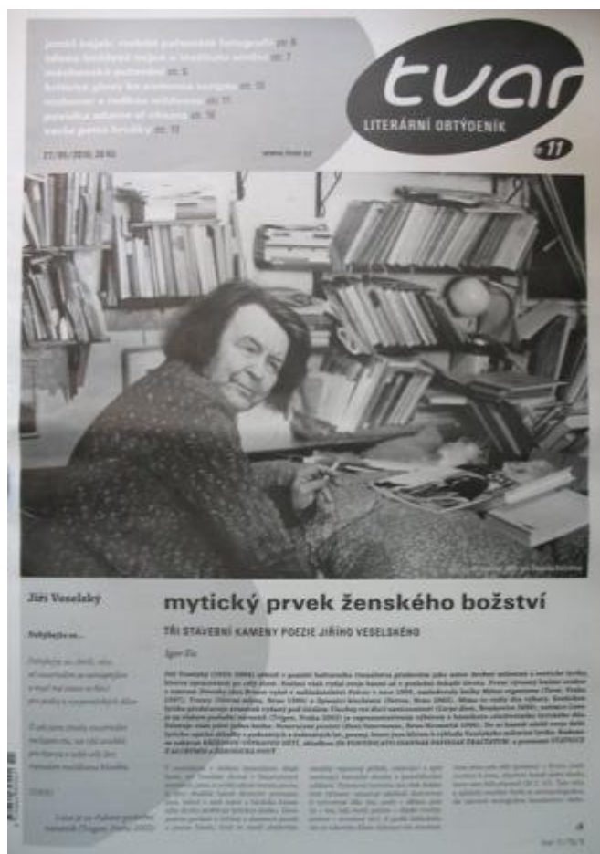
Obrázek 4 - Úvodní obrázek časopisu Tvar [21]