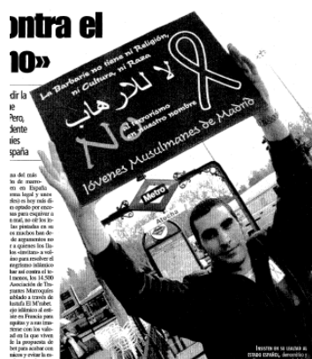
Fotografía 4 225

Incluso la fotografía de uno de Ellos que aparece es un caso extraordinario.