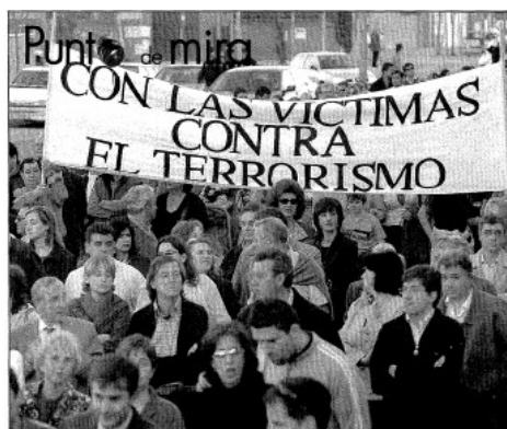
Fotografía 3 139

Solidaridad con 11-M 130 , Madrid despiden a sus muertos 131 , 4.500 personas oran por los muertos del 11-M 132 , Más de 50.000 alcaínes despiden a sus muertos 133 , La Federación de Municipios y el Ayuntamiento homenajearán a las víctimas el día 23 134 , El pueblo de Madrid 135 , Una oficina municipal centralizará todas las ayudas a las víctimas de los atentados 136 , El Pozo llora a sus muertos junto a la estación de Cercanías 137 , Víctimas del tercer once 138 .