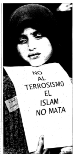
Fotografía 5 281

La victoria de Ben Laden 277 , Profesores y alumnos rinden homenaje a la niña musulmana fallecida 278 , Un marroquí representará a Jesús en la Pasión 279 , Los investigadores barajan que uno de los terroristas se arrepintiese antes de inmolarse 280 .