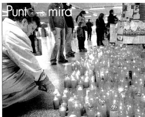
Fotografía 1 90

presentamos el dibujo que acompañaba el titular dedicado al lugar de la masacre, Atocha, un mes después .