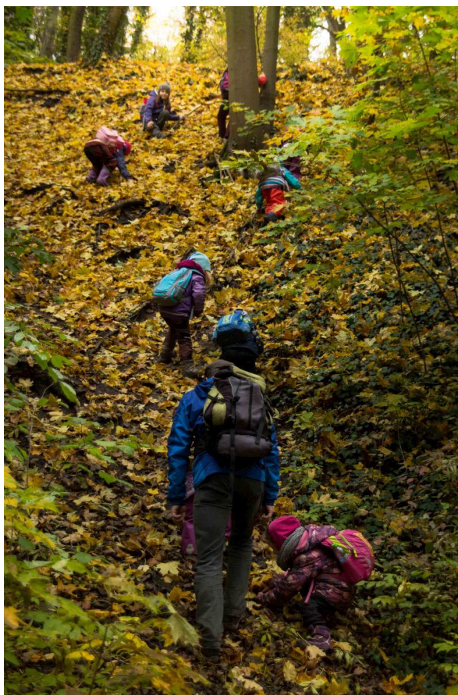
Obrázek č. 8 – procházka lesní mateřské školy 59