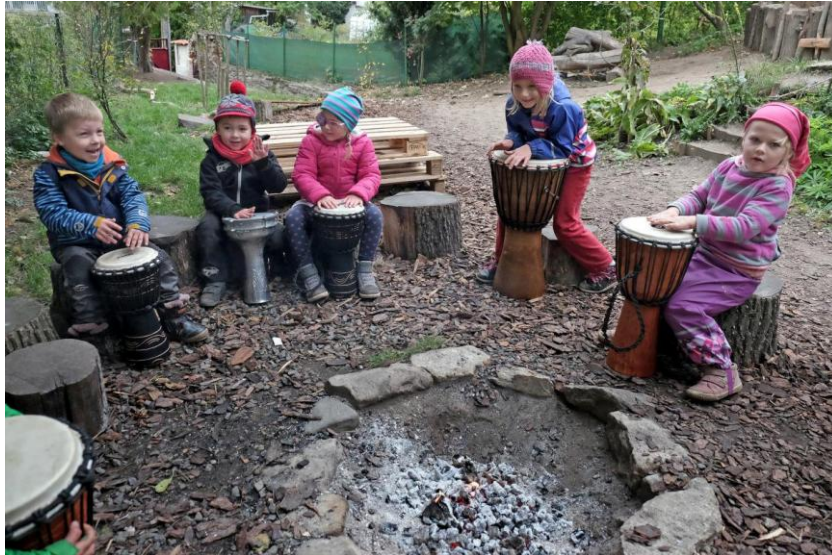
Obrázek č. 6 – hry v lesní MŠ 56