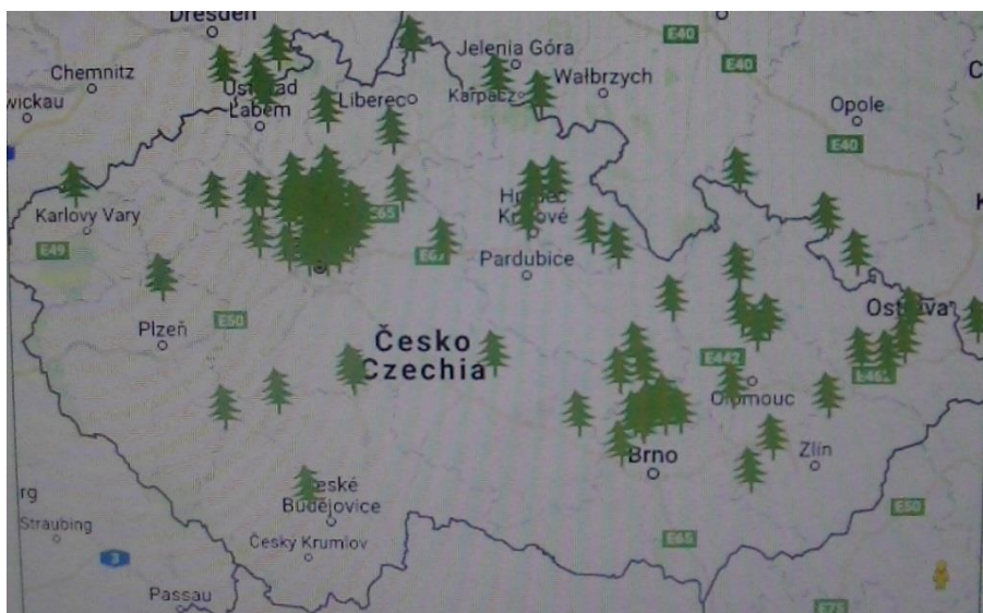
Obrázek č. 3 – detailní mapa lesních MŠ 14

Na výše uvedené mapě lesních MŠ je zřetelné, že nejvíce zřízených lesních mateřských škol se nachází v Praze a Středočeském kraji. V okolí Brna, Ostravy a Olomouce je zřízených LMŠ také poměrně dost.