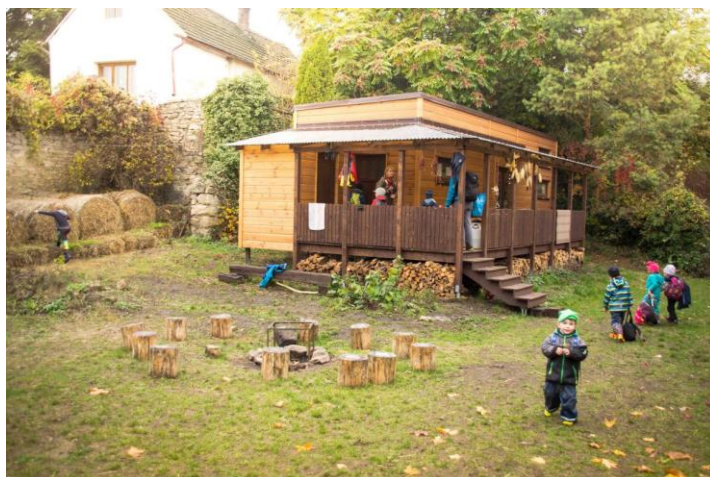
Obrázek č. 7 – zázemí LMŠ 58