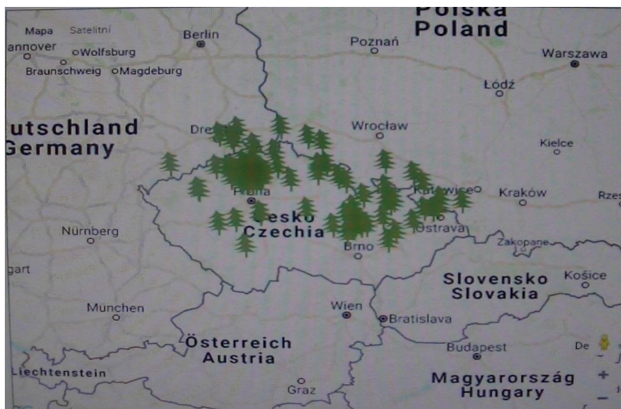
Obrázek č. 2 – přehledná mapa lesních MŠ 13

Asociace lesních MŠ 11 je občanský spolek, který sdružuje více než 120 lesních mateřských škol z celé České republiky. Hlavním účelem spolku Asociace lesních MŠ je podporovat péči o děti a jejich vzdělávání v pravidelném kontaktu s přírodou a s tím spojená podpora udržitelného rozvoje, environmentální výchovy a vzdělávání. Účelem spolku je také harmonizace profesního a rodinného života a rovných příležitostí. Asociace lesních MŠ je organizací pro subjekty zaměřené na výchovu a vzdělávání předškolních dětí v přírodě, působící na celorepublikové úrovni. 12