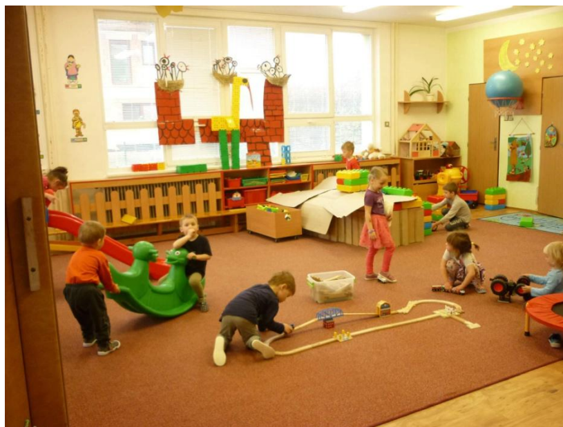
Obrázek č. 5 – hry v klasické MŠ 55

V této práci budou použity ze dvou lesních mateřských škol a ze dvou klasických mateřských škol. Použité účetní výkazy jsou za rok 2015.