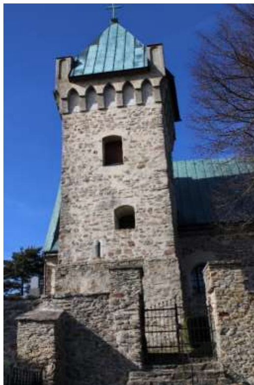
Obrázek 16. Jižní průčelí věže.