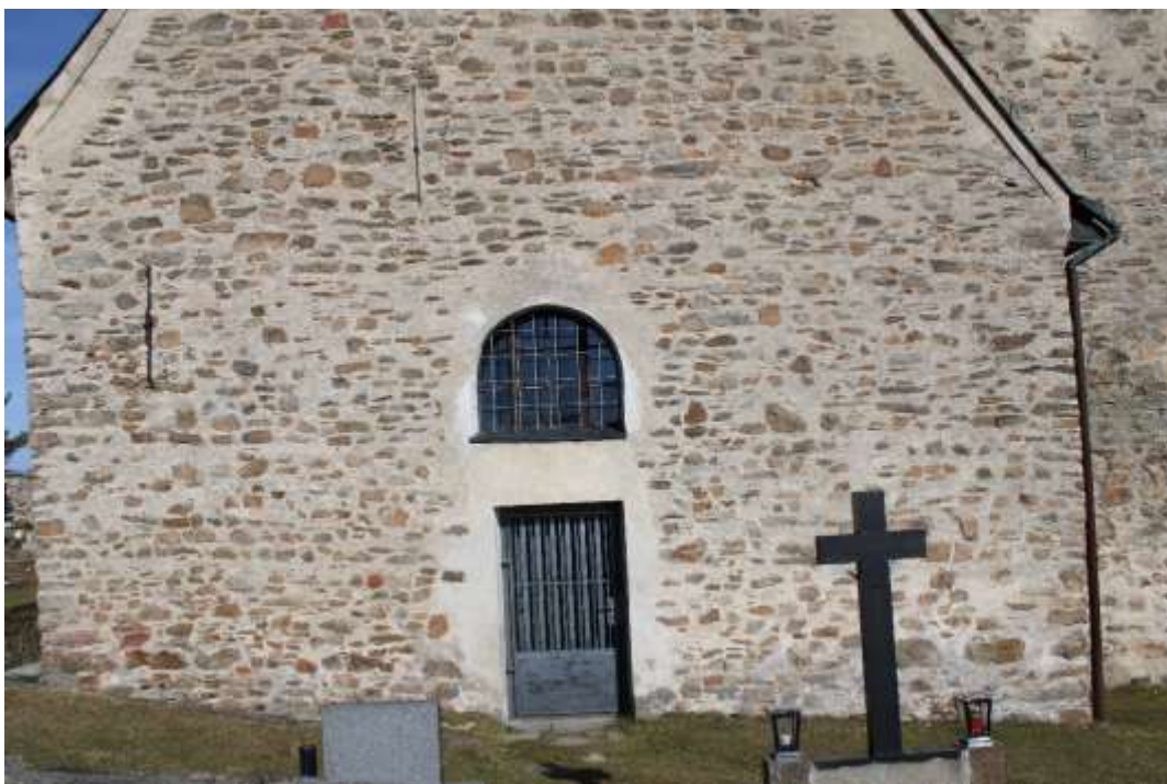
Obrázek 3. Jihozápadní vchod.