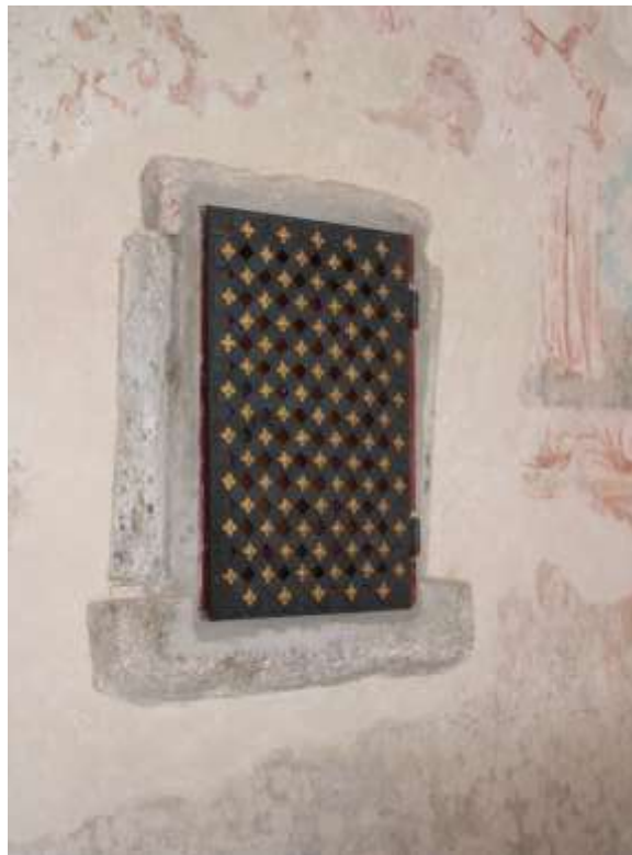
Obrázek 39. Nika opatřena tesaným rámem.