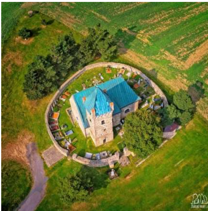
Obrázek 7.