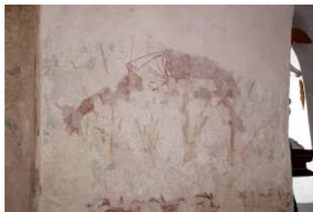
Soubor obrázků 78. Umučení 10 000 rytířů. Vítězný oblouk.