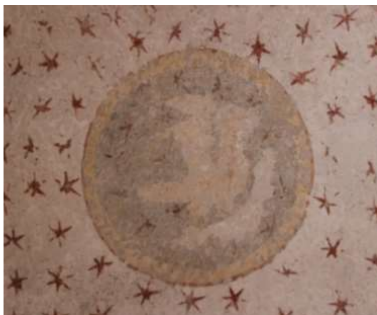
Obrázek 82. Medailon Iva evangelisty Marka. Klenba presbytáře.