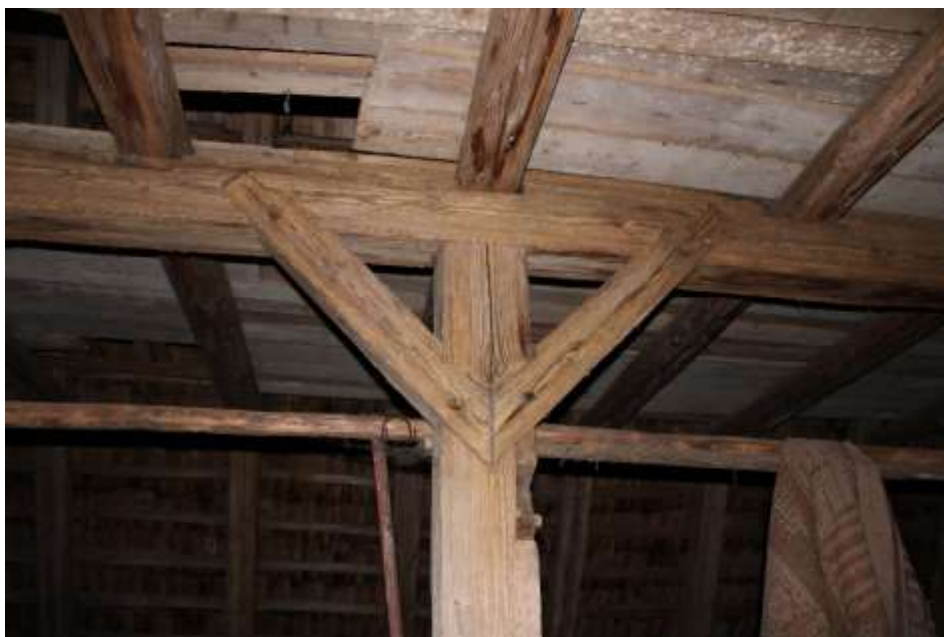
Obrázek 53. Konstrukce krovu kostela.