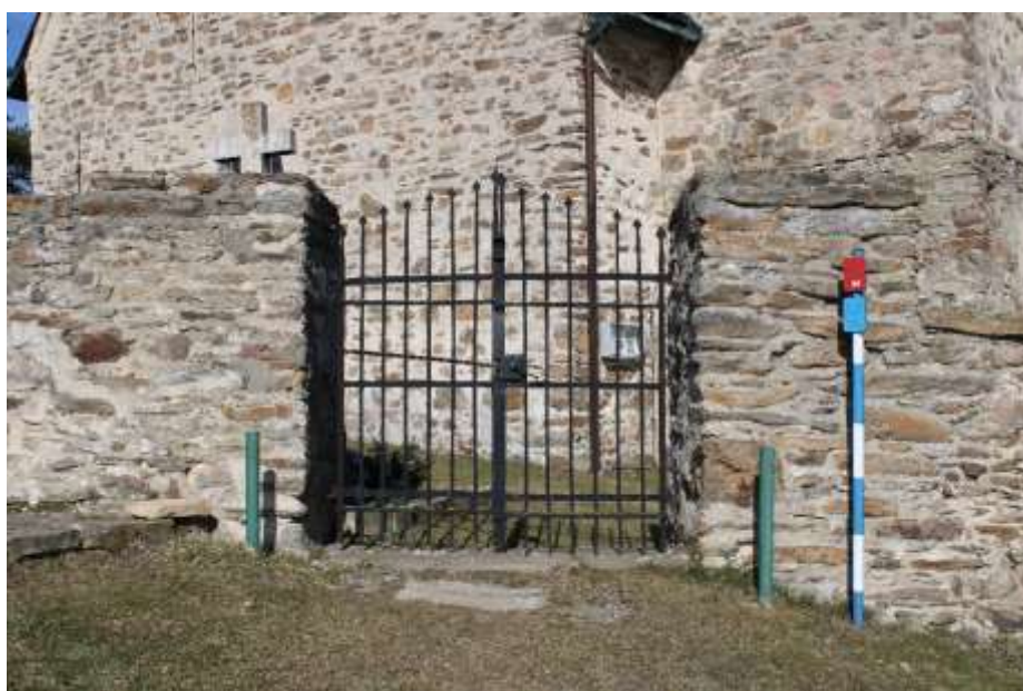
Obrázek 8. Jihozápadní vstup na hřbitov. Fotor: autor.