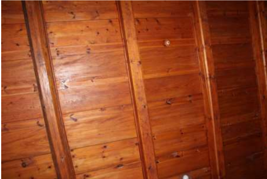
Obrázek 27. Detail trámového stropu lodě kostela.