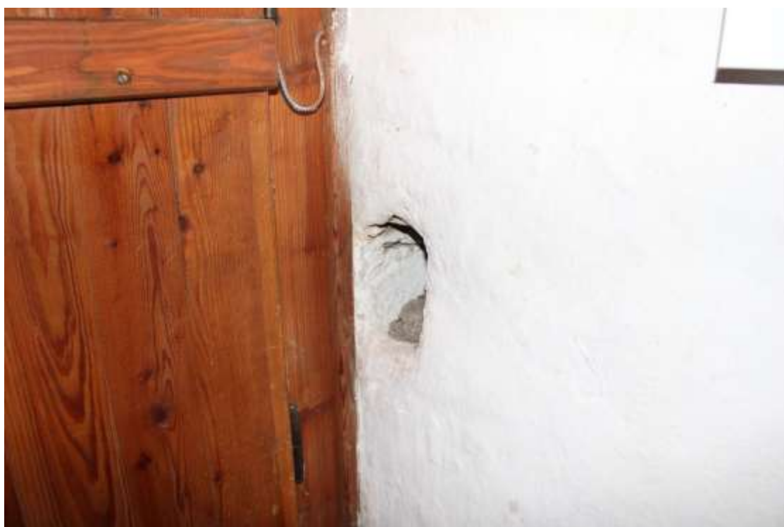
Obrázek 26. Detail hranolové kapsy závory u vstupních dveří.