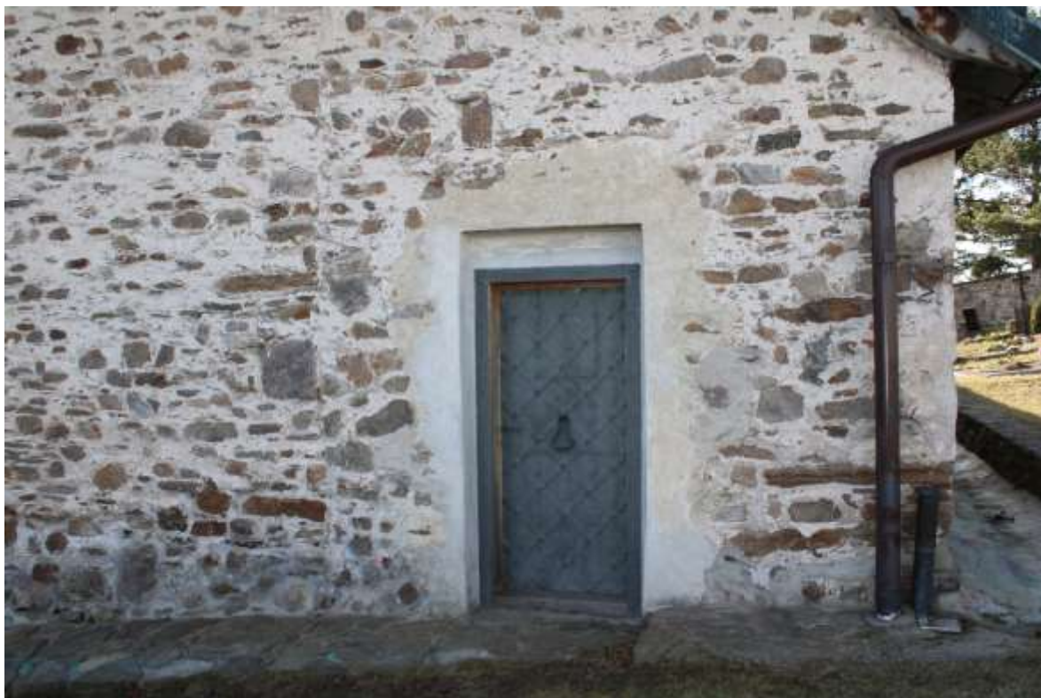
Obrázek 5. Východní vchod do sakristie.