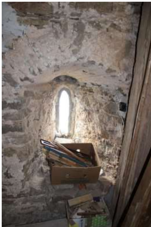
Obrázek 43. Štěrbínové okno v prvním patře věže.