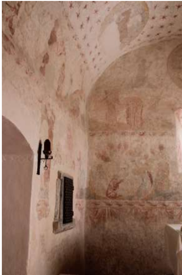
Obrázek 35. Detail uskočení v líci severní a východní stěny.