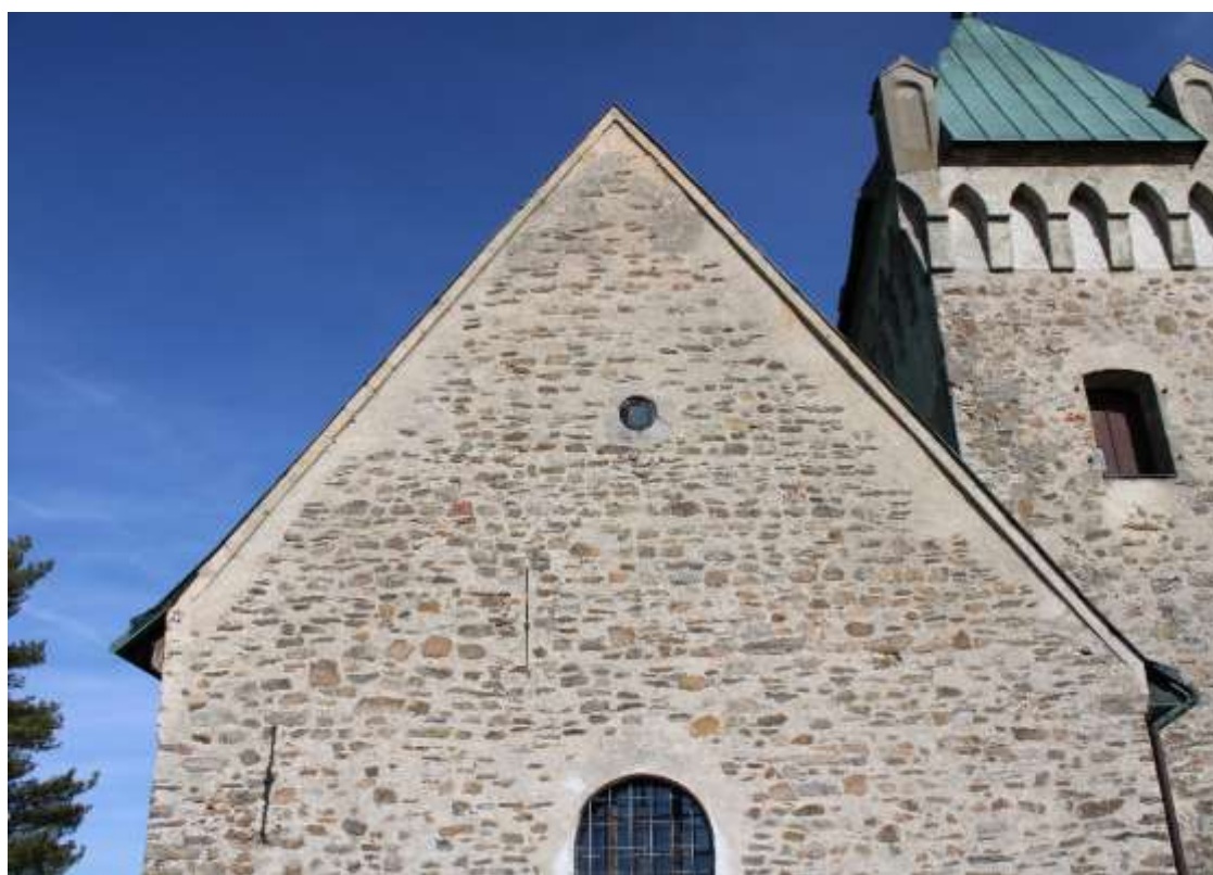
Obrázek 6. Štít lodi ze západní strany.