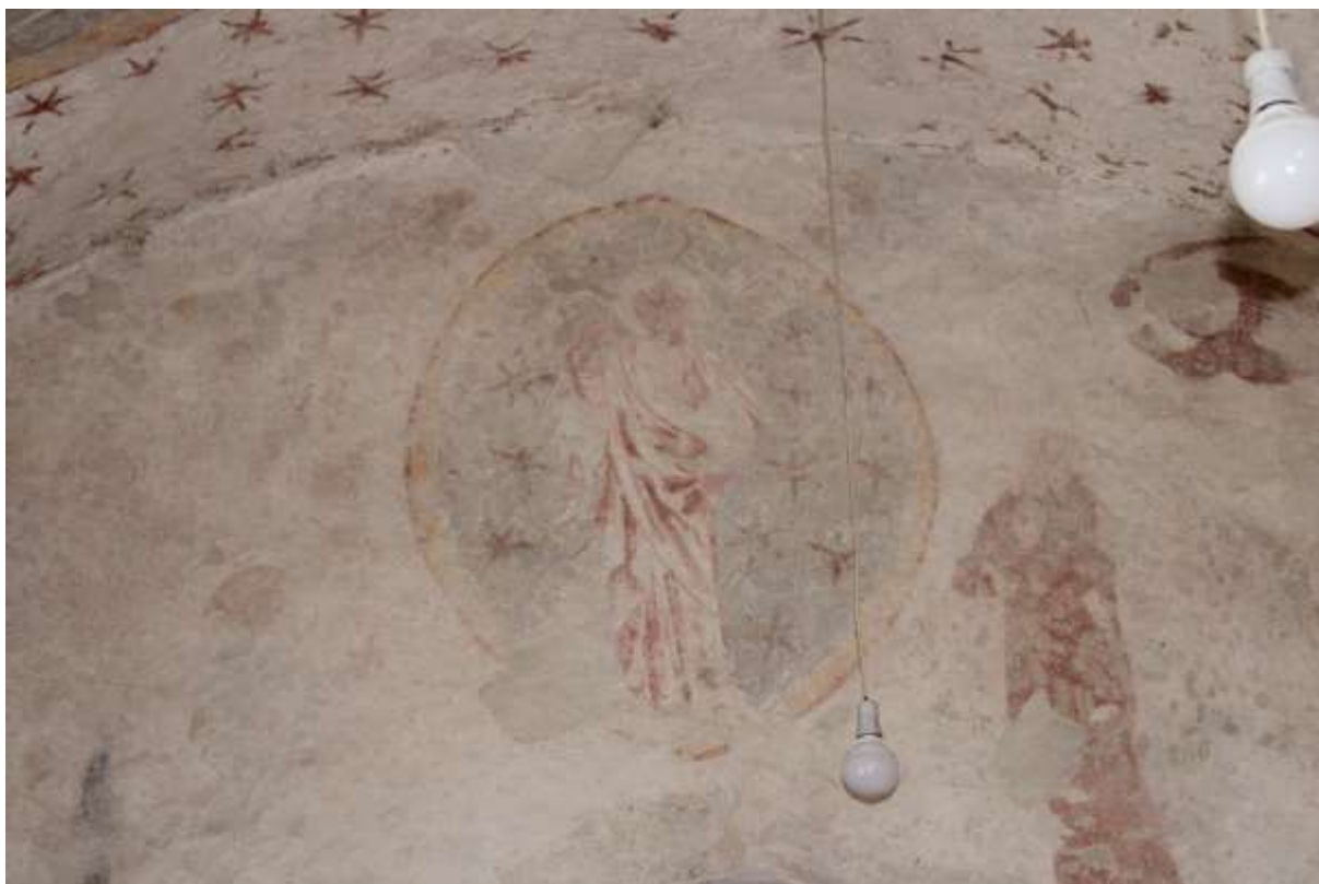
Obrázek 77. Kristus vstupující na nebesa. Vítězný oblouk.