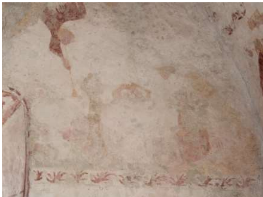
Obrázek 59. Skupina zatracených, kteří jsou odváděni d'áblem. Východní stěna presbytáře.