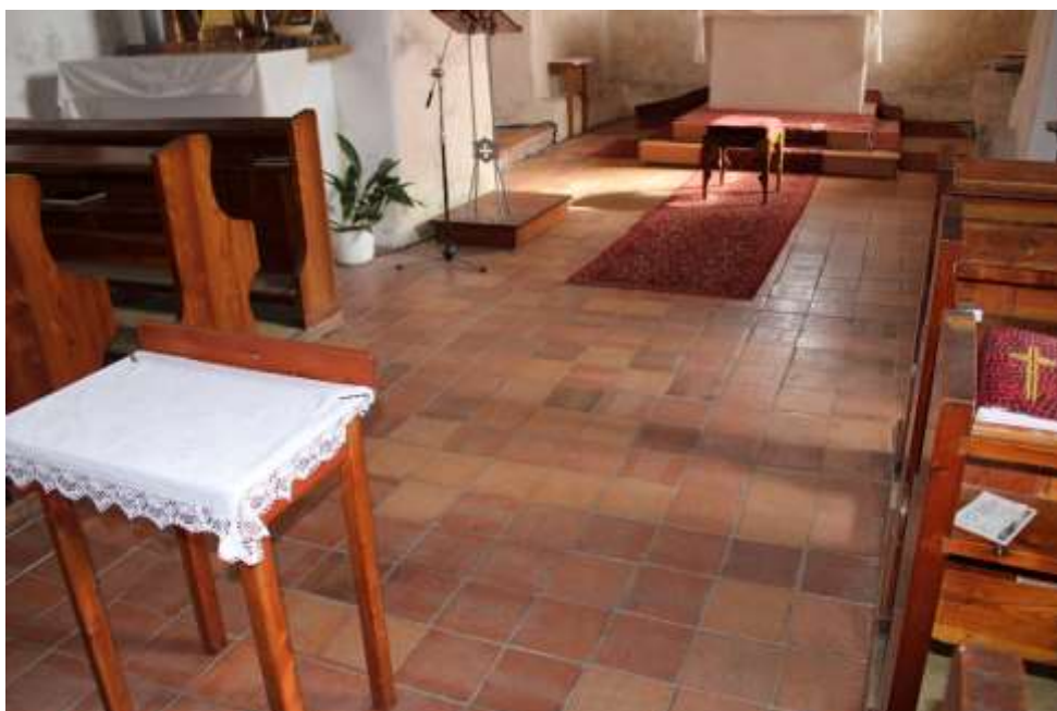
Obrázek 33. Podlaha kostelní lodi je jednotně dlážděna čtvercovými pálenými dlaždicemi a je výškově srovnána s podlahou presbytáře.