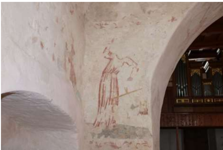
Obrázek 75. Archanděl Michael. Vítězný oblouk.