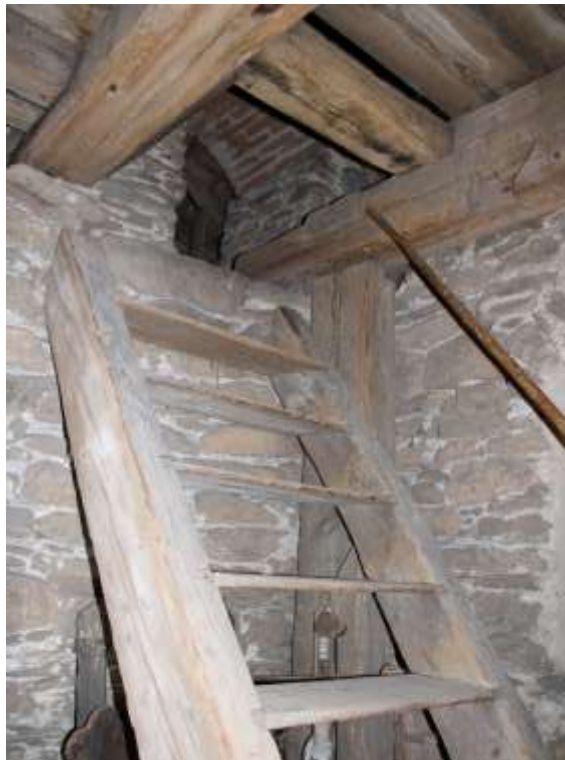
Obrázek 45. Dřevěné schody vedoucí do druhého patra věže.