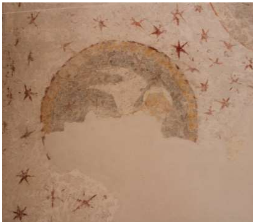
Obrázek 85. Medailon orla evangelisty Jana. Klenba presbytáře.