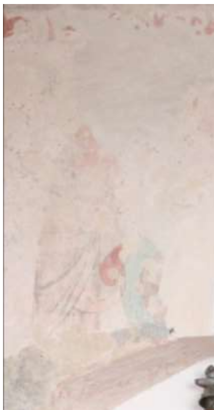
Obrázek 67. Klanění tří králů. Severní stěna presbytáře.