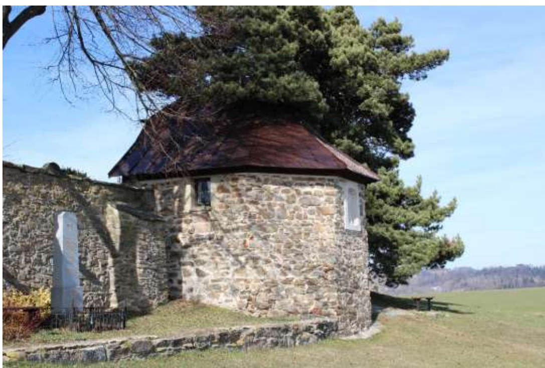
Obrázek 10. Márnice hřbitova.