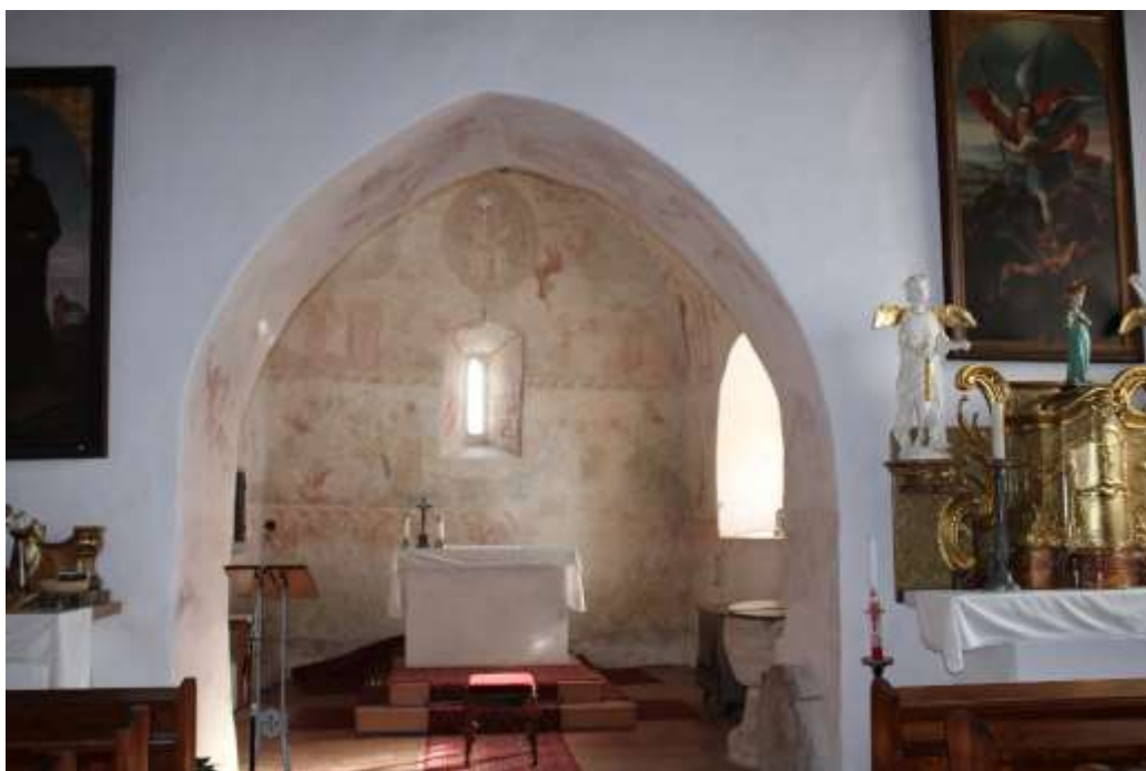
Obrázek 32. Vítězný oblouk.