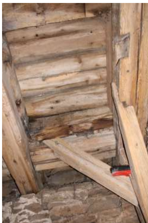
Obrázek 46. Krov prvního patra věže, detail spoje „na rybinu“.