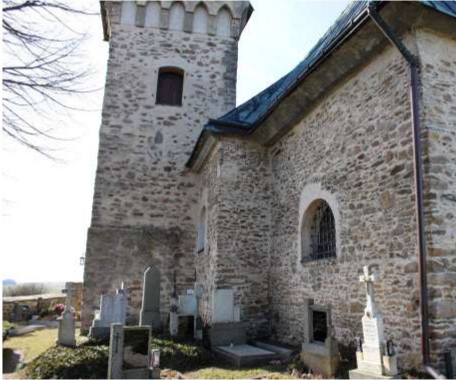
Obrázek 15. Jižní průčelí .