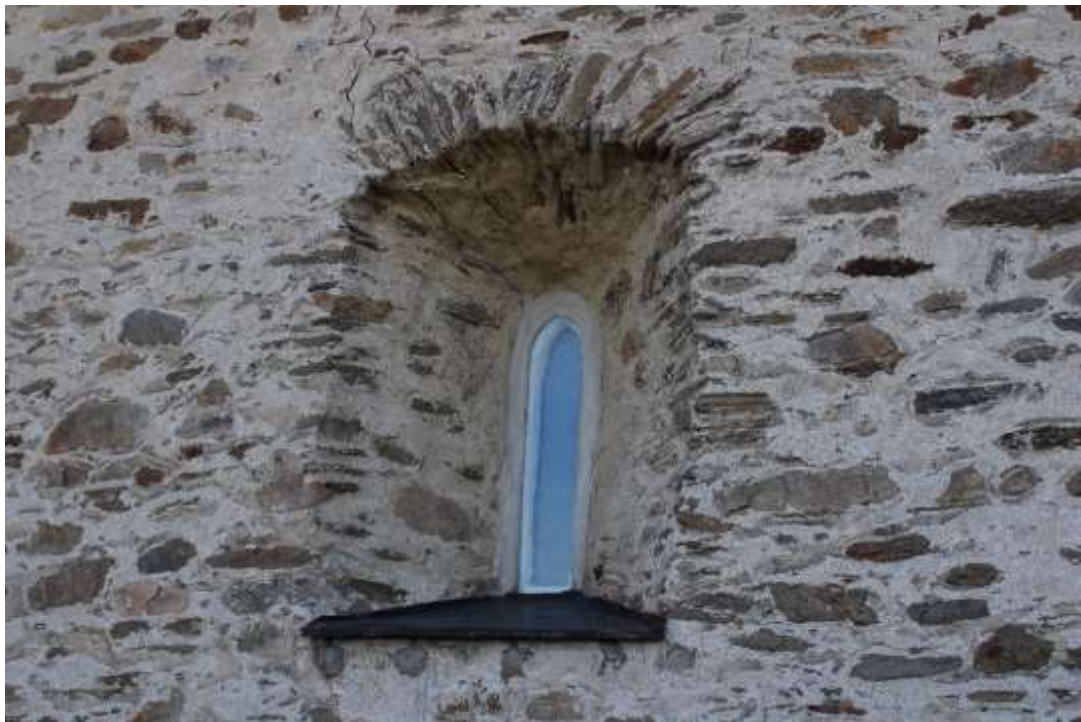
Obrázek 20. Detail okna presbytáře východní stěny.