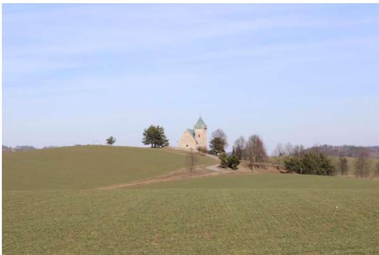
Obrázek 2. Pohled na kostel od jihozápadu.