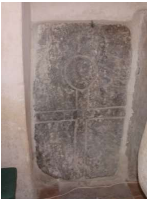
Obrázek 88. Náhrobní kámen, původní deska menzy s egyptským křížem. Presbytář kostela.