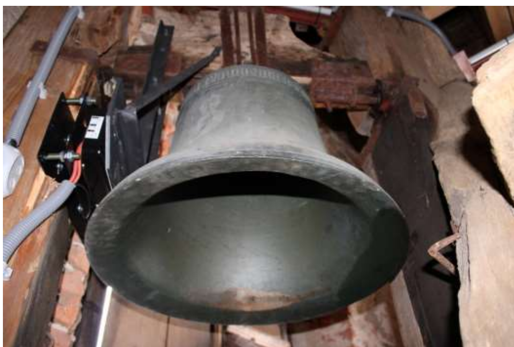
Obrázek 92 Menší zvon kostela.