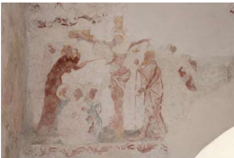
Obrázek 68. Ukřižování Krista. Jižní stěna presbytáře.