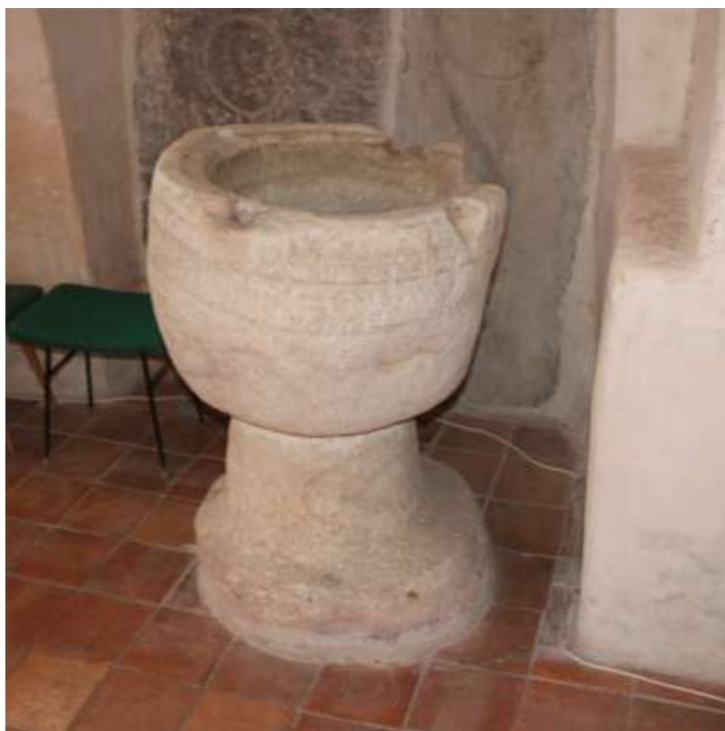
Obrázek 86. Křtitelnice.