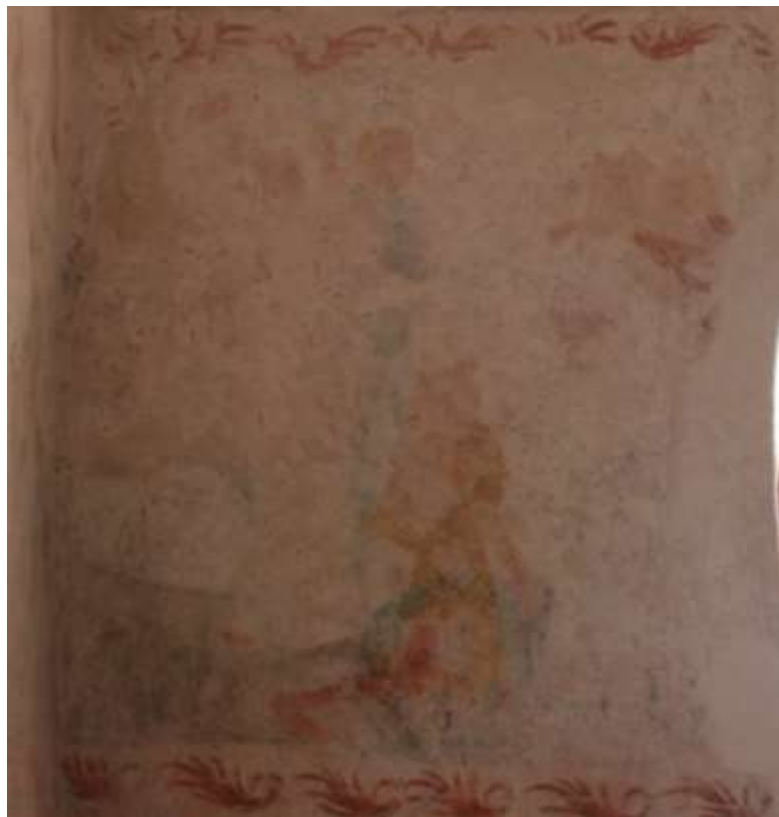
Obrázek 72. Scéna s donátory. Jižní stěna presbytáře.