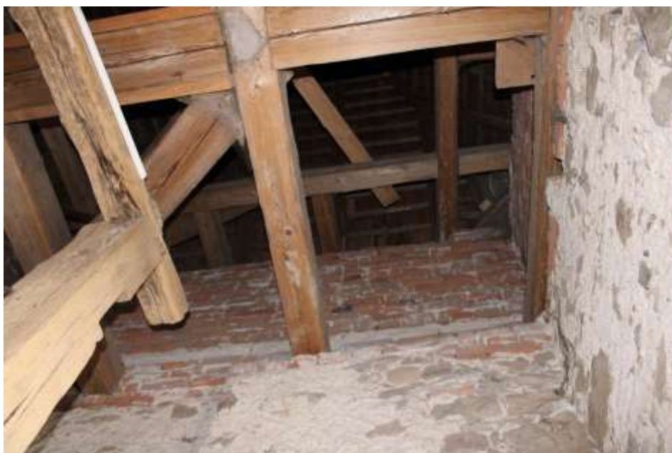
Obrázek 49. Nejvyšší zdivo věže, ve výšce přibližně 1,5 metru, je výhradně z cihel.