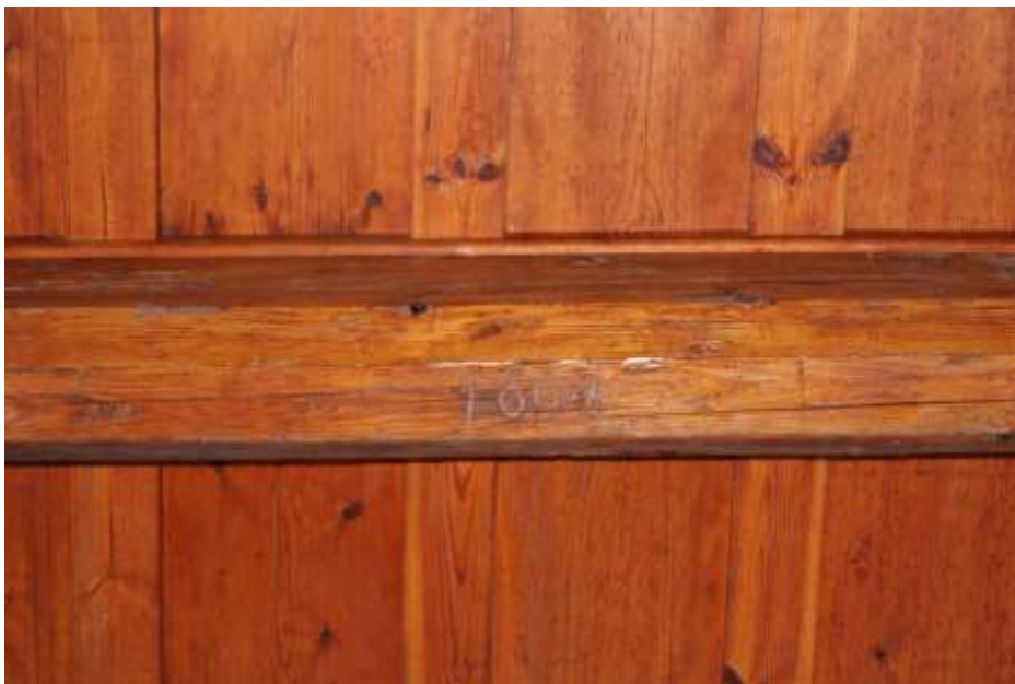
Obrázek 28. Detail trámu s datací 1661.