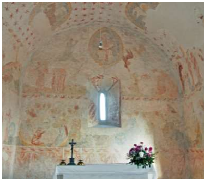
Obrázek 55. Poutní kostel sv. Michaela Archanděla – Vítchov, oltář s vnitřními malbami. 10.3.2023. Dostupné z https://www.filmvysocina.cz/cs/lokace/cirkevni-pamatky/poutni-kostel-sv-michaela-archandela-vitochov.