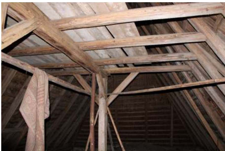
Obrázek 52. Konstrukce krovu kostela.