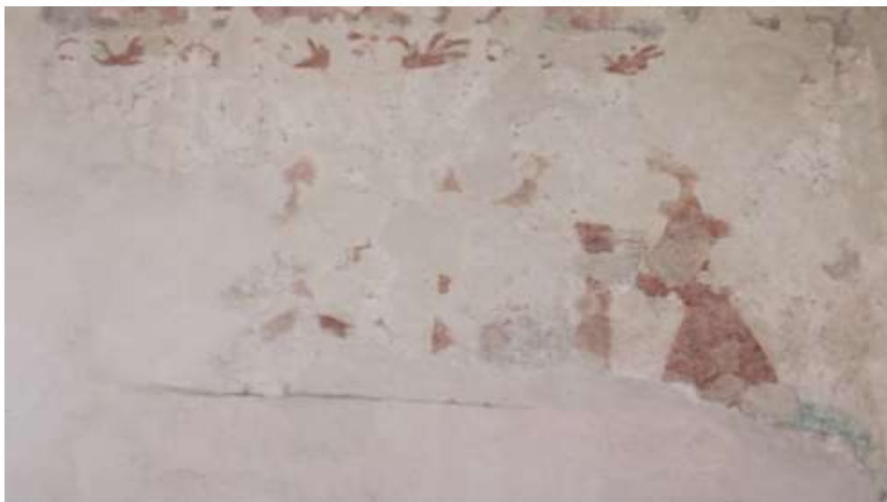
Obrázek 73. Pilát omývající si ruce. Jižní stěna presbytáře.