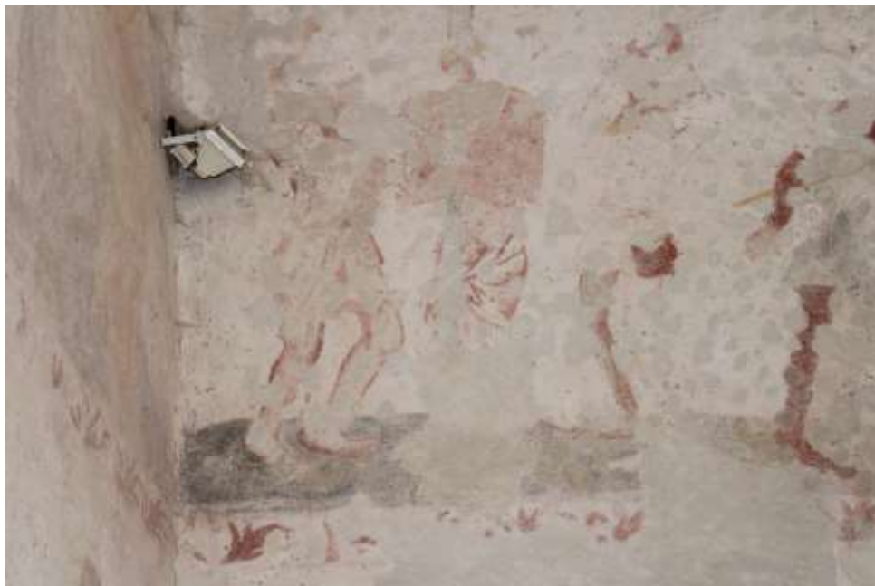
Obrázek 62. Bičování Krista. Severní stěna presbytáře.