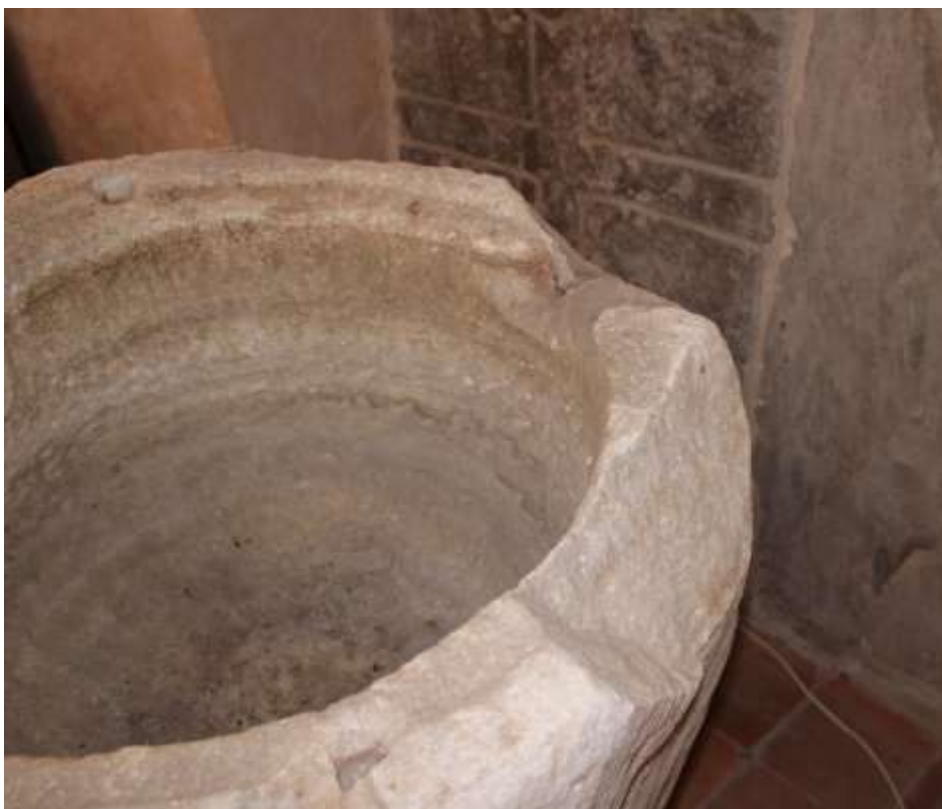
Obrázek 87. Detail poškození křtitelnice.