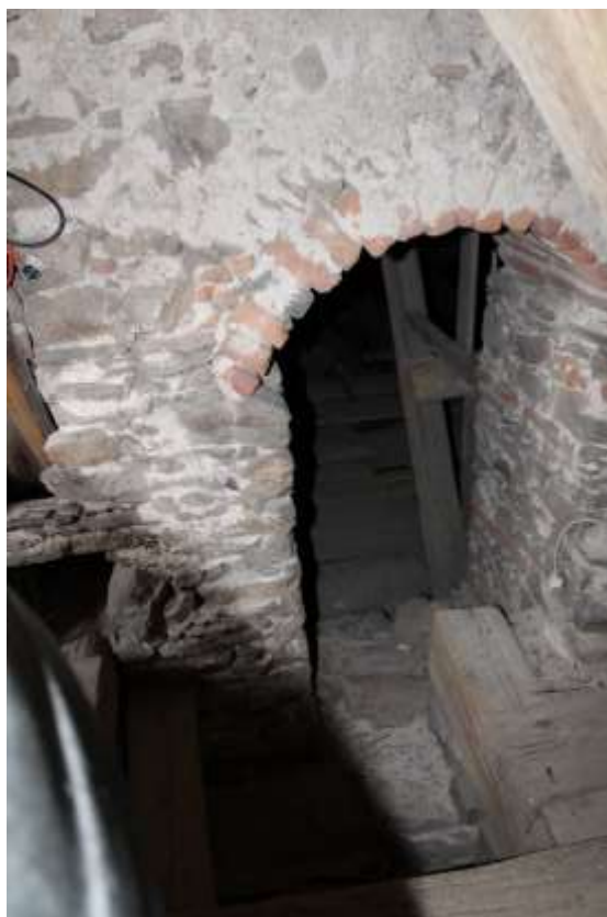
Obrázek 48. Průchod do podkroví kostela