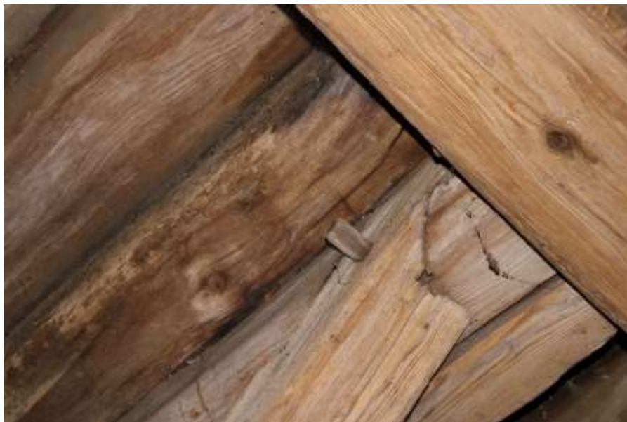
Obrázek 47. Detail spojení fixace trámů pomocí kolíků.