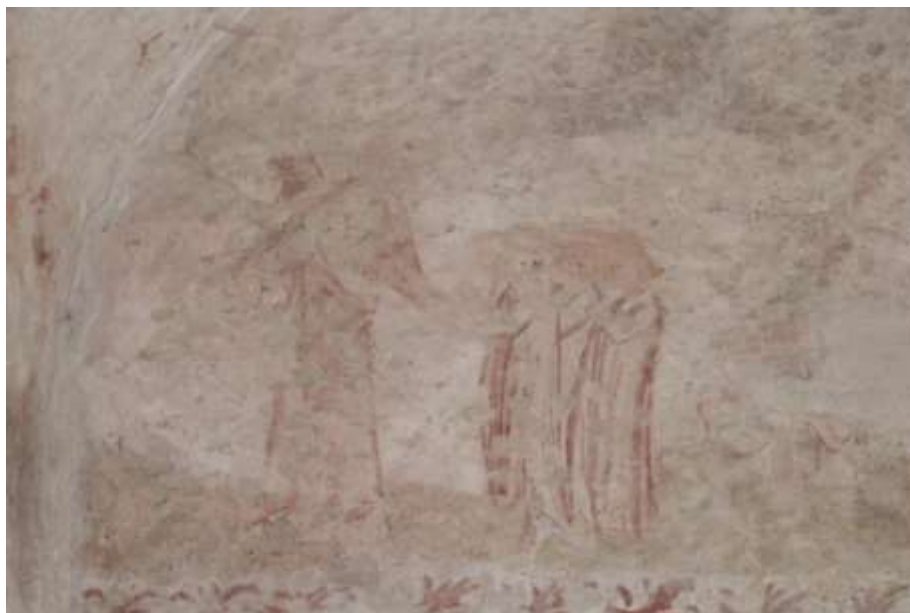
Obrázek 58. Anděl odvádějící duše do očištnice. Východní stěna presbytáře.