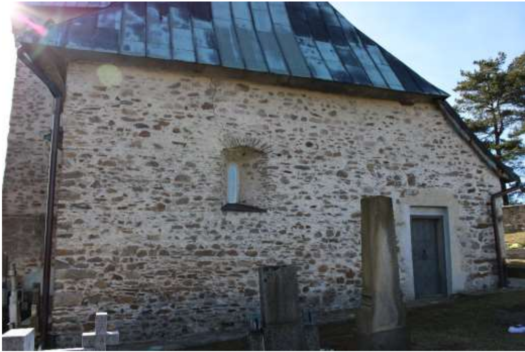
Obrázek 19. Východní průčelí.