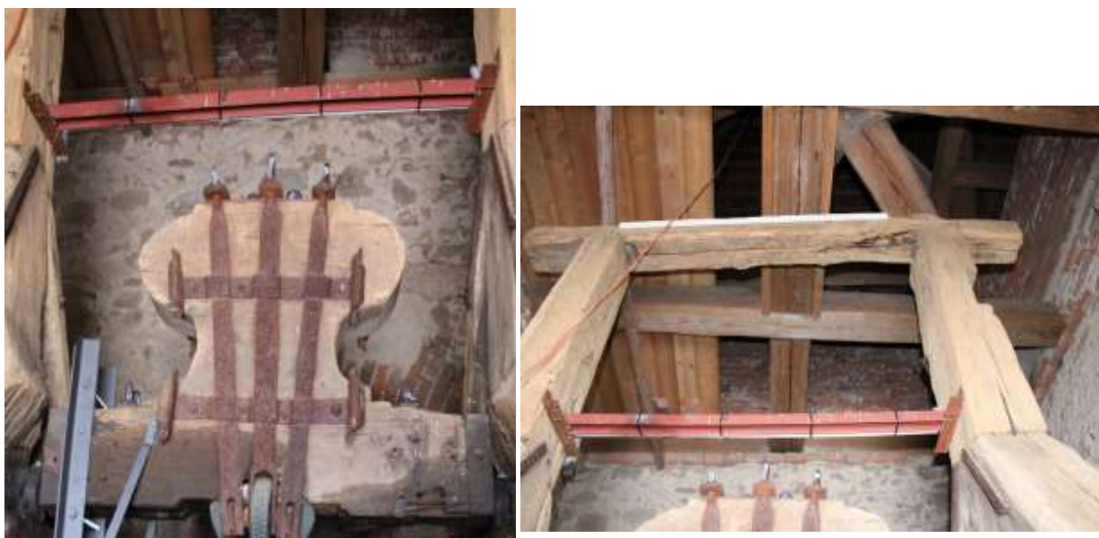
Obrázek 50. Detail trámové konstrukce nesoucí dvojici pozdně gotických zvonů.