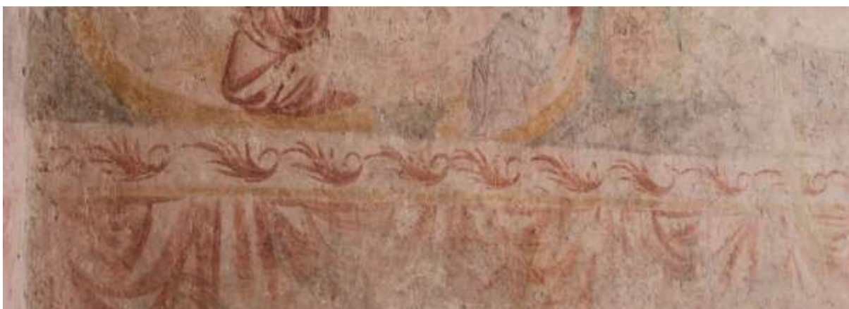
Obrázek 74. Rostlinné motivy, které oddělují jednotlivé pásy.