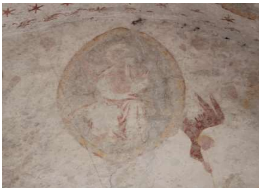
Obrázek 56. Východní stěna presbytáře. Scéna Posledního soudu, na níž je uprostřed umístěný Kristus Pantokrator ukazující rány na svých rukou.