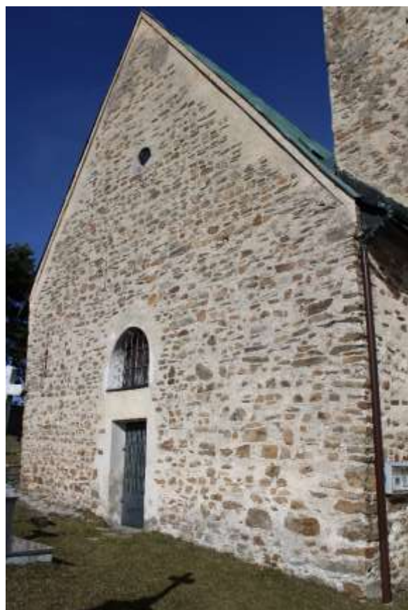
Obrázek 12. .Západní průčelí.