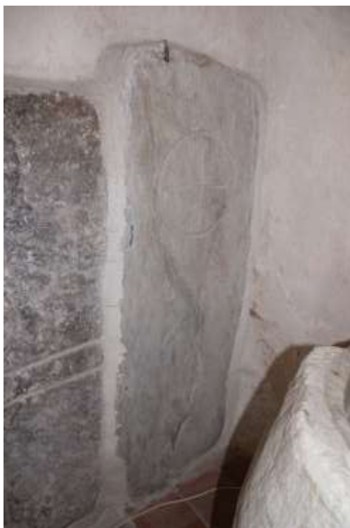
Obrázek 89. Náhrobní kámen s řeckým křížem. Presbytář kostela.