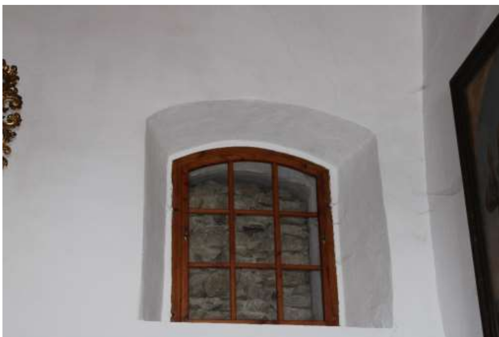
Obrázek 31. Druhotně zazděné okno severní stěny.