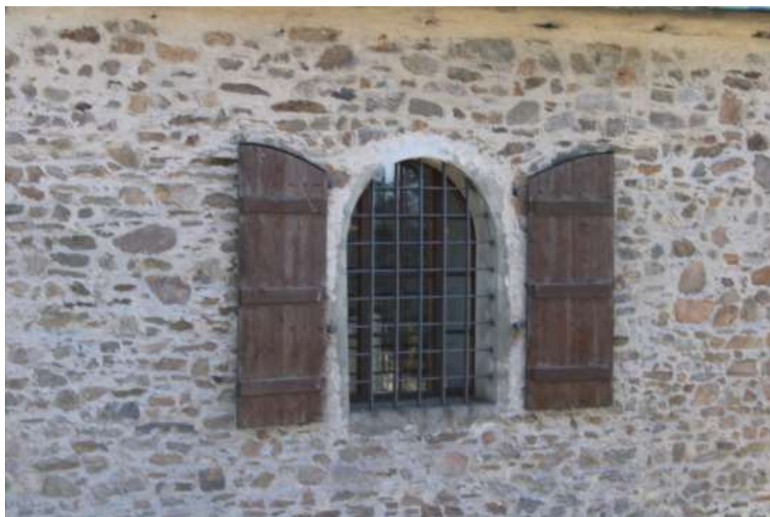
Obrázek 22. Detail okna na severním průčelí kostela.