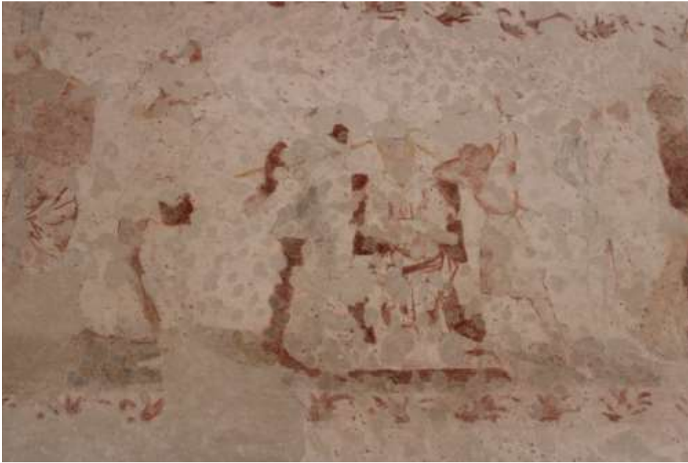
Obrázek 63. Kristus korunován trním. Severní stěna presbytáře.