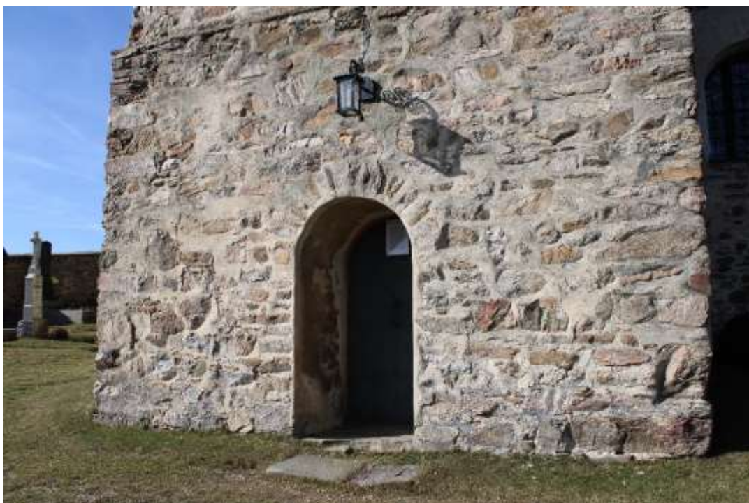
Obrázek 4. Jižní vchod podvěží.