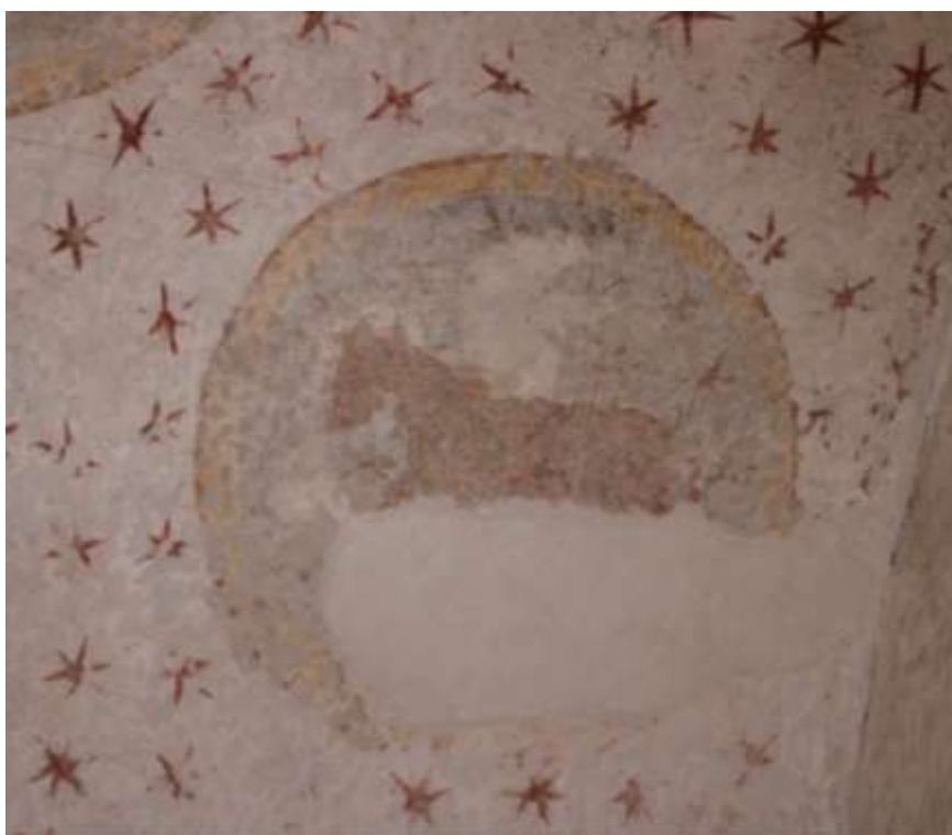
Obrázek 84. Medailon býka evangelisty Lukáše. Klenba presbytáře.