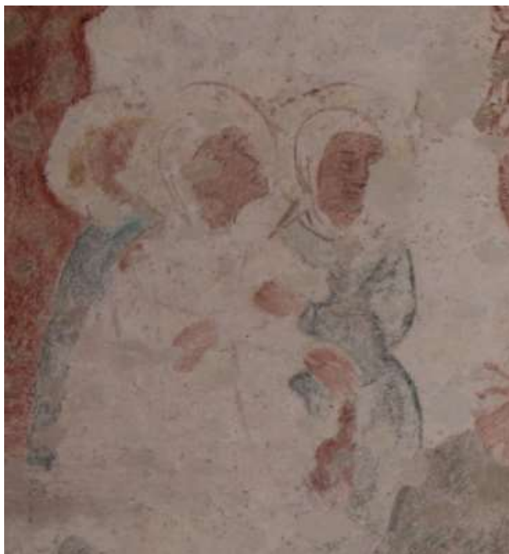
Obrázek 69. Detail jediných dochovaných vyobrazení obličejů namalovaných postav. Jižní stěna presbytáře.