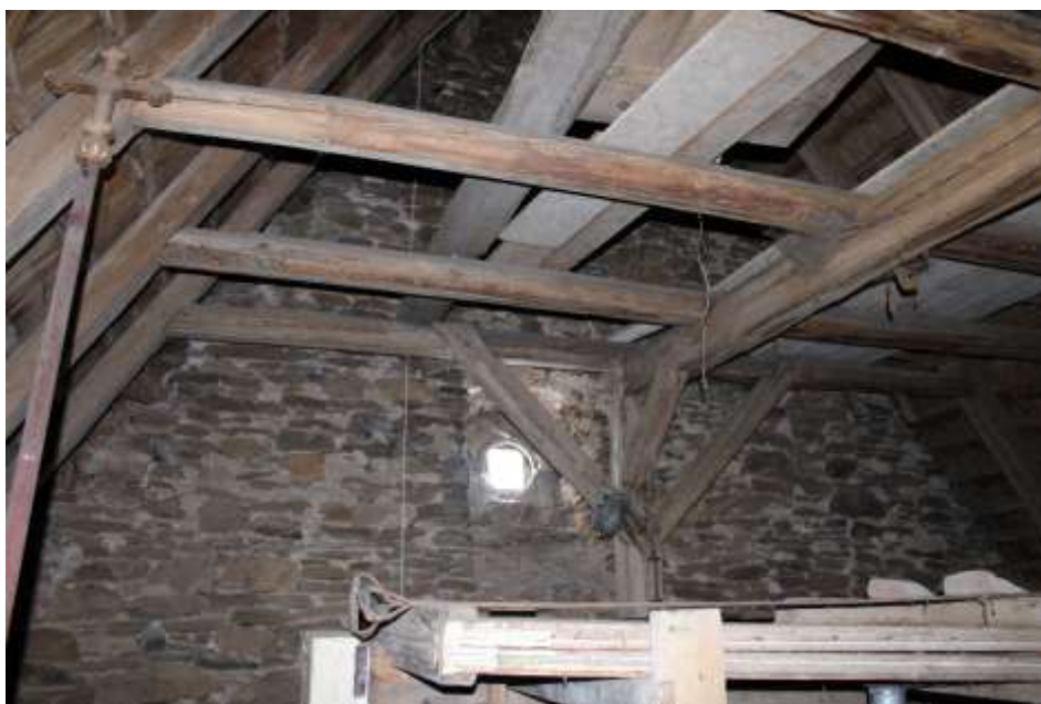
Obrázek 54. Konstrukce krovu kostela.