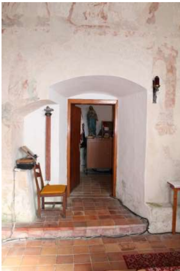
Obrázek 37. Vstup do sakristie, vlevo původní sedíle.