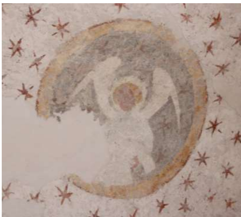
Obrázek 83. Medailon anděla evangelisty Matouše. Klenba presbytáře.