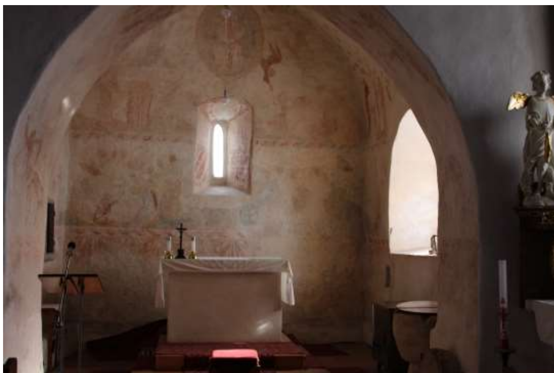
Obrázek 34. Presbytář kostela.