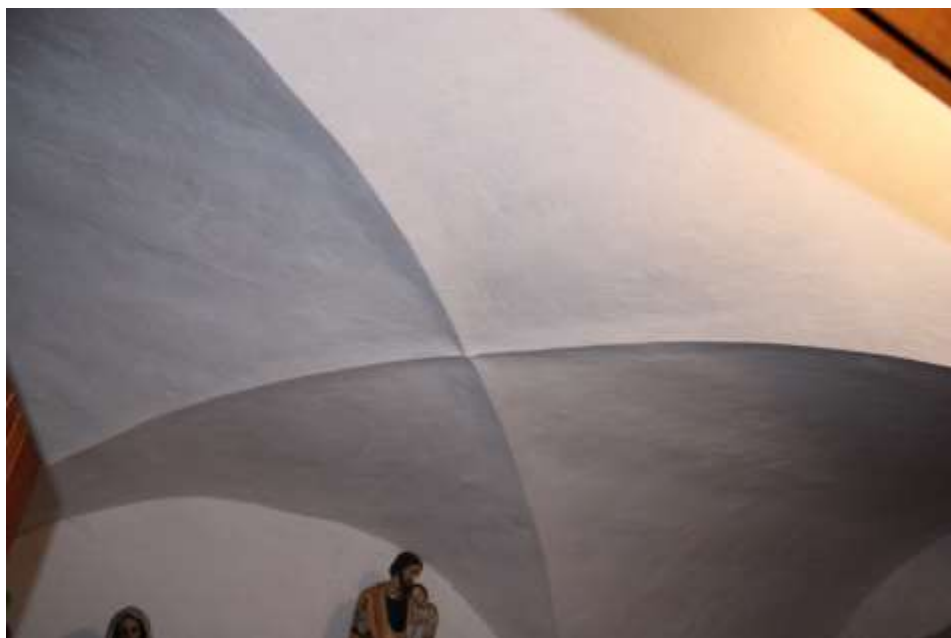
Obrázek 40. Klenba sakristie.