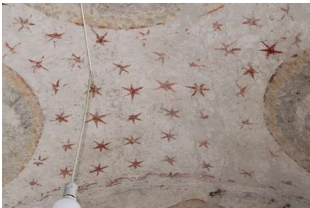
Obrázek 80. Detail šestiramenné jednoduché hvězdy. Klenba presbytáře.