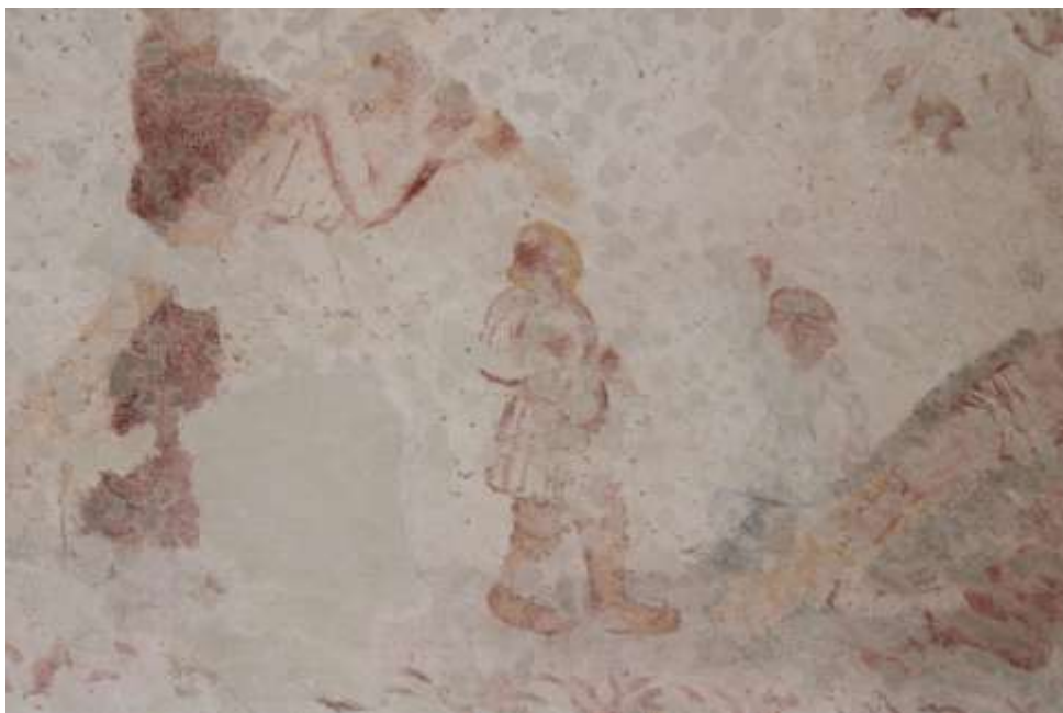
Obrázek 65. Specificky vyobrazená osoba. Severní stěna presbytáře.