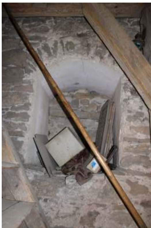
Obrázek 44. Zazděné okno v prvním patře věže.