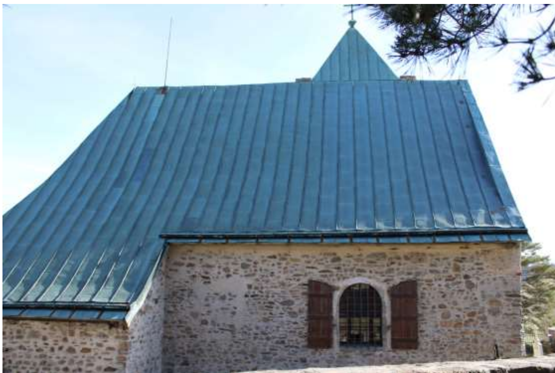
Obrázek 21. Severní průčelí.