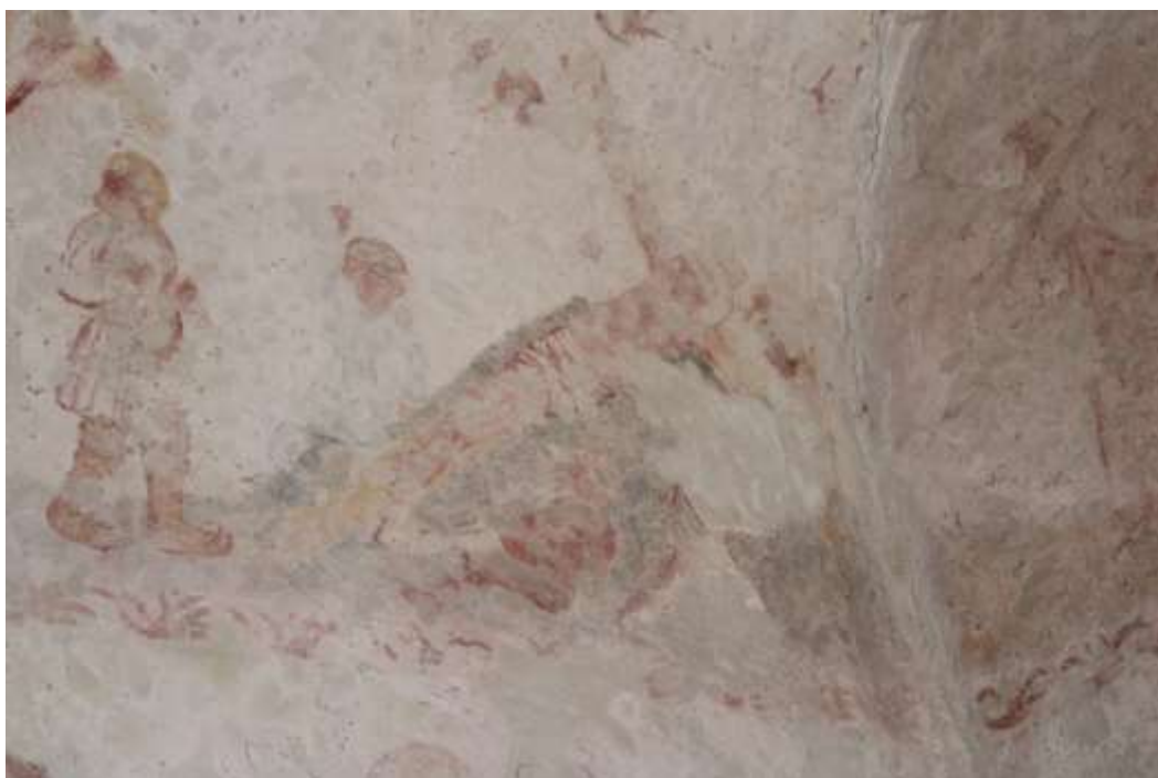
Obrázek 66. Přibíjení na kříž. Severní stěna presbytáře.