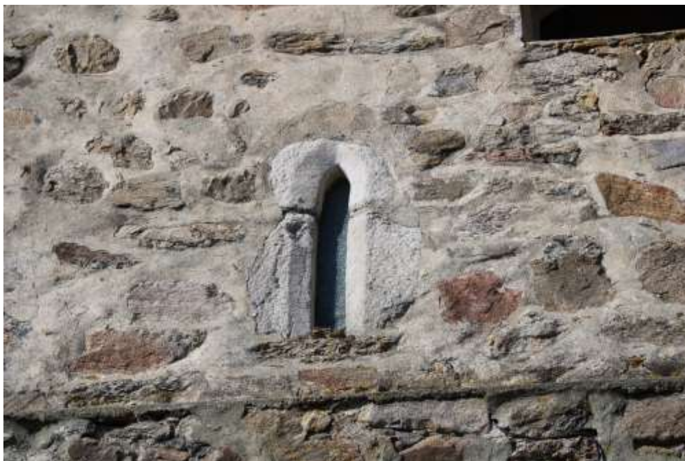
Obrázek 25. Detail okna v prvním patře věže jižního průčelí .