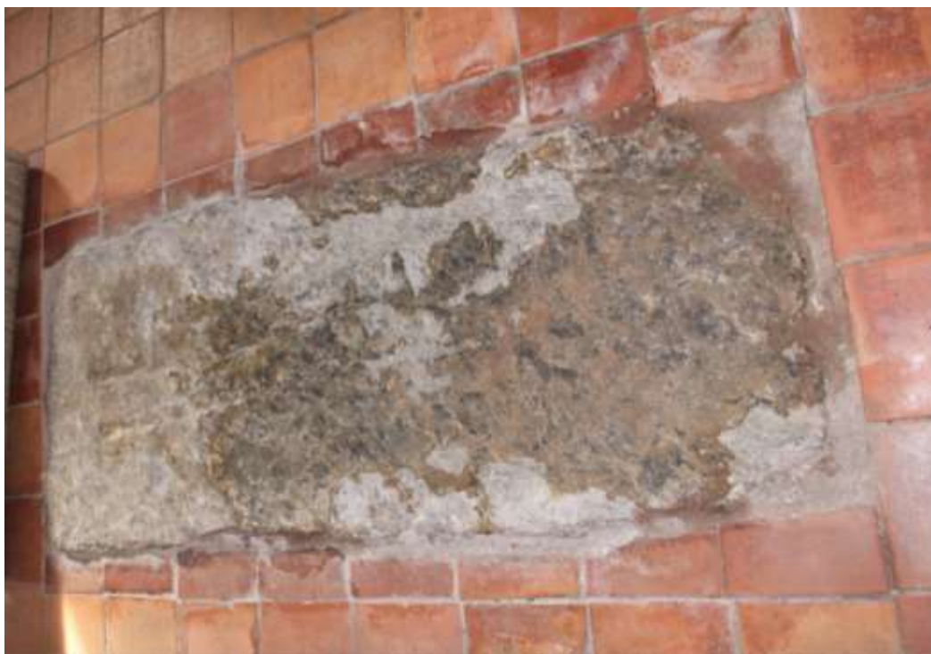
Obrázek 90. Náhrobní kámen v podlaze kostela před oltářem. Presbytář kostela.