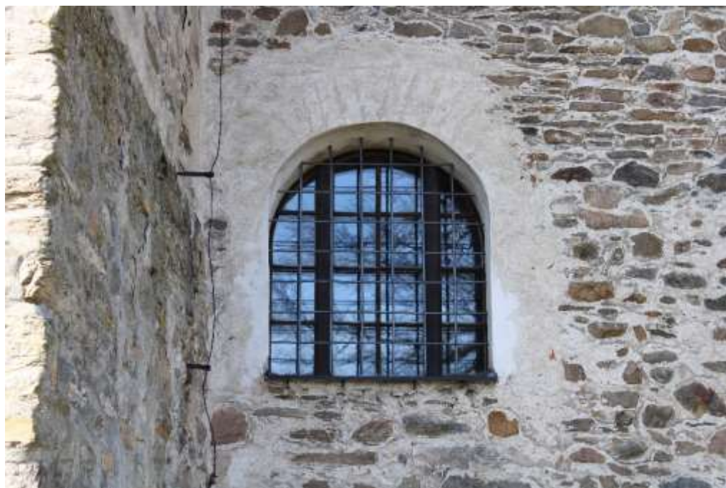
Obrázek 17. Detail čvercového okna jižního průčelí.