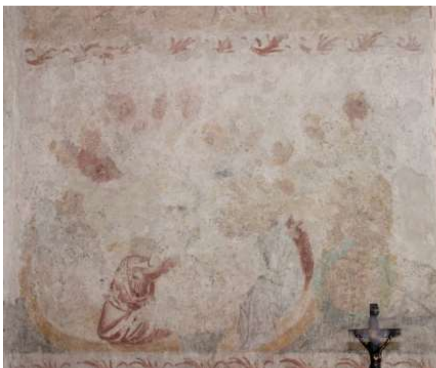
Obrázek 60. Poslední večeře Páně. Východní stěna presbytáře.