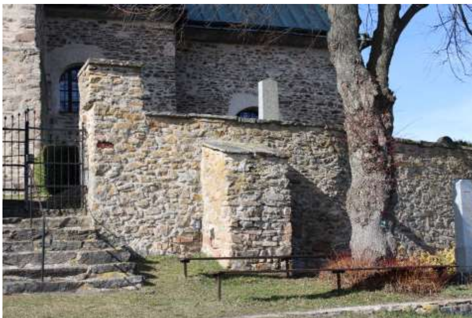
Obrázek 11. Opěrné pilíře zdi hřbitova.