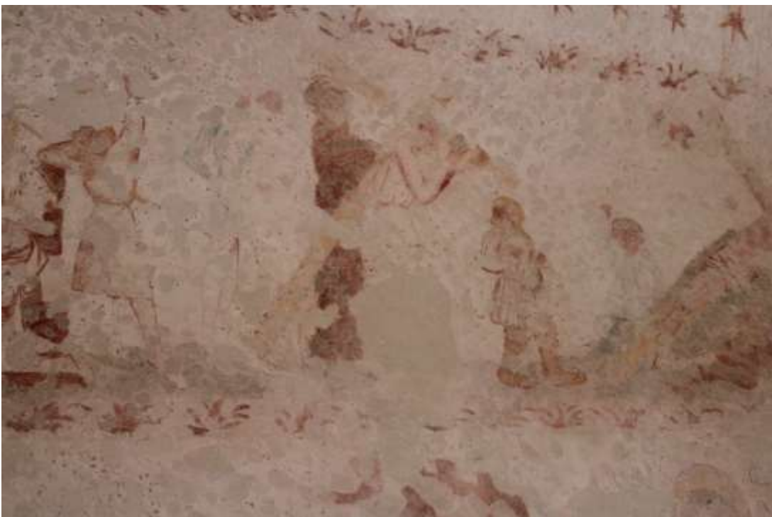
Obrázek 64. Nesení kříže. Severní stěna presbytáře.