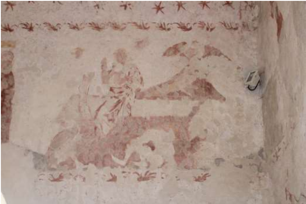
Obrázek 71. Kristovo vzkříšení. Jižní stěna presbytáře.