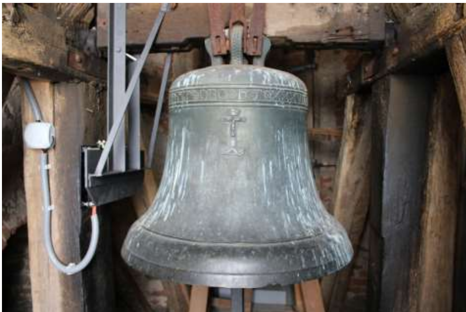
Obrázek 91. Větší zvon kostela.