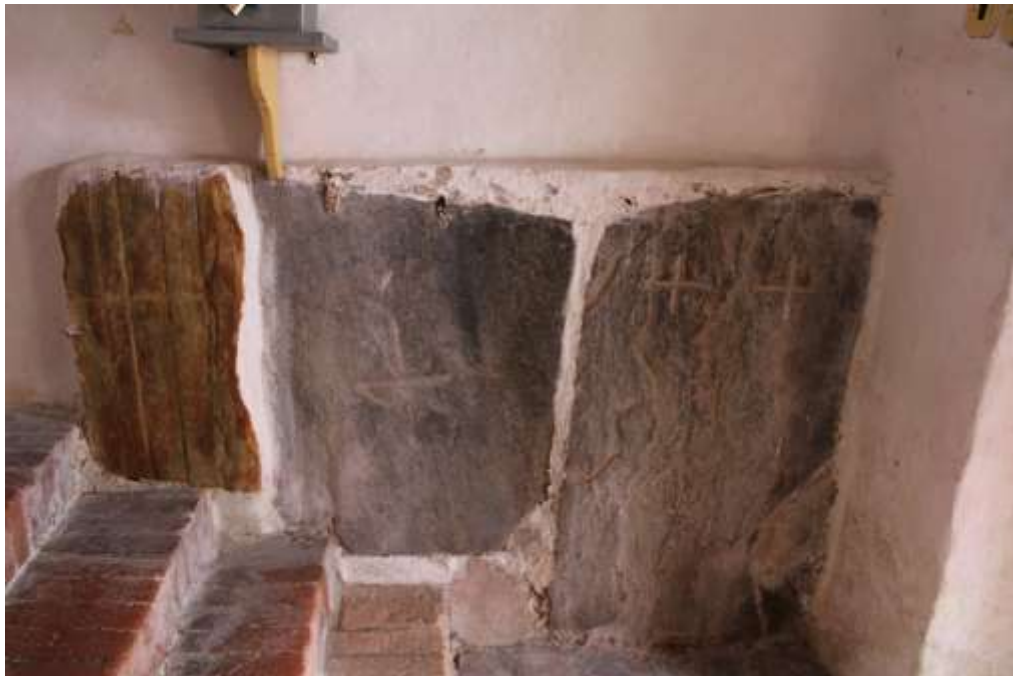
Obrázek 42. Náhrobní kameny v podvěží kostela.