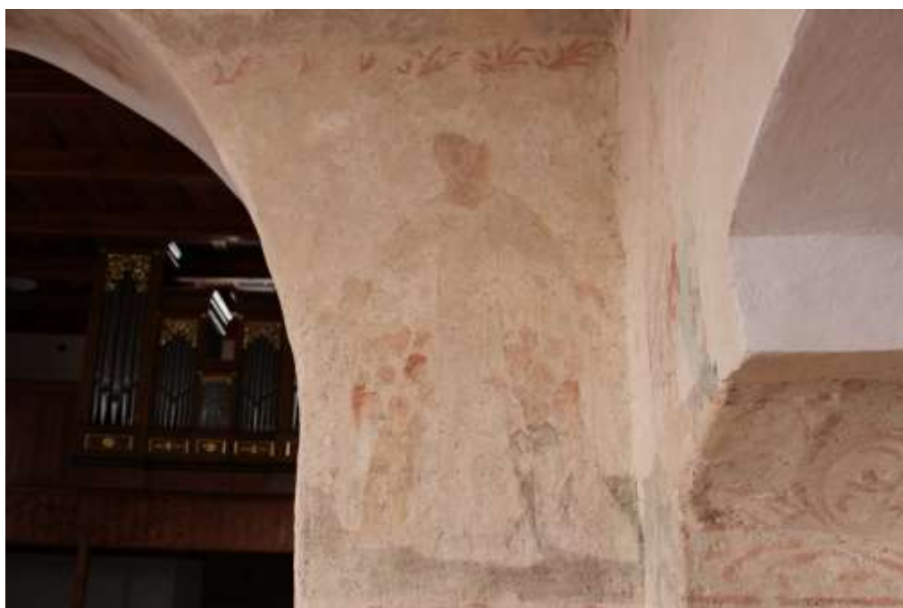
Obrázek 76. Panna Maria Ochránkyně. Vítězný oblouk.