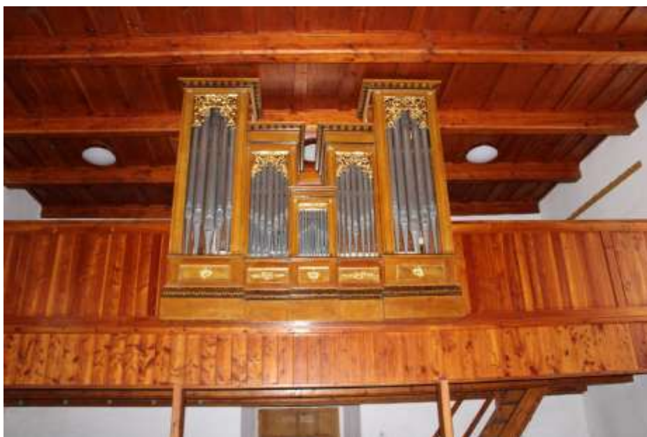
Obrázek 29. Kruchtová konstrukce.