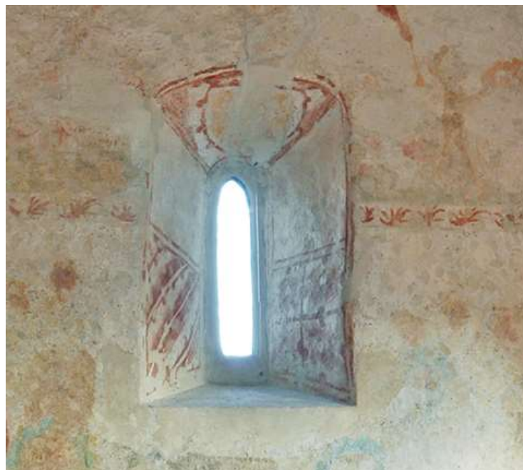
Obrázek 36. Detail okna v ose východní stěny.