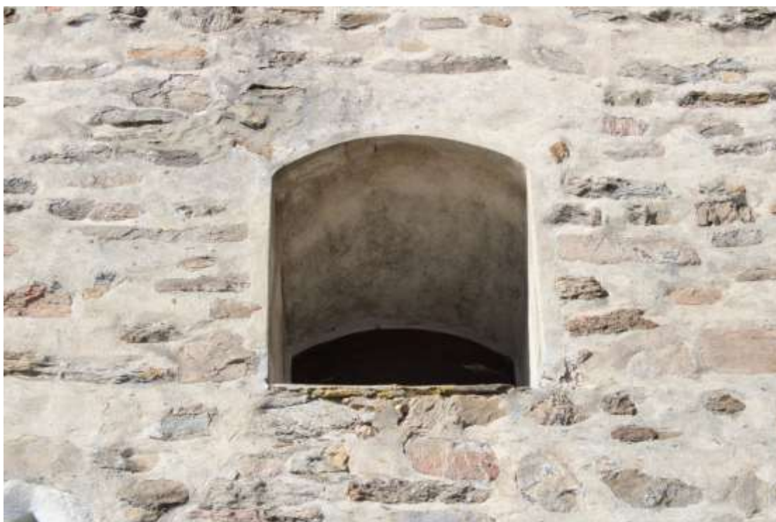
Obrázek 24. Detail okna ve druhém patře věže jižního průčelí.