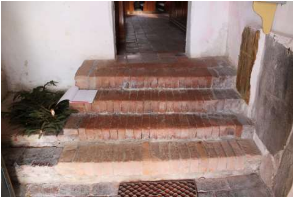
Obrázek 41. Schody vedoucí z podvěží do lodi kostela.