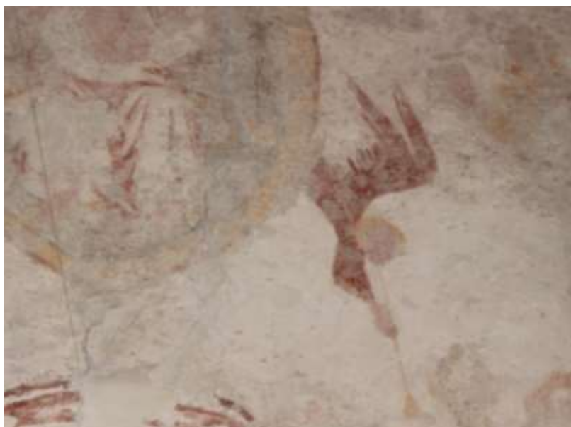
Obrázek 57. Východní stěna presbytáře. |Nejvíce dochovaný a zároveň svým pojetím nejzajímavěji vyobrazený Anděl.