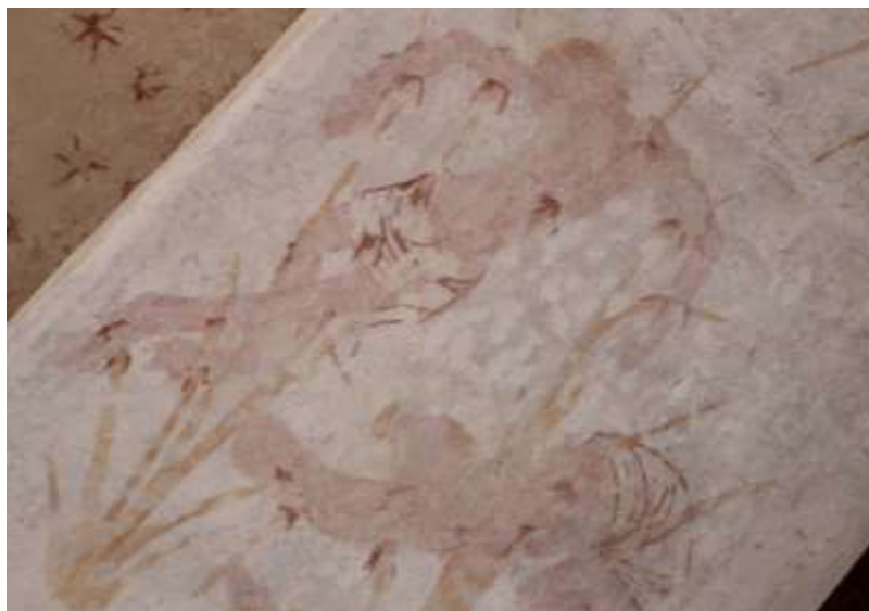
Obrázek 79. Vyobrazení jednoho z umučených rytířů. Tímto způsobem evokuje symbolické ukřižování Ježíše Krista. Foto: autor