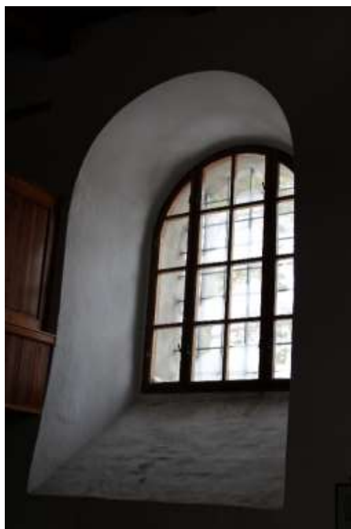
Obrázek 30. Okno v ose severní stěny.