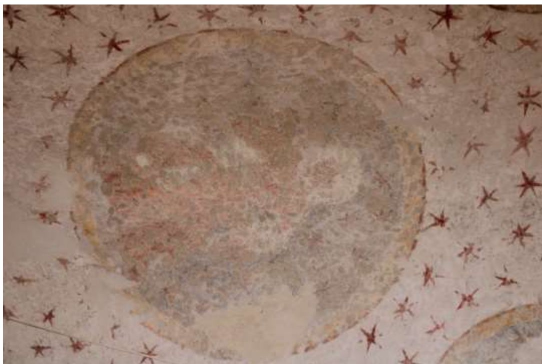
Obrázek 81. Ježíš v majestátu. Klenba presbytáře.