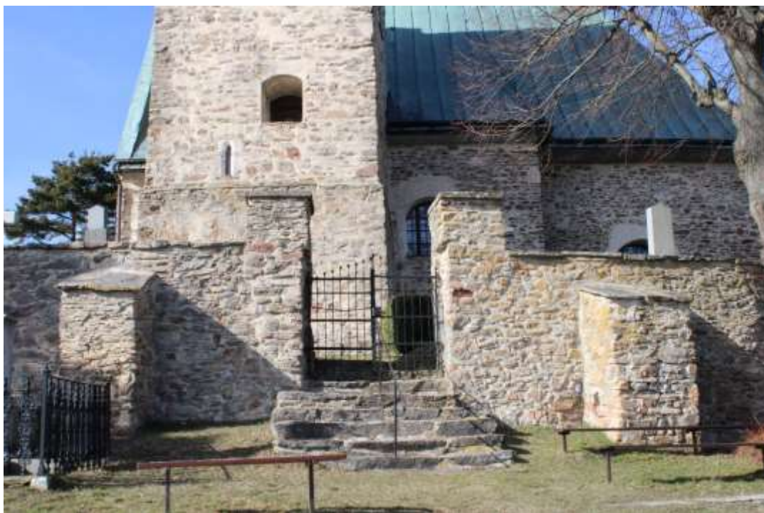
Obrázek 9. Jižní vstup na hřbitov.