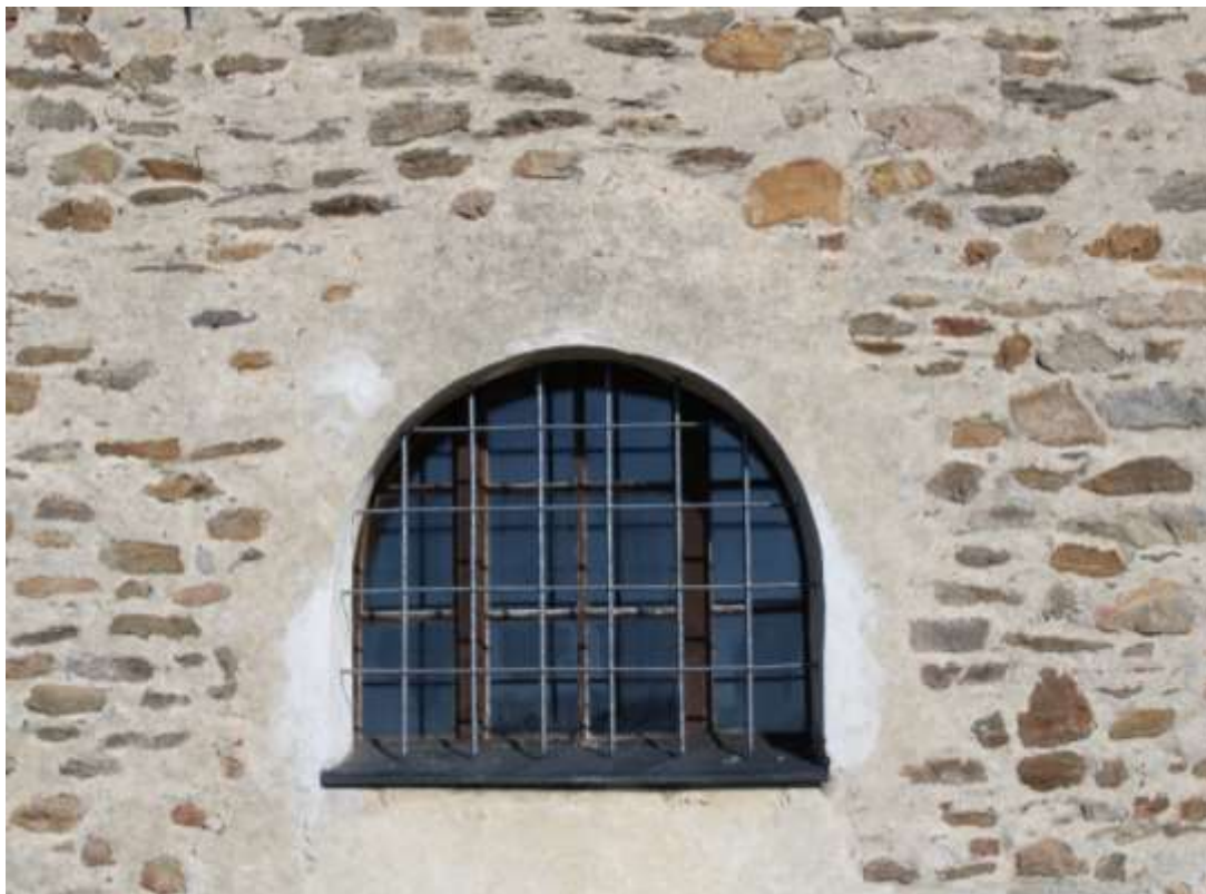
Obrázek 13. Detail okna západního průčelí.