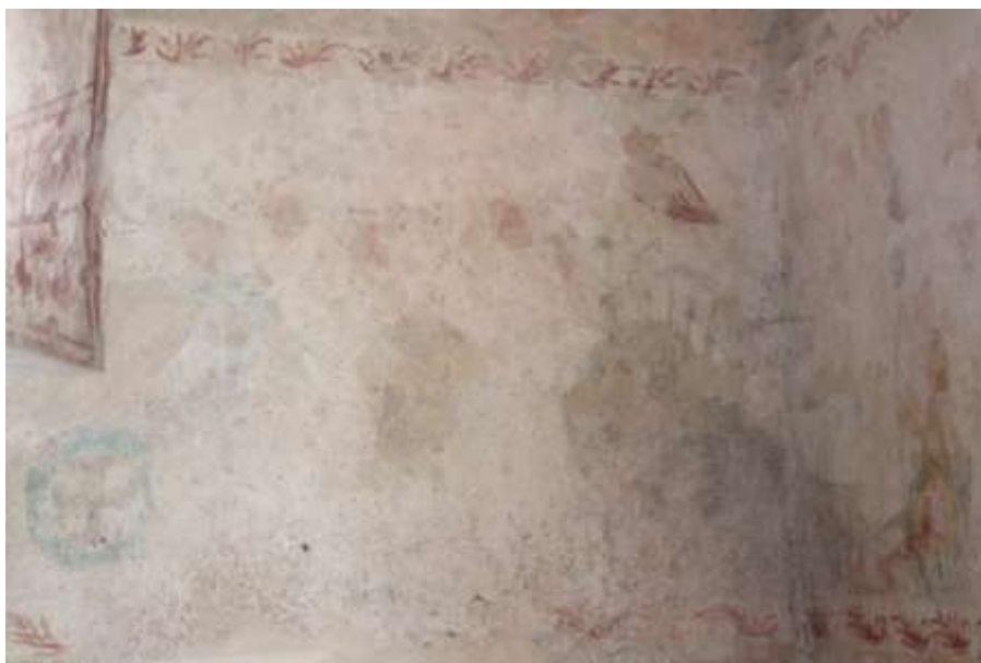
Obrázek 61. Ježíš Kristus na Olivetské hoře. Východní stěna presbytáře.