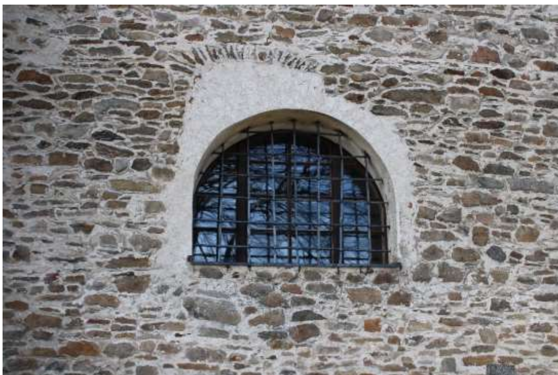
Obrázek 18. Detail okno presbytáře jižního průčelí.