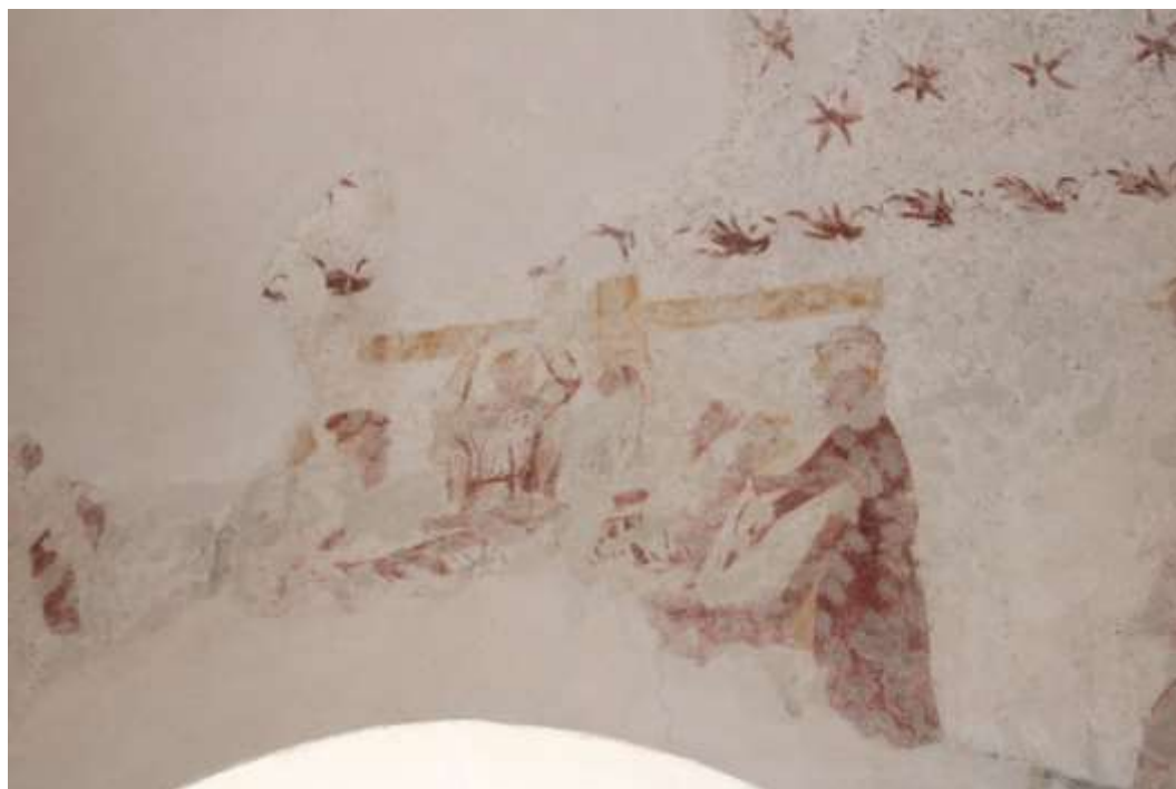
Obrázek 70. Ukládání do hrobu. Jižní stěna presbytáře.