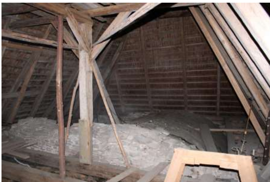
Obrázek 51. Konstrukce krovu kostela.