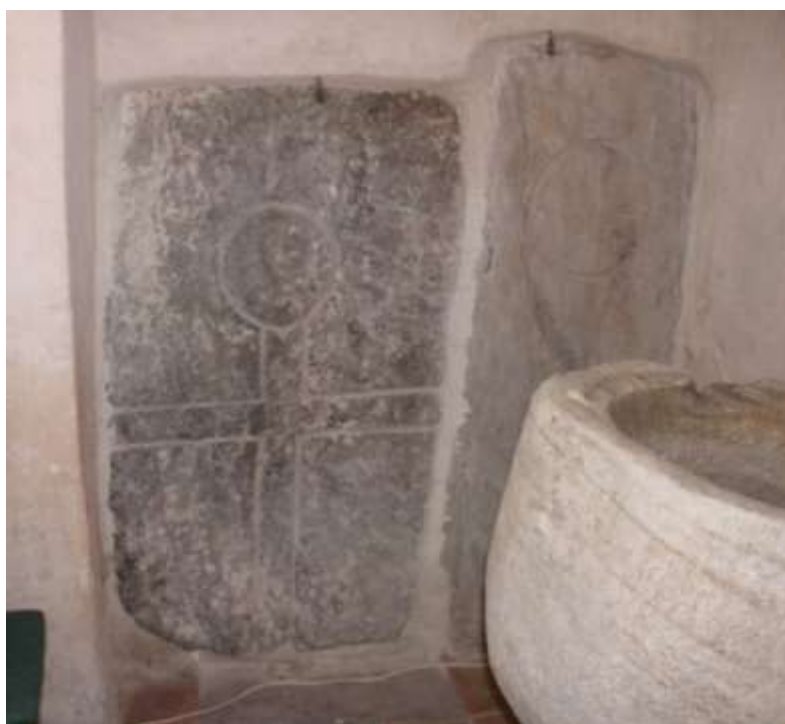
Obrázek 38. Náhrobní kameny v jižní stěně presbytáře.