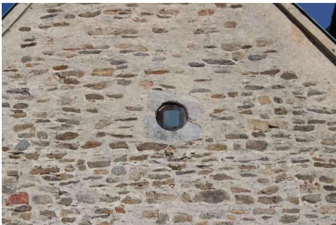
Obrázek 14. Detail okna západního průčelí ve štítu .