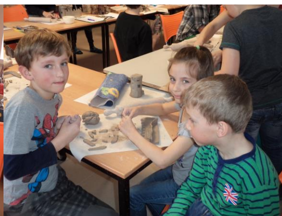
Obrázek 9 - Tvorba 2