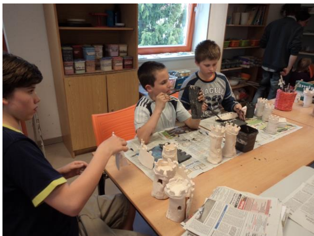
Obrázek 14 - Glazování 5