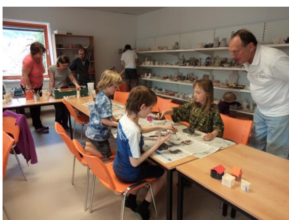
Obrázek 12 - Glazování 3