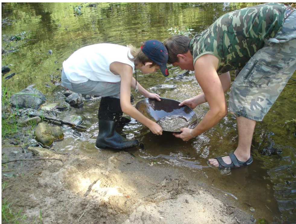
Obrázek 6 - Rýžování „zlata“