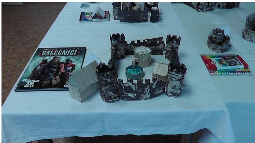
Obrázek 18 - Výtvary dětí s cenami