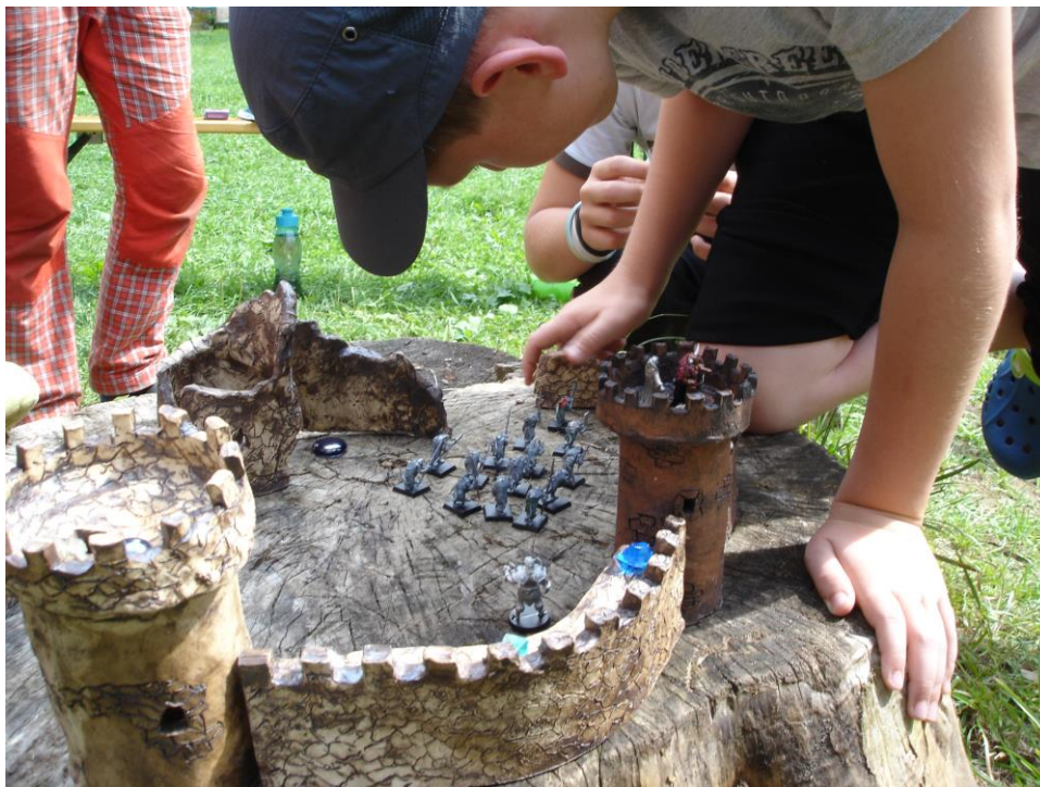
Obrázek 1 - Dračí doupě s keramickým hradem motivuje děti k tvorbě vlastního hradu