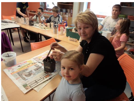
Obrázek 10 - Glazování 1