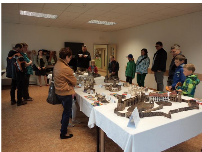
Obrázek 22 - Prohlížení dětských prací