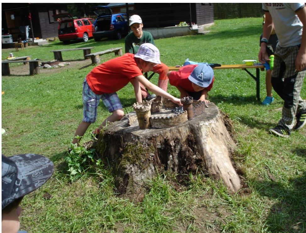
Obrázek 2 - Obr. č. 2 - Hra Dračí doupě s keramickým hradem