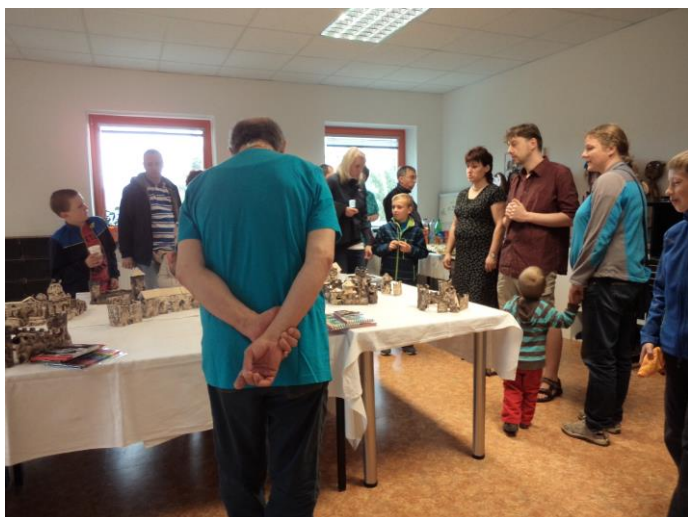
Obrázek 20 - Přivítání