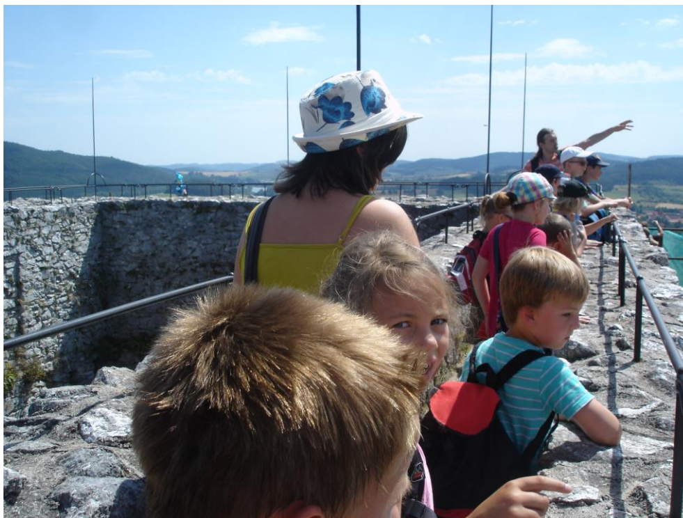
Obrázek 5 - Vyhlídka z rabského donjonu