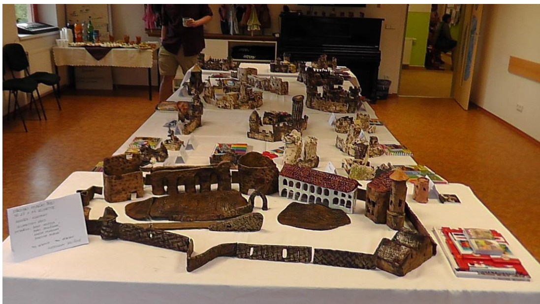
Obrázek 16 - Hrad a zámek Velhartice