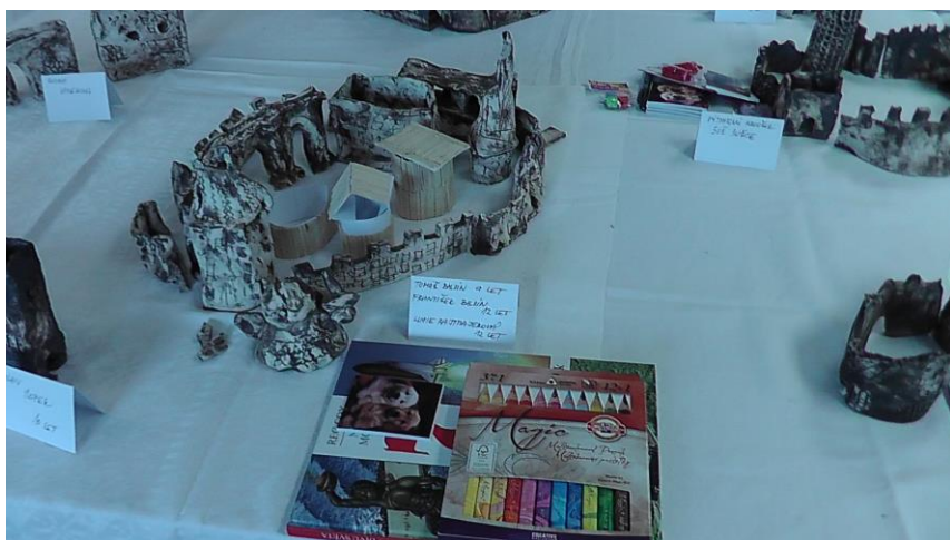
Obrázek 19 - Výtvary dětí plus ceny