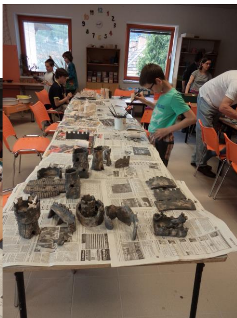
Obrázek 15 - Glazování 6