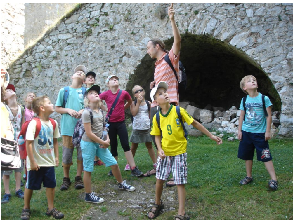
Obrázek 4 - Prohlídka hradu