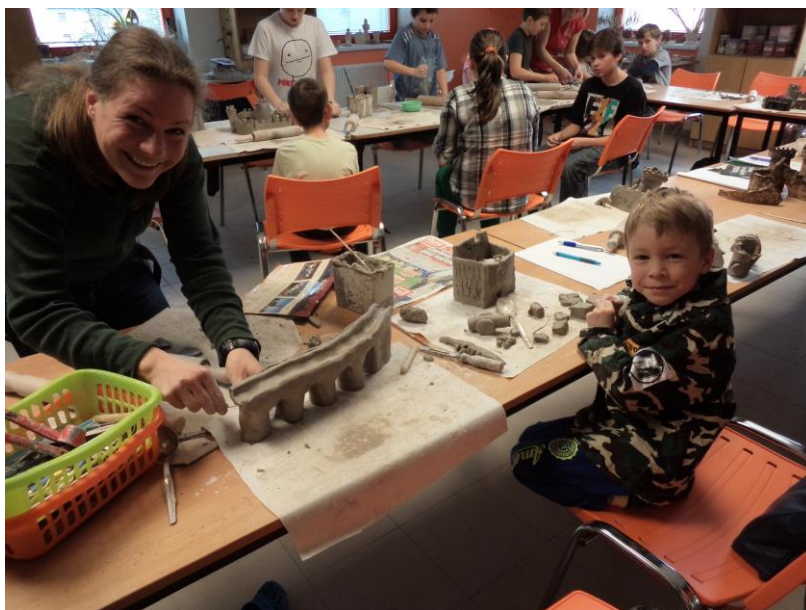
Obrázek 7 - Tvorba 1 (velhartický most)