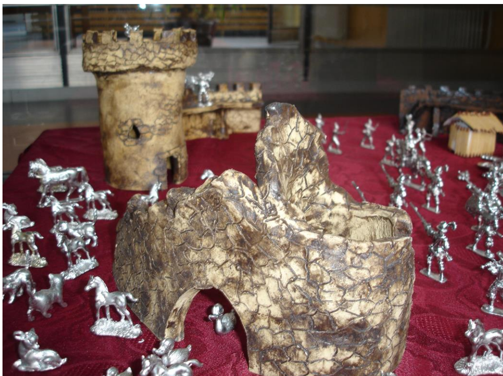
Obrázek 3 – Ukázkový keramický hrad