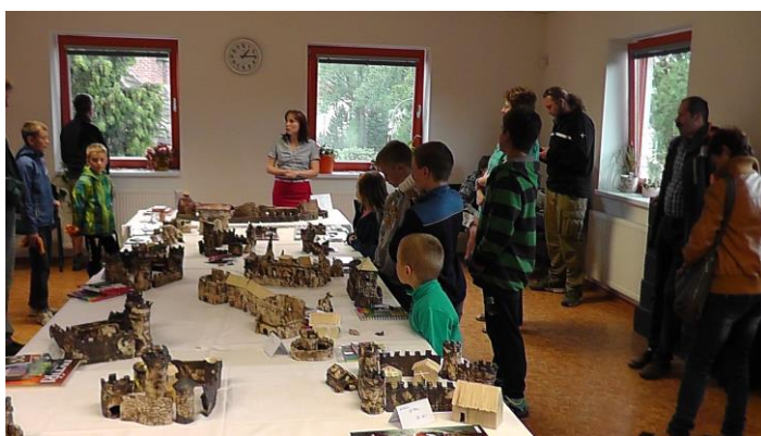
Obrázek 21 - Výklad o hradech