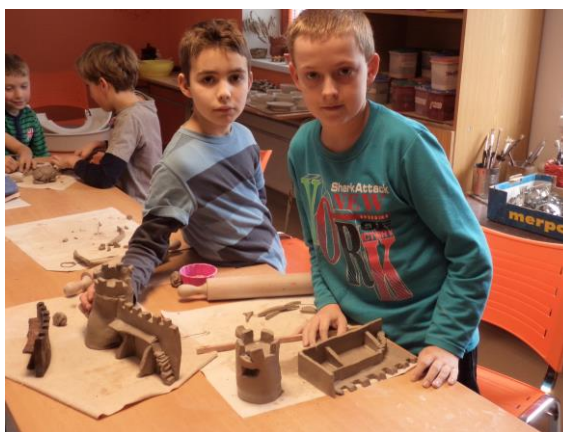
Obrázek 8 - Tvorba 3