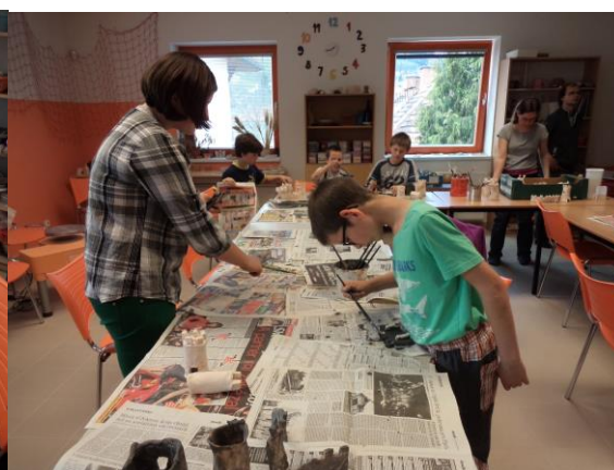
Obrázek 11 - Glazování 2