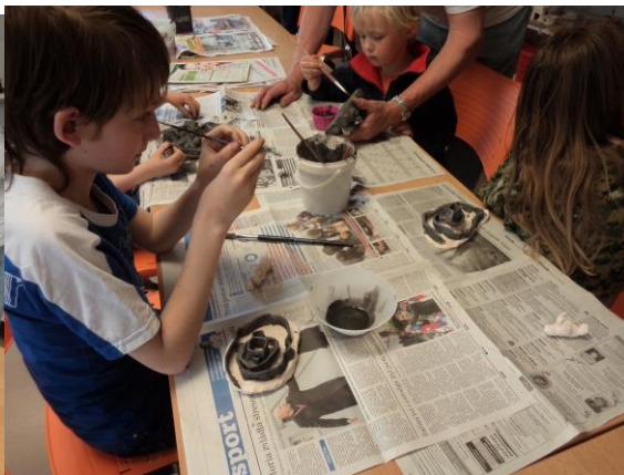
Obrázek 13 - Glazování 4