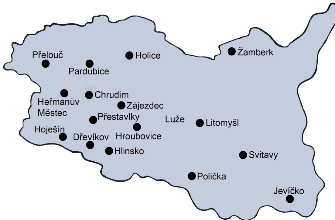
Obr. 14 Mapa židovských památek v Pardubickém kraji