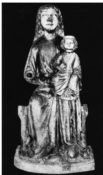
Tuřanská madona s dítětem, 40.-50. léta XIII. stol.