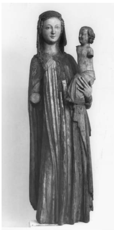
Madona z Rouchovan, 1. třetina XIV. stol.