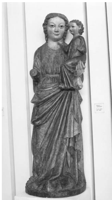
Madona z Rudolfova, poslední čtvrtina XIII. stol.