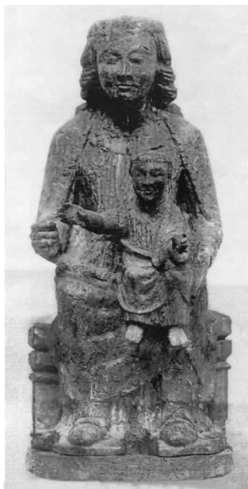
Madona z Lomnice u Tišnova, kolem r. 1220-1250