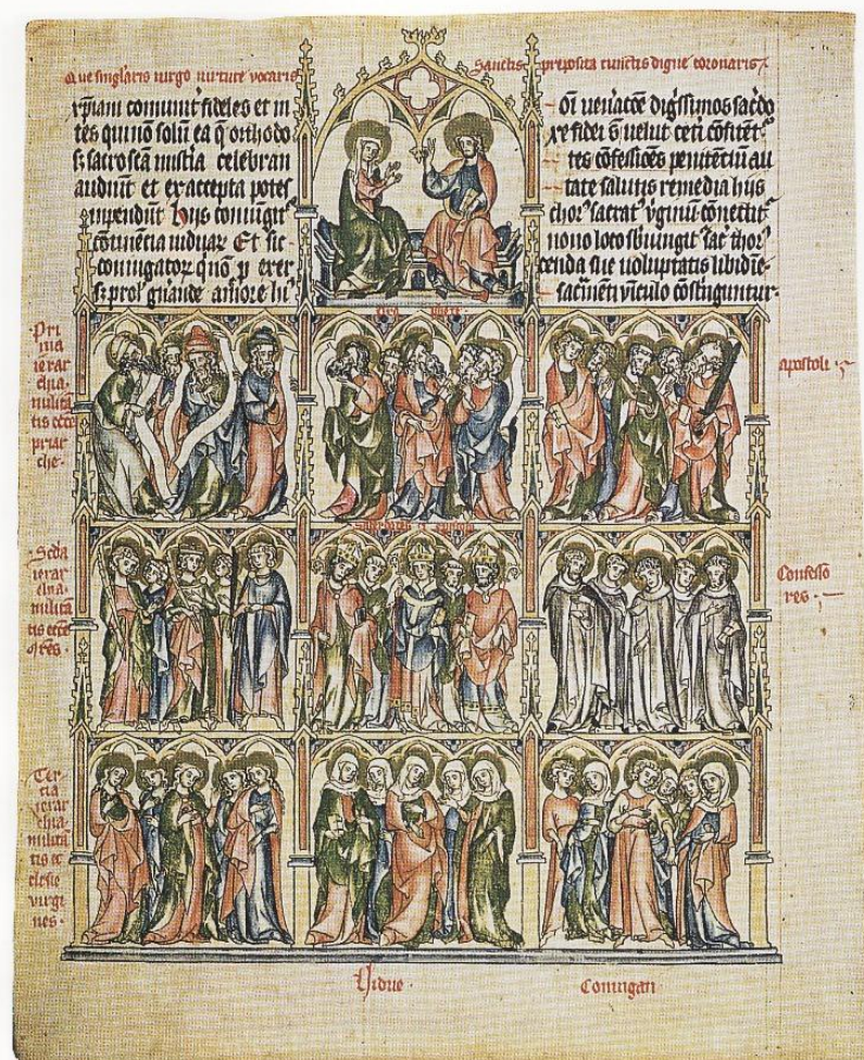
Hierarchie devíti pozemských stavů z traktátu O nebeských příbytcích (list č. 22)