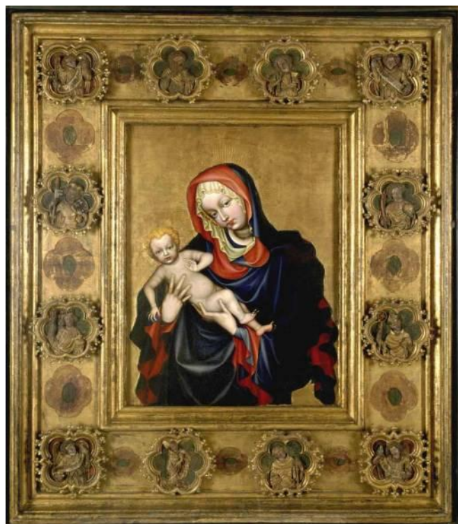
Madona svatovítská, kolem r. 1400.