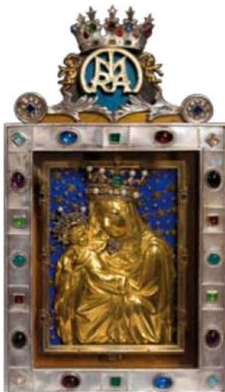
Palladium země české, konec XIV. stol.