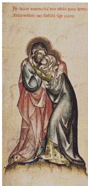
Illuminace k traktátu O statečném rytíři: Kristus s Matkou v objetí (list č. 16)