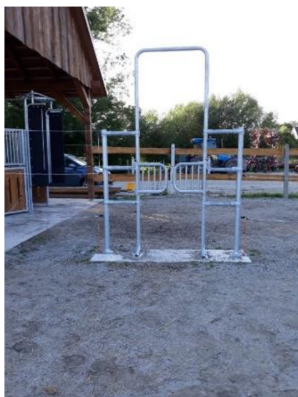
Obrázek č. 3 průchozí branky

Další podstatnou částí aktivního ustájení jsou branky (obr. 3), které mají význam v odchodu koně z místa, když nechce navštívit krmný automat, anebo když na místě dojde ke konfliktu jiných koní. Kůň může bezpečně opustit zónu neklidu.