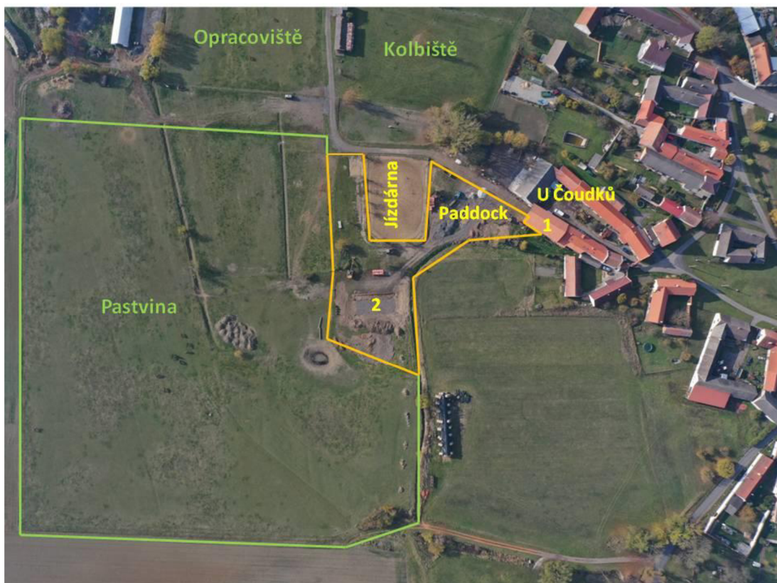
Obrázek č. 1 Znárodnění areálu U Čoudků

Na každého koně připadá 100 m 2 zpevněné plochy v paddocku a 16 m 2 v odpočívárně. K dispozici mají také pastvinu o rozloze 5 ha. Koně nebyli využiti ke sportu ani k jezdeckým účelům, které by mohli zkreslovat výsledky.