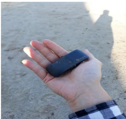
Obrázek č. 4 zařízení Tractive GPS Tracking

Bylo využito zařízení Tractive GPS Tracking (obrázek 4). Zařízení je voděodolné a má integrovanou SIM kartu. Jeho dosah je neomezený a poskytuje lokalizační data ze všech míst, kam kůň přišel. Nabízí více informací o úrovních aktivity a pohybu. Díky těmto datům může informovat o zdraví a úrovních kondice koně.