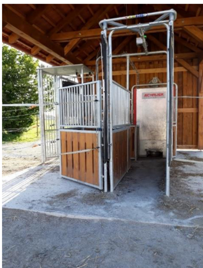
Obrázek č. 2 krmný automat na jádro

Další podstatnou částí aktivního ustájení jsou branky (obr. 3), které mají význam v odchodu koně z místa, když nechce navštívit krmný automat, anebo když na místě dojde ke konfliktu jiných koní. Kůň může bezpečně opustit zónu neklidu.