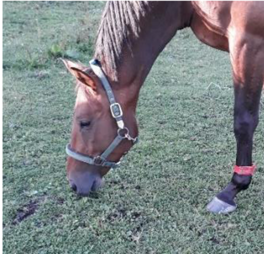
Obrázek č. 5 označení a umístění zařízení na koni

Sledování probíhalo na v létě, na podzim a v zimě. Koně měli možnost volného pohybu přes krmný automat a branky po celém prostoru aktivního ustájení.