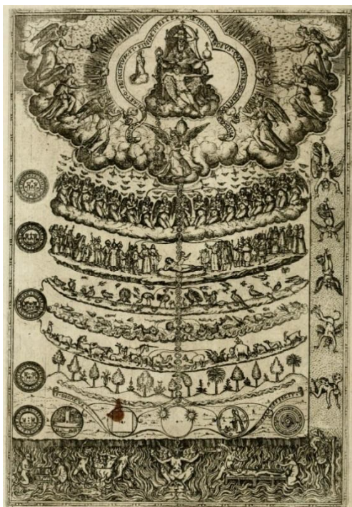
Obrázek 1: Valades (1579), Velký řetězec bytí, [LAT: Scala naturae ]

Platónský vliv se pak významně projevil v chápání pojmu hodnoty. V křesťanské teologické nauce byla hodnota jsoucen a jejich bytí hierarchizována tak, jak uvádí Plotinos (který je sám považován za novoplatonika, a v jeho pracích je zřejmá inspirace Platonem). Plotinos přichází s pojmem emanace , kterým vysvětluje, jak vzniká svět a jeho bytí. Jako základ všeho Plotinos přebírá Platonův koncept Dobra (jako nejvyššího a základního principu ze kterého vše pochází), které on sám pojmenovává Jedno , ze které postupně vzniká (emanuje) vše ostatní bytí. „Jedno je dokonalé, protože nic nehledá, nic nevlastní a nic nepotřebuje, a protože je dokonalé, přetéká, a tak jeho přebytek vytváří Druhé. Kdykoli něco dosáhne svého vlastní dokonalosti, vidíme, že nemůže vydržet zůstat sama v sobě, ale vytváří a produkuje nějakou jinou věc.“ (Glanvill 1682).