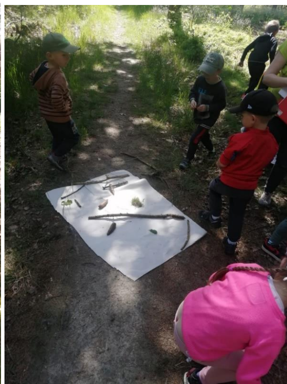
Obr. 35 (zdroj vlastní, pracovní prostor)