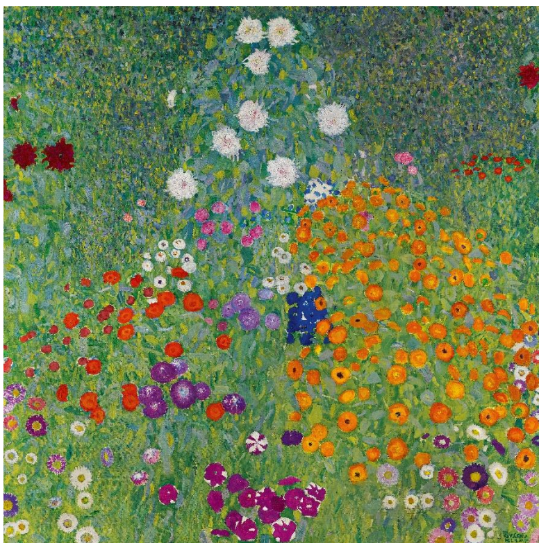
obr. 31 (zdroj web, Gustav Klimt – „Květinová zahrada“)