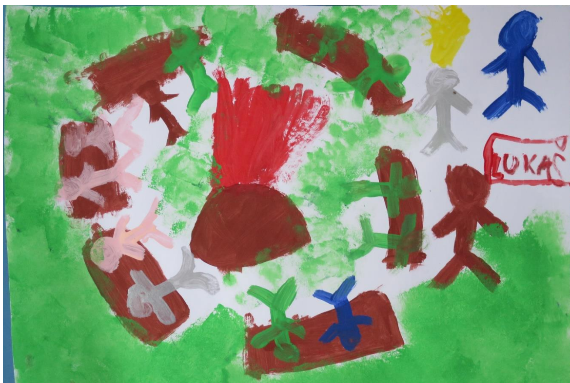
Obr. 4 („Co mě baví“ chlapec 6 let)

Vizuální realismus přichází na konci předškolního věku. Dítě přestává užívat transparenční, kresba přesněji zachycuje objekt, polohy v prostoru a je propracovanější. Řídí se skutečností. (Plevová, Pugnerová, 2022) Představivost je ovlivněna rozumem, a je objektivnější, a dochází k záznamu skutečnosti. (Uždil, Hron, 1961) V tomto období lze kolem 7 roku dítěte pozorovat důležitý vývojový skok, který se projevuje objevením profilu. (Davido, 2001)