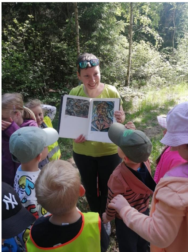
Obr. 40

jevila se mi jako přínosná. Především proto, že děti vyjadřovaly pocity, které z obrazů měly. Před poslední závěrečnou aktivitou, jsem se dětí zeptala, který z představených malířů se jim líbil úplně nejvíc. Jestli si nějaký obraz pamatují a proč. Nejvíce se jim líbil Antonín Slavíček a Gustav Klimt, důvodem byla barevnost a příjemný pocit z obrazů.