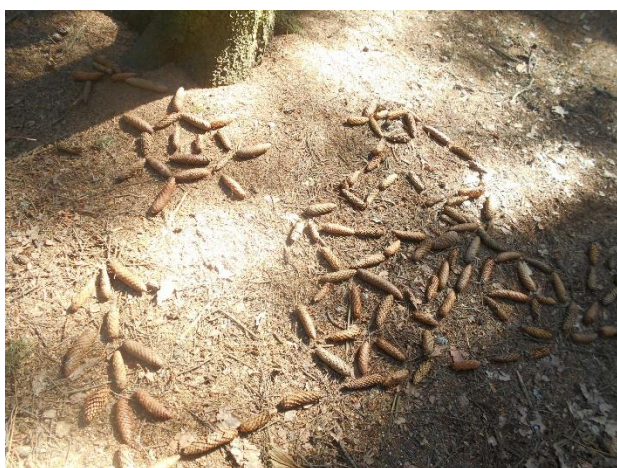
Obr. 11 (zdroj vlastní, „Cyklovýlet lesem“, děti 3-6)