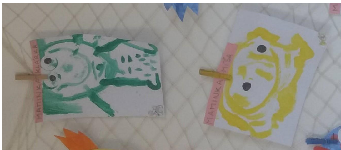
Obr. 3 („Moje maminka“, děti 2-3 roky)