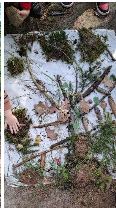
obr. 37