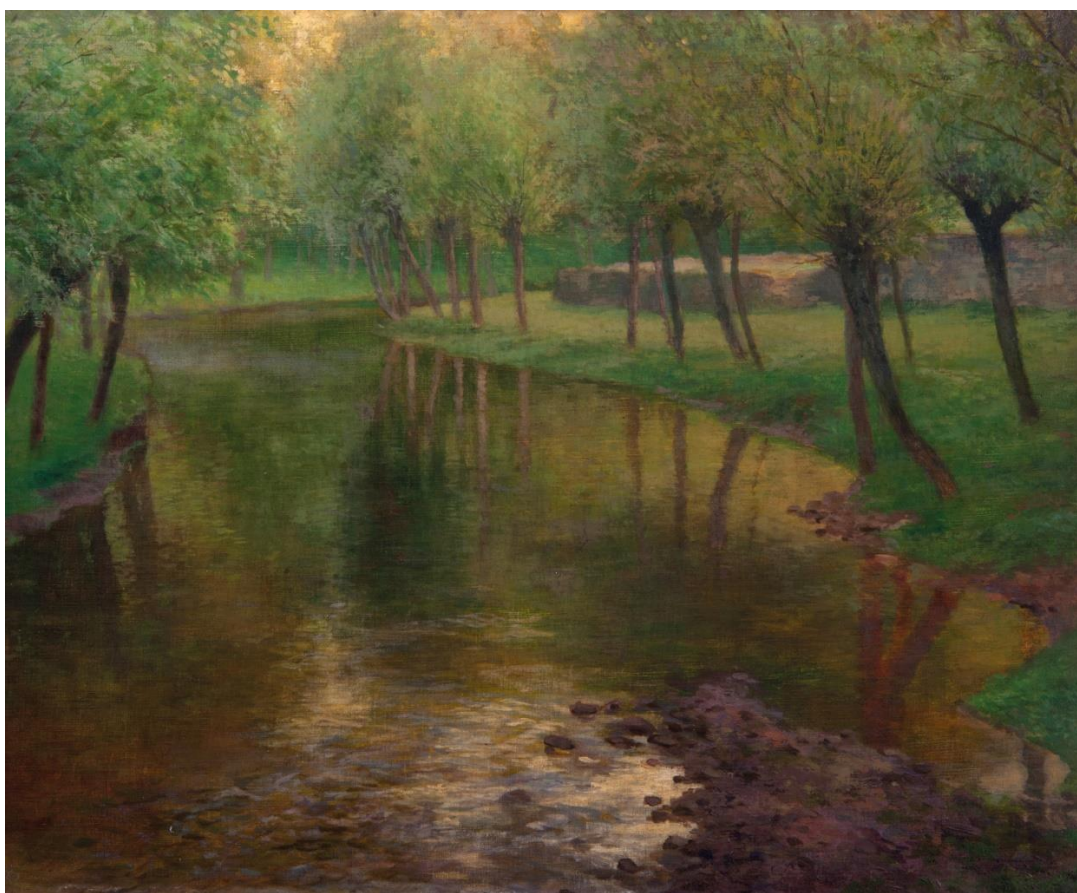
obr. 29 (, Antonín Slavíček – „Na Okořském potoce“)

V našem případě je v obálce obraz od Antonína Slavíčka – „Na Okořském potoce“, Gustava Klimta – „Květinová zahrada“ a Bohumila Kubišty – „Promenáda v Riegerových sadech“. Jsou nastříhané na díly, uloženy v obálce, společně s látkovou taškou, na kterou budou obraz překreslovat. Každému obrazu chybí jeden dílek. Děti mají za úkol poslední dílek dokreslit dle toho, co si myslí, že tam je. Poslední dílek je dětem ukázán na závěr.