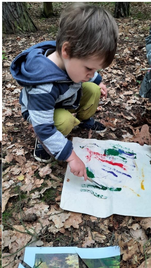
obr. 60, 61 (vlastní zdroj, malování pláten)