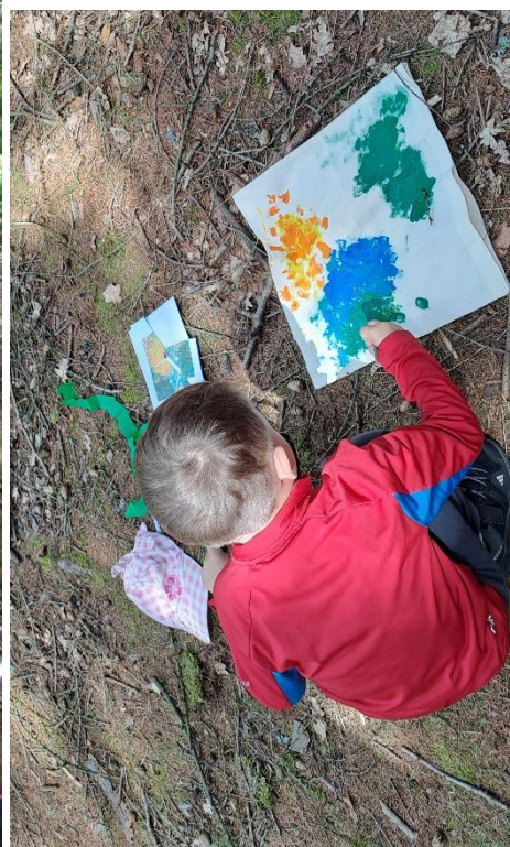
obr. 43, 44, 45, 46, 47