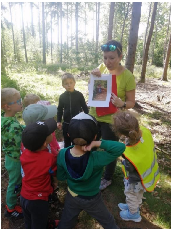
obr. 34 (seznámení s obrazem)