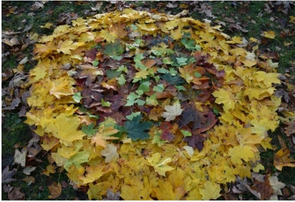
obr. 19