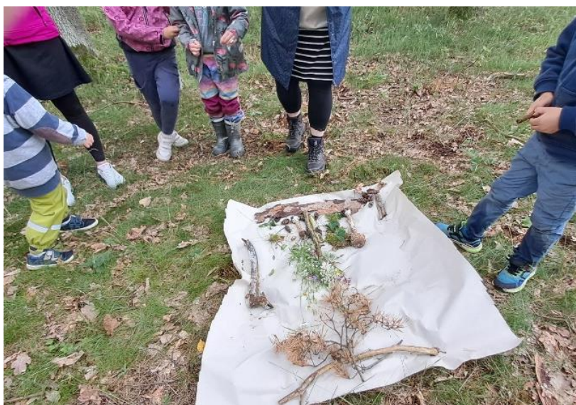
obr 51

Vzhledem k malému počtu měli práci rychle hotovou a v časovém limitu. Děti zhodnotily, že jsou se svou prací spokojeni, a že je aktivita bavila.