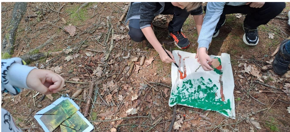
Obr 48