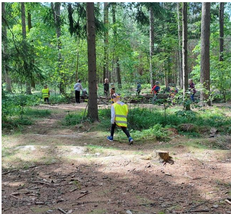
obr. 36 (vlastní zdroj, hledání barev),