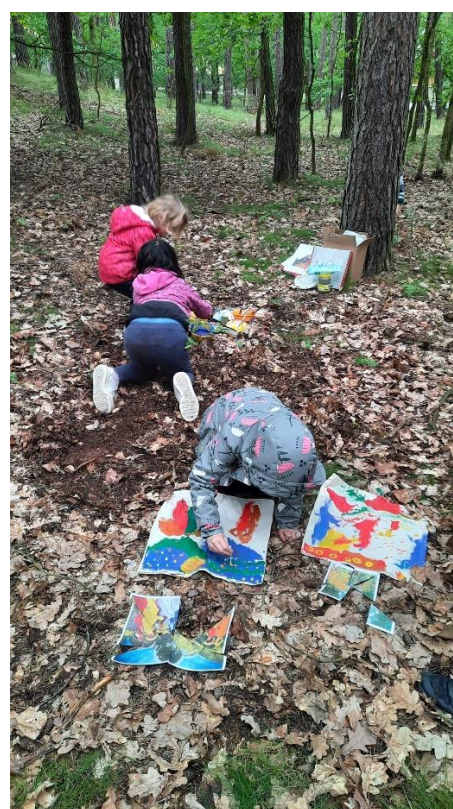
obr. 57, 58, 59 (vlastní zdroj, malování pláten)