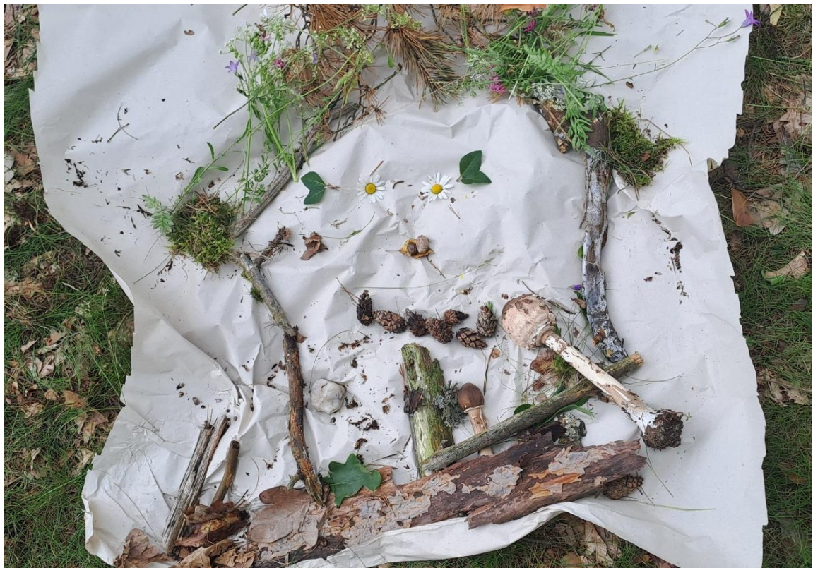
Obr. 54 (zdroj vlastní, „Paní s mikrofonem“)

Zhodnotila jsem, že jsou opravdu sehraný tým, a aktivity je baví. Při závěrečném rozhovoru s paní učitelkou jsem se dozvěděla, že tyto děti spolu běžně nekomunikují ani nepracují (viz rozhovor s učitelkami).