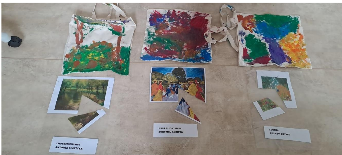
Obr. 49 (závěrečná fotka před odevzdáním dětem)