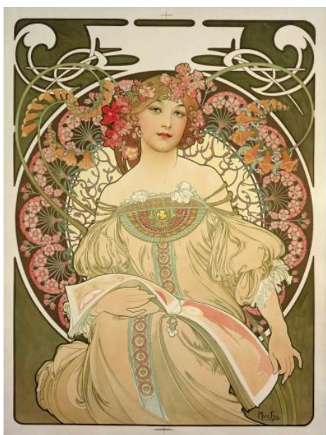
obr. 26 („Scenia“)

Pomůcky: obrázky děl Alfonse Mucha (v našem případě „Scenie“), Maxe Švabinského (v našem případě „Slynutí duší“) a Gustava Klimta (v našem případě „Polibek“), původní práce