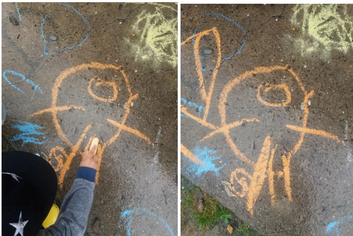
Obr.1 a 2 (vlastní zdroj, chlapec 2 roky sedm měsíců, „teta Kačka“)

Zpočátku je kresba postavy „hlavonožce“ jen kolečko, které znázorňuje hlavu a trup současně, doplněné o dvě čárky jako ruce a další dvě jako nohy. Později začínají přibývat detaily. V znázornění se objevují oči, ústa či pupík v podobě koleček či teček. Tyto detaily přibývají s mentální úrovní. Postavu dítě kreslí vždy zepředu a znázorňuje v ní sebe samotné, a to, jak se cítí. (Davido, 2001) Ranný výtvarný projev kresby je pro děti způsob vyprávění. Je pro ně důležité, co kresba znamená, než jak vypadá. (Babyrádová,2014)