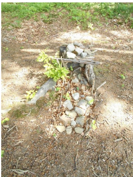
obr. 17 (zdroj vlastní, „Pro berušku“)