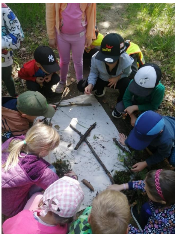
obr. 38