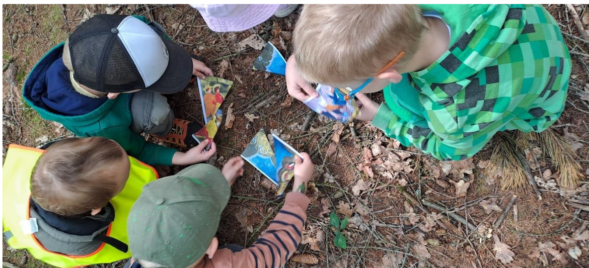
obr. 41, 42 (vlastní zdroj, skládání)

Zhodnocení celého programu: Více času na jednotlivé aktivity. 15 minut stačilo jen na seznámení s expresionismem. Závěr programu měl největší úspěch, protože malování v lese bylo pro děti novinkou, kterou ještě nezažily. Všichni si zapamatovali, čím obraz reprodukovali.