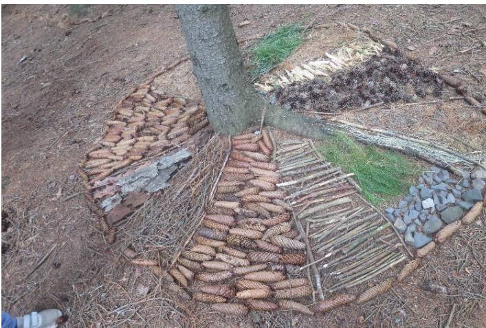
obr. 23