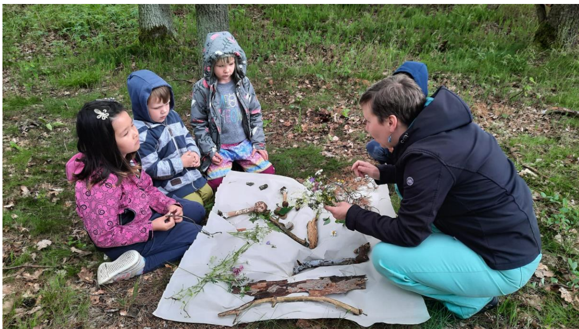
obr. 52 (plnění úkolu- máme všechny barvy?)