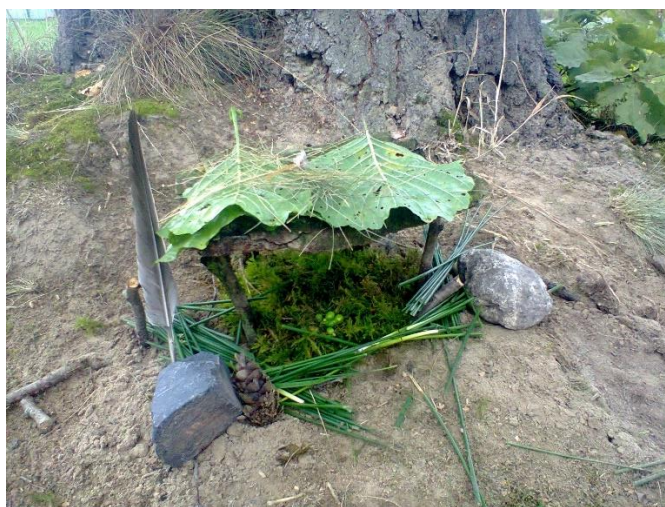
obr. 18 (zdroj vlastní, „Letní sídlo“)