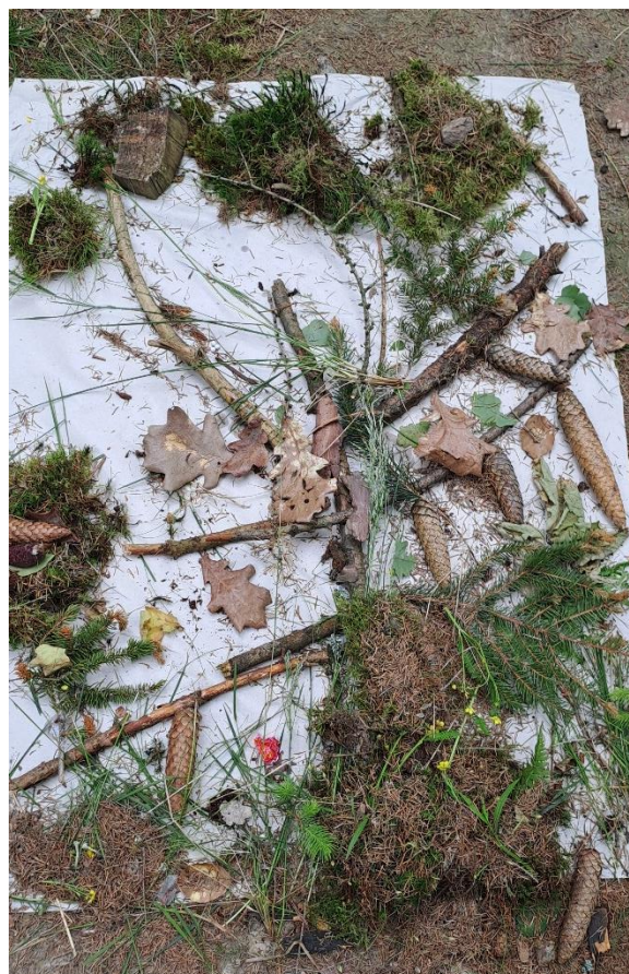
obr. 39 (výsledek „Strom s nebesy“)