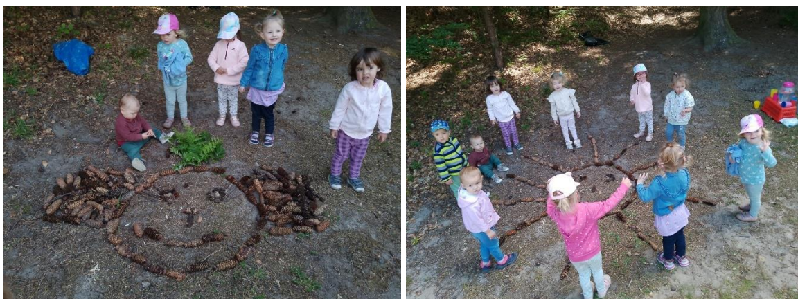
Obr. 7, 8 („Rákosníček“, „Slunce pro veselý den“, děti 2–3 roky)