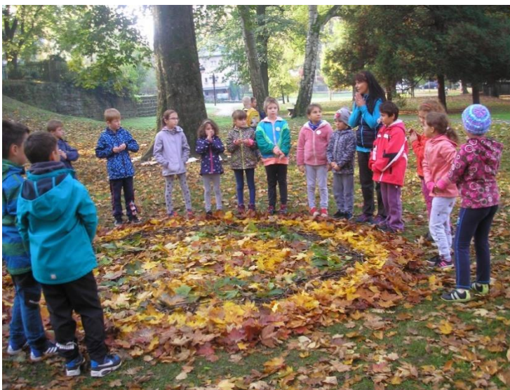
obr. 21