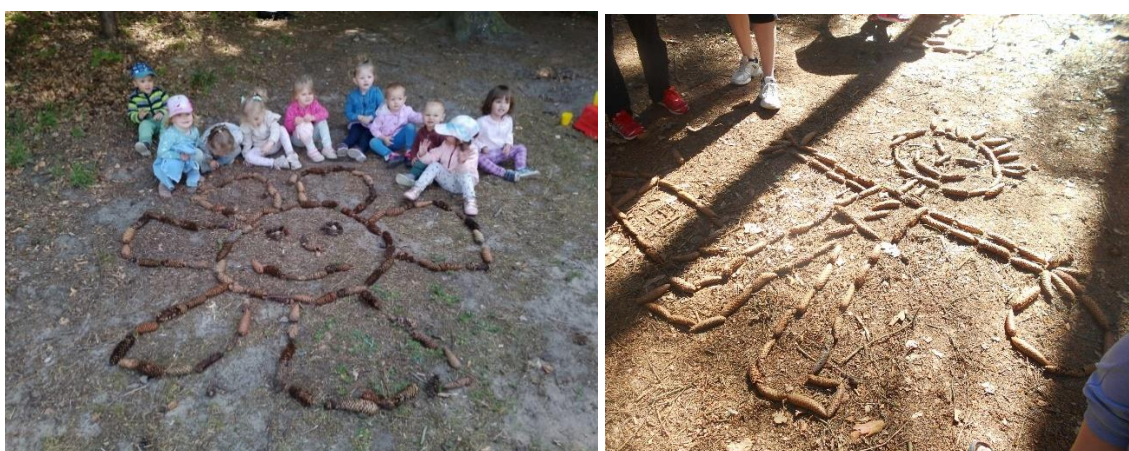
obr. 9 (zdroj vlastní, „Kvetení“, děti 2–3 roky), obr. 10 (zdroj vlastní, „Lesní kluk“, děti 3-6)