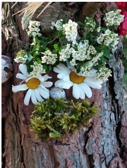
obr. 22

Necháme děti diskutovat o různých nápadech na dárky nebo ozdoby pro stromy. Vybereme ten, který měl u dětí největší podporu. Potom je necháme nasbírat materiál a průběžně pracujeme na vymyšleném návrhu. Na závěr utvoříme kroužek kolem ozdobeného a obdarovaného stromu, a každé dítě vysloví svou gratulaci.