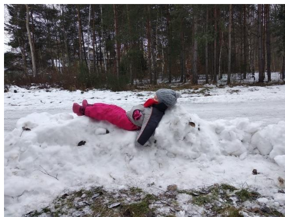
Obr. 25 (zdroj vlastní, „Obýván“)