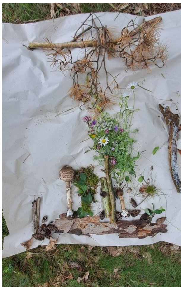
obr. 53 (vlastní zdroj, „Váza plná květin s lampou“)