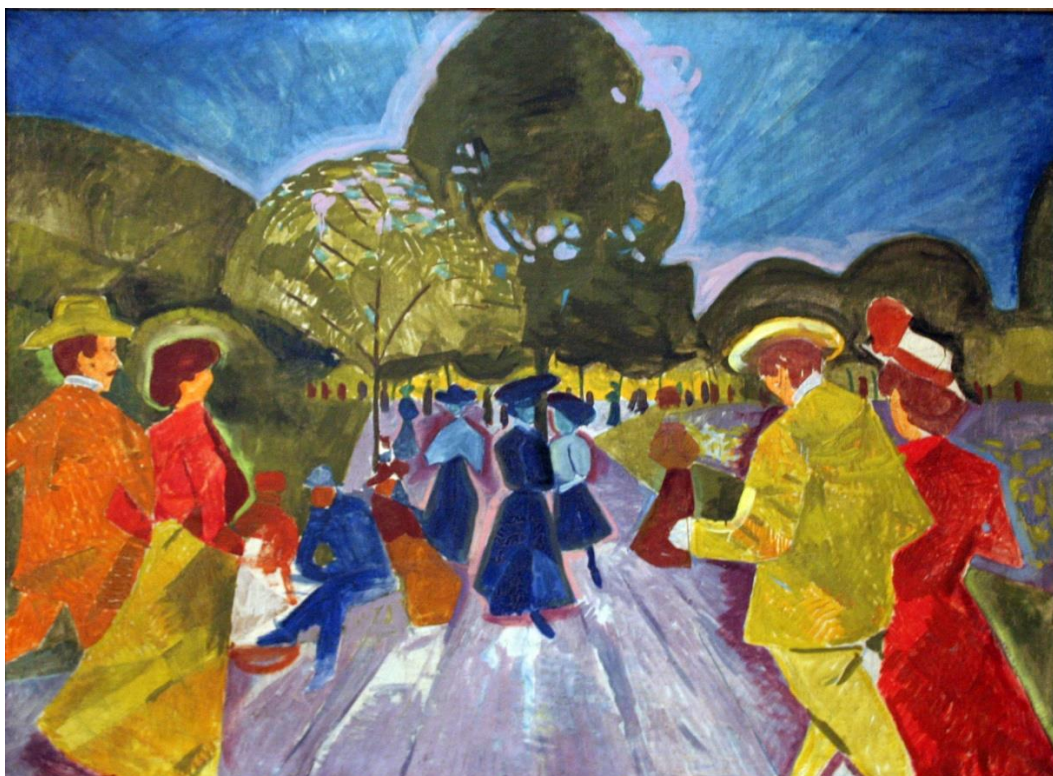
obr. 30(Bohumil Kubišta – „Promenáda v Riegerových sadech“)