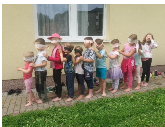
obr. 5 (zdroj vlastní, poznávání chutí poslepu), obr. 6 (zdroj vlastní, naboso poslepu)