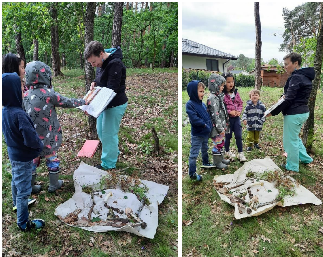
obr. 55, 56 (vlastní zdroj, práce s knihou)

Na tuto aktivitu jsme celých 15 minut nevyužili, jednalo se přibližně o cca 10 minut. I v tomto případě jsem zhodnotila, že to malým počtem skupiny.