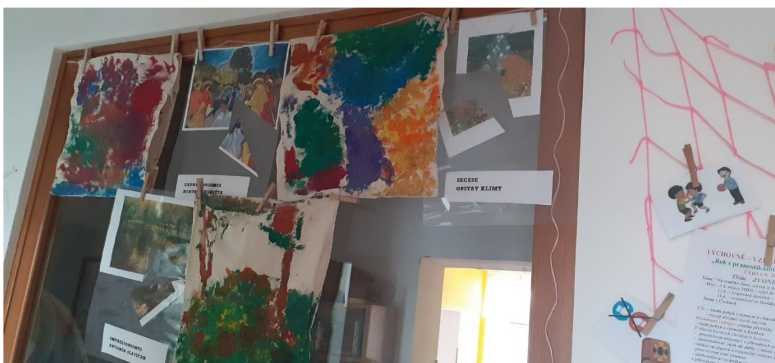
Obr. 50 (zdroj vlastní, u dětí ve třídě)