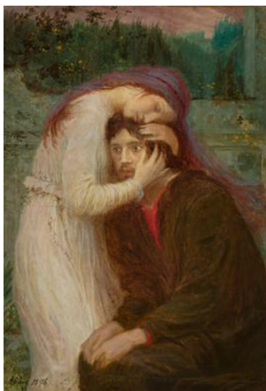
obr. 28 (zdroj web, „Slynutí duší“)