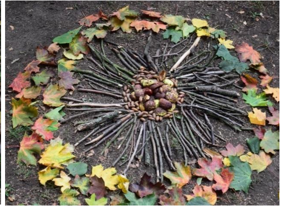
obr. 20