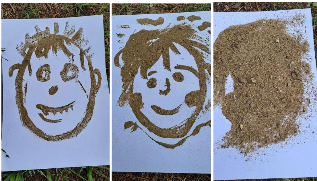
obr.14, 15, 16 („Miki“, „Anička“ „Tomík je neviditelný“)

Riziko: Některé děti jsou s prací rychle hotové. Některé se v předškolním věku „bojí špíny“.