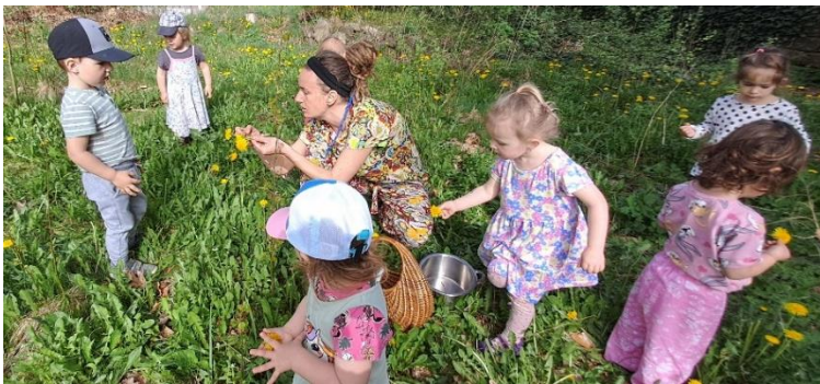
obr. 12 (zdroj vlastní)

Necháme děti sbírat, co si myslí, že se dá ochutnat, a zároveň dáváme pozor, aby si zatím nic do pusy nedávaly. V případě, že sbíráme na pampeliškový med, sbíráme do košíku, v případě, že sbíráme smrkčkové výhonky na sirup, můžeme je dávat rovnou do malých skleniček. Před použitím děti mohou vymýšlet „jarní hostinu“ – sedmikráskové toustové chleby apod. Dále jak by nasbírané věci použily, co se s nimi může vytvořit, aby jídlo bylo zajímavější a atraktivnější. A na závěr pod dozorem děti ochutnají všechny jedlé rostlinky.