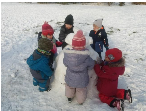
Obr. 24

Děti rozdělíme na dvě skupiny, aby každý mohl na stavbě pracovat. Musí se ve skupině domluvit, co je jejich záměr a jak má výtvar vypadat. Po uplynutí času společně obdivujeme hotová díla, povídáme si, co se nám na nápadu druhé skupiny líbí, k čemu bude sloužit, co na stavbě obdivujeme.