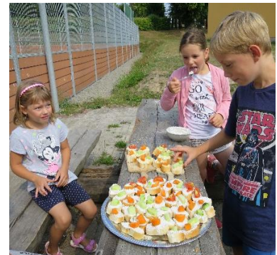
obr. 13 (zdroj vlastní - hostina)