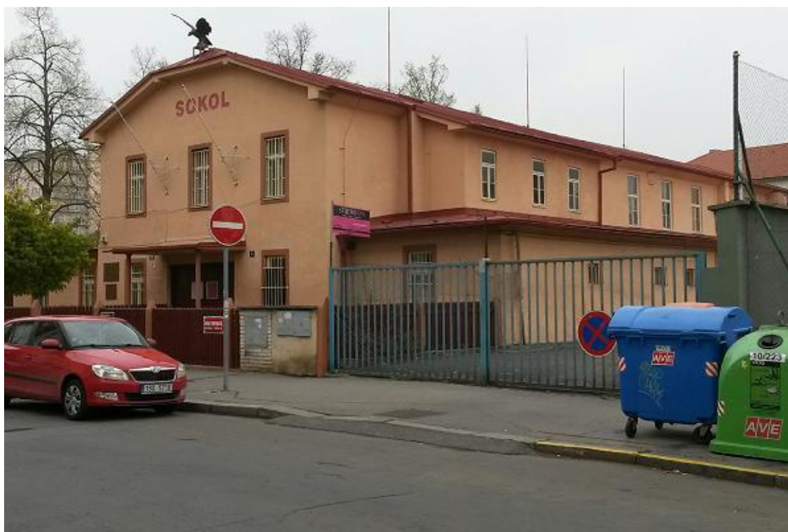
Obrázek 14. Sokolovna TJ Sokol - Strašnice.