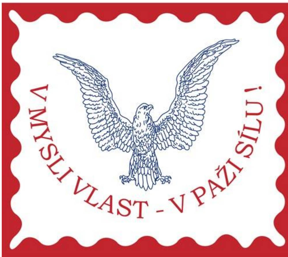
Obrázek 13. Prapor TJ Sokola - Strašnice.