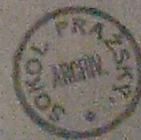
Obrázek 2. Zápis o zvolení prvního výboru Sokola Pražského (s chybným datem 30. března místo 16. února 1862). (Dr. Miroslav Tyrš 1832 - 1932, 1932)