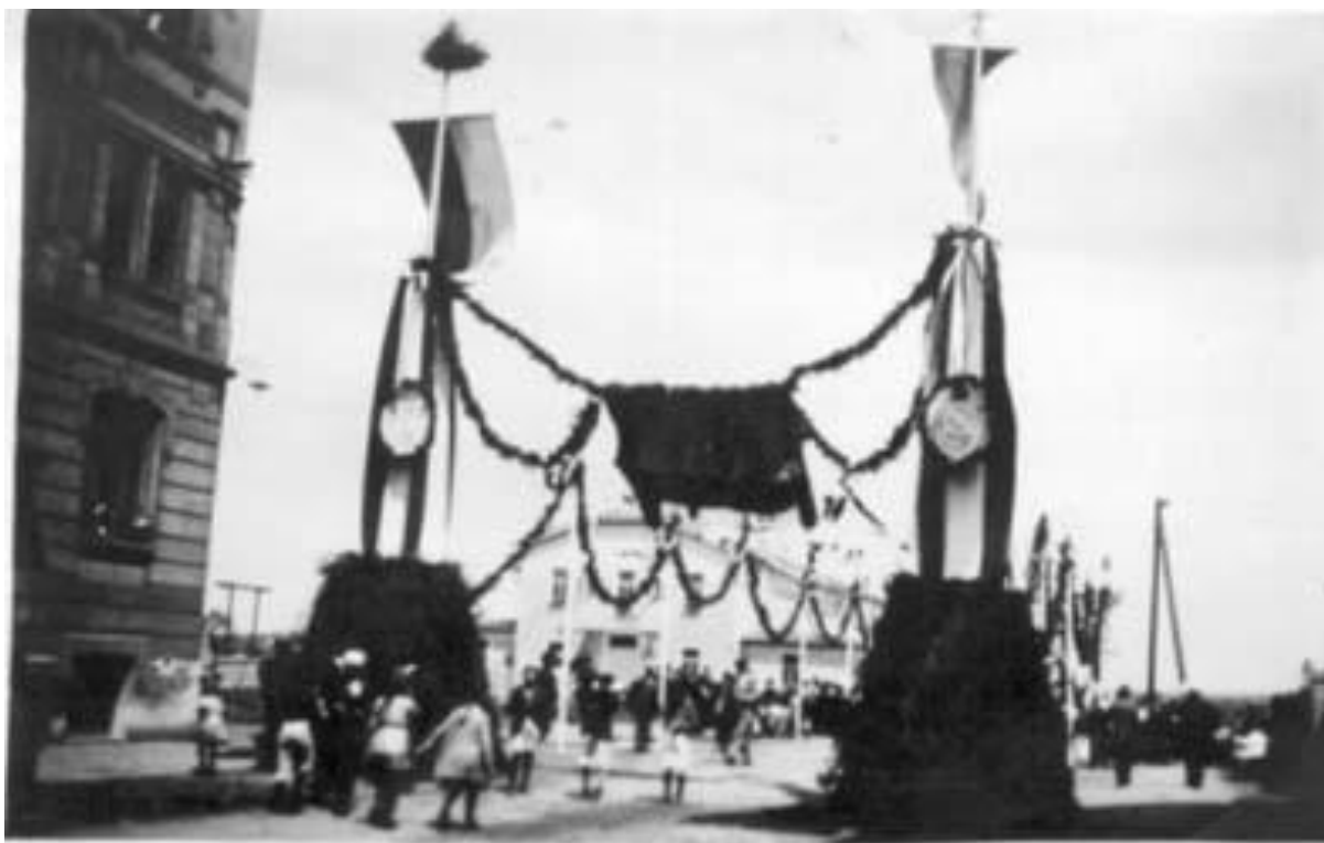
Obrázek 9. Slavnostní otevření sokolovny ve Strašnicích r. 1924.