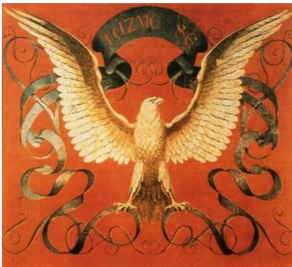
Obrázek 4. Prapor Pražského Sokola od J. Mánesa, 1862. (Žižka, 2005)