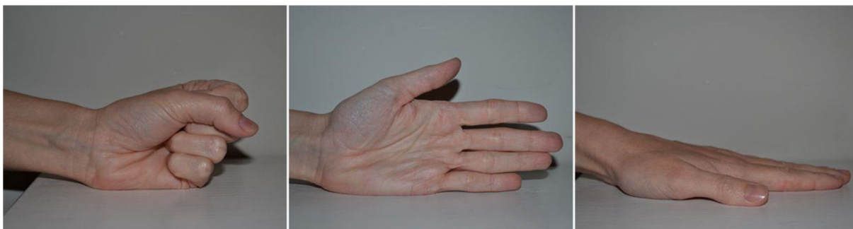
Obrázek 4 Třístupňový test horní končetiny (Cassidy, 2016, s. 321)

Další možností je hodnocení tzv. třístupňového příkazu, jehož ukázka je na Obrázku 4 (s. 28). Terapeut poklepe několikrát po sobě na podložku pěstí, hranou ruky a dlaní a pacient to musí zopakovat (Cassidy, 2016, s. 320).