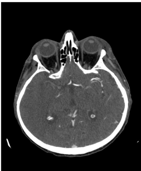
Obrázek 1 CT angiografie ischemické CMP (FNOL – radiologická klinika)

dávkou ionizujícího záření, jež pronikne do pacienta (Seidl, 2015, s. 117; Vilela, Rowley, 2017, s. 165).