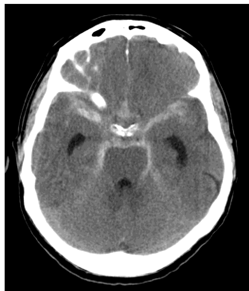
Obrázek 2 Nativní CT hemoragické CMP (FNOL – radiologická klinika)