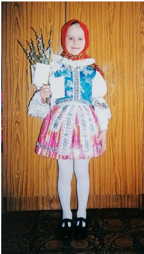
Vítání jara s letěčkem