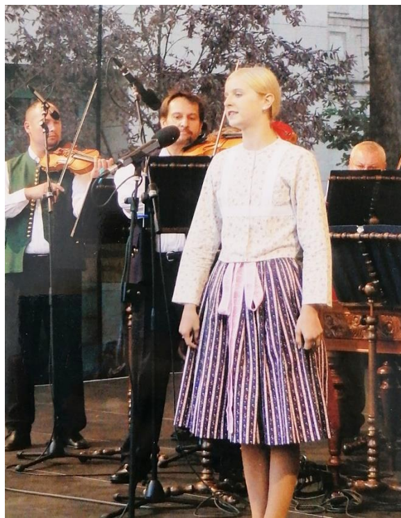
Vystoupení s BROLNem