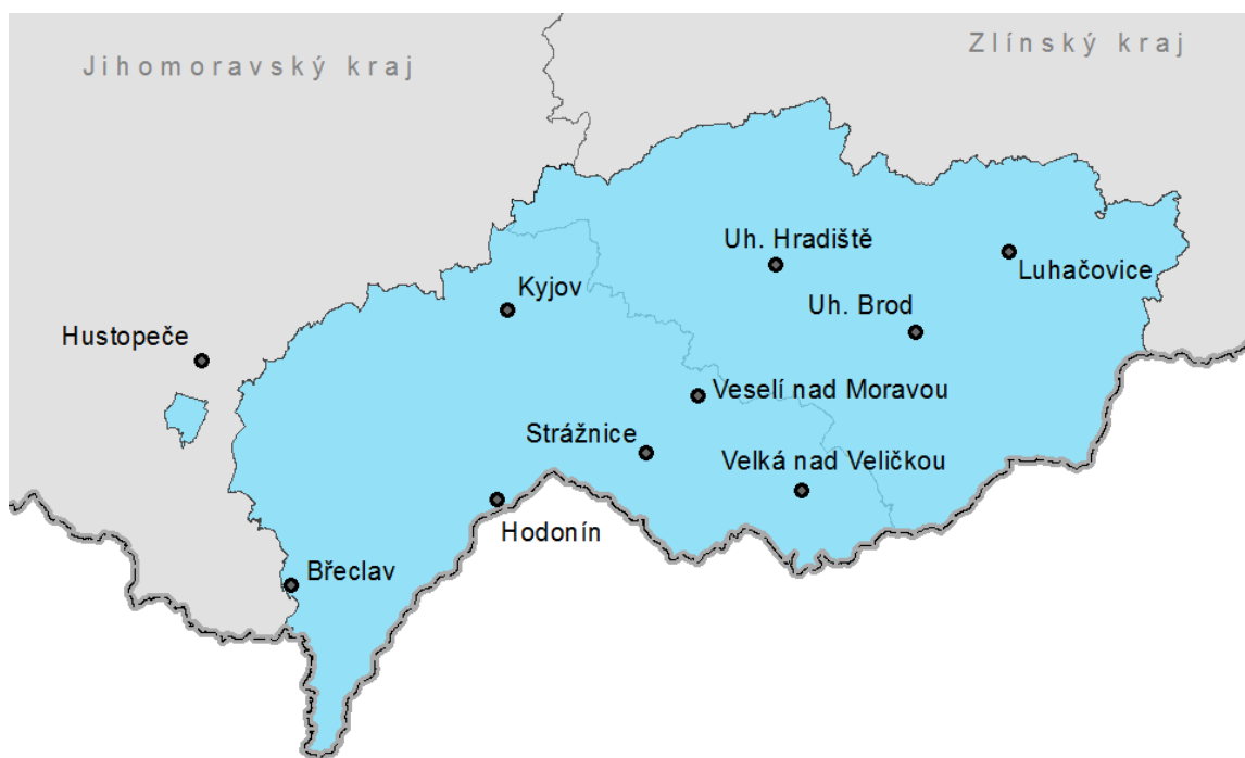
Obrázek č. 1: Mapa Slovácka

„Slovácko leží v nejjižnějším cípu východní Moravy. Rozlohou patří k nejrozsáhlejší moravským národopisným oblastem. Rozkládá se přibližně od Napajedel až k soutoku řeky Moravy s Dyjí. Na jihu hraničí s Rakouskem, na východě se Slovenskem, na severu a severozápadě s Hanou a Brněnskem. Směrem západním od Moravskokrumlovska až k Pálavě sahá nově osídlené území.“ (Jelínková, 1996, s. 3).