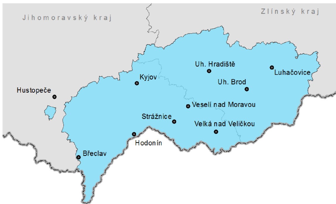
Obrázek č. 1: Mapa Slovácka

„Slovácko leží v nejjižnějším cípu východní Moravy. Rozlohou patří k nejrozsáhlejší moravským národopisným oblastem. Rozkládá se přibližně od Napajedel až k soutoku řeky Moravy s Dyjí. Na jihu hraničí s Rakouskem, na východě se Slovenskem, na severu a severozápadě s Hanou a Brněnskem. Směrem západním od Moravskokrumlovska až k Pálavě sahá nově osídlené území.“ (Jelínková, 1996, s. 3).