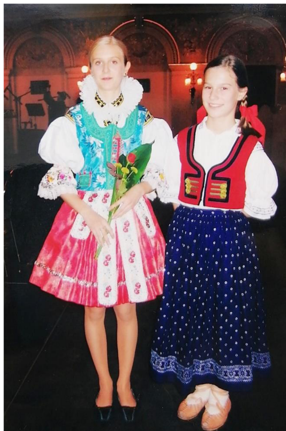
Vystoupení na Žofině