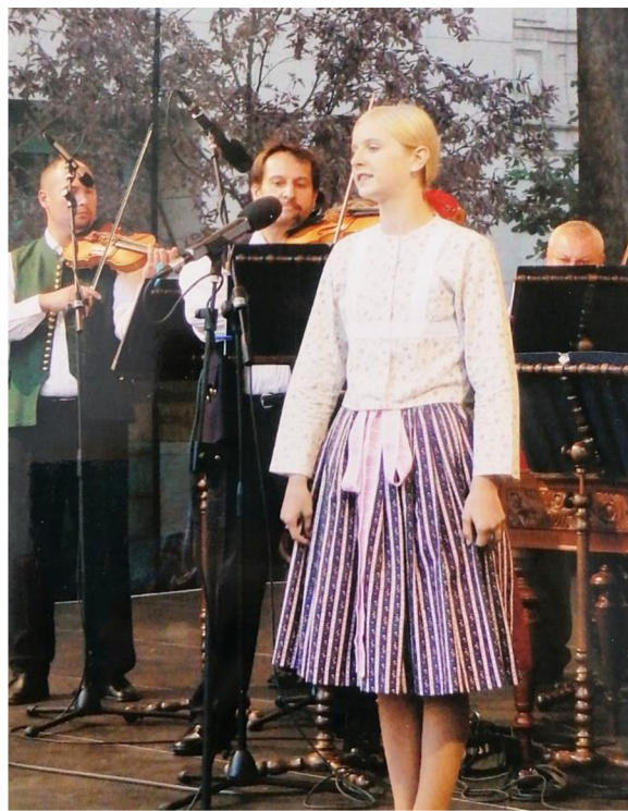
Vystoupení s BROLNem