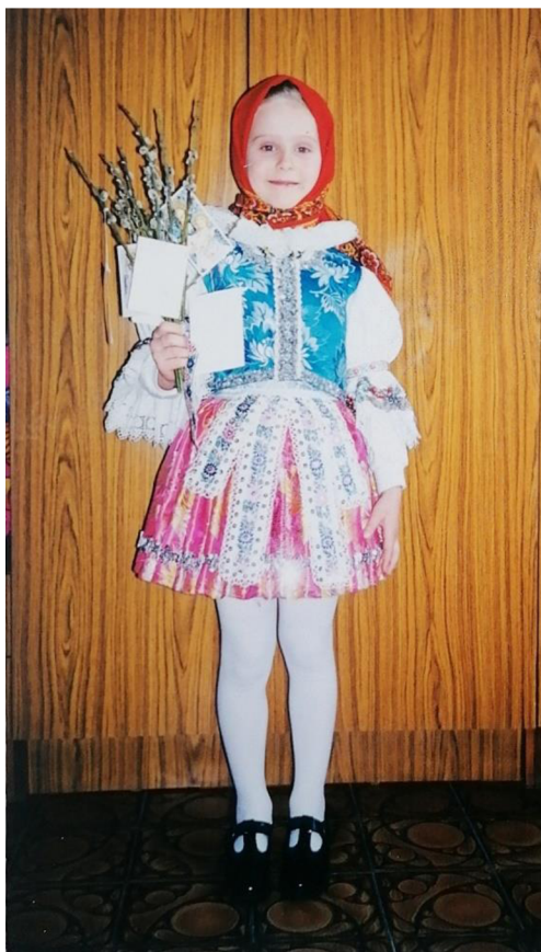
Vítání jara s letěčkem