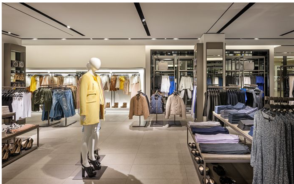
Obrázek 8 Zara