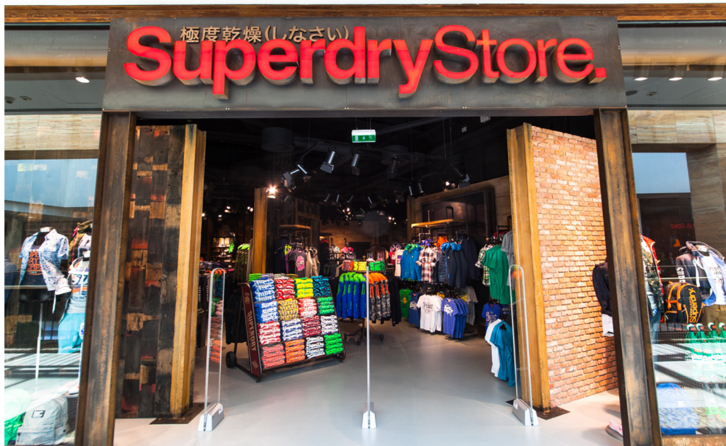
Obrázek 11 SuperDry

dokázalo přilákat některé z dotazovaných do této prodejny, je nakoupení věcí pro děti a levné oblečení. Nejmladší respondentka by do prodejny šla, protože ji zná a chce vidět, co nabízí nového.