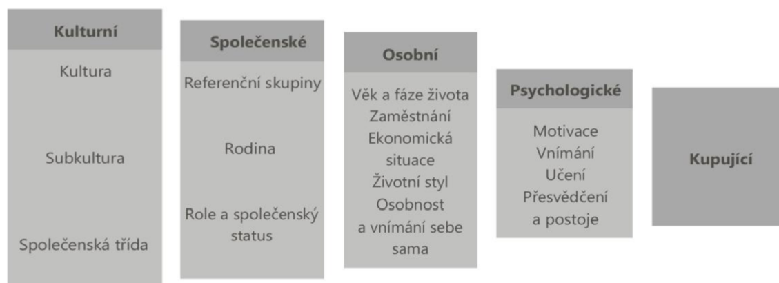
Obrázek 1 Faktory ovlivňující chování spotřebitele dle Kotlera

Podle Kotlera jsou spotřebitelské nákupy ovlivňovány kulturními, společenskými, osobními a psychologickými faktory, viz obrázek 1.