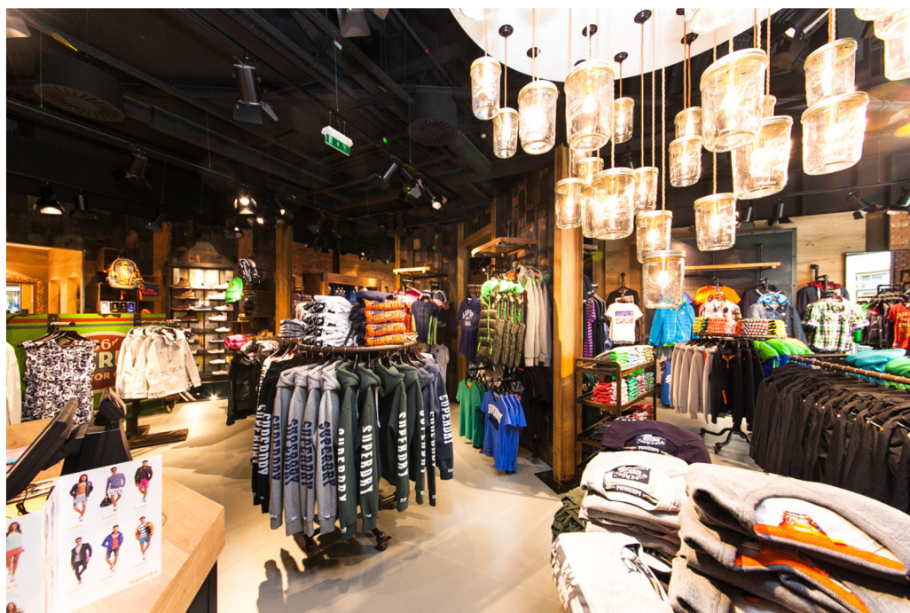
Obrázek 12 SuperDry