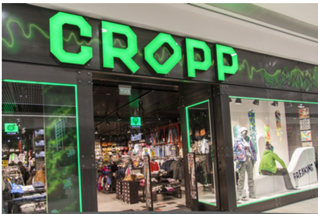
Obrázek 9 Cropp

Všichni z dotázaných tento obchod znají a většina z nich by se ho rozhodla navštívit. Nejen proto, že obchod znají a také znají sortiment v něm, ale i kvůli přehlednosti, výloze a celkově tomu, že by je obchod nalákal zvenku. Respondentům, kteří by se tento obchod rozhodli nenavštívit buď vadilo, že oblečení z tohoto obchodu nosí spousta dalších lidí, (vzhledem k tomu, jak je obchod známý) nebo by se jim to tam zdálo nepřírozené kvůli studenému osvětlení.