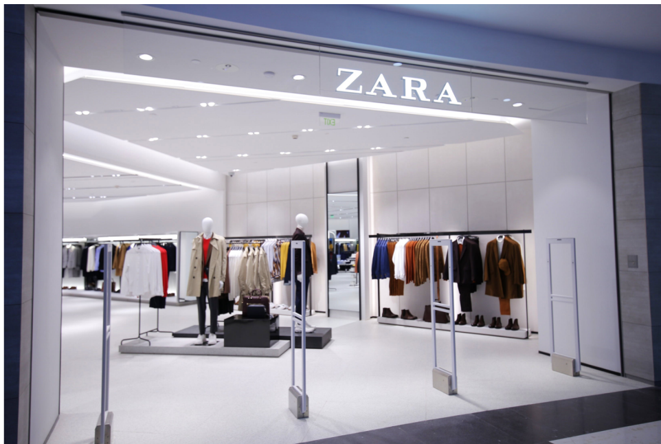
Obrázek 7 Zara

(Zdroj: https://www.strategyzer.com/business-model-examples/zara-business-model )