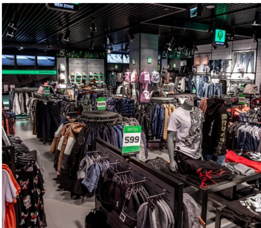
Obrázek 10 Cropp