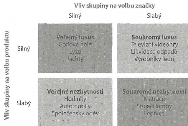
Obrázek 3 Rozsah vlivu skupiny na volbu produktu a značky