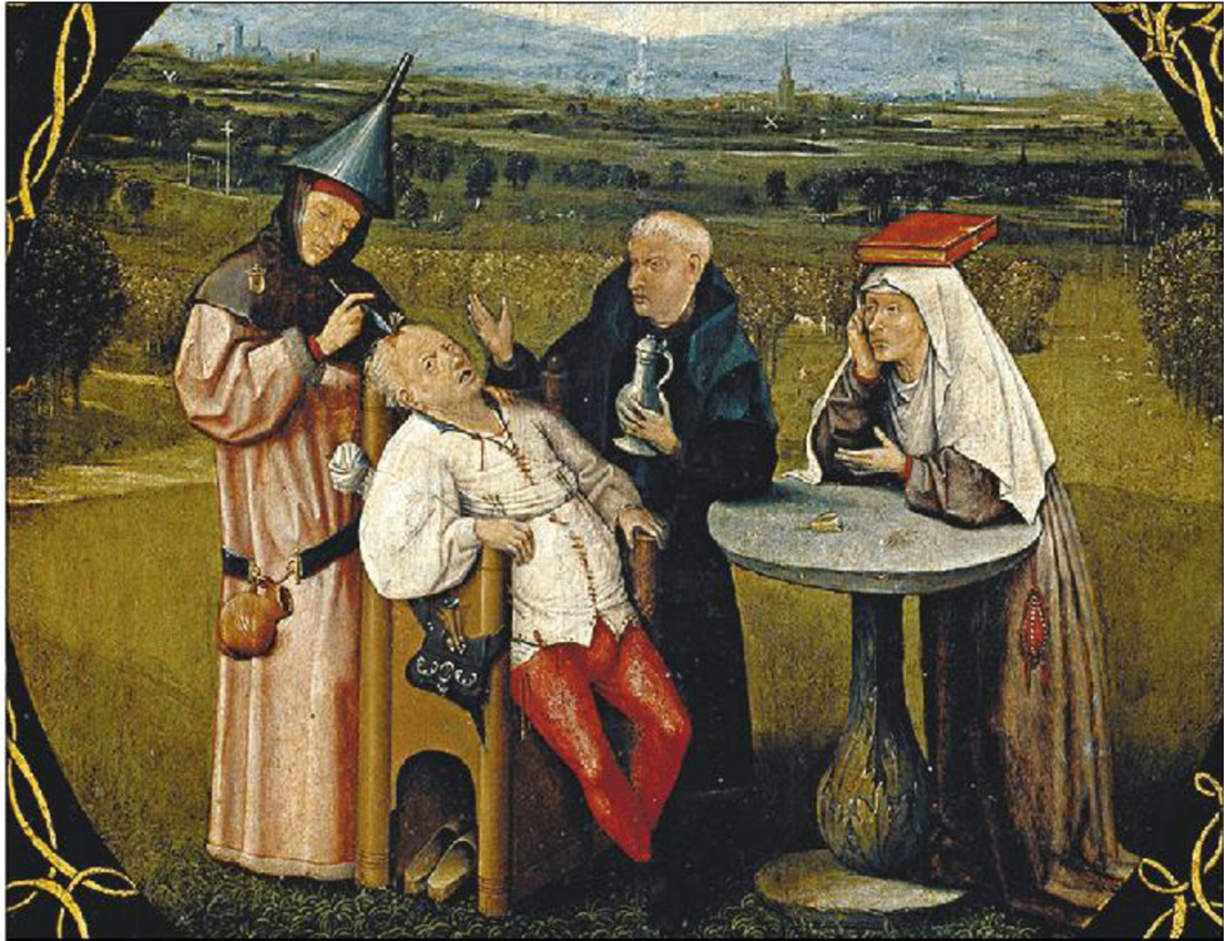
Liečenie bláznovstva (výrez)