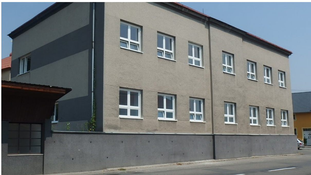
Obrázek 6: Budova školy r. 2018