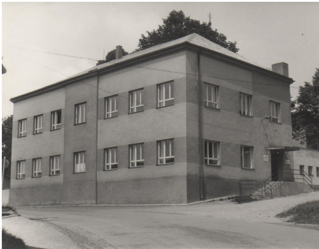
Obrázek 4: Budova školy r. 1968 - pohled od Dřevohostic