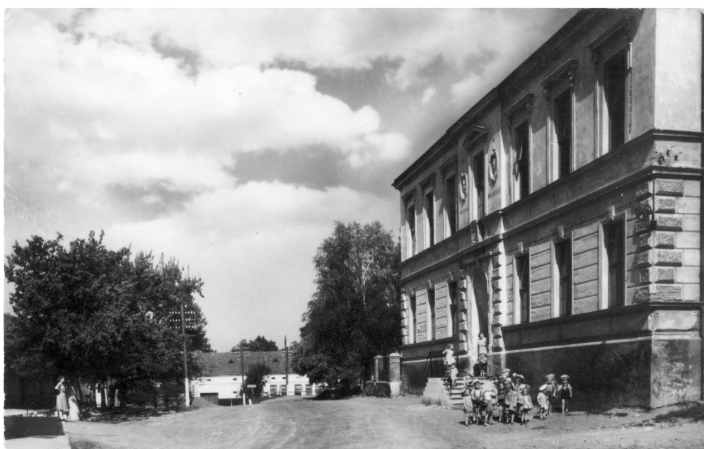
Obrázek 2: Budova školy r.1938 - pohled od Dřevohostic