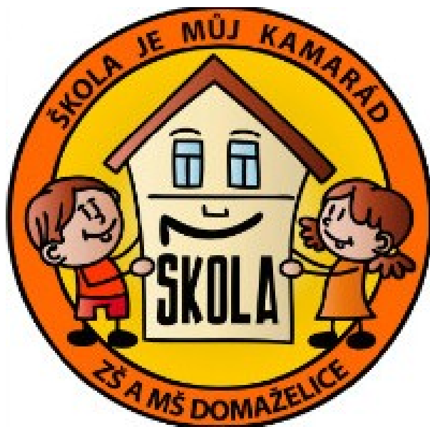
Obrázek 5: Logo školy