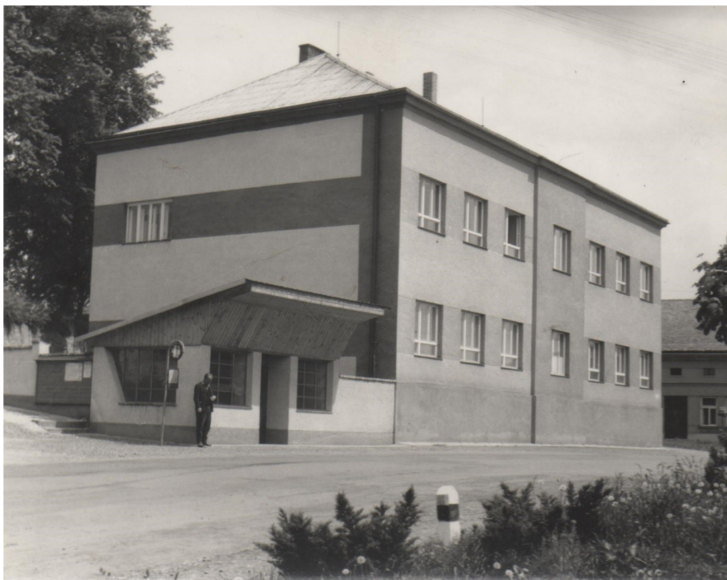
Obrázek 3: Budova školy po generální opravě r.1968 - pohled z návsi