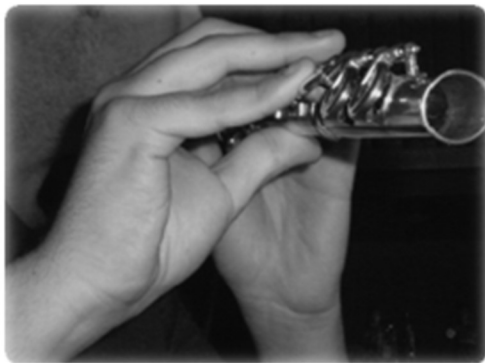
Obrázek 3 Postavení pravé ruky při hře na příčnou flétnu (Artigues-Cano & Bird, 2014, p. 206)

Hypermobilita má často souvislost také s poruchou propriocepce. Hudebníci však mají obvykle lepší propriocepci než většina běžné populace. Ve výše zmíněné studii s flétnisty bylo zjištěno, že ačkoli mají hypermobilní interphalangeální a metakarpophalangeální klouby, jejich propriocepce je na velmi dobré úrovni. K posouzení propriocepce autoři studie použili Leeds hand proprioceptometr (Artigues-Cano & Bird, 2014, p. 206-207). Při použití této metody měření je ruka připnuta do přístroje v oblasti zápěstí a interphalangeálních kloubů 2. prstu, které jsou extendované. Metakarpophalangeální kloub ukazováčku je volný. Na horní části zařízení je víko s úhlovou stupnicí. V první fázi testování je proband vyzván k zaujetí 10 na stupnici přesně znázorněných poloh ukazováčku za zrakové kontroly. Do víka přístroje je pak vložena neprůhledná fólie a se stejným postupem je proveden samotný test propriocepce. Úspěšnost se hodnotí na základě úhlových odchylek, které se odečítají ze stupnice, která je testovanému skryta (Wycherley et al., 2005, p. 639).