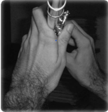
Obrázek 2 Postavení levé ruky při hře na příčnou flétnu (Artigues-Cano & Bird, 2014, p. 205)

metakarpophalangeální kloub 2. prstu (viz Obrázek 2, s. 26) a distální interphalangeální kloub 5. prstu (viz Obrázek 3, s. 26). Generalizovaná hypermobilita na základě Beightonovy škály u většiny probandů nebyla prokázána. Studie však zahrnovala pouze 20 účastníků, což mohlo vést ke zkreslení výsledků (Artigues-Cano & Bird, 2014, p. 203-205).