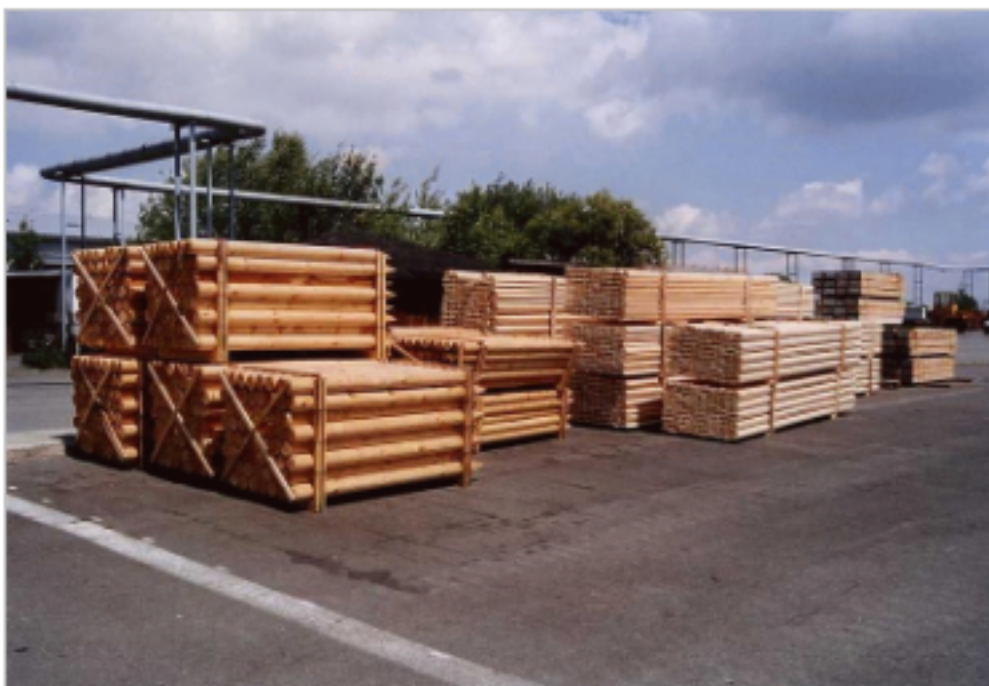
Obrázek 4 Výroba sortimentů ( https://www.poziadavka.sk/ponuky/ponuka-78458/Pilarska-vyroba---Agregatni-sortiment-reziva )