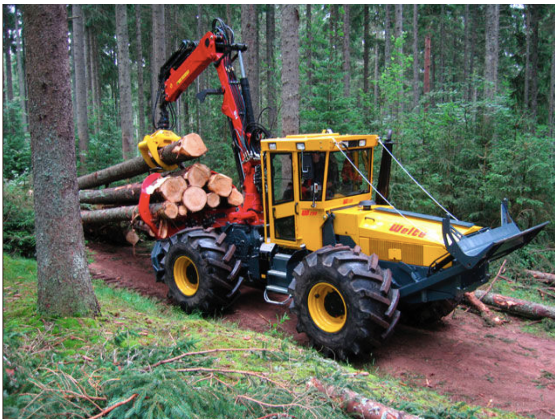
Obrázek 2 Soustředování dříví