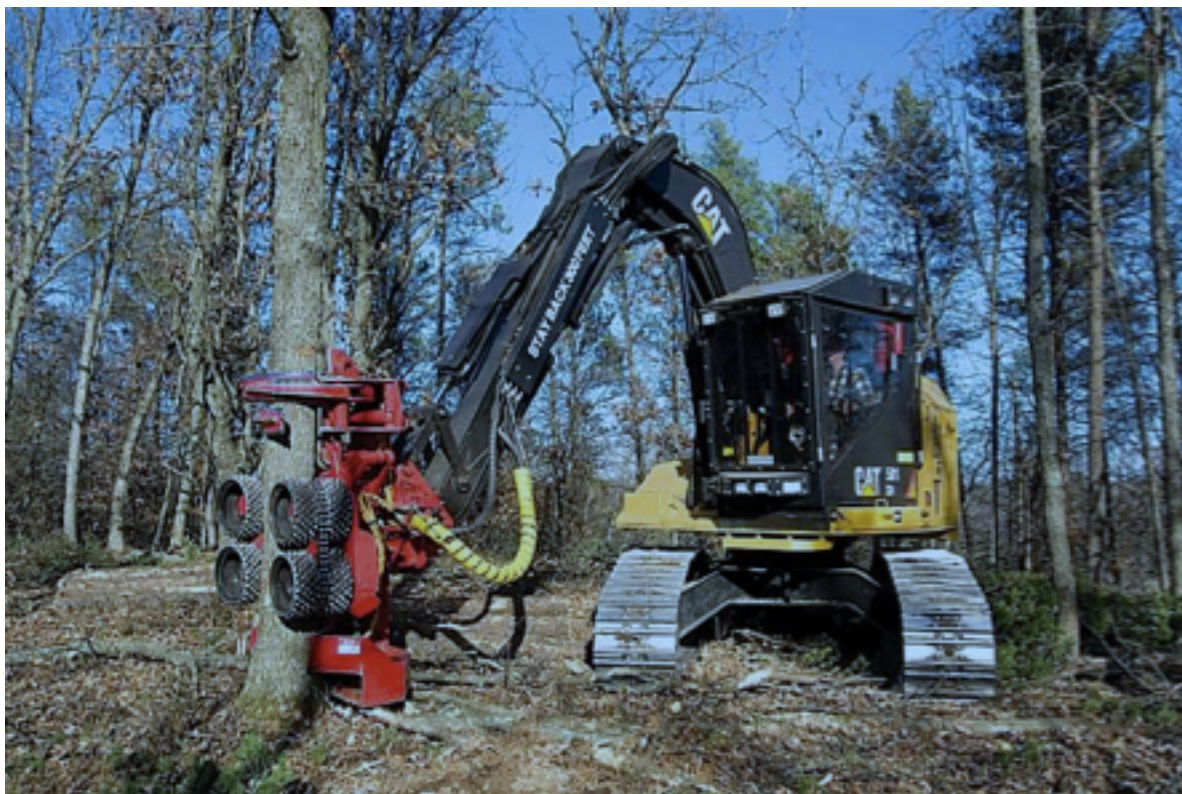
Obrázek 1 Těžba dříví (Brychta, 2018)