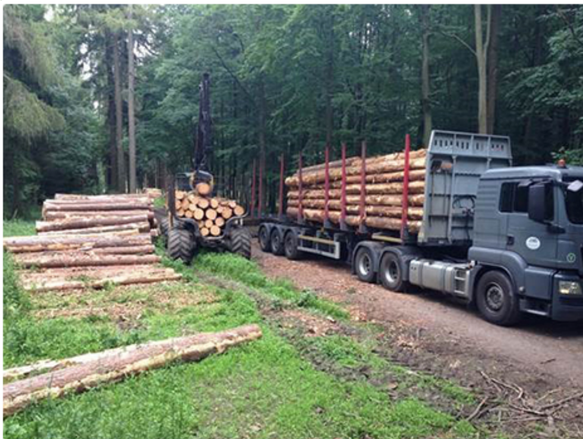
Obrázek 3 Odvoz dříví