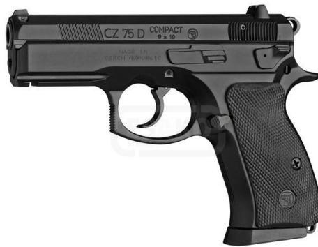
Obrázek 1 pistole CZ 75 D Compact