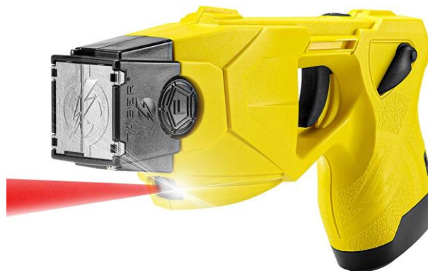
Obrázek 3 Taser X26P