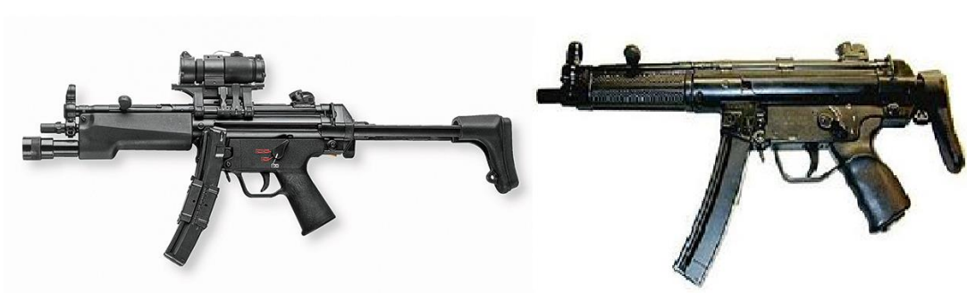
Obrázek 2 samopal Heckler & Koch MP5 (Maschinenpistole 5)