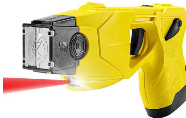
Obrázek 3 Taser X26P