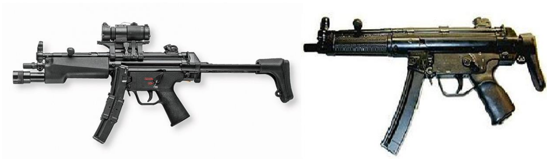
Obrázek 2 samopal Heckler & Koch MP5 (Maschinenpistole 5)