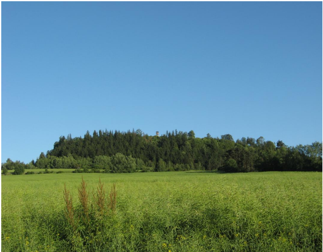
Obr. č. 2 – Malý Chlum