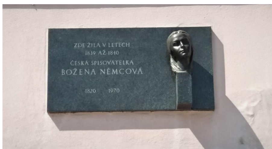
Obrázek č. 12: Busta Boženy Němcové (dům č. 27 na Smetanově náměstí)