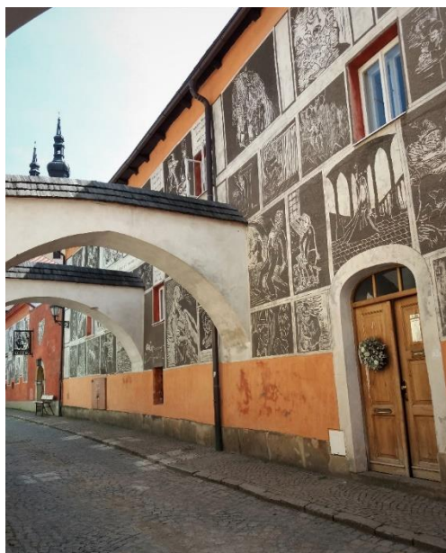
Obrázek č. 8: Váchalova ulice