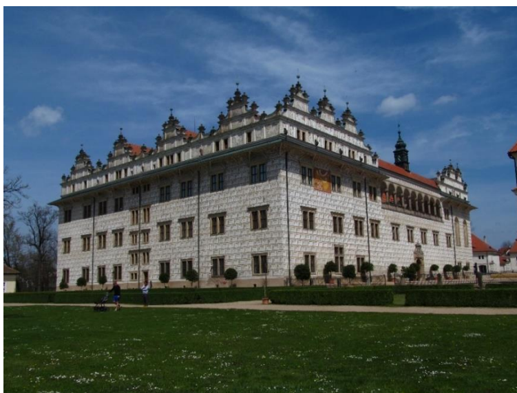
Obrázek č. 1: Zámek Litomyšl (pohled z francouzské zahrady)