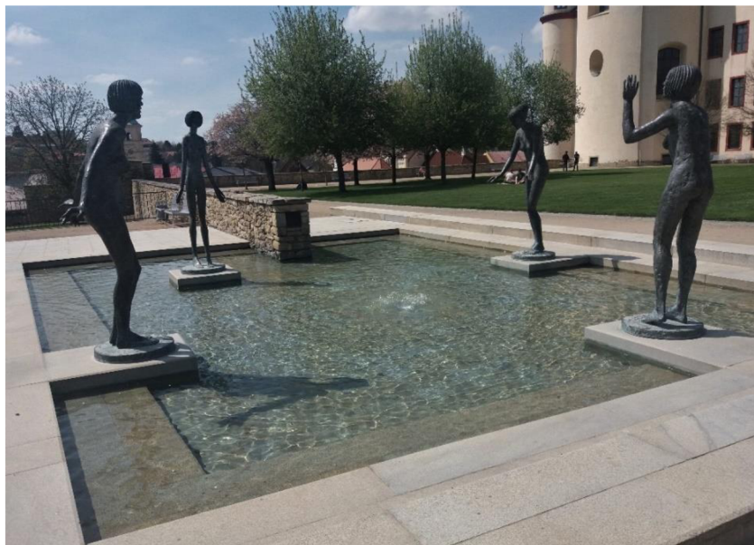
Obrázek č. 4: Sochy Olbrama Zoubka v klášterních zahradách