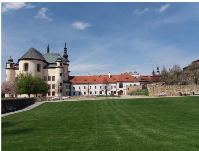
Obrázek č. 3: Klášterní zahrady s piaristickým chrámem Nalezení sv. Kříže