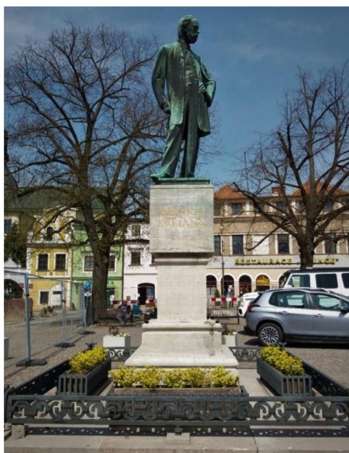
Obrázek č. 10: Památník Bedřicha Smetany