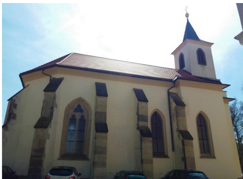
Obrázek č. 6: Kostel Rozeslání sv. Apoštolů