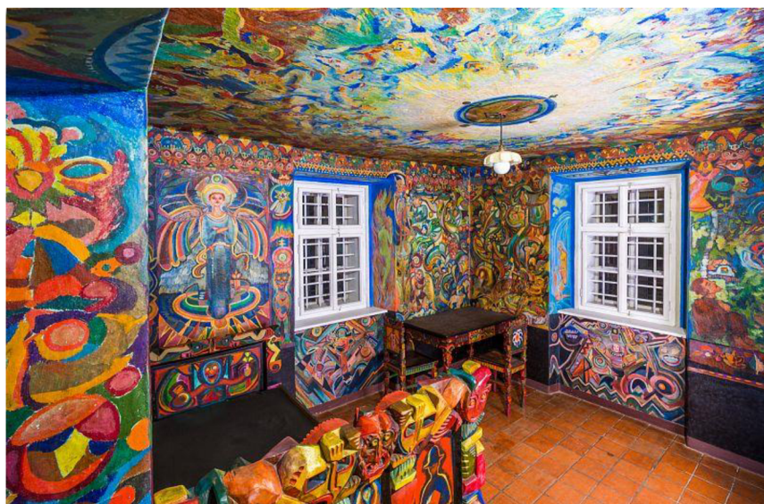
Obrázek č. 7: Portmoneum – Museum Josefa Váchala