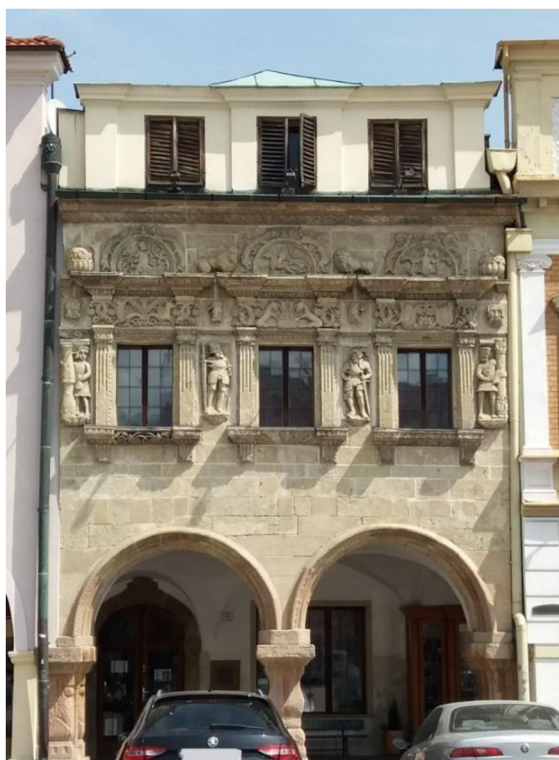
Obrázek č. 9: Dům u Rytířů