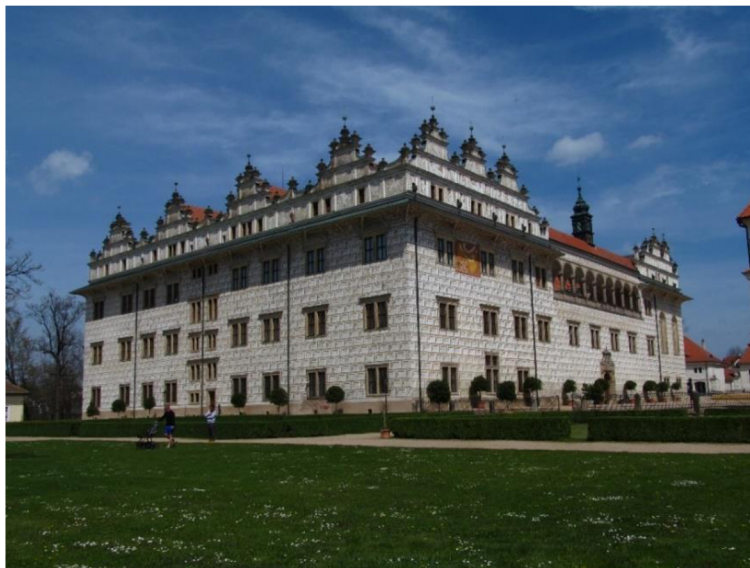
Obrázek č. 1: Zámek Litomyšl (pohled z francouzské zahrady)