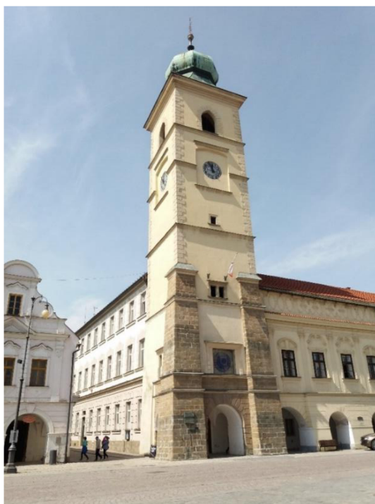
Obrázek č. 13: Budova radnice na Smetanově náměstí