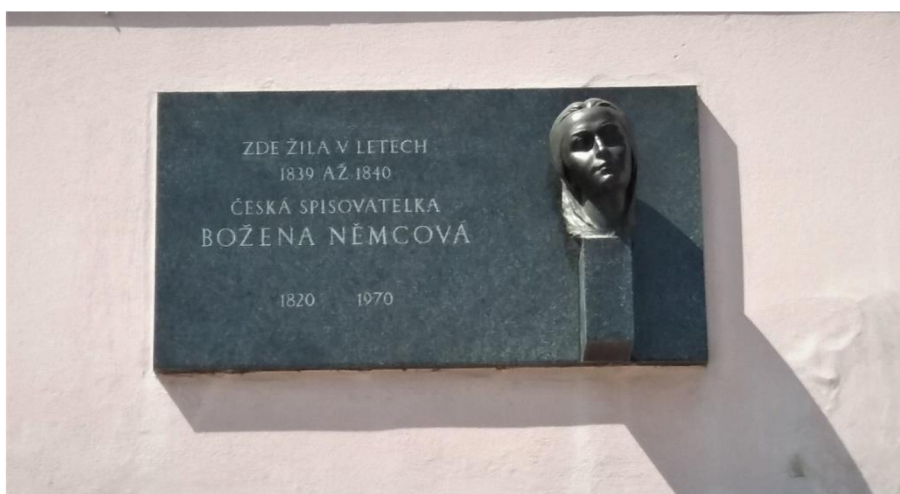
Obrázek č. 12: Busta Boženy Němcové (dům č. 27 na Smetanově náměstí)