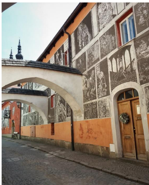
Obrázek č. 8: Váchalova ulice