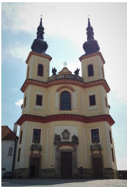
Obrázek č. 2: Piaristický chrám Nalezení sv. Kříže