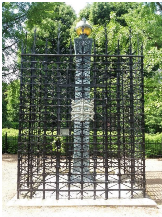
Obrázek č. 14: Památník českým bratřím na Růžovém paloučku