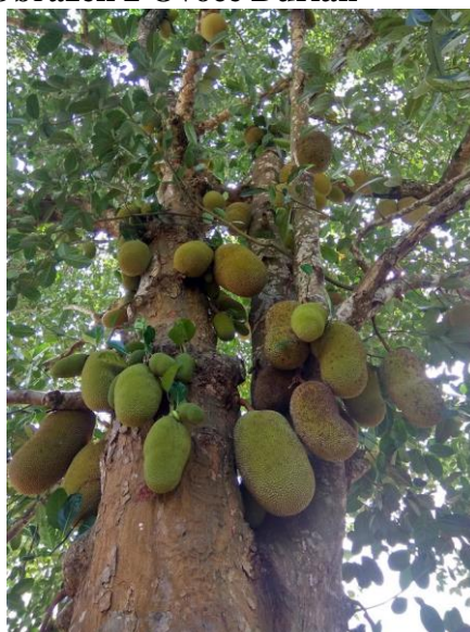
Obrázek 2 Ovoce Durian

Ve středu ostrova se nachází proslulá farma na výrobu a pěstování koření nazývaná Spice Tour. Na této farmě se pěstuje od hřebíčku, muškátového ořechu, pepře, citronové trávy až po veškeré exotické ovoce, kde typický příklad je durian, v angličtině se nazývá Jack fruit. 8