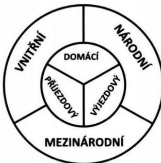
Obrázek 1 Typy cestovního ruchu

Zdroj: RYGLOVÁ, K., Michal B. a I. VAJČNEROVÁ. Cestovní ruch Praha: Grada, 2011. Str. 21