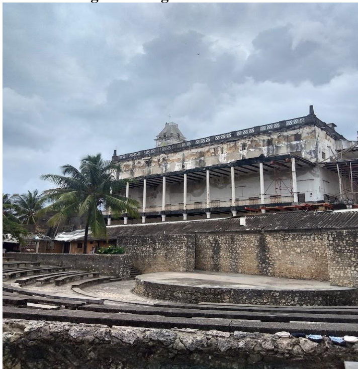
Obrázek 5 Ngome Kongwe/Omani Fort