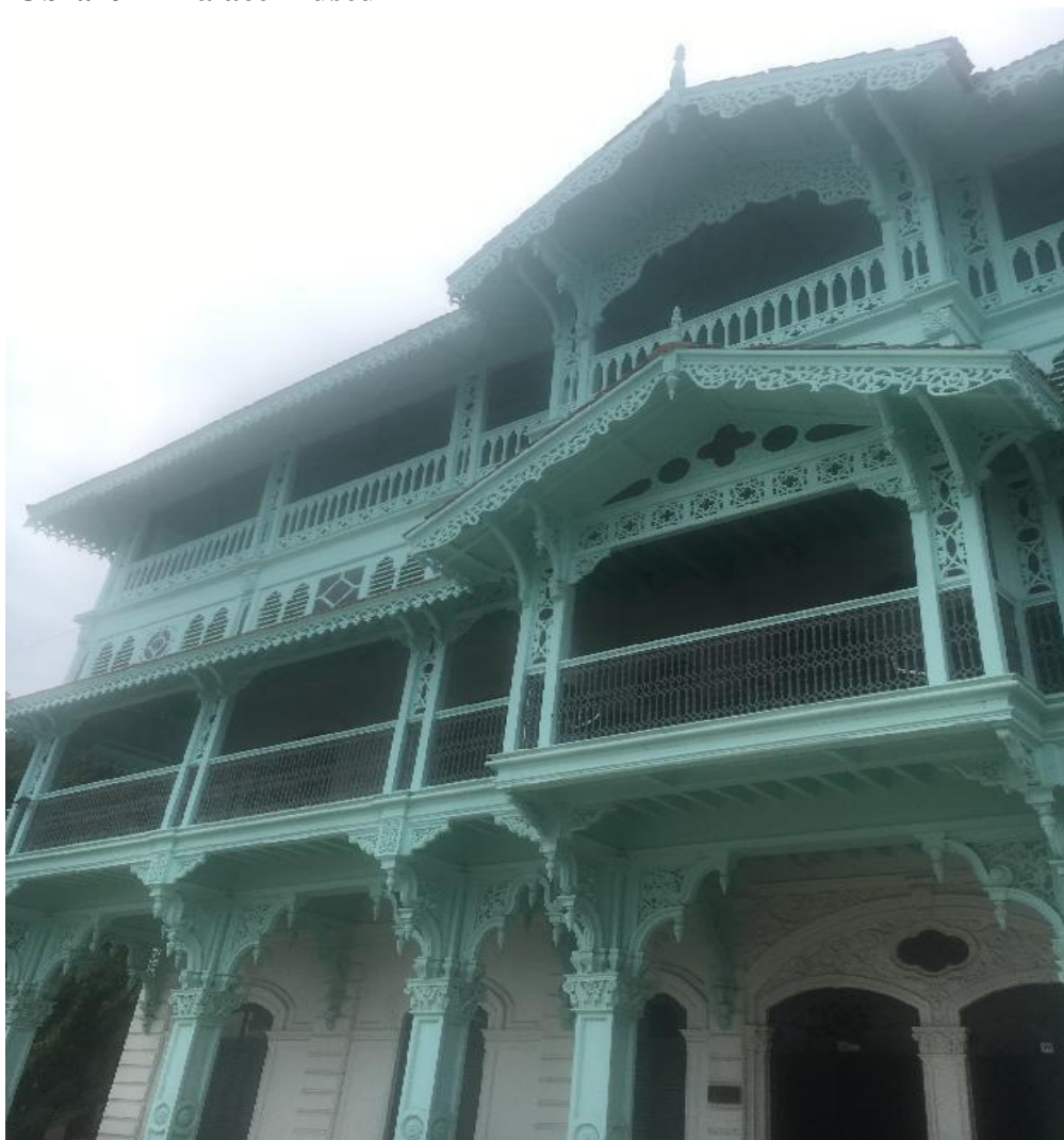
Obrázek 4 Palace Museum

Bývalý sultánův palác, později sídlo vlády a dnes expozice dějin sultanátu. Zajímavostí je místnost věnovaná sultánově dceři princezně Salme, do níž se zamiloval německý obchodník Heinrich Ruete a která s ním ve 22 letech utekla do Německa. Tam žila pod jménem Emily Rueteová a měla tři děti. Manžel však zemřel několik let po návratu a zanechal ji v chudobě. Její německy psané paměti jsou na Zanzibaru všude k dostání a je tam velmi populární. 10