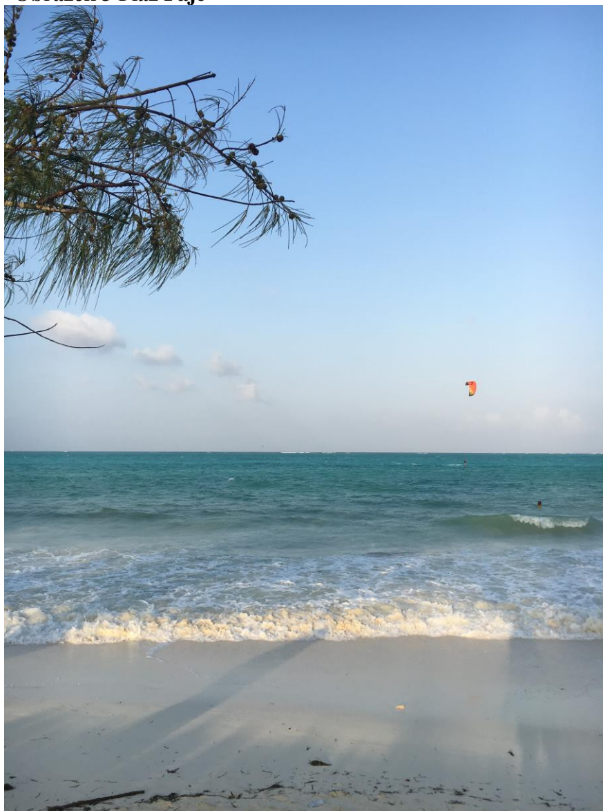
Obrázek 3 Pláž Paje