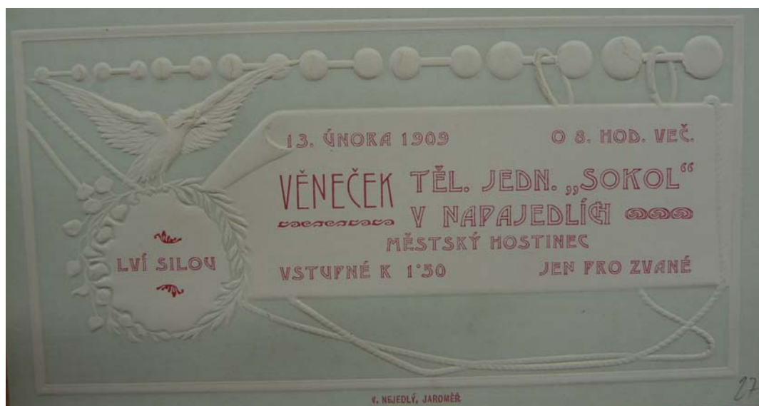
Obrázek 12 Pozvánka na sokolský věneček SOkA Zlín, f. Tělocvičná jednota Sokol, inv. č. 38, kart. 29.