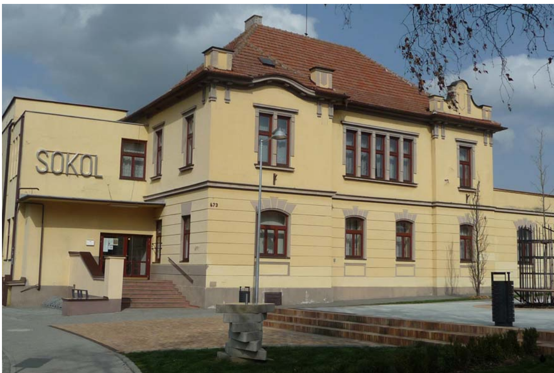
Obrázek 9 Budova sokolovny v současnosti