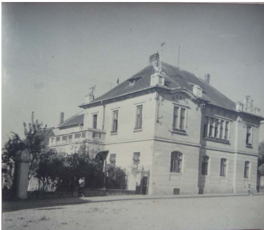
Obrázek 8 Budova sokolovny před přístavbou SOKA Zlín, f. Tělocvičná jednota Sokol, inv. č. 76.