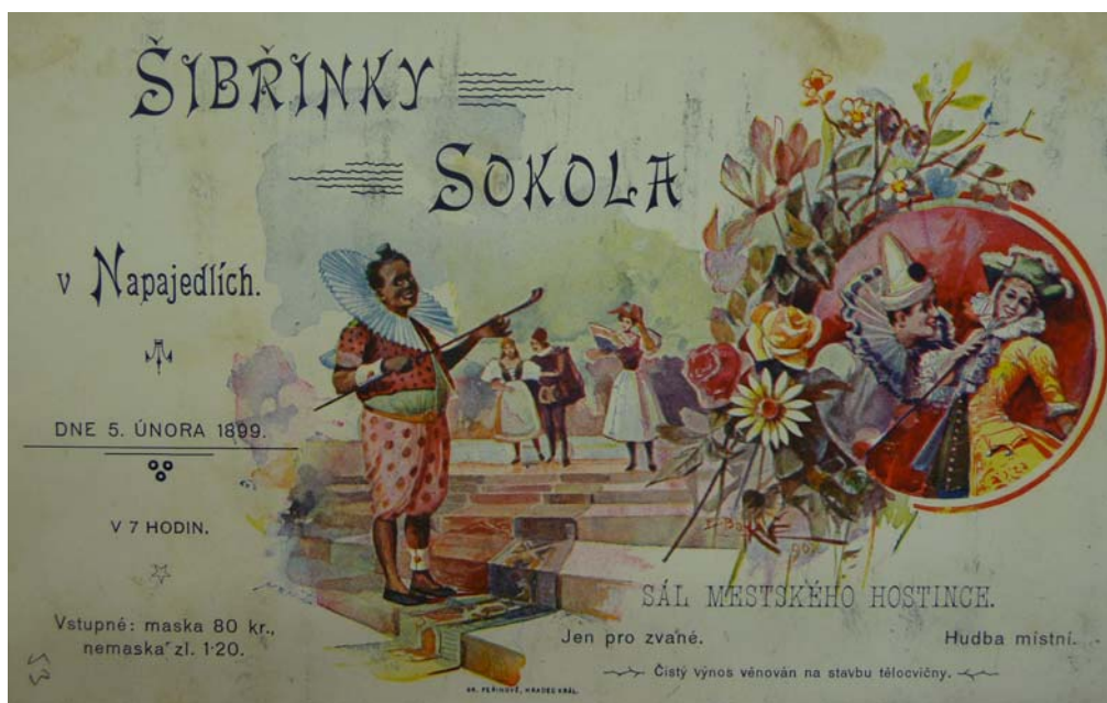
Obrázek 11 Pozvánka na šibřinky 1899 SOka Zlín, f. Tělocvičná jednota Sokol, inv. č. 38, kart. 29.