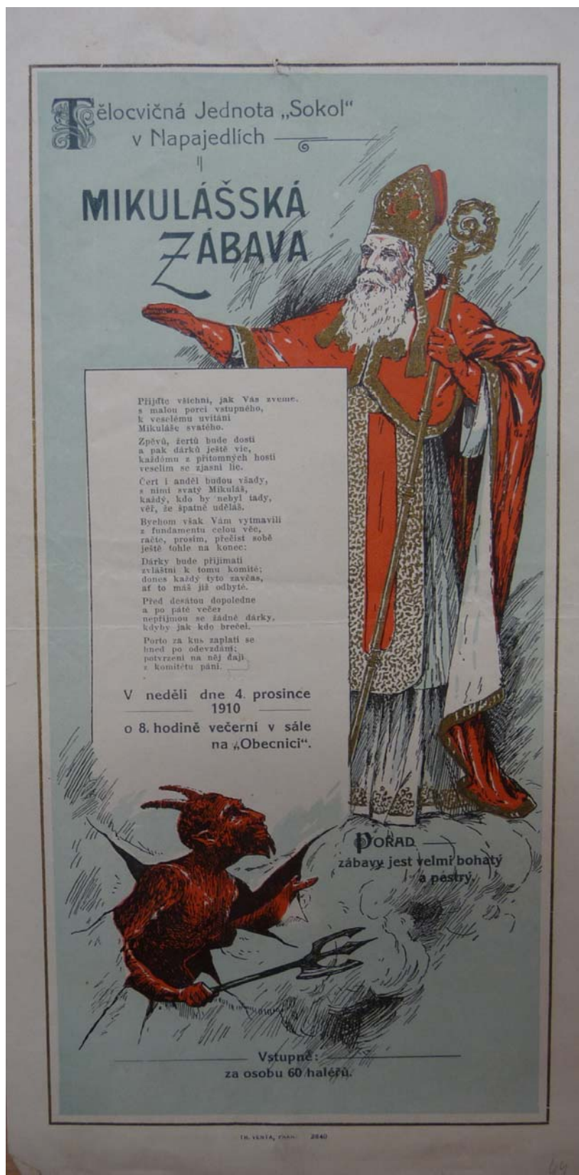
Obrázek 13 Pozvánka na Mikulášskou zábavu pořádanou TJ Sokol Napajedla SOKA Zlín, f. Tělocvičná jednota Sokol, inv. č. 38, kart. 29.