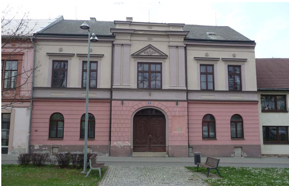
Obrázek 2 Bývalá budova "Obecnice"