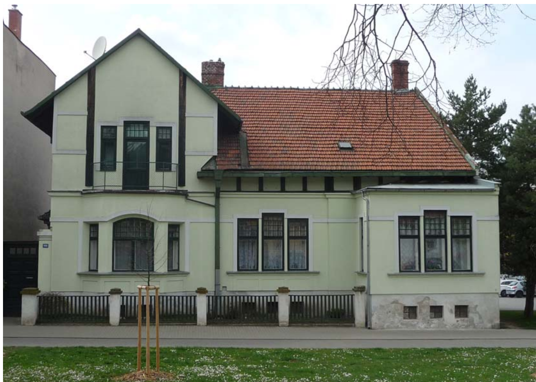
Obrázek 7 Vila u Würzů