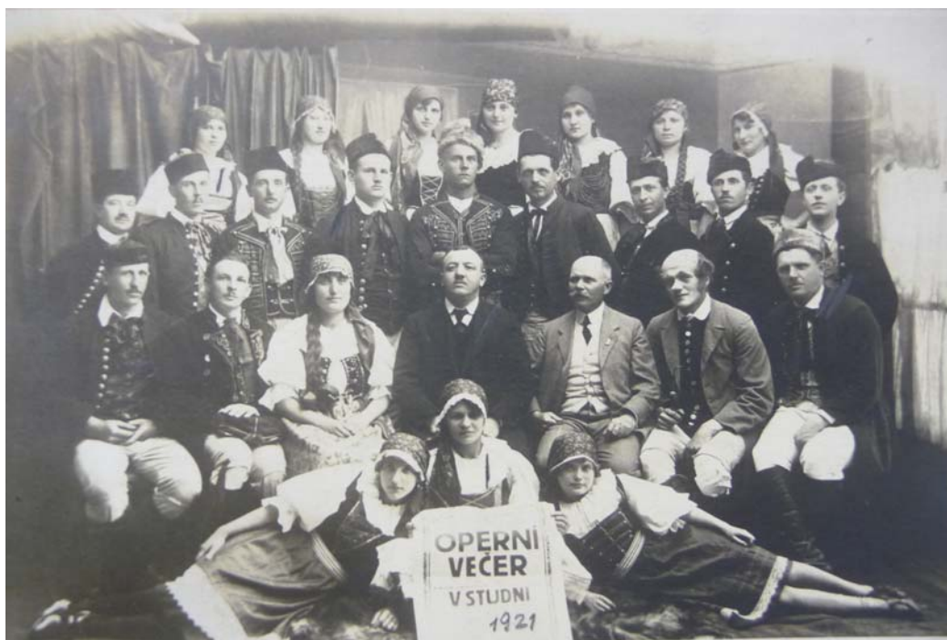
Obrázek 10 Pěvecký sbor Sokola SOkA Zlín, Tělocvičná jednota Sokol, inv. č. 76.