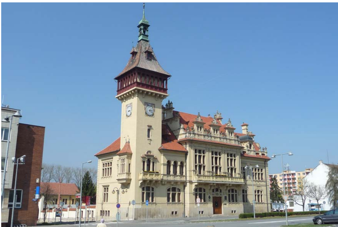
Obrázek 1 Budova radnice