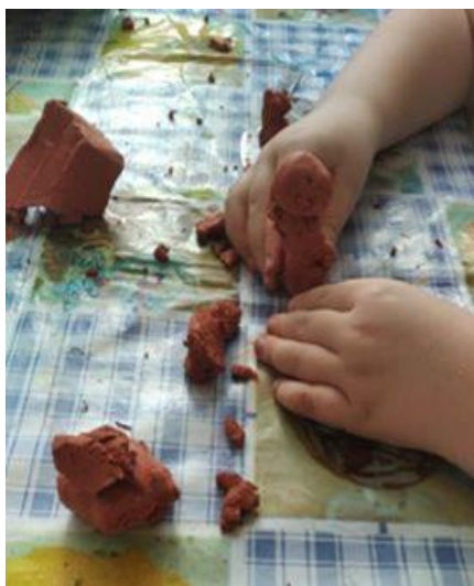
Obrázek 21: Tvorba sochy