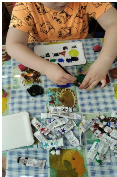
Obrázek 15: Tisk – koláč