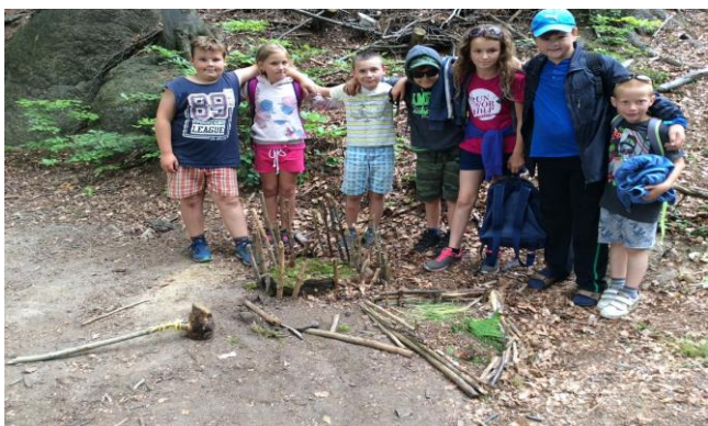
Obrázek 8: Spolupráce u stavby díla