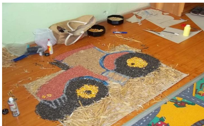
Obrázek 11: Společné dílo