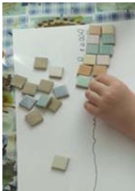
Obrázek 17: Cesta ke králi - mozaika z kachlíků