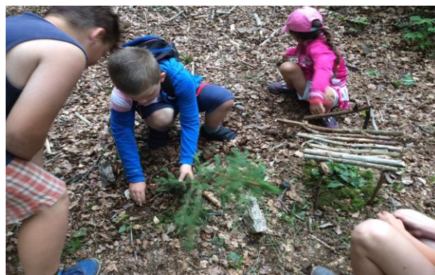
Obrázek 9: Stavění pro krále