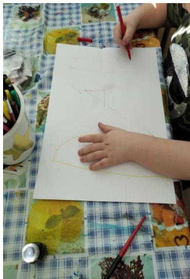
Obrázek 2: Hlášky psané štětcem, redisperem