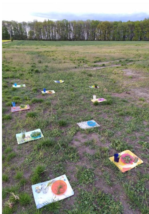
Obrázek 13: Celkové dílo Land art – hostina