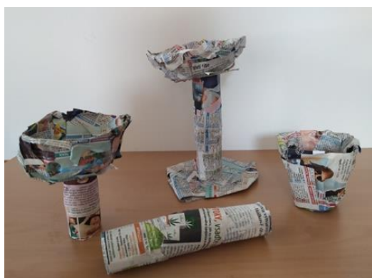
Obrázek 18: Poháry pro krále – kašírování