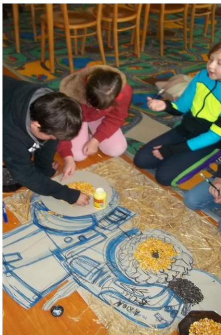
Obrázek 10: Použití přírodnin