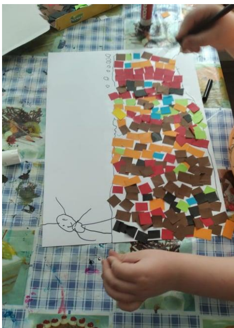
Obrázek 16: Cesta ke králi – mozaika z papíru