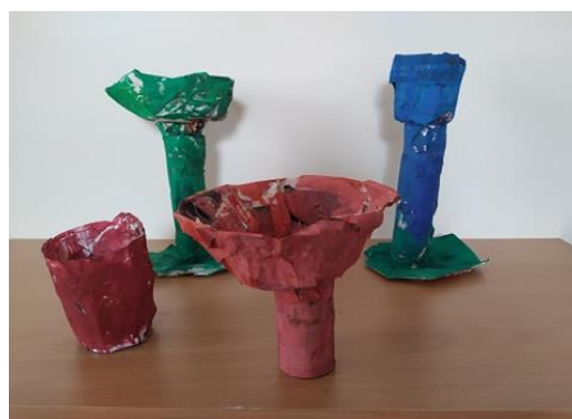
Obrázek 19: Malba pohárů