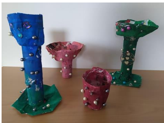
Obrázek 20: Celkové dílo – pohár pro krále