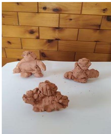
Obrázek 22: Socha