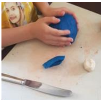
Obrázek 4: Příprava na tvorbu hlásek