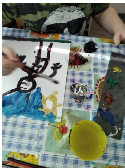
Obrázek 6: Pohádkový čert