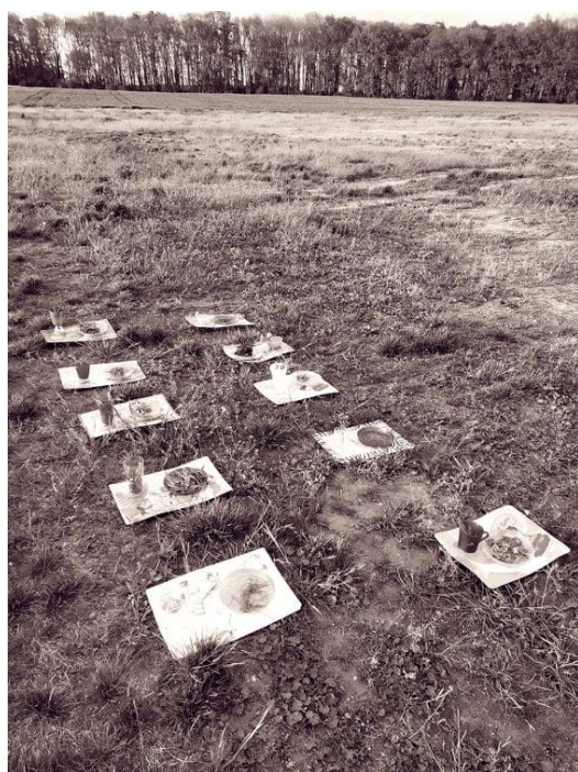
Obrázek 12: Celkové dílo – hostina Land art