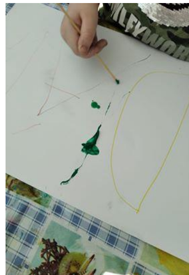
Obrázek 3: Hláška psaná špejlí