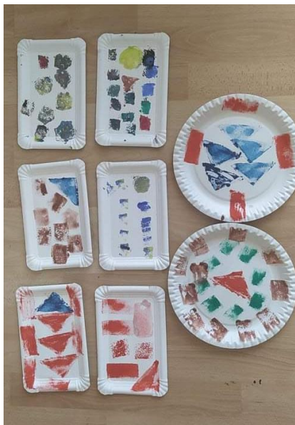
Obrázek 14: Celkové dílo tisk