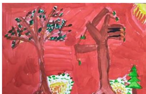
Obrázek 7: Pohádkový strom