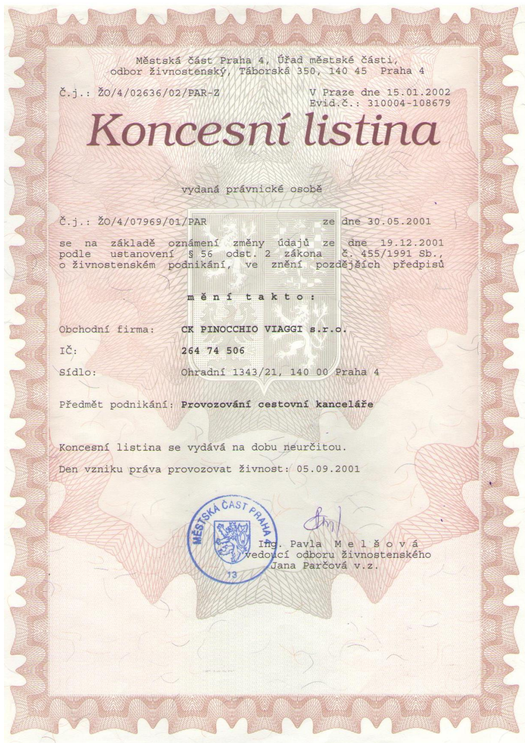
Obrázek 2: Ukázka koncesní listiny