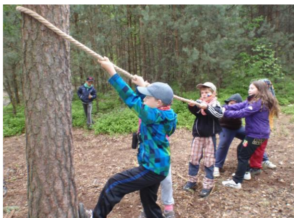
Obr. 41: Přetahování lanem, S. Splavy, 25. 9.2014