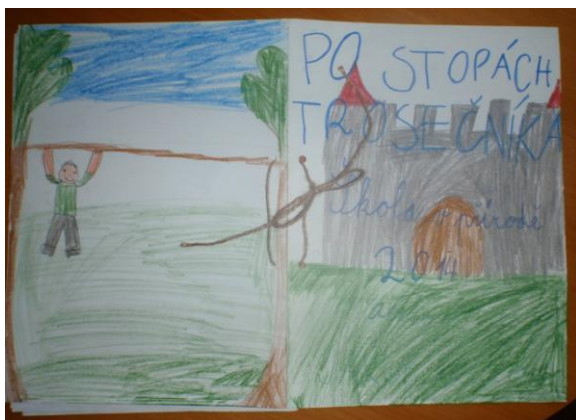
Obr. 23: Deníček 1, Staré Splavy, 22. 9. 2014

„Každý den si budete vytvářet deníček „Po stopách trosečníka“. Můžete si do něj zapisovat a kreslit, co jste předchozí den prožili.“