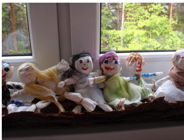
Obr. 29: Přítel Pátek, Staré Splavy, 23. 9. 2014