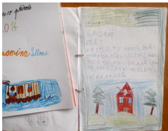
Obr. 24: Deníček 2, Staré Splavy 22. 9. 2014