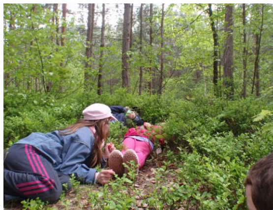
Obr. 43: Stopovaná, S. Splavy, 25. 9. 2014