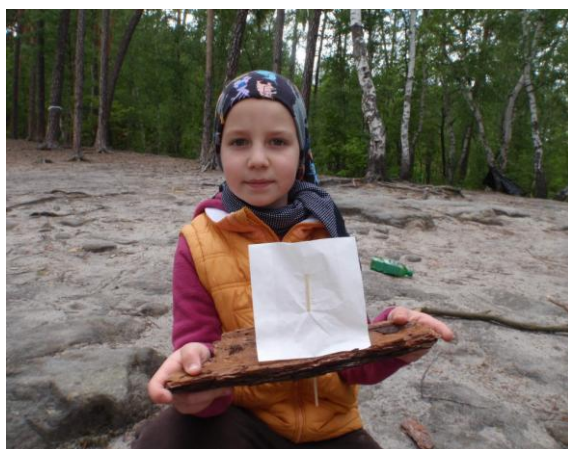
Obr. 50: Loďka z kůry, S. Splavy, 26. 9.2014

Pro inspiraci jsem dětem ukázala, jak vypadá moje loďka a zároveň jsem jim nabídla svoji radu a pomoc. „Než každý trosečník svoji loďku spustí na vodu, řekne ostatním, co nového se na ostrově naučil, co překonal a čeho si na sobě nejvíce váží. Svoji loďku pak vypustí na cestu z ostrova domů.“