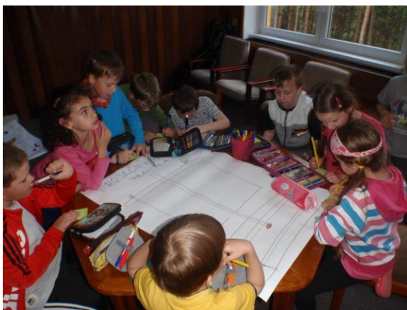
Obr.17: Tvorba pravidel, Staré Splavy, 21. 9.2014

„Aby se trosečnickům na ostrově dobře žilo, musejí si vytvořit trosečnická pravidla. Vy pravidla dobře znáte, ve třídě je také používáte. Na pomoc si vezmete barevné lepící lístečky, na které budete pravidla zapisovat. Pak je přilepíte na připravený arch papíru.“ Když děti dolepily svoje lístečky, začala jsem jednotlivá pravidla předčítat. Děti se k nim vyjadřovaly a zároveň je vysvětlovaly. Upravili jsme si je tak, aby s nimi všichni souhlasili. Na stvrzení souhlasu si každý ještě obkreslil svoji ruku, podepsal si ji a nalepil na arch s pravidly. Trosečnickova pravidla, spolu s originální vlajkou, jsme pověsili na dobře viditelné místo v naší klubovně, kde bude po celou dobu pobytu.