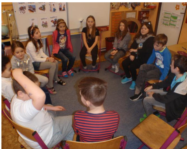
Obr. 6: Sdělování sympatií, ZŠ Klič Česká Lípa, 12. 9. 2014