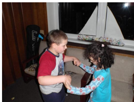
Obr. 32: Slavnost - tanec, S.Splavy., 23.9. 2014