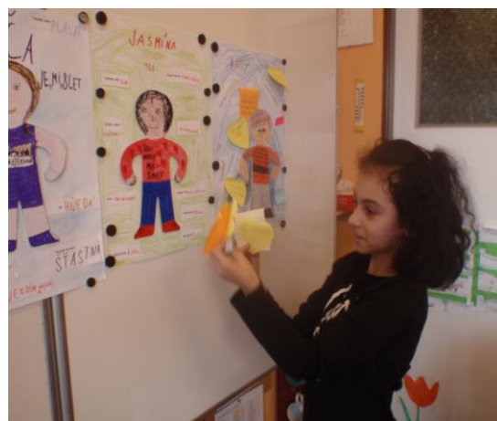
Obr. 10: Čtení vzkazů, ZŠ Klíč Česká Lípa, 16. 9. 2014