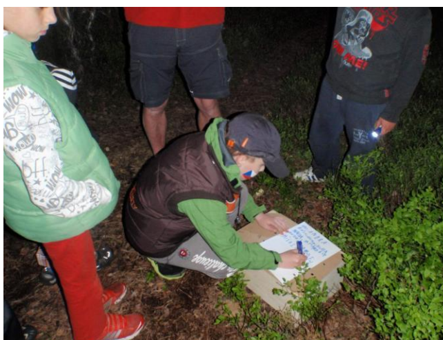
Obr. 48: Podpis odvahy, Staré Splavy, 25. 9.2014