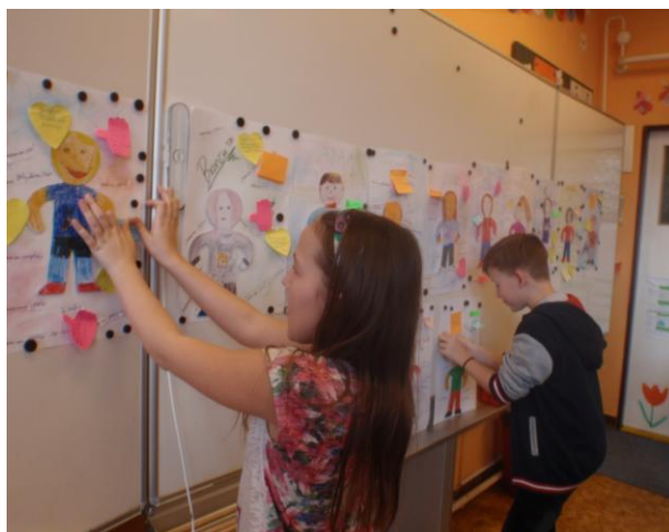
Obr. 8: Lepení vzkazů, ZŠ Klíč Česká Lípa, 16. 9. 2014