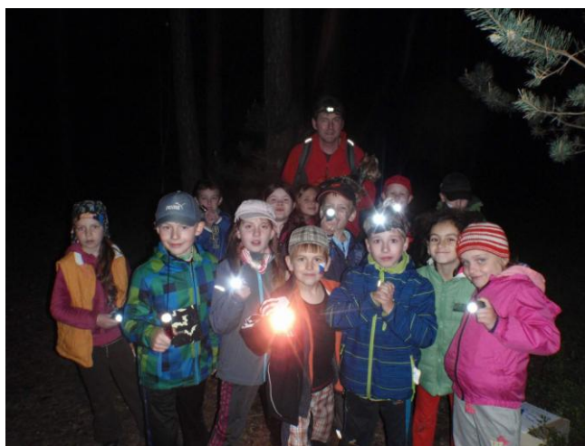
Obr. 49: Stezka odvahy, Staré Splavy, 25. 9.2014