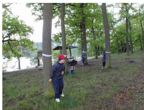
Obr. 37: Hra „Hejbejte se“, S. Splavy, 24. 9. 2014

Jaké jste měli pocity, když jste přebíhali?