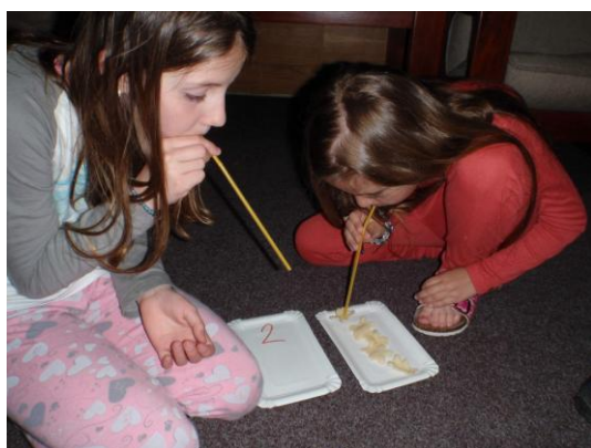
Obr. 31: Slavnost - soutěž, S.Splavy, 23.9.2014

„Dneska jste, moji trosečníci, zažili hodně tvořivý den. Vyrobili jste si svého nového kamaráda „Pátka“ a podařilo se vám i střílet prakem. Zasloužíte si proto dnešní den pořádně oslavit! Připravila jsem malou diskotéku s tancem a soutěžemi!“