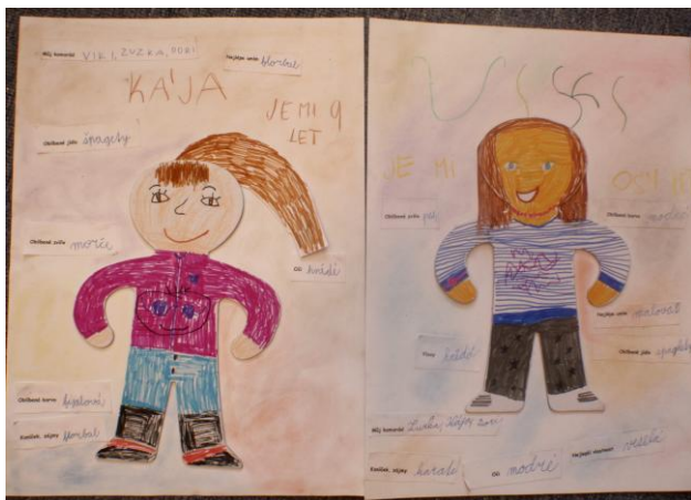
Obr. 7: To jsem já, ZŠ Klíč Česká Lípa, 15. 9. 2014

třídy i zrcadlo, tak ho neváhejte využít! Až svoji postavičku dokončíte, nalepíte ji na velkou čtvrtku, která bude podkladem pro váš plakát. Potom si přijdete pro připravené lístečky, na které si doplníte a dopíšete svůj popis podle všech bodů. Ty potom nalepíte na plakát. Dokončený plakát si připevníte na naši výstavku, která bude na tabuli. Můžete si tak postupně prohlížet všechny vytvořené plakáty a zjišťovat, srovnávat nebo vyhledávat, se kterým spolužákem máte něco stejného, společného nebo podobného.“