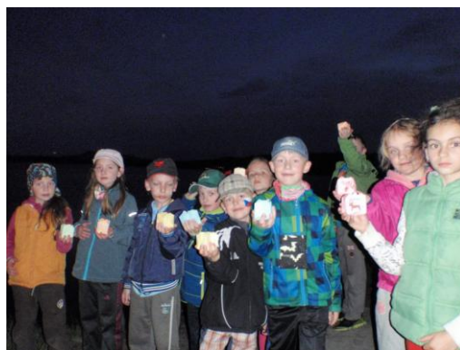
Obr. 45:Lampionek, 25. 9.2014

Chtěl by někdo někoho ocenit pře ostatními?