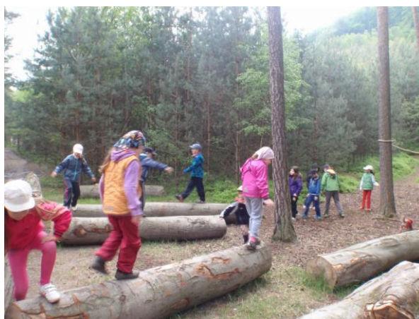
Obr. 42: Cvičení na kládách, S. Splavy, 25. 9.2014