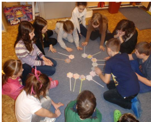
Obr. 5: Kytička vlastností, ZŠ Klíč Č.Lípa, 11. 9. 2014