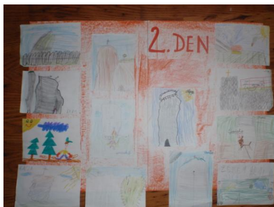
Obr. 28: Rituál, Staré Splavy, 22. 9. 2014