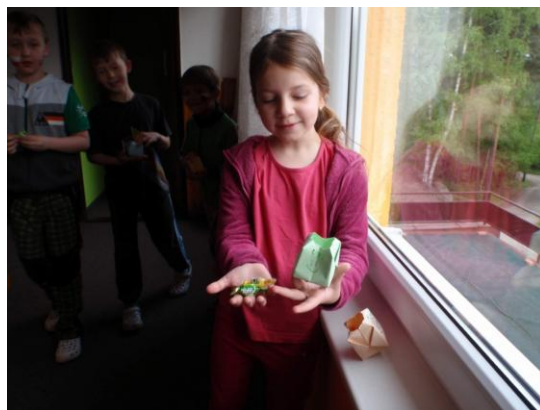
Obr.22: Sladké překvapení, S.Splavy, 22. 9.2014