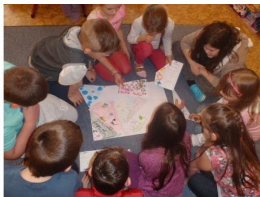
Obr. 11: Síla skupiny, ZŠ Klíč Česká Lípa, 17. 9. 2014