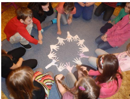
Obr. 3: Prsty – moje silné a slabé stránky, ZŠ Klíč Česká Lípa, 9. 9. 2014

Na závěr si všichni položíme svoji ruku do společného kolečka. „Cítíte, jak jste každý z vás výjimečný? Každý z vás našel na sobě pět silných stránek. To je úžasné! Bylo by skvělé, kdyby se teď všechny naše ruce spojily a vzájemně si pomáhaly.“ Děti si ze svých papírových dlaní vytvoří společný kruh tak, aby se všechny vzájemně dotýkaly. „Cítíte, jak jste nyní společně silní? Společně toho hodně dokážete!“