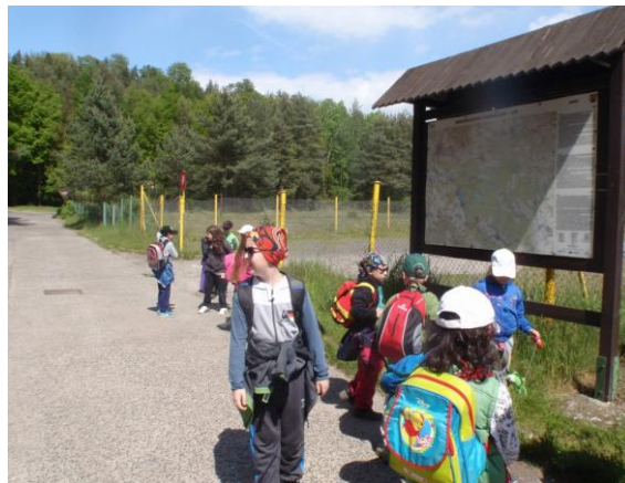
Obr. 25: Pozorování zvěře, S.Splavy 22.9.2014 Obr. 26: Plán ostrova, St. Splavy, 22. 9. 2014