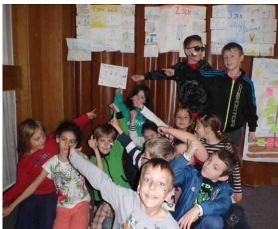
Obr. 54: Spokojenost Staré Splavy, 26. 9.2014