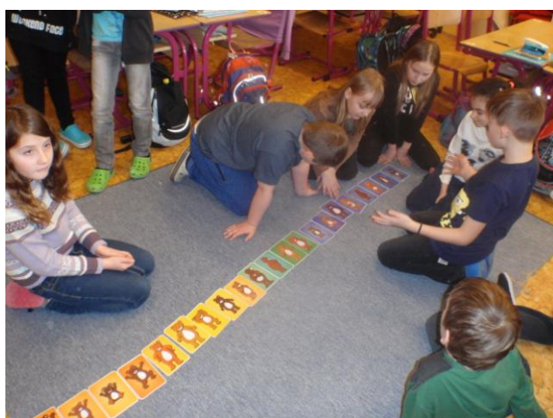
Obr. 2: Stupnice pocitů, ZŠ Klíč Česká Lípa, 8. 9. 2014