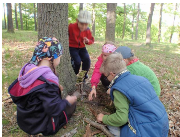
Obr. 14: Stavba domečků, Staré Splavy, 21. 9. 201