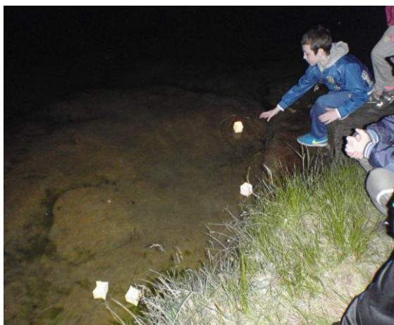
Obr. 46:Vypouštění , S. Splavy,25.9.2014

Cestou zpátky do našeho areálu už byla tma. Děti věděly, že je tuto noc čeká stezka odvahy. Začaly se vzájemně strašit a vyprávět si strašidelné příběhy.