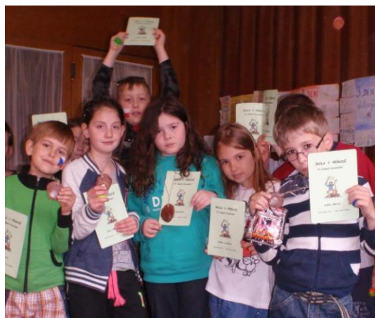
Obr. 55: Ocenění, Staré Splavy, 26. 9.2014