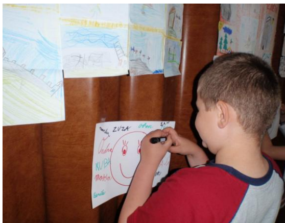
Obr. 52: Zápisi smajlíků, S. Splavy, 26. 9.2014

„Vyberte si jeden symbol, ke kterému napíšete svoje jméno podle toho, jak se vám na ostrově líbilo. Podepište se a řeknete, jak jste se tady cítili, co se vám líbilo, co nelíbilo, co nového jste získali nebo dokázali. Potom si přijdete ke mně pro svůj diplom a trosečnický amulet.“