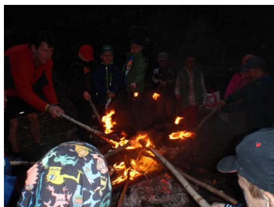
Obr.39: Dřevěné louče, 24. 9. 2014 Obr. 40: Trosečnickův slib, 24. 9. 2014