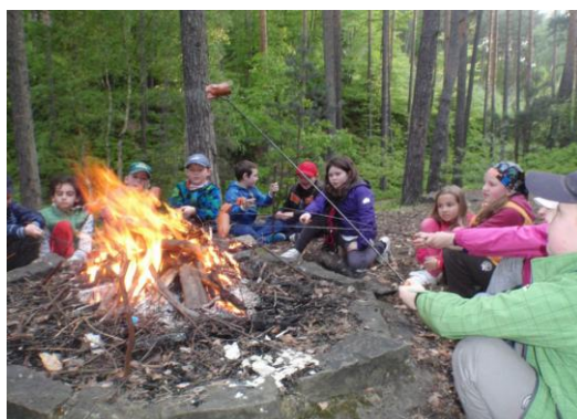
Obr. 38: Opékání buřtů, S. Splavy, 24. 9. 2014

„Vítám mezi námi samotného Robinsona! Přišel vám slavnostně zapálit oheň!“ Robinson se pečlivě po všech dětech rozhlíží a řekne: „Po celou dobu na ostrově vás pečlivě sleduji a musím vás moc pochválit! Dokázali jste už spoustu věcí! Proto jsem všem přinesl vlastnoručně vyrobené dřevěné louče, s kterými teď můžete složit Trosečnickův kamarádský slib!“