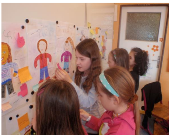
Obr. 9: Čtení vzkazů, ZŠ Klíč Česká Lípa, 16. 9. 2014