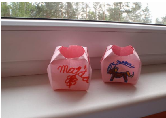
Obr.21: Krabička, Staré Splavy, 22.9.2014

Na budíček jsem dětem pouštěla pohádkové písničky. Hned jak se všichni probudily, běžely se podívat do svých krabiček, jestli tam na ně čeká překvapení.