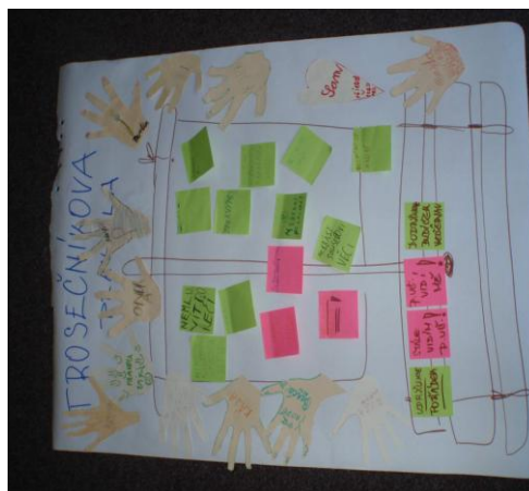
Obr.18: Pravidla, Staré Splavy, 21. 9.2014