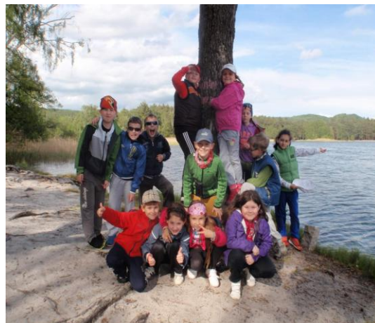
Obr.12: Bouře na lodi, S.Splavy, 21. 9.2014 Obr.13: Trosečníci na ostrově, S.Splavy,21.9.2014