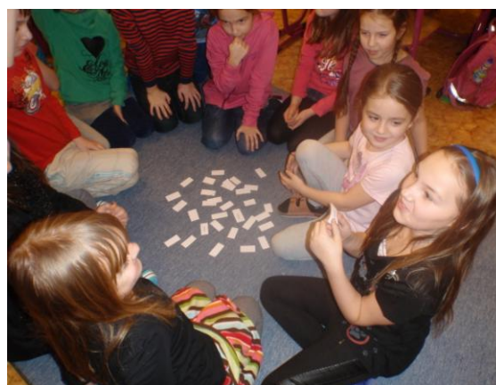
Obr. 4: Kladné a záporné vlastnosti – kartičky, ZŠ Klíč Česká Lípa, 10. 9. 2014