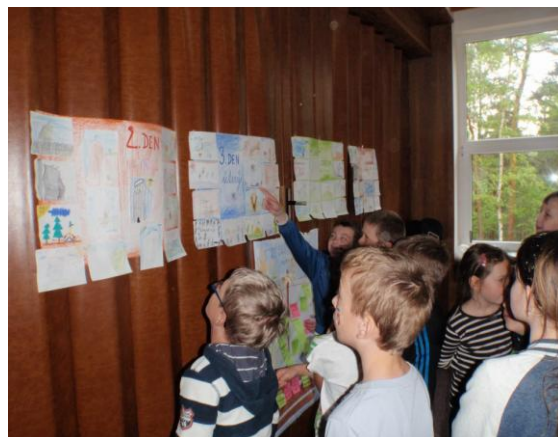
Obr. 53: Rekapitulace, S. Splavy, 26. 9.2014