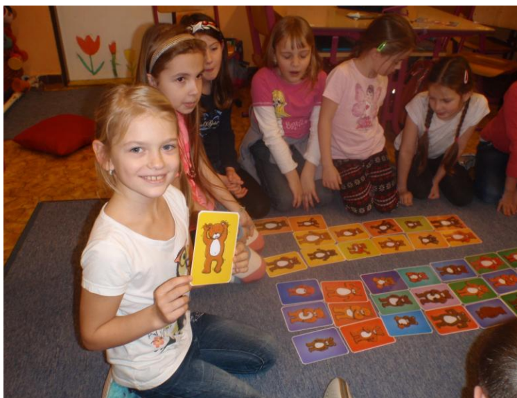
Obr. 1: Poznáváme emoce - karty medvídků, ZŠ Klíč Česká Lípa, 8. 9. 2014

Na koberci jsou nyní rozloženy všechny karty medvídků s emocemi. Každý žák si vybere jednoho medvídka podle toho, jak se právě teď cítí a poví nám, jak se cítí jeho medvídek.