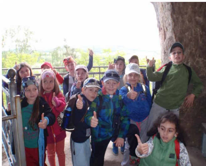
Obr. 27: Hrad Jestřebí, Jestřebí, 22. 9. 2014