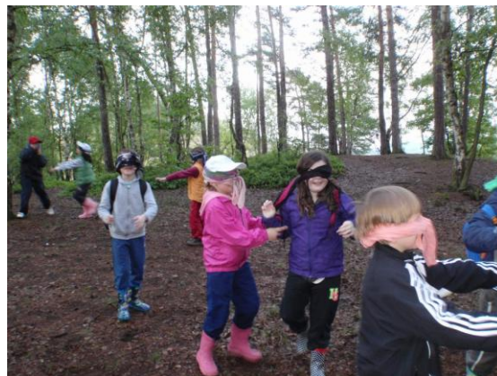
Obr. 36: Hra „Upíři“, Staré Splavy, 24. 9. 2014