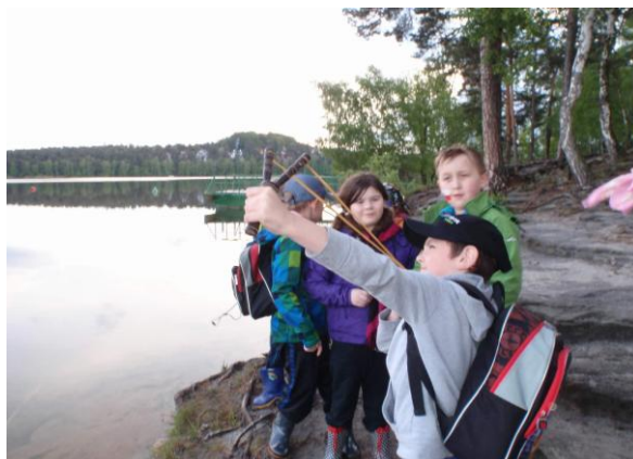
Obr. 30: Hra na lovce, Staré Splavy, 23. 9. 2014