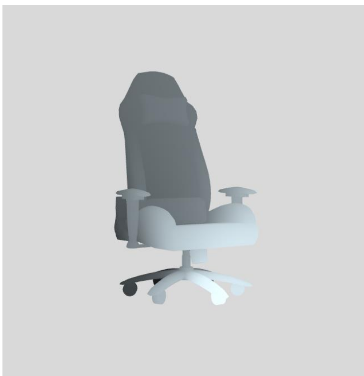
Obr. 8 Křeslo zobrazené vlastním OBJ parserem.

Řádek je zpracován příslušnou metodou a následně dané informace o modelu uloženy do datové struktury, která se následně předá k dalšímu zpracování. Tato datová struktura obsahuje data o modelu potřebné k jeho vykreslení. Další zpracování už probíhá kódem popsáním v předešlé kapitole s tím, že zpracovaná data modelu jsou předávána do daných bufferů.