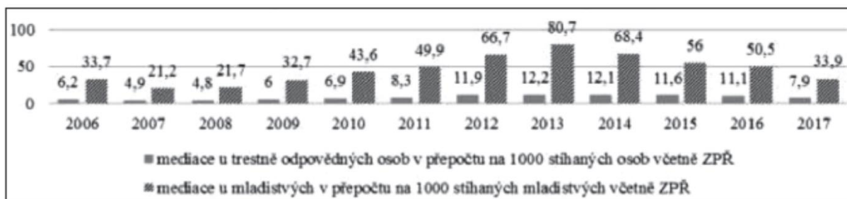
Obr. 3 Počet mediací v přepočtu na stíhané dospělé osoby (1. graf) a počty mediací v přepočtu na stíhané mladistvé osoby (2. graf) mezi lety 2006 – 2017. 197