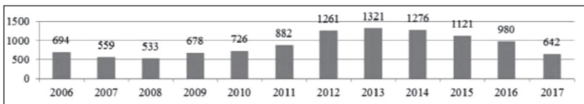
Obr. 2 Počty mediací realizovaných Probační a mediační službou mezi lety 2006 – 2017. 195196

Potenciál mediace a jejího přínosu pro pachatele a oběti trestných činů v České republice tak zůstává nadále nevyužit. Na druhou stranu, jak vyplývá z této diplomové práce, například z podkapitoly 5.1, restorativní programy, zejména pak mediace, jsou v českém právním prostředí považovány za moderní trend a mezi odbornou veřejností panuje shoda na tom, že je potřeba tento trend reflektovat a restorativní programy v České republice dále rozvíjet. Tomu napovídá také skutečnost, že Probační a mediační služba usiluje o zřízení nových programových center, o navyšování počtu odborných zaměstnanců Probační a mediační služby a co je podstatné, o sjednocení postupu resortů v otázce péče o oběti trestných činů, mimo jiné sjednocení postupu resortů v otázce mediace v trestních věcech 194 . Pozitivní je dále také skutečnost, že stále probíhá debata o rozšíření uplatňování mediace a dalších restorativních programů ve vykonávacím řízení, k čemuž také z posledních dostupných dat česká trestní justice směřuje.