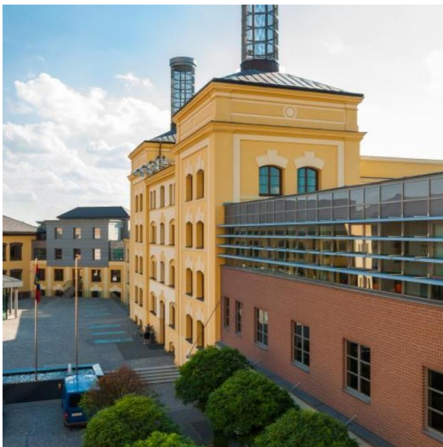
Obrázek 3 - Krajský úřad Královéhradeckého kraje