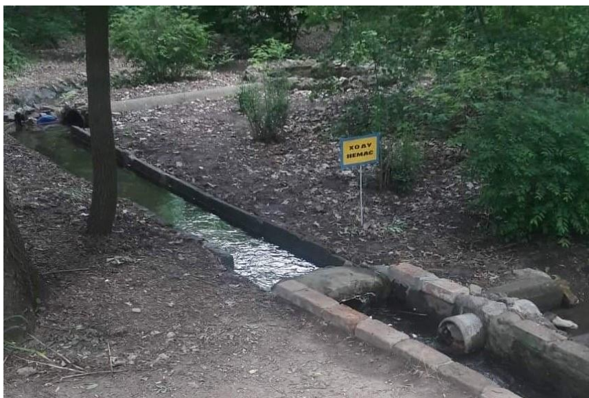
Obrázek 7 - Zavlažovací systém oázy.

Koncem 19. století, kdy celá oblast patřila milovníku přírody Friedrichu Falz-Feinovi, začaly na rozlehlých stepích vznikat výběhy pro stepní zvířata, hned poté byla založena zoologická a posléze i botanická zahrada (askania-nova-zapovidnik, 2020). Zoologická zahrada byla unikátní svou nadčasovostí, byla jednou z nejstarších v Evropě, svou rozlehlostí a také i nabídkou exotických druhů zvířat a ptactva, které zde byly k vidění (discover-ukraine, 2020). V rozlehlé stepi se zakladateli, díky důmyslnému zavlažovacímu systému (viz. Obrázek 7), podařilo vybudovat oázu s rozlohou 167 hektarů s několika vodními plochami bez přírodního přítoku (askania-nova-zapovidnik, 2020). Na tomto webu je uvedeno, že se zde nachází více než 500 druhů rostlin a každoročně sem ze severu přilétá