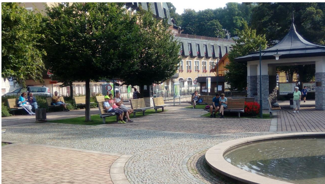
Obrázek 2 - Lázeňští hosté odpočívající na kolonádě v centru města.

Hned ze začátku výzkumu bylo velmi nesnadné samotné nalezení místních obyvatel. Po centru města se procházeli především lázeňští hosté či ostatní návštěvníci, což je zachyceno na následujícím obrázku. V kavárnách a restauracích pracovali lidé z okolních obcí. Z uskutečněných rozhovorů poté vyplynulo, že ačkoliv je v Janských Lázních nabídka pracovních pozic pestrá, a to především v odvětvích cestovního ruchu a služeb, místní obyvatelé za prací dojíždějí do větších měst, především do blízké Svobody nad Úpou nebo Trutnova.