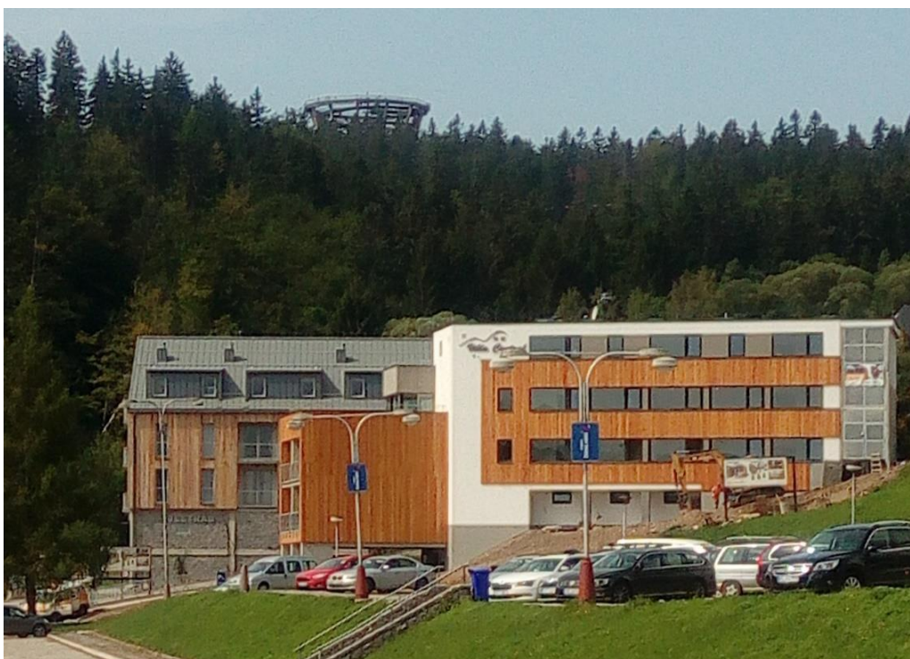
Obrázek 4 - Pohled na infocentrum s vyčnívající Stezkou korunami stromů v pozadí.

jiných měst. Ačkoliv zvažoval přestěhování se do většího města, prozatím svou budoucnost vidí zde, kde mu velmi imponuje místní horské prostředí a příroda. Jako vhodné změny uvedl především navýšení počtu obchodů a jejich nabídky. Sám uvedl podobnou situaci, kterou řeší v nedaleké Peci pod Sněžkou, kde existují dva obchody, jejichž sortiment je nejen pro místní nedostatečný, ale především i drahý. Jako další šanci na zlepšení pro místní obyvatele uvedl problematiku odpadu, který po sobě turisté zanechávají. Nově vystavěnou Stezku korunami stromů, která se tyčí nad městem (viz. Obr. 4), nevnímá nijak negativně, protože se davy návštěvníků pohybují především v její bezprostřední blízkosti a do města často nescházejí (viz. Obr. 1, str. 24). Svůj vztah k turistům a cestovnímu ruchu popsal bez velkých emocí, kdy necítí ani nadšení, ale ani nevraživost.