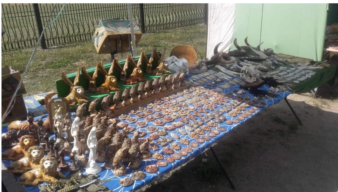
Obrázek 10 - Ukázka suvenýrů prodávaných v destinaci Askania Nova.

Posledním místním obyvatel, se kterým byl v rámci výzkumu proveden rozhovor, byl prodejce suvenýrů, respondent (č. 8). Byl to velmi pozorný a zkušený obchodník. Uvedl, že prodejem suvenýrů se živí již 20 let. Většina prodávaných výrobků obsahuje prvky zvířat ze zoologické zahrady. K vidění byly například ozdobné zvířecí rohy, paví peří a mnohé další, které jsou zachyceny na Obrázku č. 10. Jedná se o autentické suvenýry lokální výroby, které jsou propojeny s historickým a tradičním prostředím místa. Při zvýšeném prodeji by bylo nutné vyhnout se komodifikaci a komercializaci výrobků, což je popsáno v teoretické části v kapitole 3.3.1 Socio-kulturní dopady na život místních obyvatel.