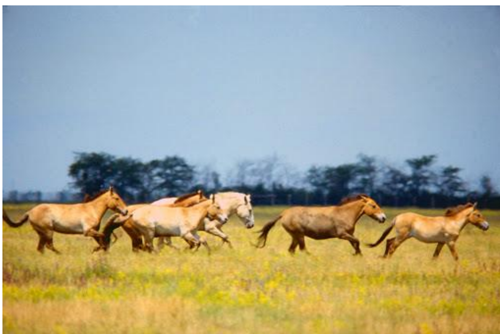
Obrázek 8 - Chov koně Převalského ve stepích Askania Nova.

Od roku 1919 je Askania Nova ve státním vlastnictví a od roku 1983 nese také označení národní park (askania-nova-zapovidnik, 2020). Askania Nova je celosvětově proslulá díky volnému chovu koně Převalského (viz. Obrázek č. 8), posledního druhu divokého koně na světě, který je zde chován již od roku 1899 (askania-nova-zapovidnik, 2020). Právě odsud, jak je na stránkách psáno, je poté vypouštěn zpět do volné přírody, konkrétně do stepí Mongolska. Na stránkách je také uvedeno, že právě díky této biosférické rezervaci UNESCO a vědeckému výzkumu, který je zde veden, se daří navracet mnoho druhů zvířat a ptactva zpět do volné přírody.