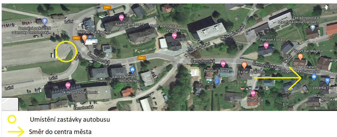
Obrázek 1 - Umístění autobusové zastávky a centra města v Janských Lázních na mapě.

K příjezdu do destinace byla využita autobusová hromadná doprava. Ačkoliv byl pracovní den, autobusová sedadla byla z velké části obsazená, a to především návštěvníky, kteří jeli navštívit Černou horu nebo Sněžku. Několik návštěvníků vystoupilo na zastávce nad Janskými Lázněmi, nescházeli ovšem dolů do centra města, ale naopak se vydali nahoru do hor. Jedna ze zastávek autobusu je vhodně umístěna nad centrem města, čímž se místní obyvatelé a turisté nemusí dostat do vzájemného kontaktu. Umístění zastávky a centra města je zachyceno na následujícím obrázku.