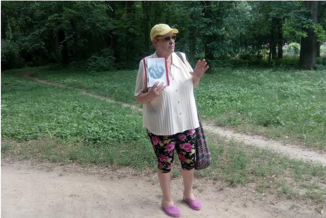
Obrázek 9 - Prohlídka areálu s výkladem průvodkyně.

Výklad průvodkyně se týkal historie založení areálu, života zakladatele Fridricha Falz-Feina, místní fauny i flory, vzniku oázy, botanické a zoologické zahrady a zapsání do sítě biosférických rezervací UNESCO. Průvodkyně byla velmi potěšena vznikem bakalářské práce s tematikou problematiky rozvoje cestovního ruchu v destinaci Askania Nova. Na otázky rozhovoru odpovídala respondentka (č. 6) velmi erudovaně a vždy si odpovědi pečlivě promyslela.