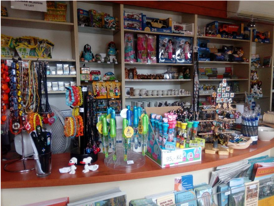
Obrázek 5 - Ukázka nabízených suvenýrů v infocentru Janských Lázní.

Pracovníci infocentra přijde výskyt cestovního ruchu a profit z něho v tomto místě přirozený a chování návštěvníků nevnímá nijak negativně. Problémy jí občas způsobuje logistika práce, kdy se věnuje návštěvníkům infocentra, odpovídá na dotazy potenciálních návštěvníků přes telefon, a ještě je v kompetenci infocentra obsluha ubytovacího rezervačního systému. Všechny tyto činnosti podle ní není jednoduché kvalitně zabezpečit především při velkém počtu návštěvníků v hlavní sezóně.