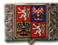
Čepicový státní znak