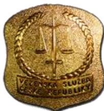
Resortní znak Vězeňské služby ČR