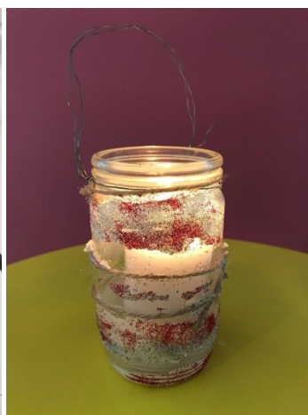
Obr. č. 18 Hotový výrobek