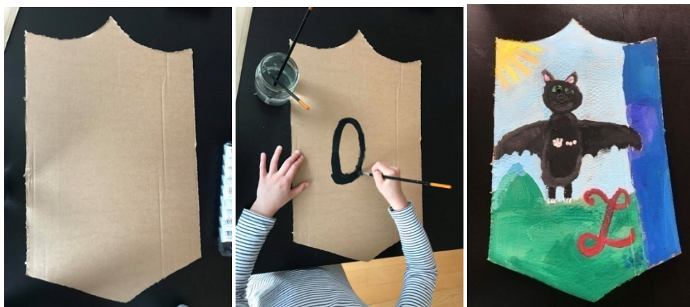
Obr. č. 6, 7 a 8 Výroba štítu