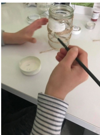
Obr. č. 17 Výroba lampionu