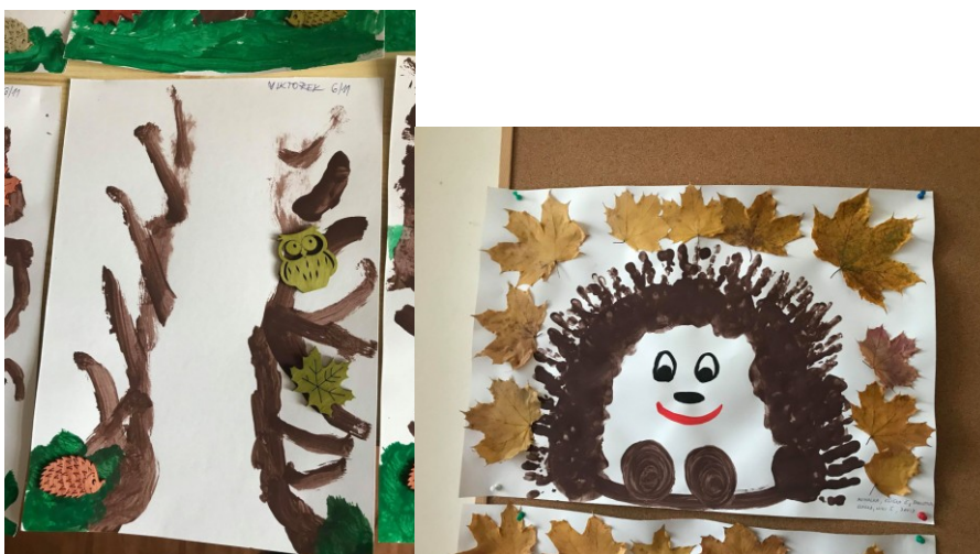
Obr. č. 4 a 5 Práce dětí