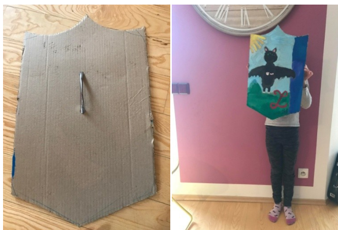
Obr. 9 a 10 Hotový výrobek