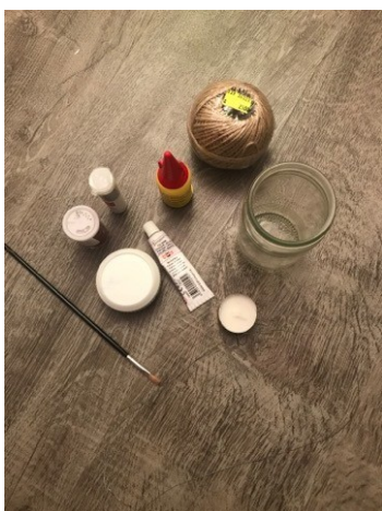
Obr. č. 16 Pomůcky