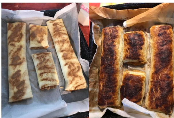
Obr. č. 14 Výrobek před pečením Obr. č. 15 Upečený štrúdl