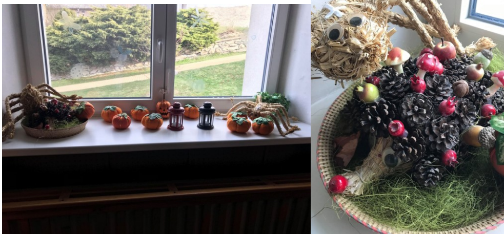
Obr. č. 2 a 3 Výzdoba šatny

Další v pořadí proběhl rozhovor s paní ředitelkou z Mateřské školy Skřípov. I v tomto případě se jedná o mateřskou školu na vesnici a také se věnují téměř všem lidovým zvykům a tradicím. Společně s mateřskou školou na některých zvycích a tradicích spolupracuje i vesnice. Děti zvyky a tradice baví, mají o ně velký zájem, rády se dozvídají nové věci. I tato mateřská škola společně s dětmi oslavila 100 let výročí od vzniku Československého státu, jak sázením lípy, tak i různými aktivitami, pojíctími se ke vzniku republiky. Mezi další zvyky a tradice podzimu zařazují svatého Václava, Strašidelný týden (Halloween), Dušičky, svatý Martin, Mikuláš a v neposlední řadě advent.