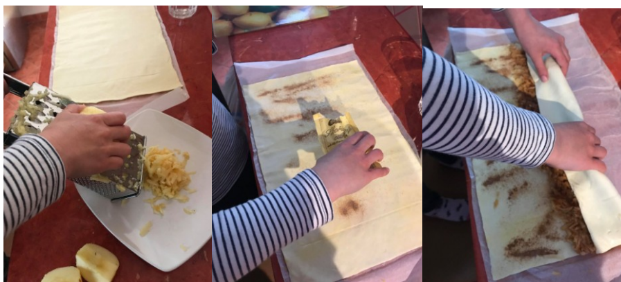
Obr. 11, 12 a 13 Pečení štrúdlu