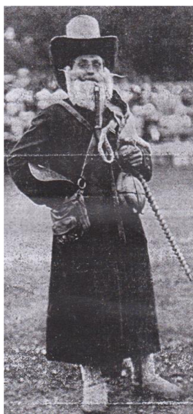
Obrázek 3: Žid 149

Je tak patrné, že působil velmi zámožně. Také se svým bohatstvím chlubil a tím si chtěl nevěstu získat. Přesněji chtěl ji koupit společně s peřinami. V Příbylově textu s ním nevěsta chtěla odejít. On si ji však musel vyzkoušet, jestli je chytrá, a tak jí zkouší například z jazyků. Zde byla uvedena němčina a maďarština. 150 Židovo zkoušení mělo tak ženichovi a ostatním svatebčanům ukázat, že nevěsta je chytrá, a v životě si dokáže poradit i s těžkou situací. Ve Václavkově textu však dochází na situaci, kdy ženich měl žida při kupování peřin přeplatit. 151 Tím se tak mělo poukázat na ženichovo bohatství, a že má možnost nabídnout nevěstě více než onen žid. Snaha žida koupit si nevěstu se také dá interpretovat jako ukázka hostům, že ženich ani nevěsta se nenechají oklamat nabídkou lehkého výdělku bez žádné práce a jedná se o poctivé lidi. Celá situace s židem zároveň byla pro všechny zábavou, neboť se před nimi objevila postava, která v té době zřejmě čelila určitým společenským předsudkům a posměchu. Není tak divu, že dodnes existují přirovnání, která odkazují na židovskou chamtivost a přílišnou spořivost.