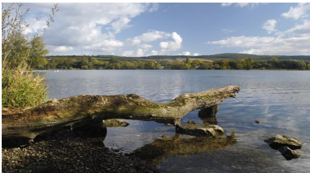
Obrázok 6: Sĺňava