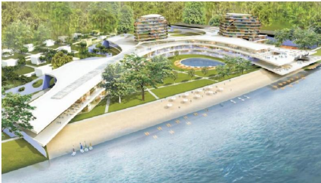
Obrázok 9: Vizualizácia projektu Bana Thermal

projekt v skutočnosti zrealizuje alebo zostane iba pekným nesplneným snom nie jedného Piešťanca a skončí založený, ako iné podobné projekty, niekde v zásuvke vlastníkov firmy.