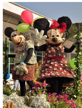
Autor: František Halás