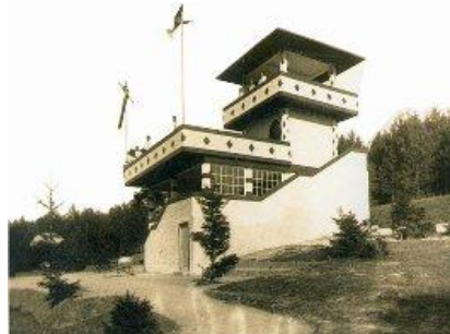
Obrázok 10: Bývalá Červená veža

výhľad na honosný kúpeľný komplex.“ (www.pnky.sk, cit. 202-02-28). Začiatkom 90. rokov bol tento objekt sčasti zdemolovaný s cieľom renovácie, no žiadna sa do dnešného dňa neudiala. Namiesto kedysi vyhľadávanej vyhlídkovej veže tu človek nachádza schátranú bídu obkolesenú neudržiavaným lesoparkom, v ktorom sú polámané konáre, vyvážané stromy a neporiadok (Príloha G).