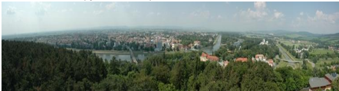
Obrázok 1: Panoramatický pohľad na Piešťany