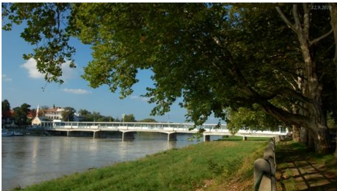
Autor: Miriama Šiveňová

Pri vstupe na most z mestskej časti je od roku 1933 umiestnený symbol piešťanský kúpeľov a mesta – bronzová socha Barlolámača v nadživotnej veľkosti odliata podľa sochára R. Kühmayera (Obrázok 5). Návrh dnešnej podobizne sa však zrodil ešte v roku 1894, kedy Ludovít Winter chcel vyjadriť uzdravenie jedinou figúrou, ktorá by