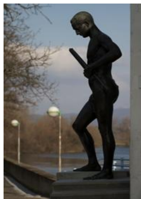
Autor: Erik Ďuriš