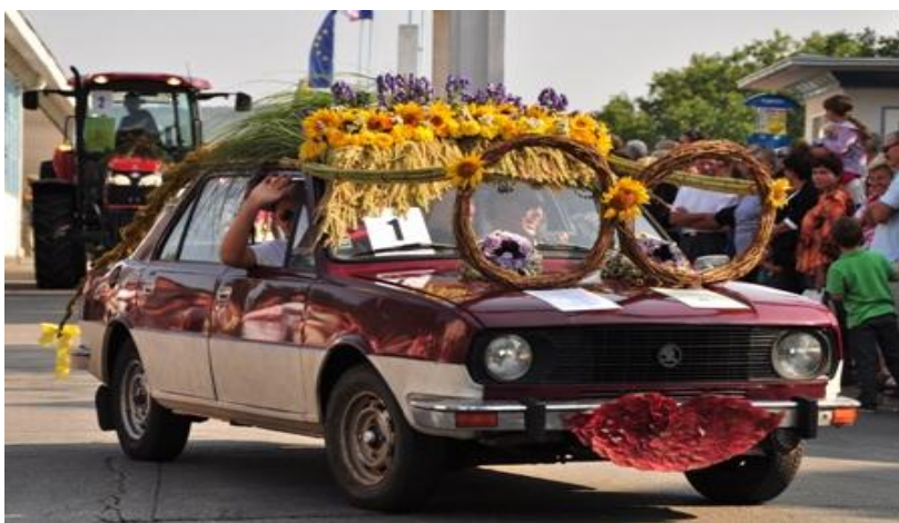
Autor: František Halás