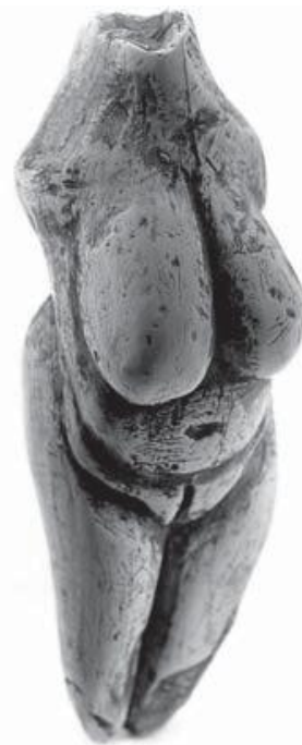
Obrázok 2: Moravianska Venuša

Najstaršie stopy osídlenia súčasných Piešťan a ich blízkeho okolia siahajú až do praveku. V tomto období sa tu, v blízkosti nezamrzajúcich horúcich prameňov, usadil pračlovek neandertálskeho typu – zberač plodov a lovec zveri, ktorý tu zanechal prvé kamenné nástroje. Osídlenie tohto územia v mladšom období staršej doby kamennej dosvedčuje jeden z najvzácnejších archeologických nálezov – soška ženského tela bez hlavy, rúk a chodidiel vyrezaná z mamutoviny, nazvaná Moravianska Venuša (Obrázok 2). Vhodné prírodné podmienky vytvárali priaznivé prostredie pre život ľuďom rozličných kultúr a etnických skupín. Títo sa tu striedali počas nasledujúcich vývojových období až do tzv. veľkého sťahovania národov, kedy sa tu postupne začali usádzať slovanské národy (ŠÍPOŠ, 1992).