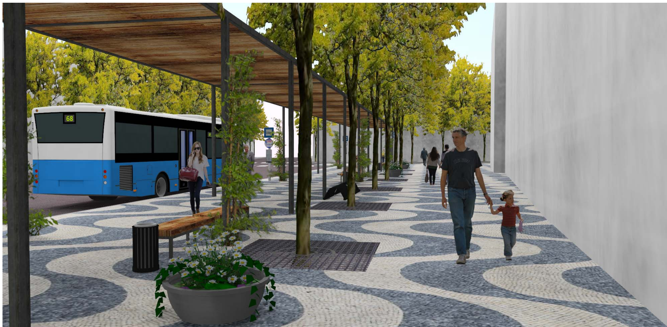
Perspektiva č. 2 - Pohled od Riegerova pramene k budově České spořitelny