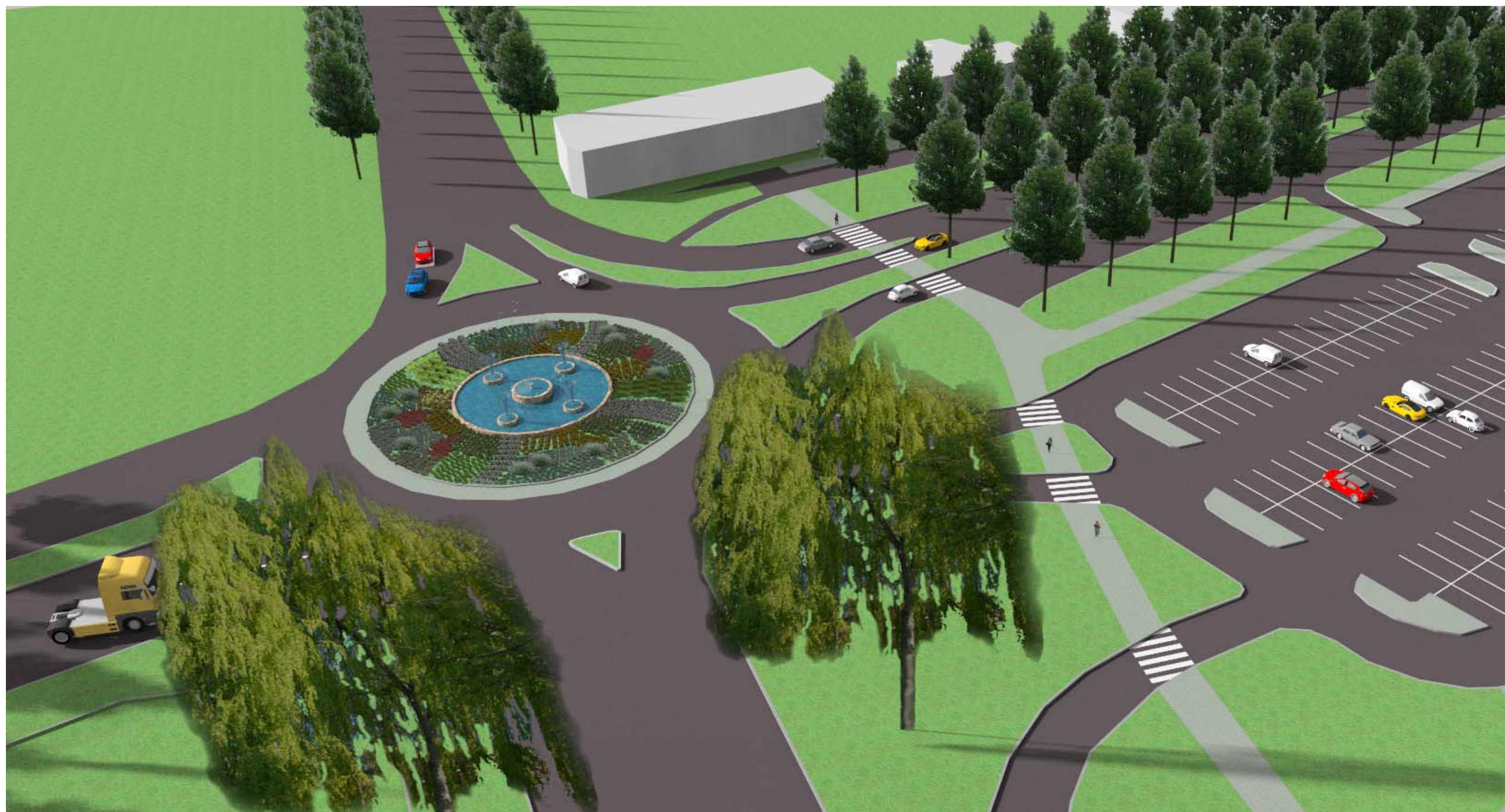
Ptačí pohled od Poděbrad