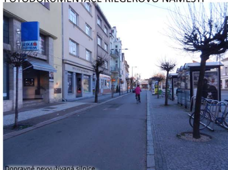
Dopravně nevyužívaná silnice