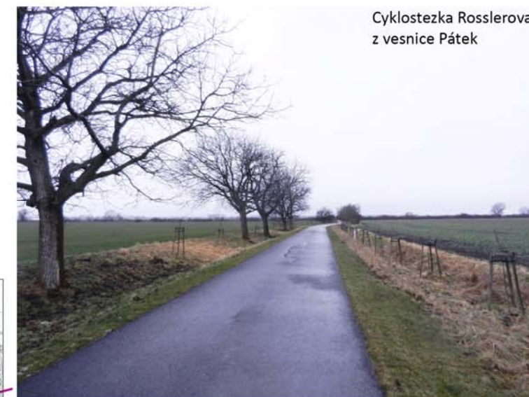
Cyklostezka Rosslerova z vesnice Pátek