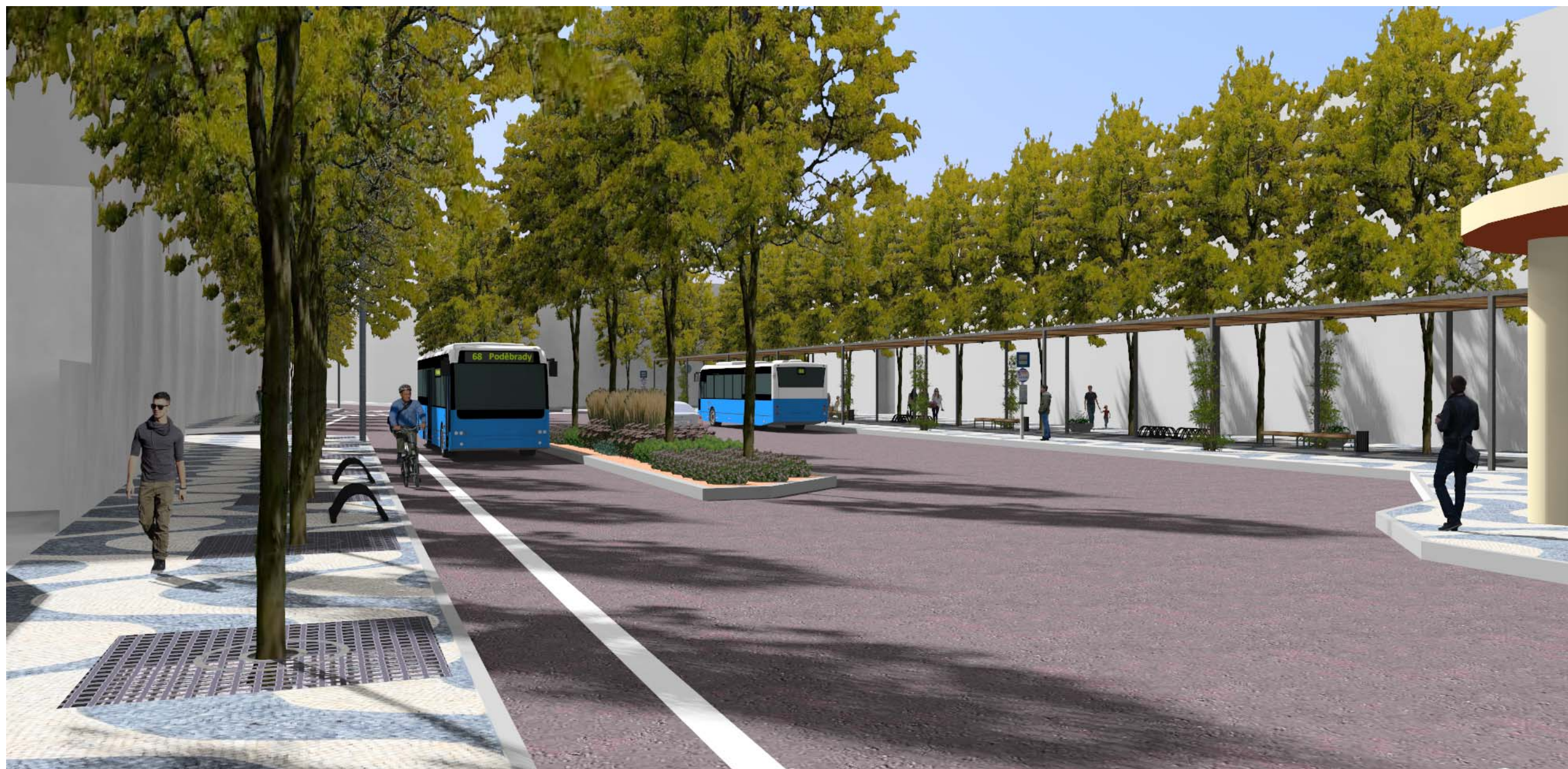
Perspektiva č. 6 – Pohled na náměstí z ulice Fügnerova