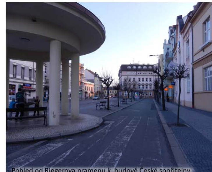
Pohled od Riegerova pramenu k budově České spořitelny