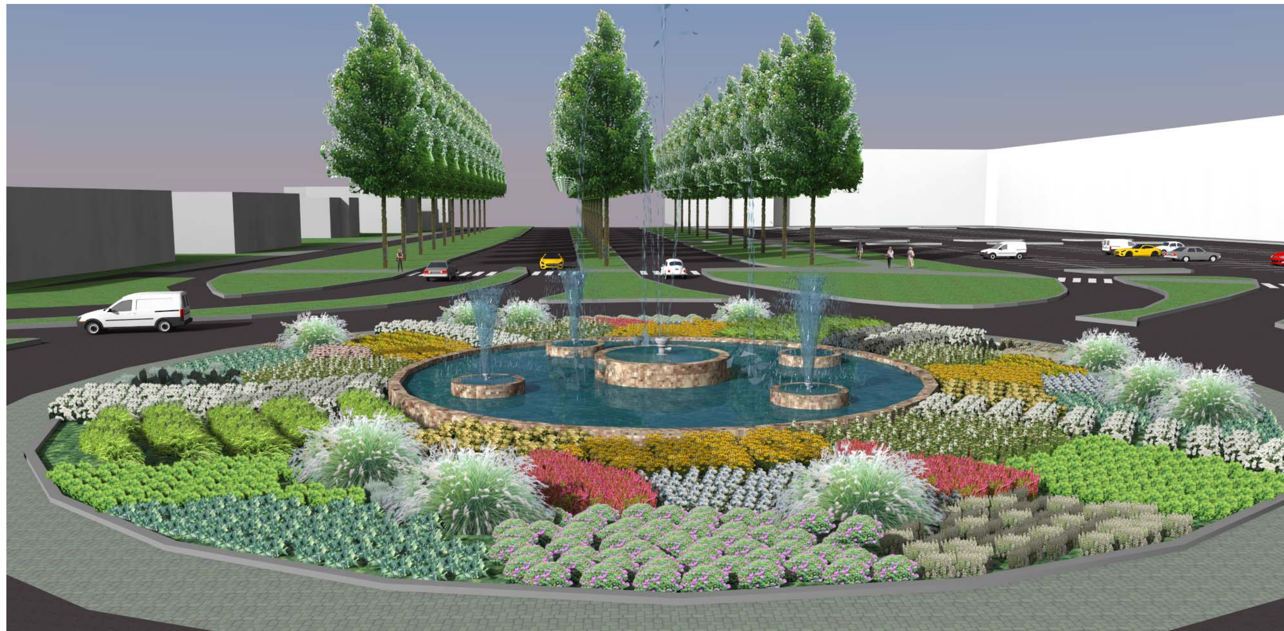
Detailní pohled na fontánu a reprezentativní záhon