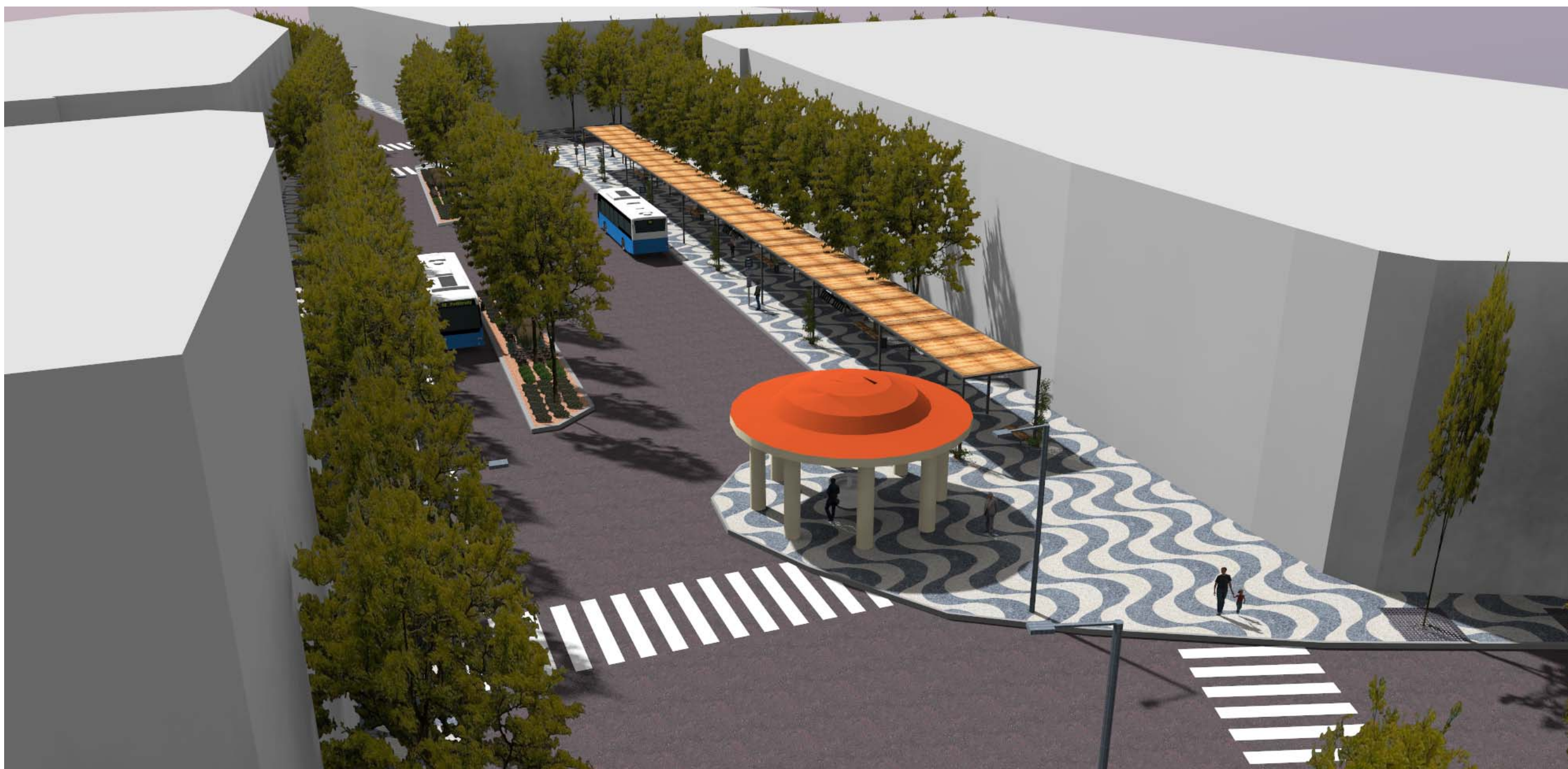
Ptačí pohled Riegerovo náměstí