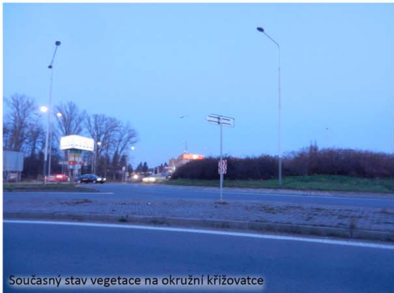
Současný stav vegetace na okružní křižovatce