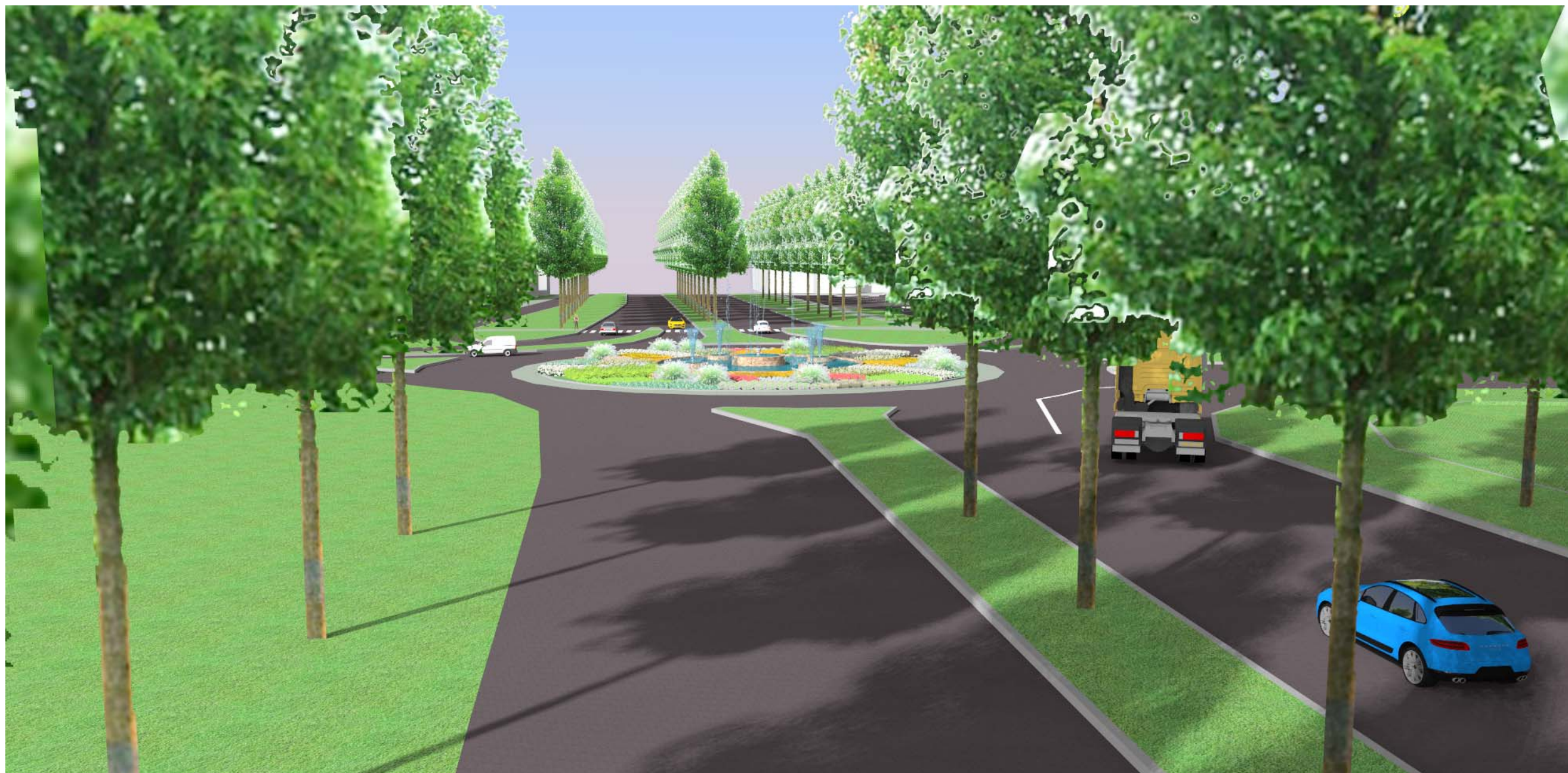
Perspektiva č. 2 – Pohled z Kolína