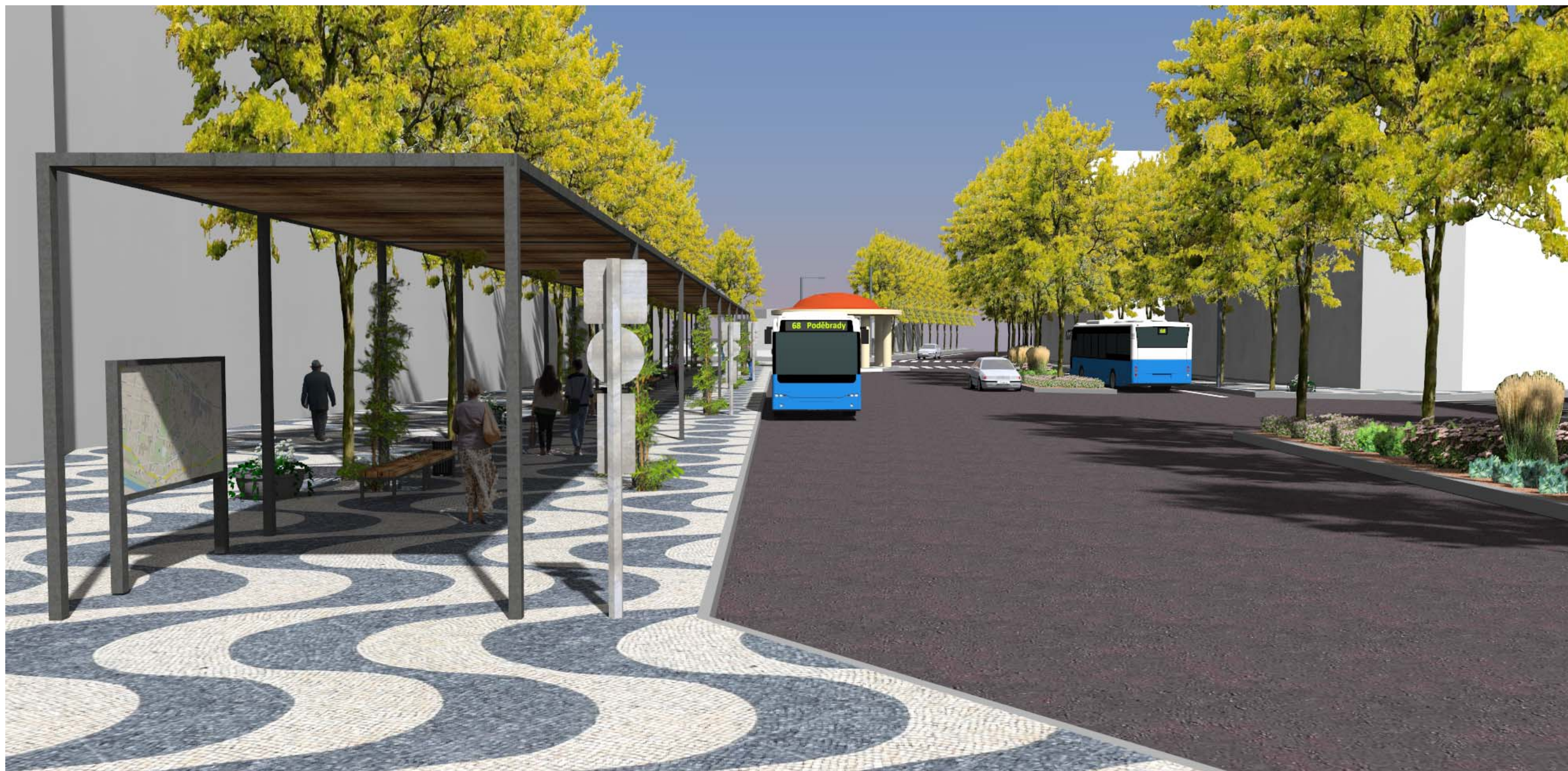
Perspektiva č. 3 – Pohled na autobusovou zastávku