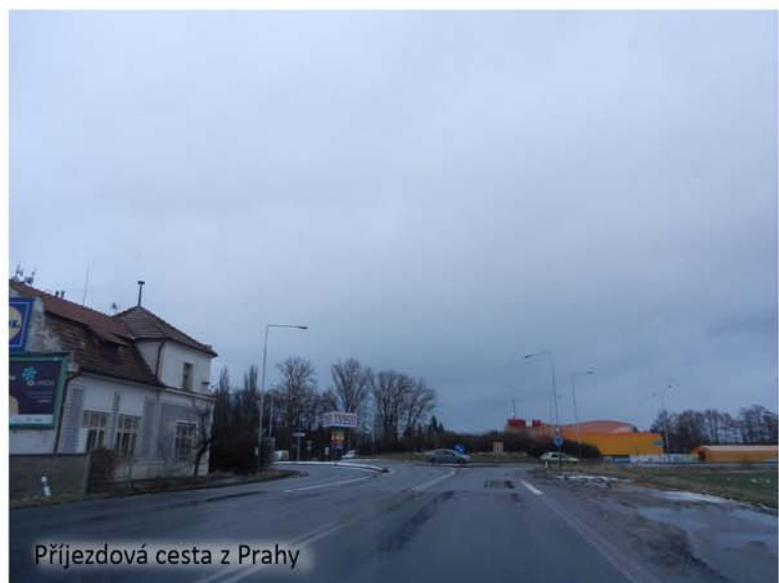
Příjezdová cesta z Prahy