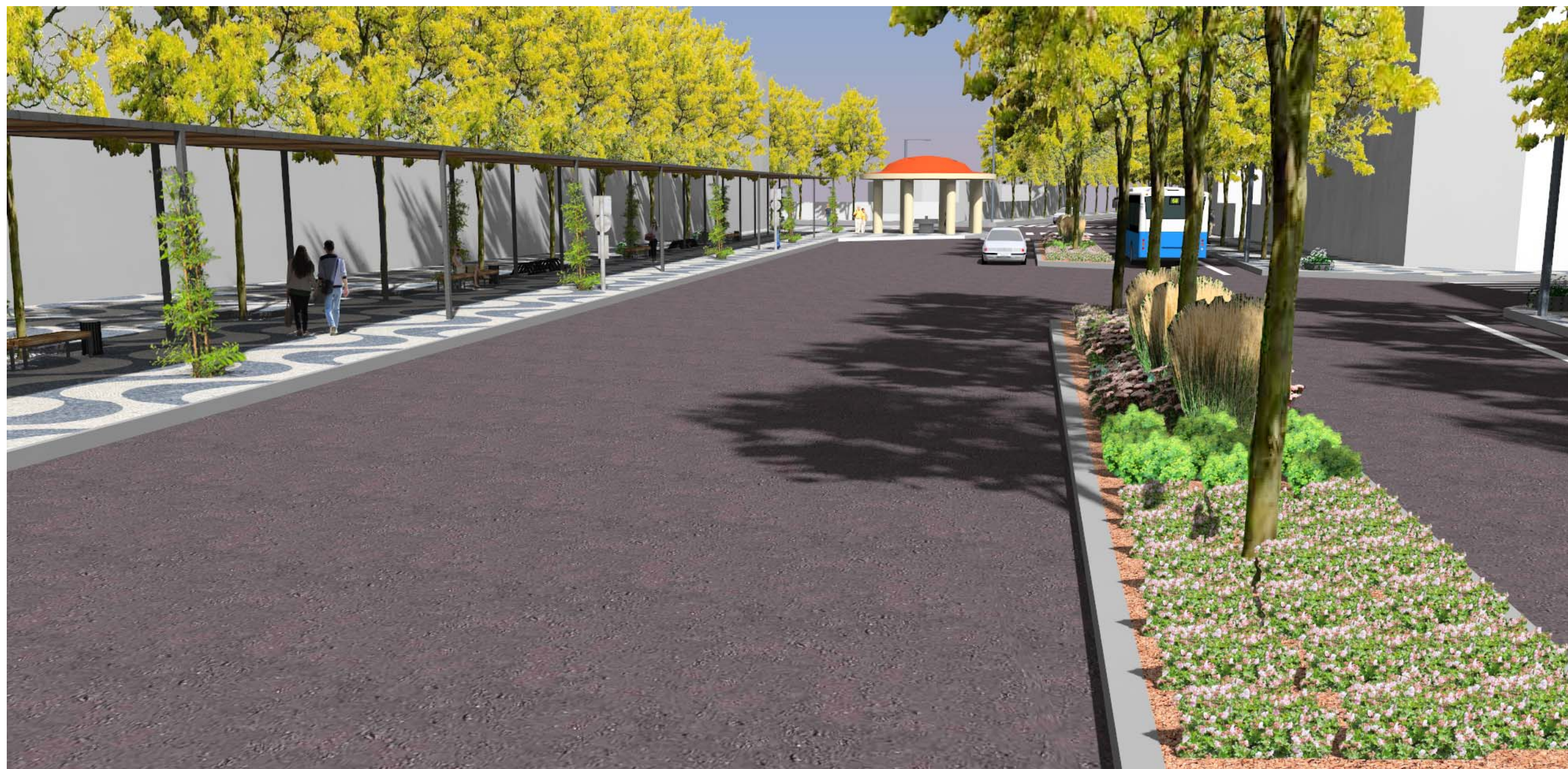
Perspektiva č. 5 – Pohled na středový pás s trvalkovým záhonem