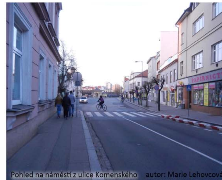
Pohled na náměstí z ulice Komenského