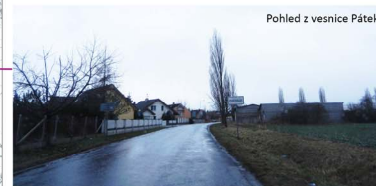
Pohled z vesnice Pátek