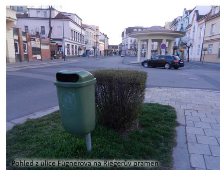
Pohled z ulice Fügnerova na Riegerův pramen