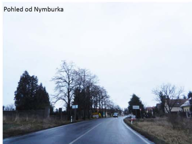
Pohled od Nymburka