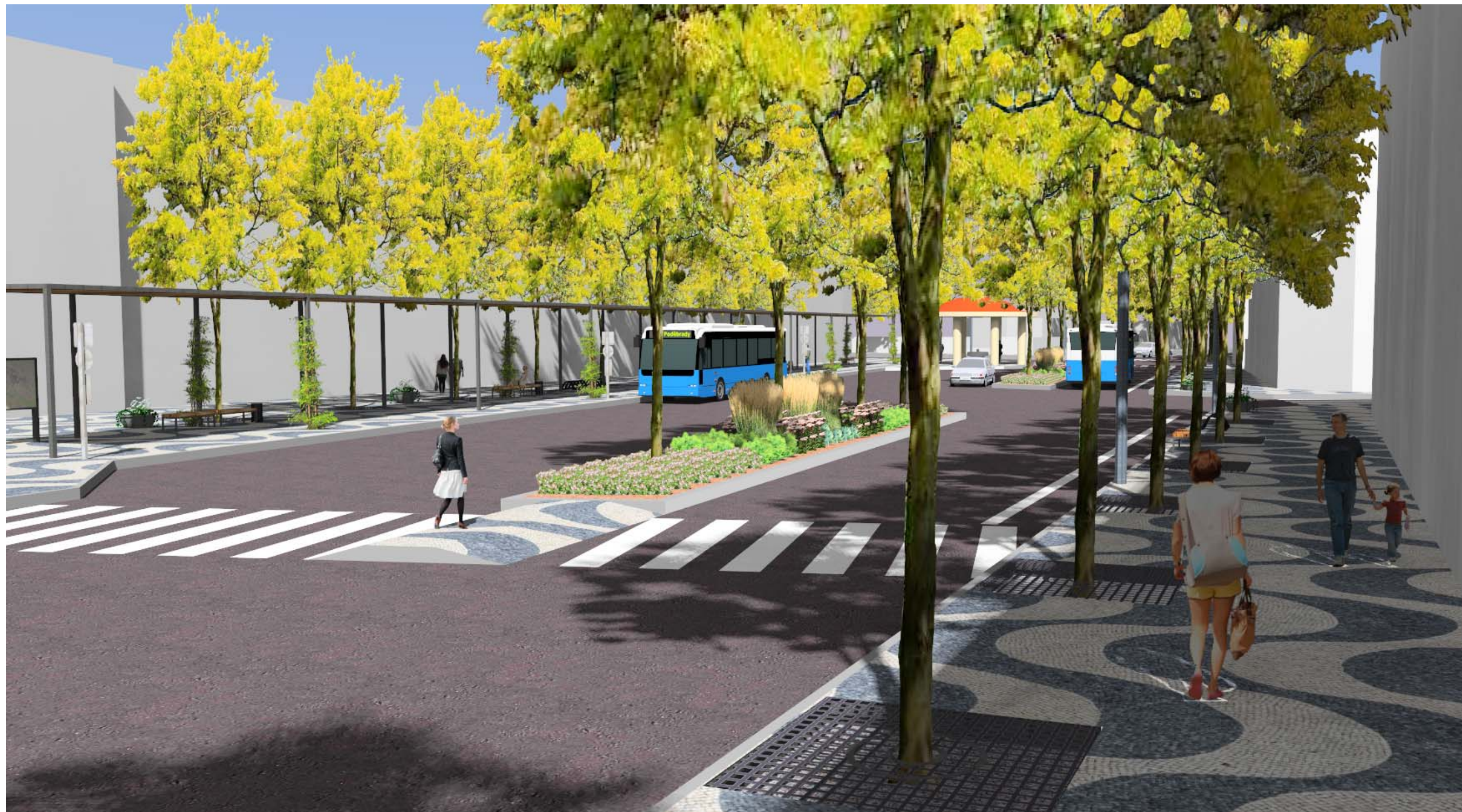
Perspektiva č. 1 - Pohled na náměstí z ulice Komenského