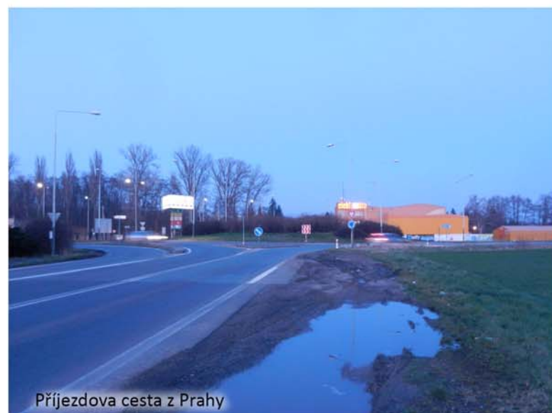
Příjezdová cesta z Prahy