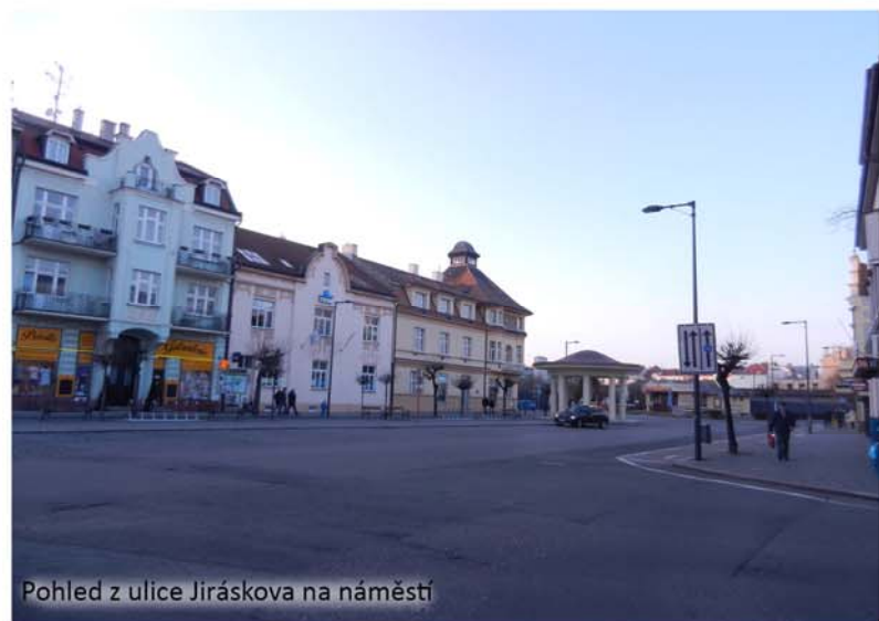
Pohled z ulice Jiráskova na náměstí