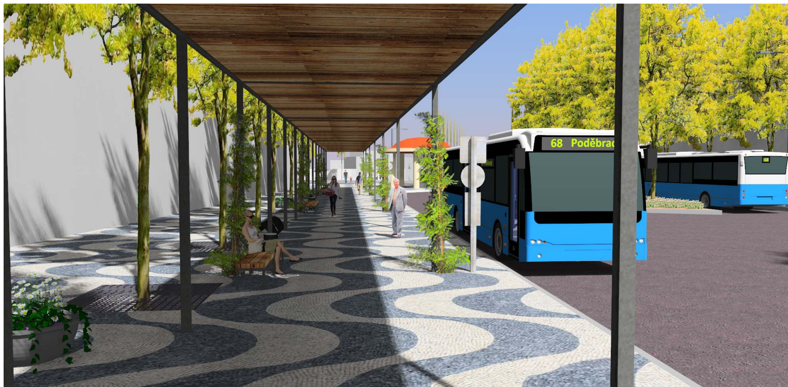
Perspektiva č. 4 – „Kolonáda“