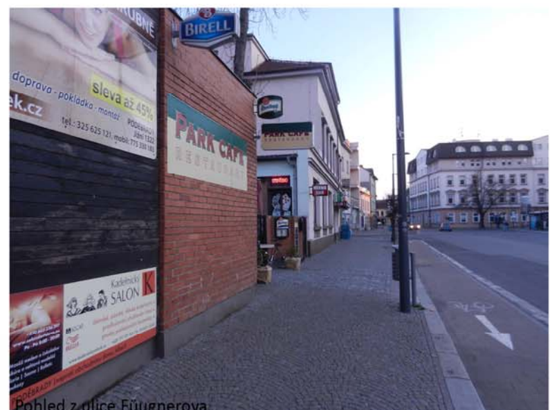
Pohled z ulice Fügnerova