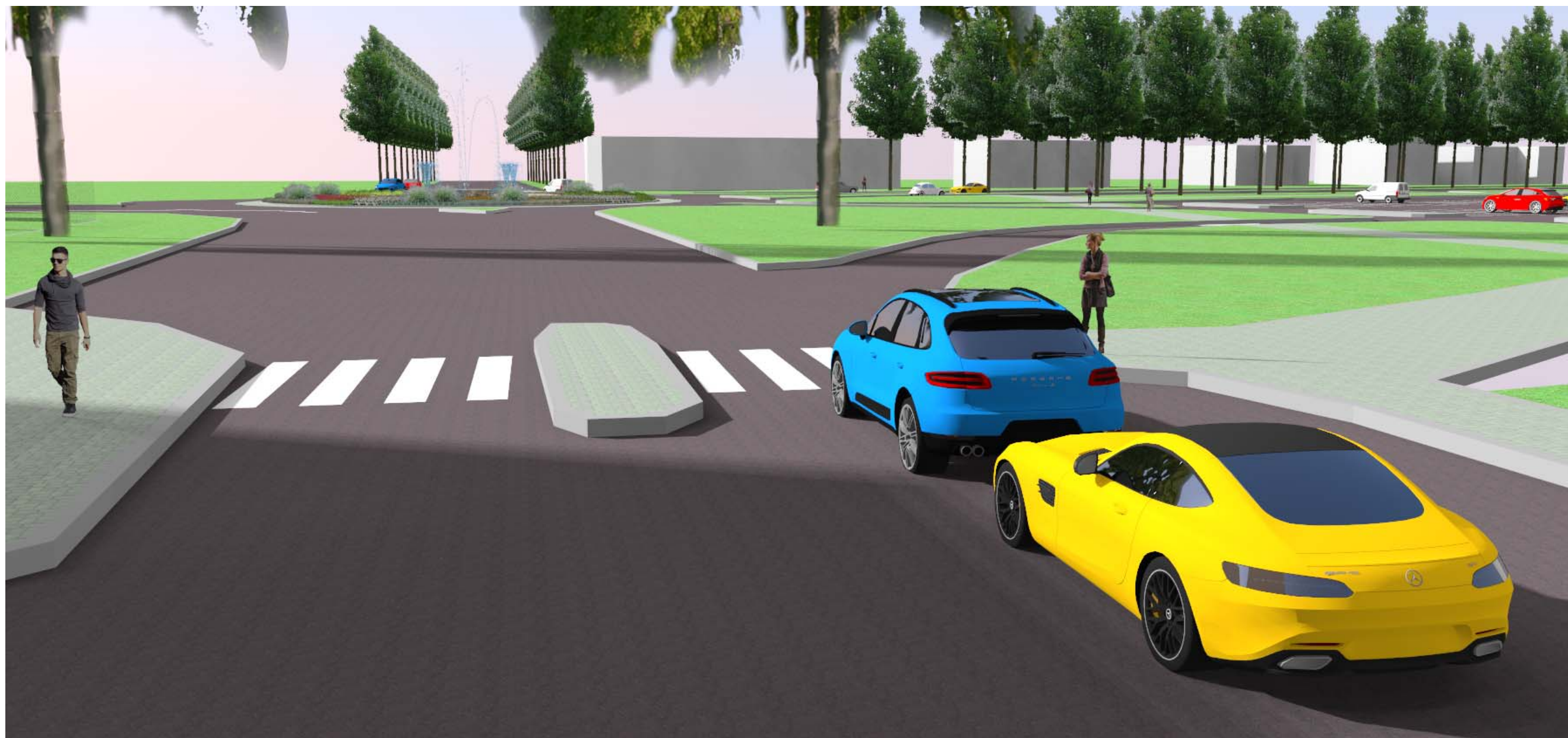
Perspektiva č. 1 – Pohled na okružní křižovatku cestou z Poděbrad