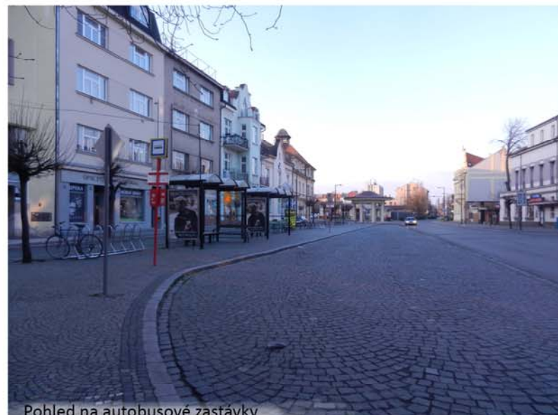
Pohled na autobusové zastávky