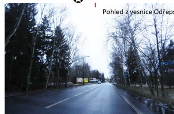
Pohled z vesnice Odřepsy