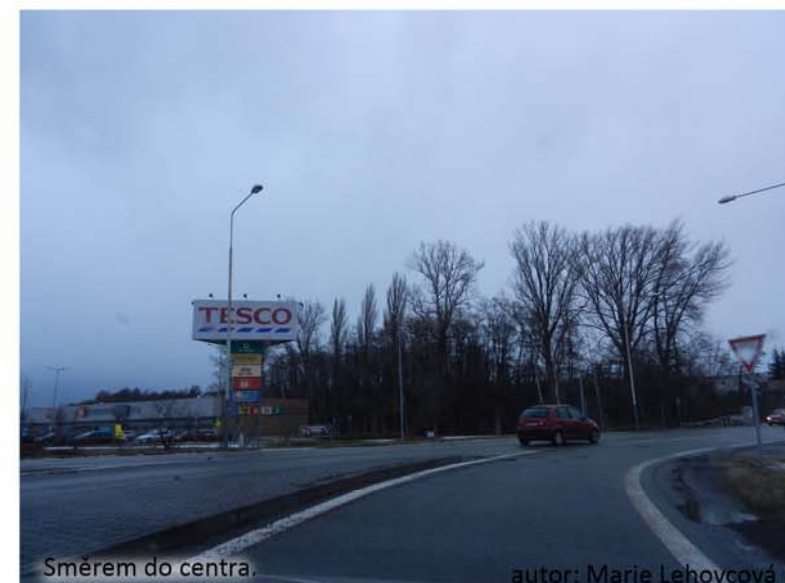
Směrem do centra.