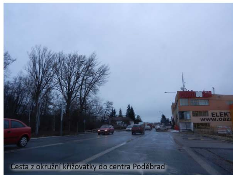
Cesta z okružní křižovatky do centra Poděbrad