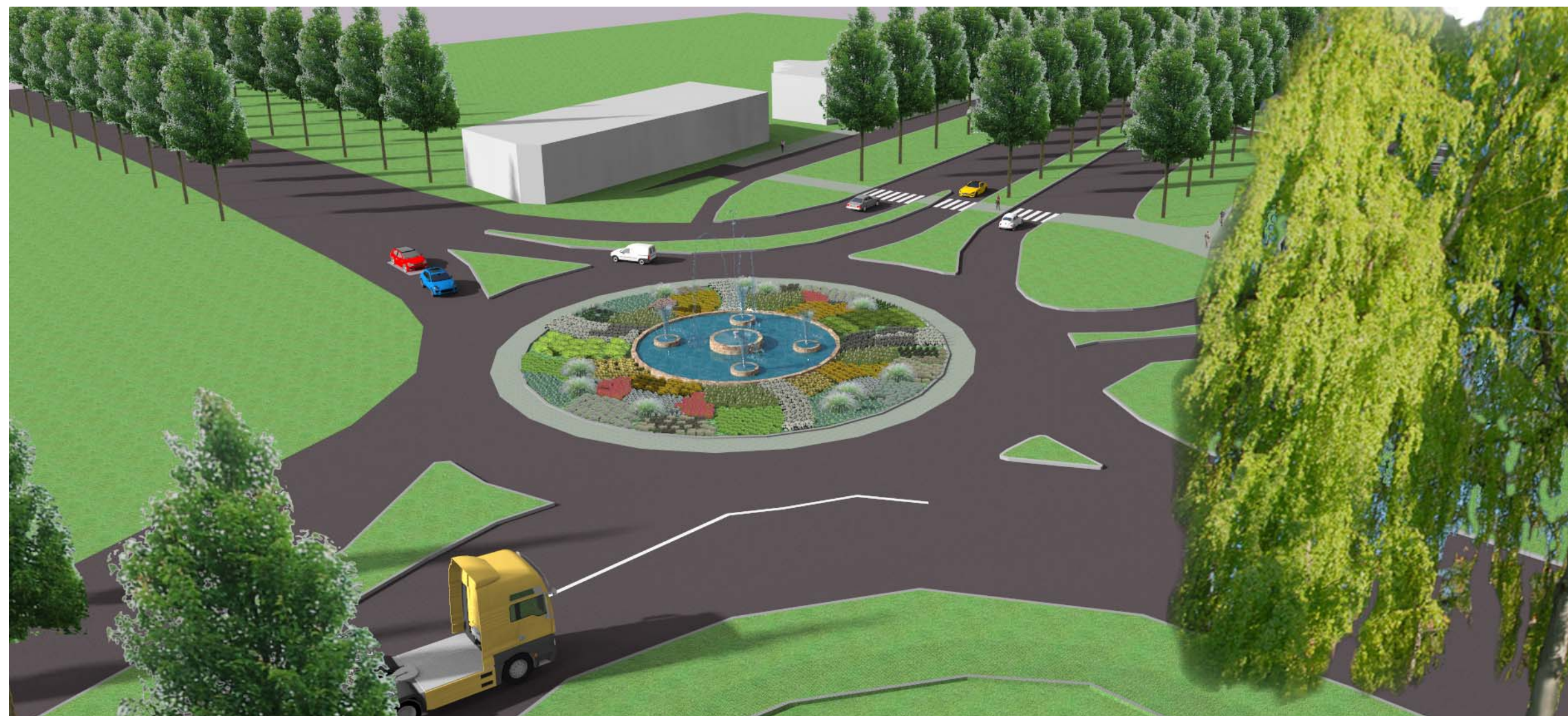
Ptačí pohled s pohledem na trasu z Prahy a z Nymburka