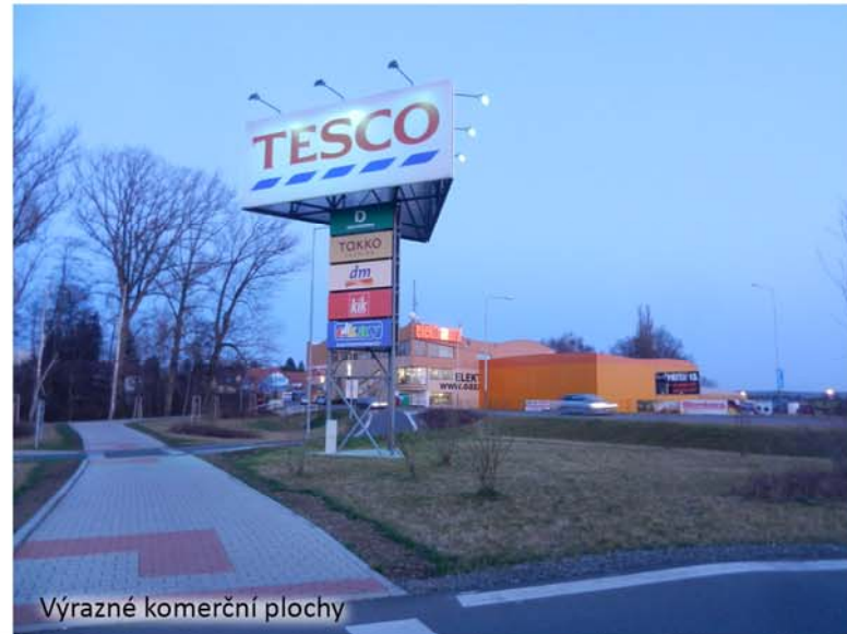
Výrazné komerční plochy