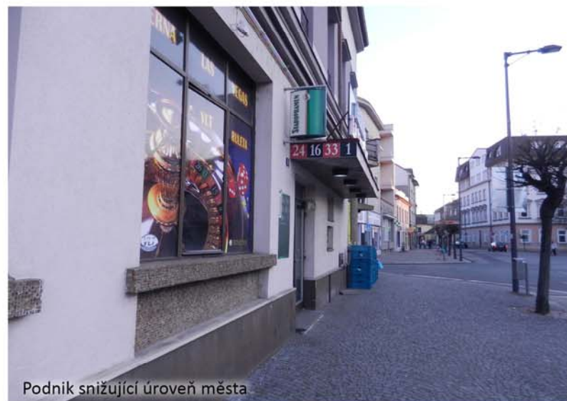
Podnik snižující úroveň města