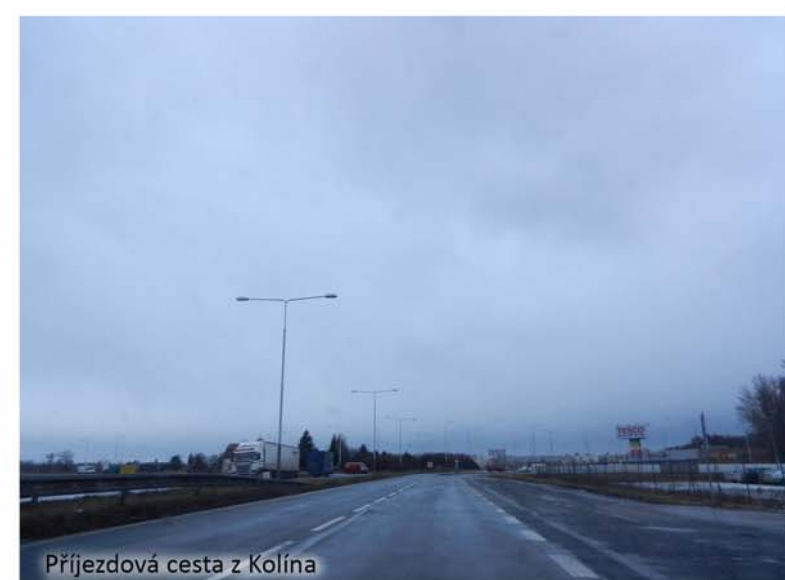
Příjezdová cesta z Kolína