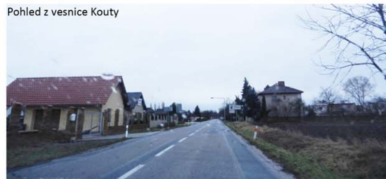
Pohled z vesnice Kouty