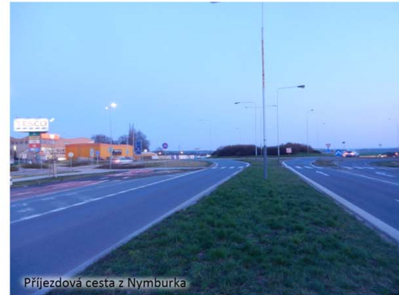
Příjezdová cesta z Nymburka