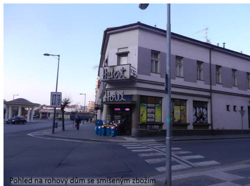
Pohled na rohový dům se smíšeným zbožím