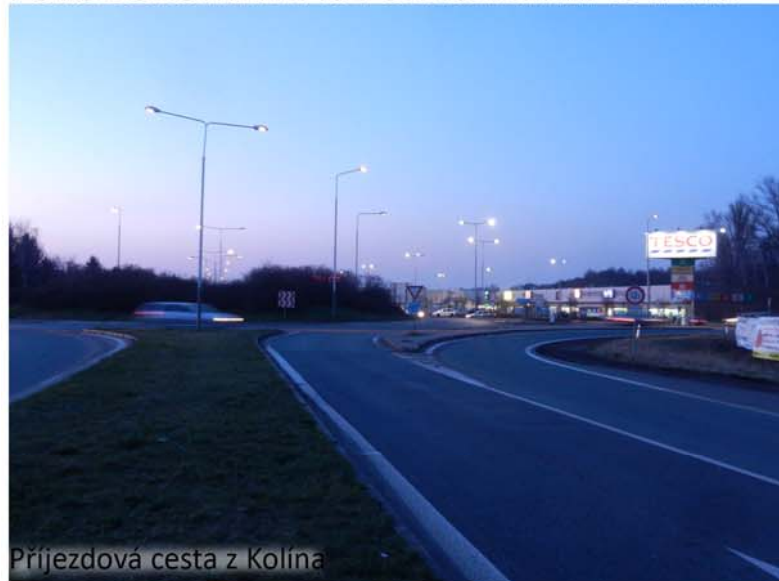
Příjezdová cesta z Kolína