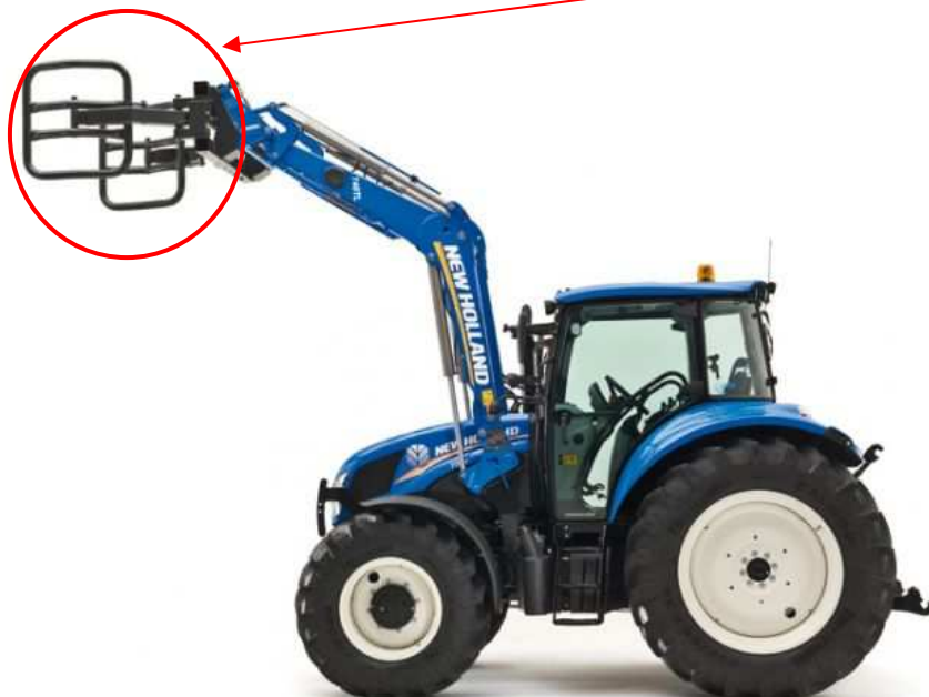
Obrázek č. 6 Čelní nakladač New Holland, modelová řada TL 740 s manipulačními kleštěmi