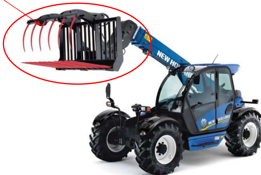
Obrázek č. 7 Manipulátor New Holland, modelová řada LM5020 Plus vybaven vidlemi s přtklopem