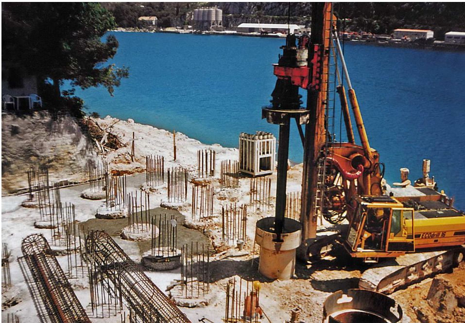
Obrázek č. 4 Stavba mostního pilíře v Dubrovniku

Vlivy počasí mají nezanedbatelný vliv na technický stav stroje, např. jedná-li se o nasazení stroje v přímořských oblastech, tak se na stavu stroje negativně projevuje vysoká vlhkost a slaná voda.