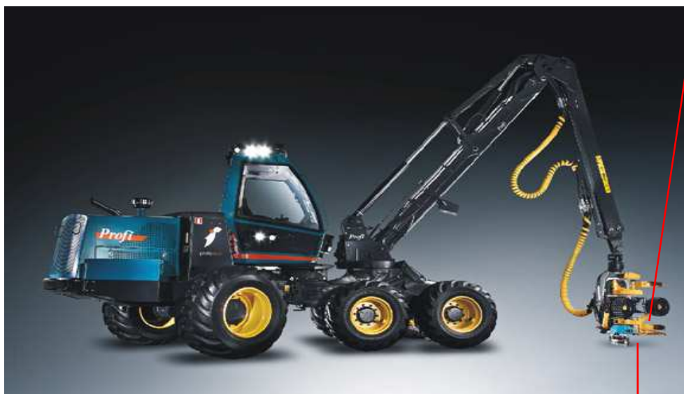
Obrázek č. 5 Harvestorová souprava

Střední nová hodnota je u strojů tvořena i ze standardně dodávaného příslušenství.