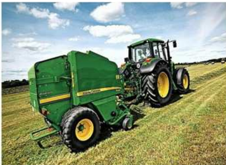
Obrázek č. 2 Svinovací lis John Deere 644-P

Zdroj: Lis svinovací JD-644P, agrozetshop.cz 3