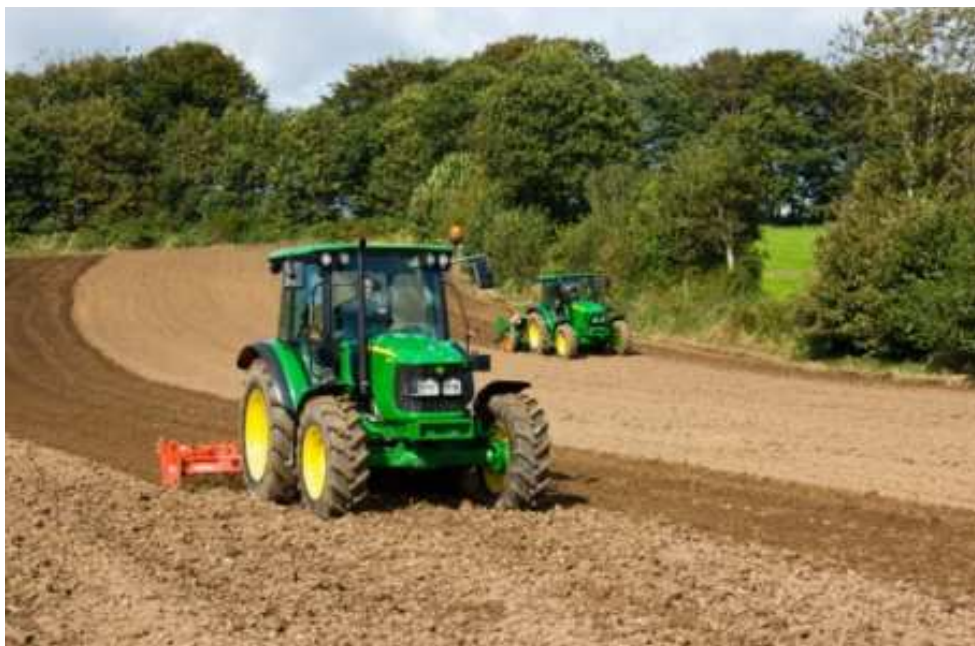
Obrázek č. 1 Kompaktní a obratný traktor řady 5M, John Deere