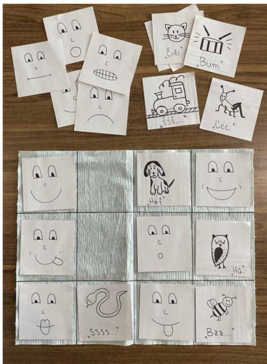
obrázek č. 2 – Orofaciální tabulka (tvorba autora práce)

Doporučení: Je důležité činnost provádět až po seznámení se s kartičkami. Je nutné znát symboly a mít zvládnuté jejich provedení. Čím pravidelnější opakování činnosti je, tím efektivnější je její průběh.