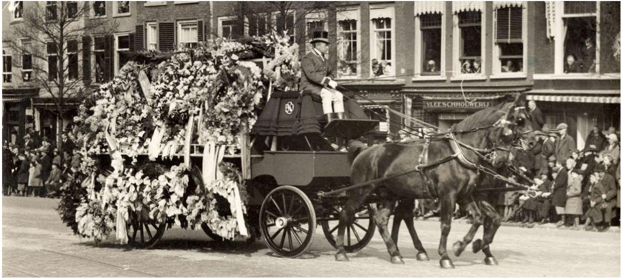
Afbeelding 10 - De begrafenis van Koningin-Moeder, prinses Emma (Z.n. 2024d)