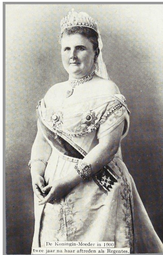
Afbeelding 8 – De Koningin-moeder Emma in 1900 (Z.n.2024f)

Na de inhuldiging van Wilhelmina verdween Emma naar de politiek achtergrond. Wilhelmina beschreef dat Emma dit graag deed en dat ze deze functie na de dood van haar man trouw vervulde (Wilhelmina 2007: 43-44).