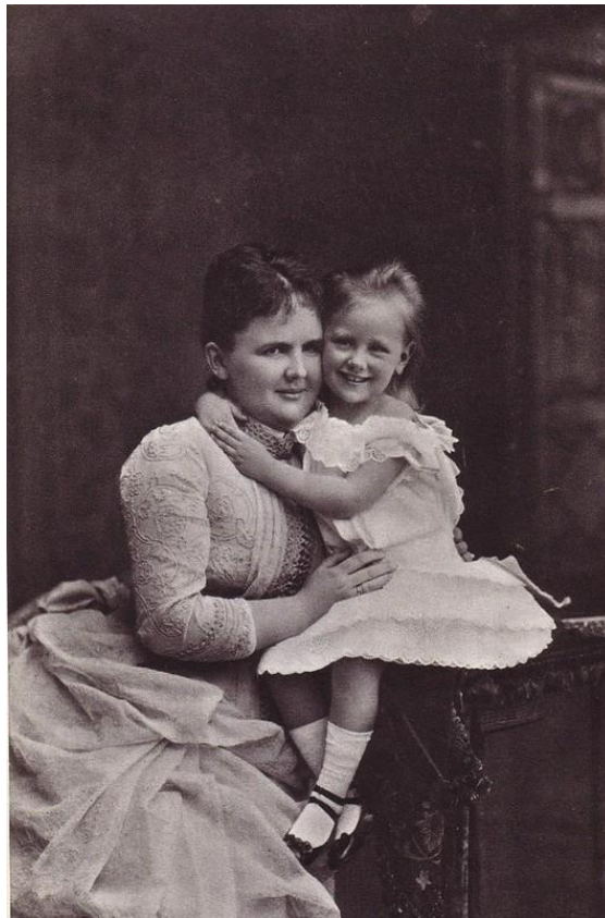
Afbeelding 7 - Emma en Wilhelmina, 1885 (Z.n. 2009)

Na hun huwelijk verwachtte iedereen in Nederland dat Emma vroeg zwanger zou zijn en in juli 1879 was er informatie over het begin van een zwangerschap maar van Van Limburg Stirum, de Nederlandse diplomaat in Berlijn, hoorde men twee weken later dat Emma niet in verwachting is (van der Meulen 2013: 591).