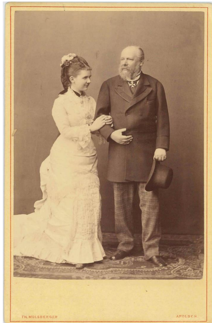
Afbeelding 6 - Prinses Emma en Koning Willem III na hun verloving in 1878 (Lamain 2022)

vakantiereizen en was nog steeds geïnteresseerd in haar familie en wilde alles weten over elk lid van de familie (Verburg 1989: 15-16).