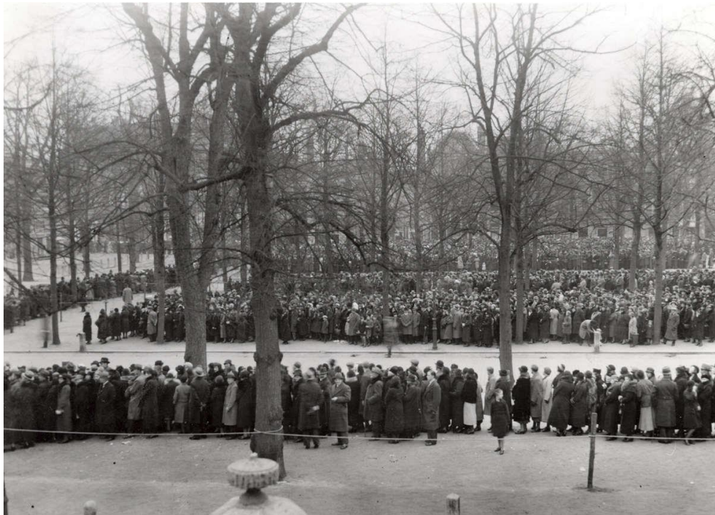
Afbeelding 11 – Koningin Emma's begrafenis, waar mensen in lange rijen stonden (Z.n. 2024g)