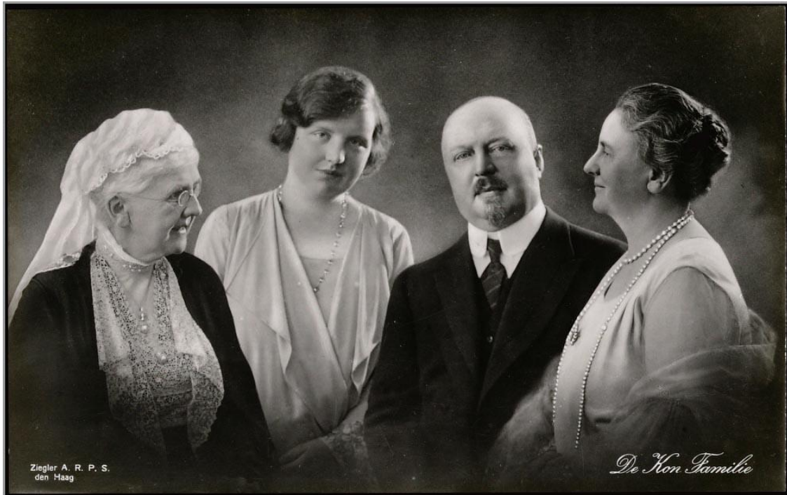
Afbeelding 9 - Koningin- moeder Emma, prinses Juliana, prins Hendrik en koningin Wilhelmina

Emma bleef een grote steun voor haar dochter en Hendrik van Mecklenburg-Schwerin, de echtgenoot van Wilhelmina, en ook voor Juliana, haar kleindochter. Ze had als haar erfdeel het landgoed Soestdijk genomen na Wilhelmina's huwelijk en legateerde hun het Paleis Het Loo. Het was moeilijk voor zowel Emma als Wilhelmina om na haar huwelijk gescheiden te worden, omdat ze een sterke band hadden, maar het was noodzakelijk. Als haar winterverblijf heeft Emma paleis het Voorhout in Den Haag gekozen (Wilhelmina 2007: 43-44). Tijdens de Eerste Wereldoorlog verbleef Emma in haar paleis in Voorhout (Wilhelmina 2007: 165-166).