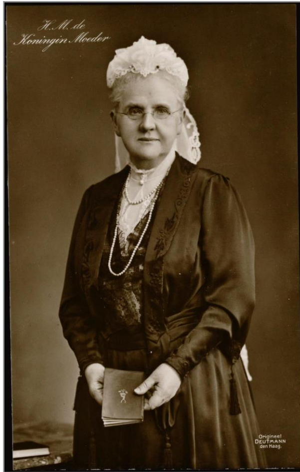
Afbeelding 13 - Koningin-moeder Emma (Z.n. 2024e)

In haar dankwoord vertelde ze aan wie ze het financiële geschenk zou geven en dit werd het land van Oranje-Nassau's Oord waar het eerste Nederlandse sanatorium zou worden gebouwd. Vroeger was dit huis door Willem III aangekocht voor Emma als buitenverblijf en weduwegoed: