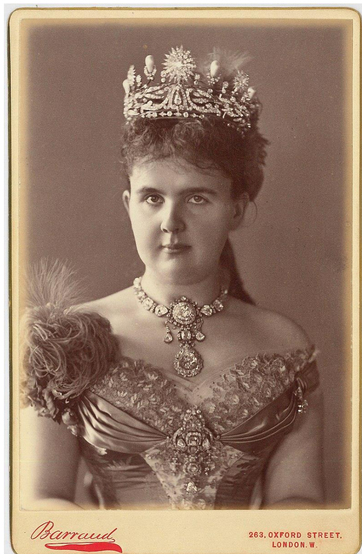
Afbeelding 4 - Koningin Emma van Pyrmont-Waldeck (de Carvalho 2019)

Ze werd genoemd als 'Koningin der weldadigheid' , 'Koningin der barmhartigheid' , later 'de liefste oude dame van Europa' en ook "Koningin-moeder" .