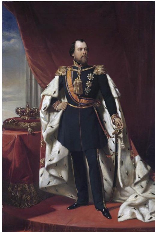
Afbeelding 3 - Willem III der Nederlanden (Z.n. 2024b)

1877 apart. Twee jaar na haar dood heeft Willem III zijn tweede echtgenote prinses Emma van Waldeck-Pyrmont gehuwd met wie hij een dochter Wilhelmina had (van der Meulen 2013: 542-553).