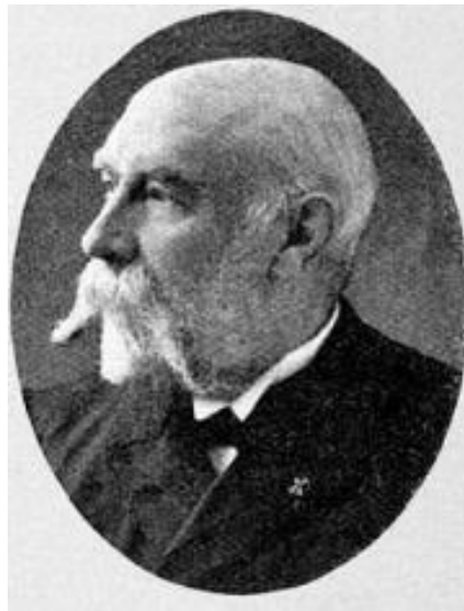
Afbeelding 12 - August Lodewijk Willem Seyffardt (Beekelaar 2013)

De hoogste autoriteit over zee en landmacht had de koning en er was een directe band tussen het departement van oorlog en koning. Als staatshoofd probeerde Emma de traditie van koning Willem II en Willem III van hun actieve betrokkenheid te behouden. Na de dood van Willem III waren in de Tweede Kamer discussies over de posities van het Militaire Huis van de Koningin en de Grote Staf en haar militaire entourage (Boekholt 1990: 45).