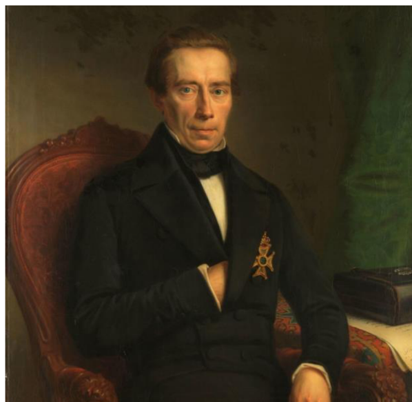
Afbeelding 2 - Johan Rudolph Thorbecke, Minister van Binnenlandse Zaken (Neuman 1852)

Vanaf 1849 tot 1872 heeft Johan Thorbecke als Minister van Binnenlandse Zaken drie kabinetten geleid. Onder zijn leiding zijn er verschillende hervormingen ontstaan zoals de wet op het Middelbare Onderwijs of het instellen van de Kieswet, de gemeentewet en de provinciale wet (Visser 2022). Daarna heeft Floris van Hall (1791-1866) de kabinetten geleid (Engelbrecht e.a. 2015: 215-216).