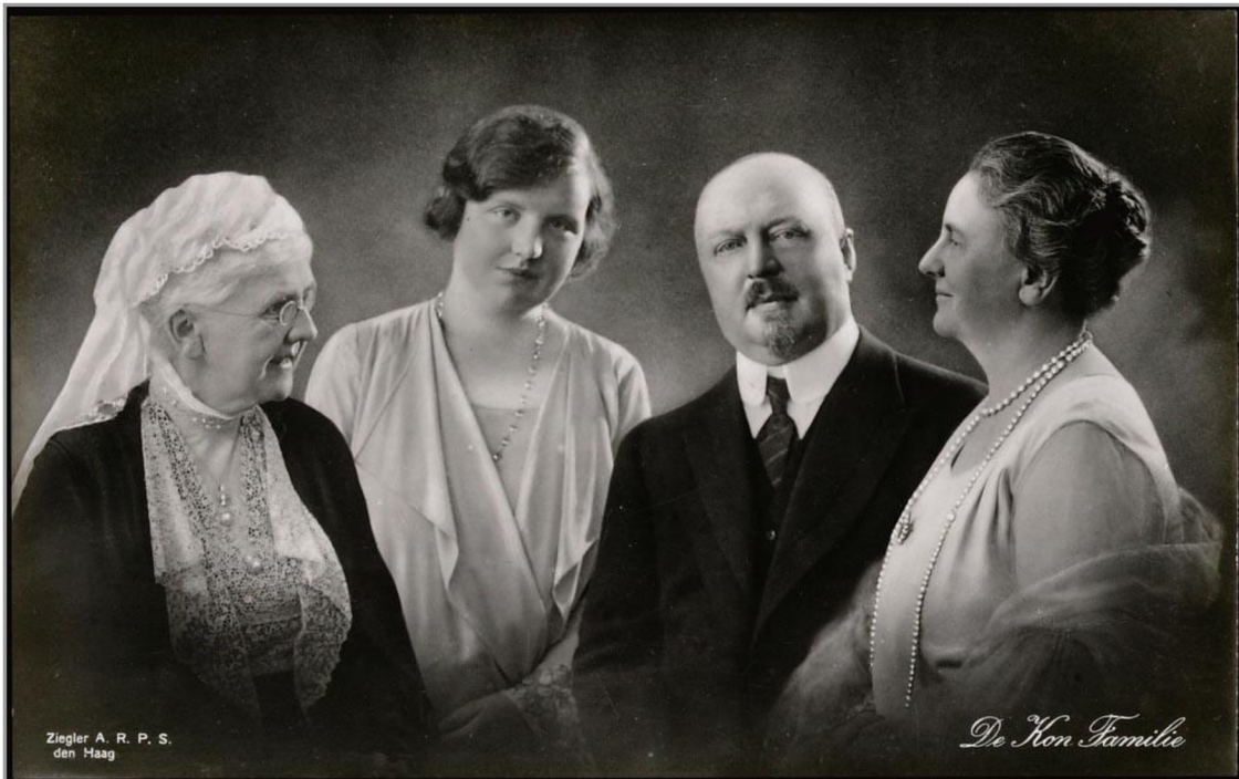
Afbeelding 9 - Koningin- moeder Emma, prinses Juliana, prins Hendrik en koningin Wilhelmina (Z.n. 2024c)

Emma bleef een grote steun voor haar dochter en Hendrik van Mecklenburg-Schwerin, de echtgenoot van Wilhelmina, en ook voor Juliana, haar kleindochter. Ze had als haar erfdeel het landgoed Soestdijk genomen na Wilhelmina's huwelijk en legateerde hun het Paleis Het Loo. Het was moeilijk voor zowel Emma als Wilhelmina om na haar huwelijk gescheiden te worden, omdat ze een sterke band hadden, maar het was noodzakelijk. Als haar winterverblijf heeft Emma paleis het Voorhout in Den Haag gekozen (Wilhelmina 2007: 43-44). Tijdens de Eerste Wereldoorlog verbleef Emma in haar paleis in Voorhout (Wilhelmina 2007: 165-166).