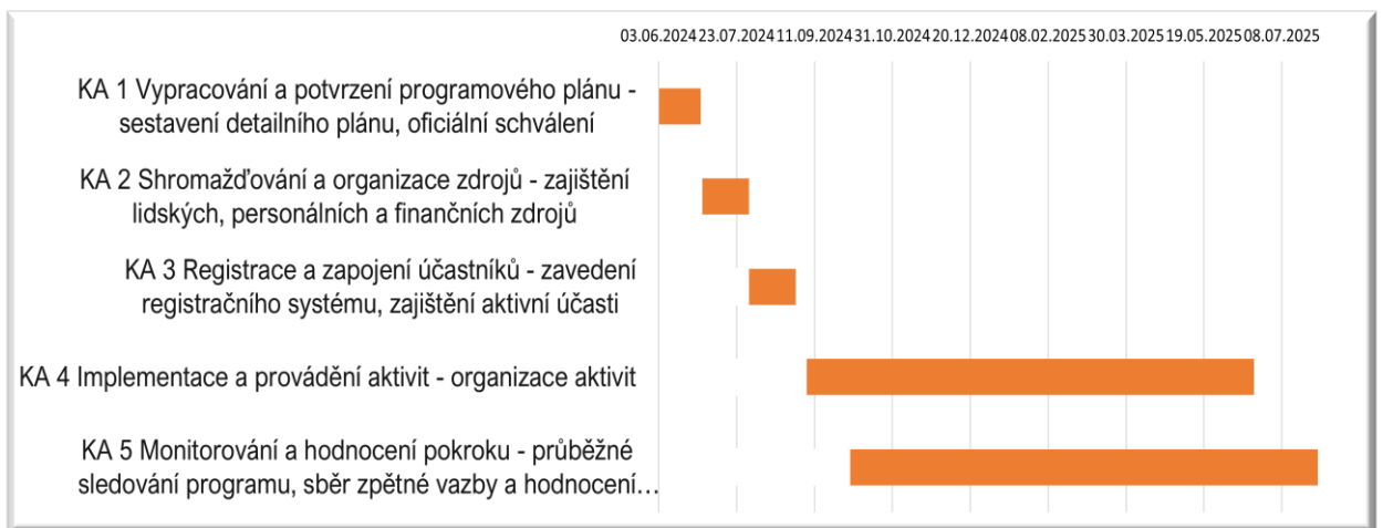
Obrázek 2: Ganttův diagram

Níže je zobrazen Ganttův diagram projektu "Probud' dřevo", který vizualizuje plánování klíčových aktivit projektu v časovém horizontu od června 2024 do července 2025. Diagram ukazuje začátek a konec každé z klíčových aktivit (KA). Poskytuje přehled o tom, jak na sebe jednotlivé úkoly časově navazují a jaký čas je pro ně vyhrazen.