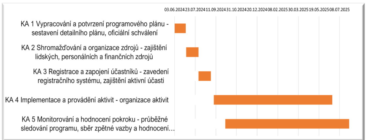
Obrázek 2: Ganttův diagram

Níže je zobrazen Ganttův diagram projektu "Probud' dřevo", který vizualizuje plánování klíčových aktivit projektu v časovém horizontu od června 2024 do července 2025. Diagram ukazuje začátek a konec každé z klíčových aktivit (KA). Poskytuje přehled o tom, jak na sebe jednotlivé úkoly časově navazují a jaký čas je pro ně vyhrazen.