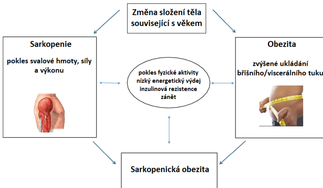
Obrázek 3 Změna složení těla související s věkem a rozvoj sarkopenické obezity, upraveno dle Atkins & Wannamethee (2020).

Pacienti sužováni sarkopenickou obezitou jsou vystaveni mimo jiné zvýšenému riziku inzulínové rezistence, dyslipidémie, hypertenze, T2D a zánětu nízkého stupně; zvýšenému riziku invalidity, omezení mobility a celkovému zhoršení fyzické kapacity; depresi a zhoršenému psychickému zdraví (Koliaki et al. 2019).