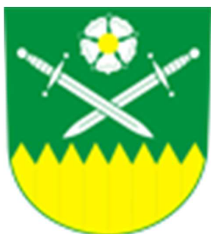
Znak Vojenského újezdu Hradiště