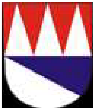
Znak Vojenského újezdu Libavá