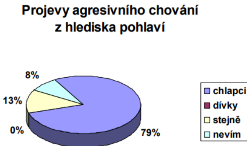
Graf 3 Projevy agresivního chování z hlediska pohlaví